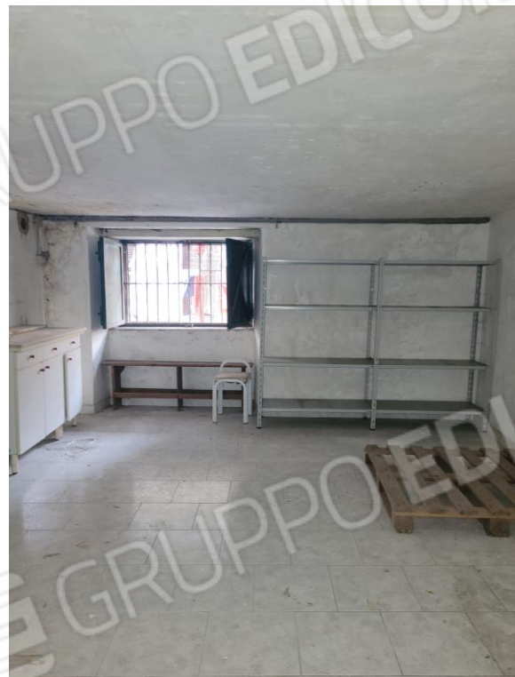
Vista area sopalcata