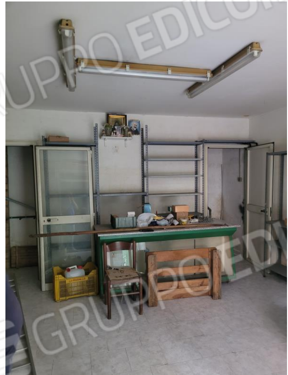
Vista locale commerciale piano terra