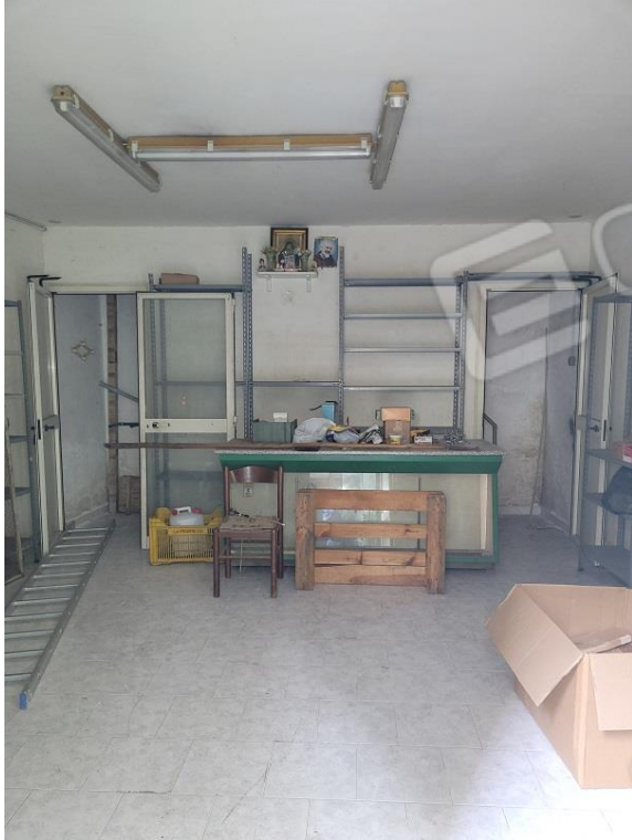
Vista locale commerciale piano terra