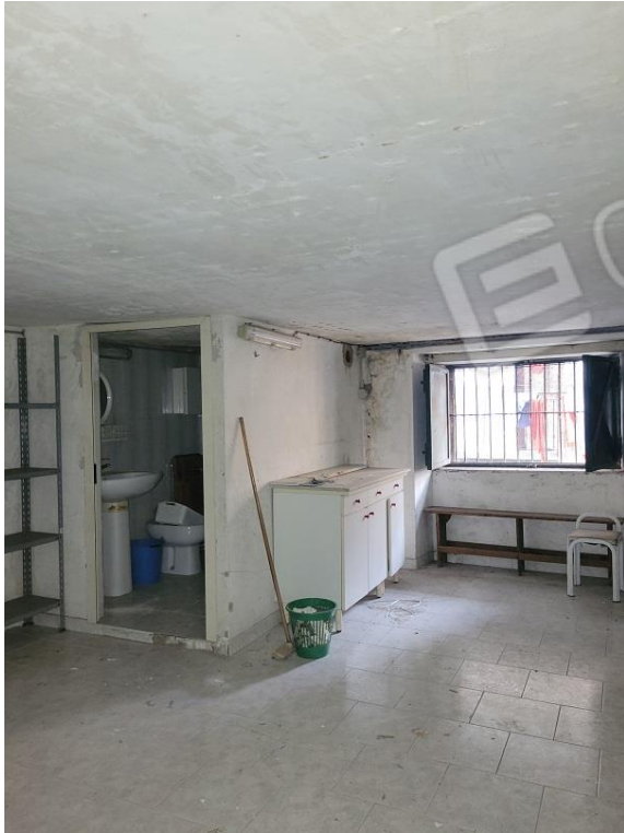
Vista area sopalcata