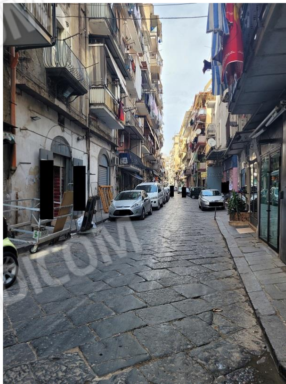
Vista Via Lavinaio