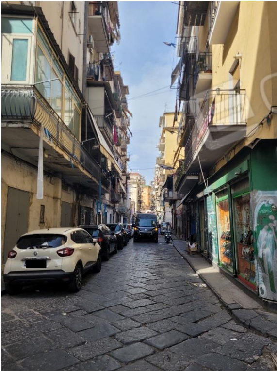
Vista Via Lavinaio