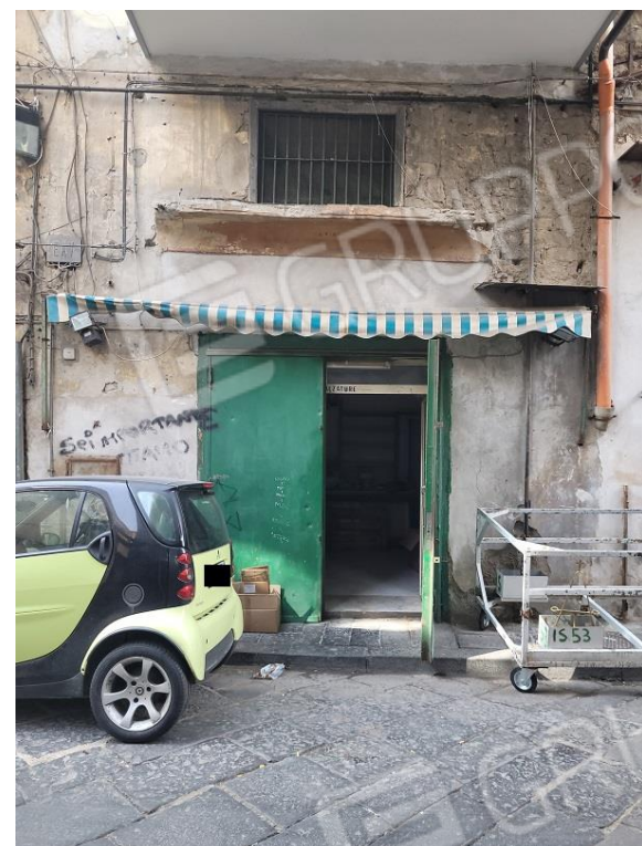
Vista portone di accesso all'immobile