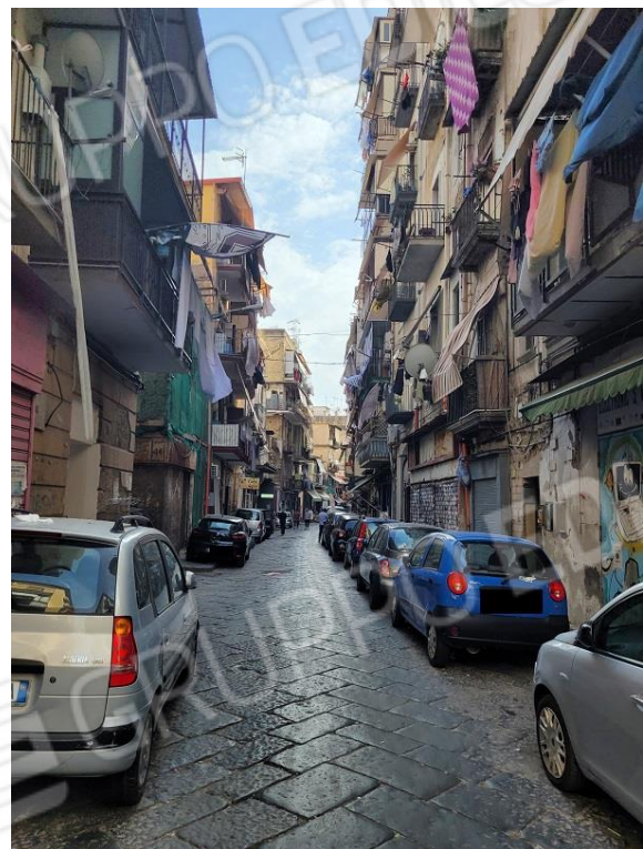
Vista Via Lavinaio