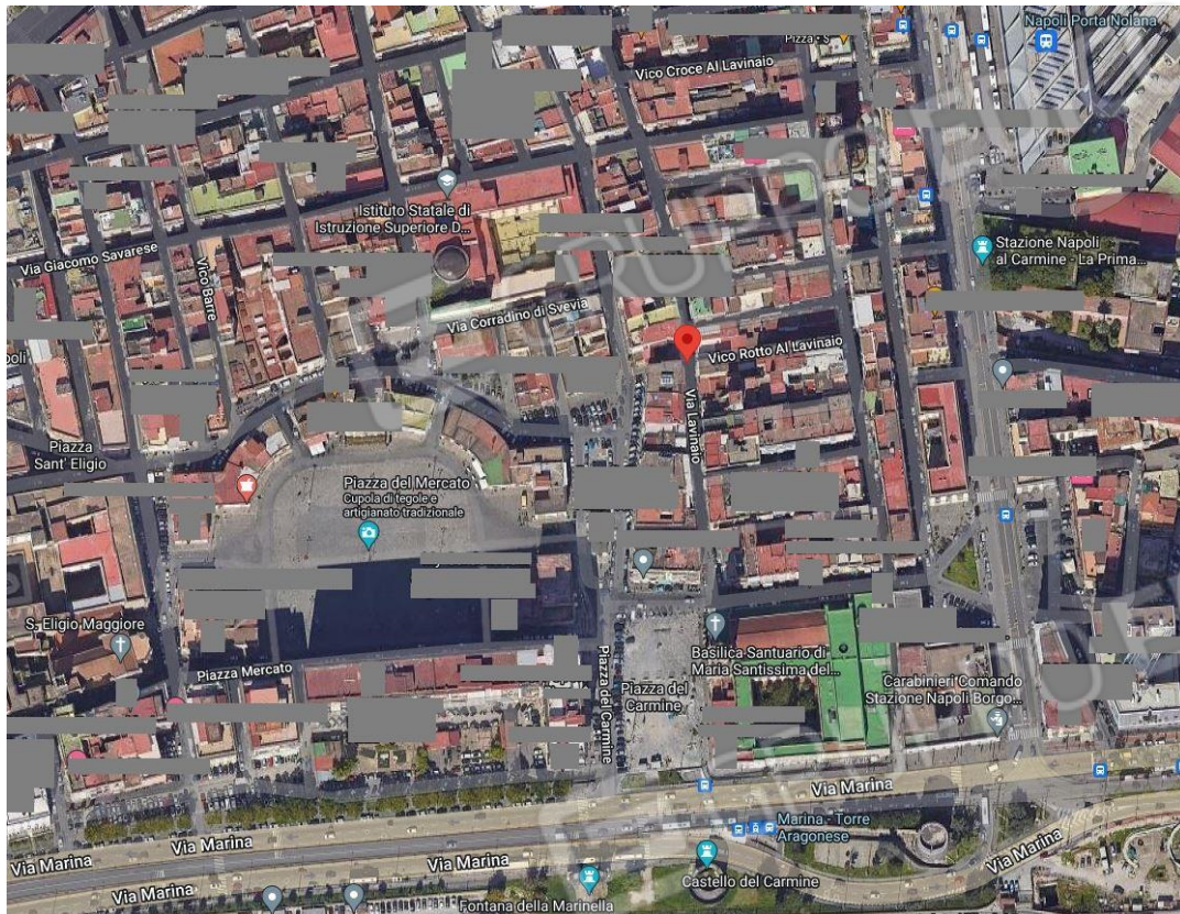
Foto aerea-satellitare con individuazione dell'edificio in cui è allocato il bene pignorato

Al fine della esatta individuazione del fabbricato, in cui è allocato il bene oggetto di pignoramento si rimette foto aerea-satellitare con individuazione dell'edificio.