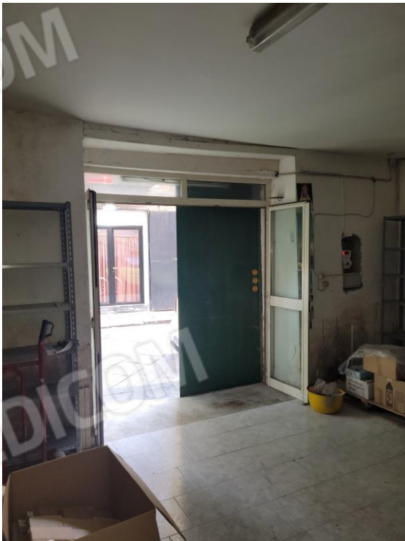
Vista locale commerciale piano terra