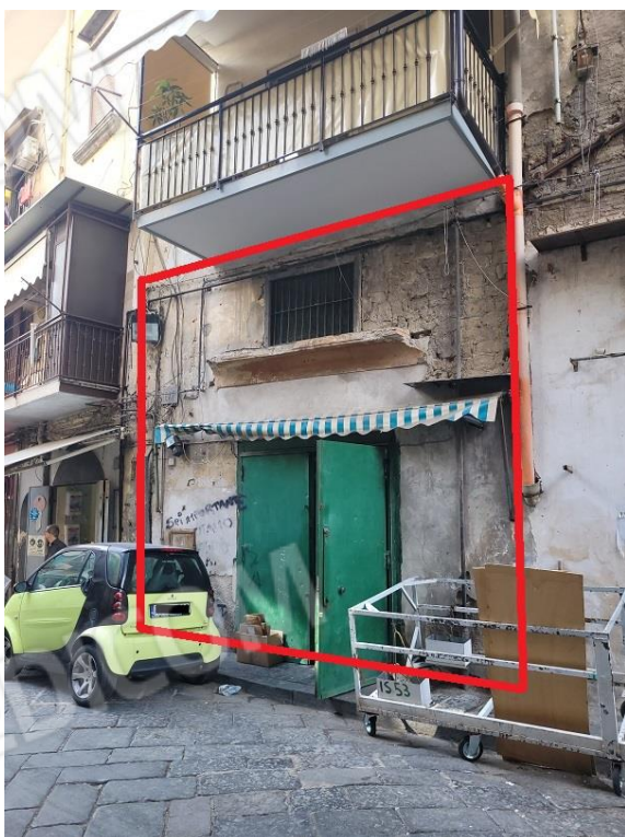
Individuazione immobile pignorato