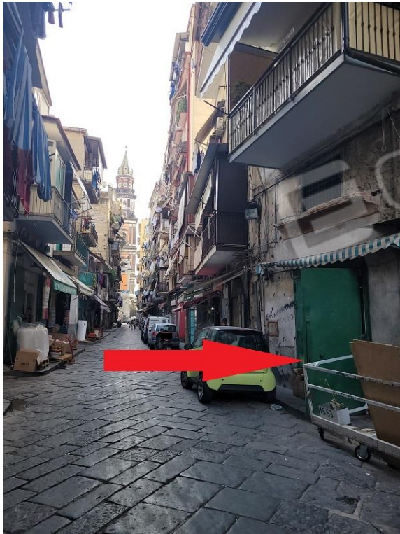
Individuazione immobile pignorato