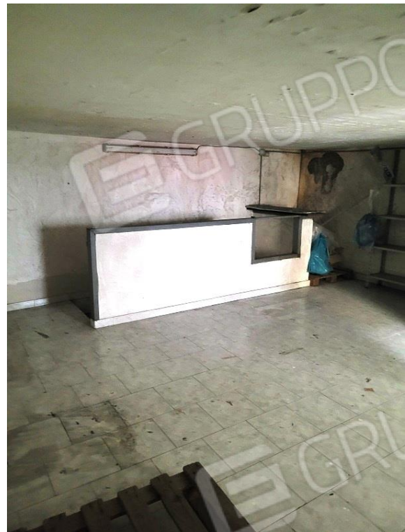
Vista area sopalcata - area scala di accesso