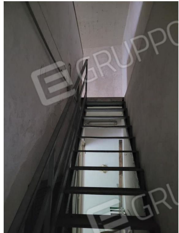
Vista cassa scale di accesso al soppalco