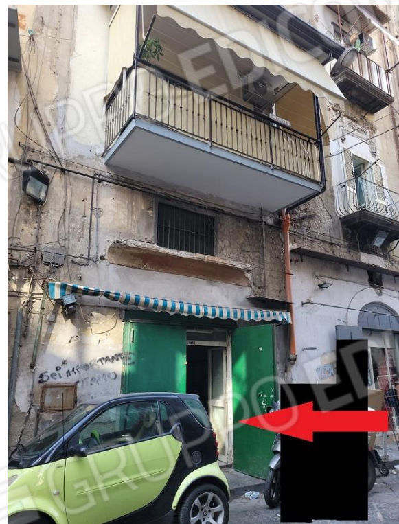
Individuazione immobile pignorato