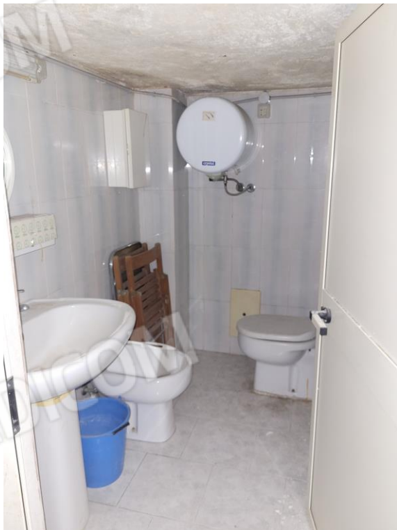
Vista locale bagno