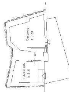
PIANTA PIANO SEMINTERRATO