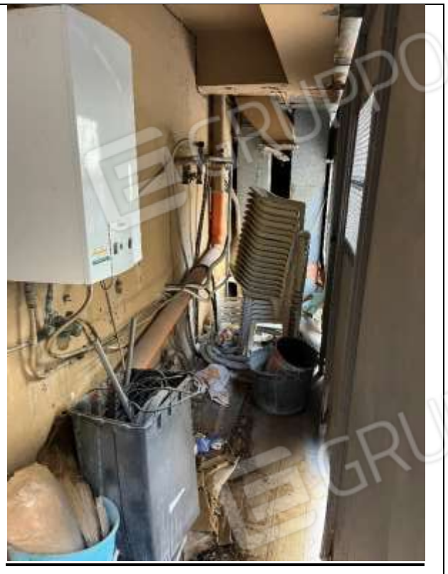
Dettaglio della chiusura senza titolo, esterna, dove insiste una uscita di emergenza