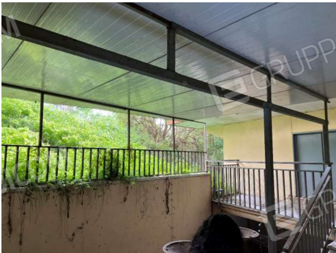
Dettaglio della Tettoia esistente priva di titolo e non sanabile