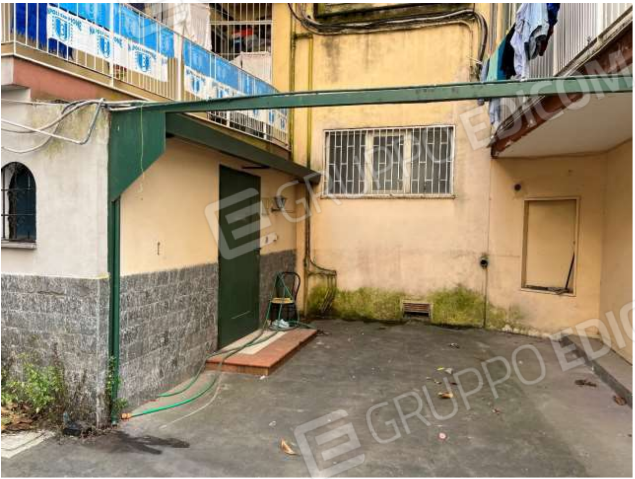
Dettaglio dell'ingresso di accesso – difformità rispetto al titolo edilizio