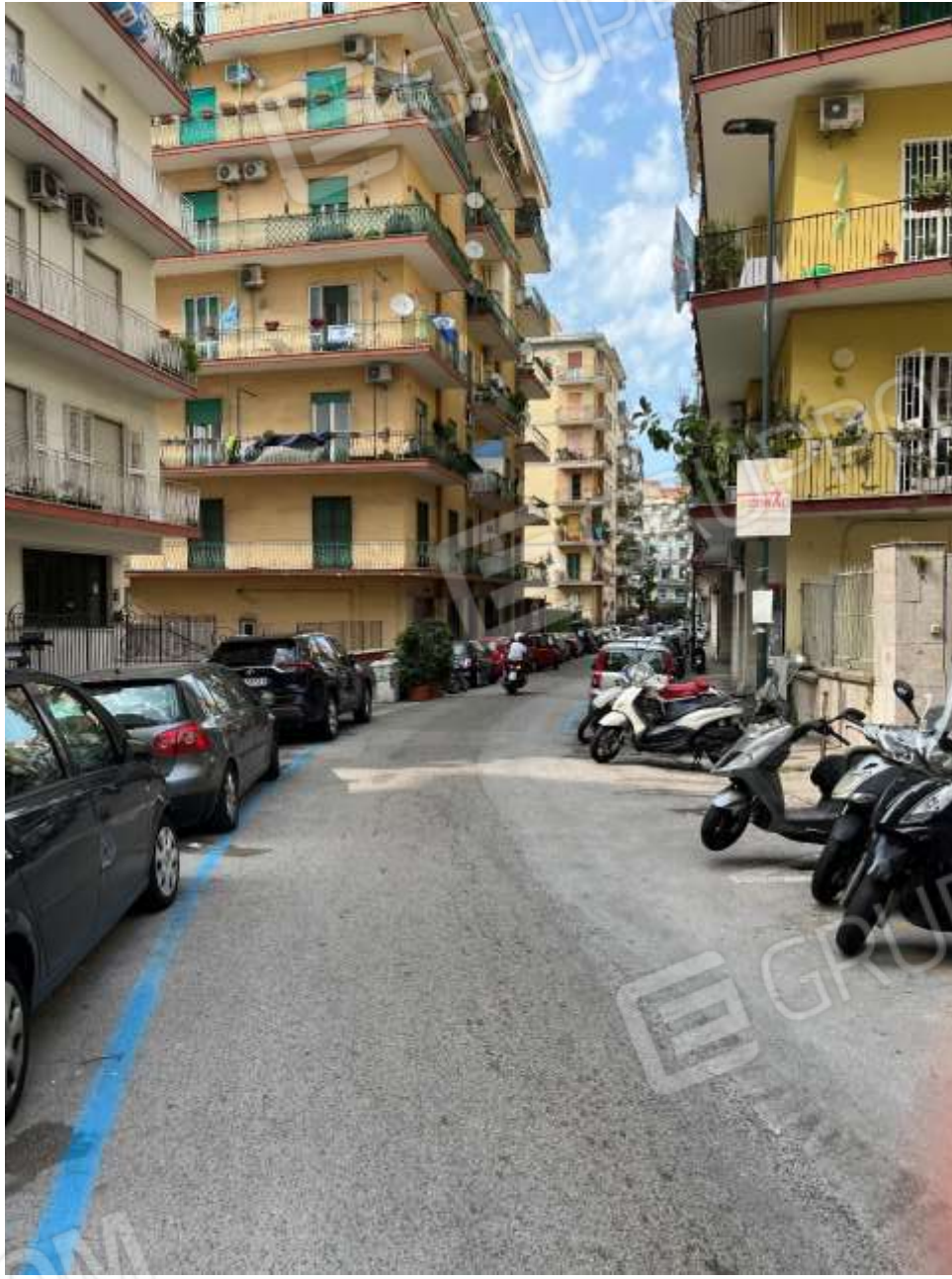
Via M. Ruta direttrice senso unico da via Luigi Caldiari