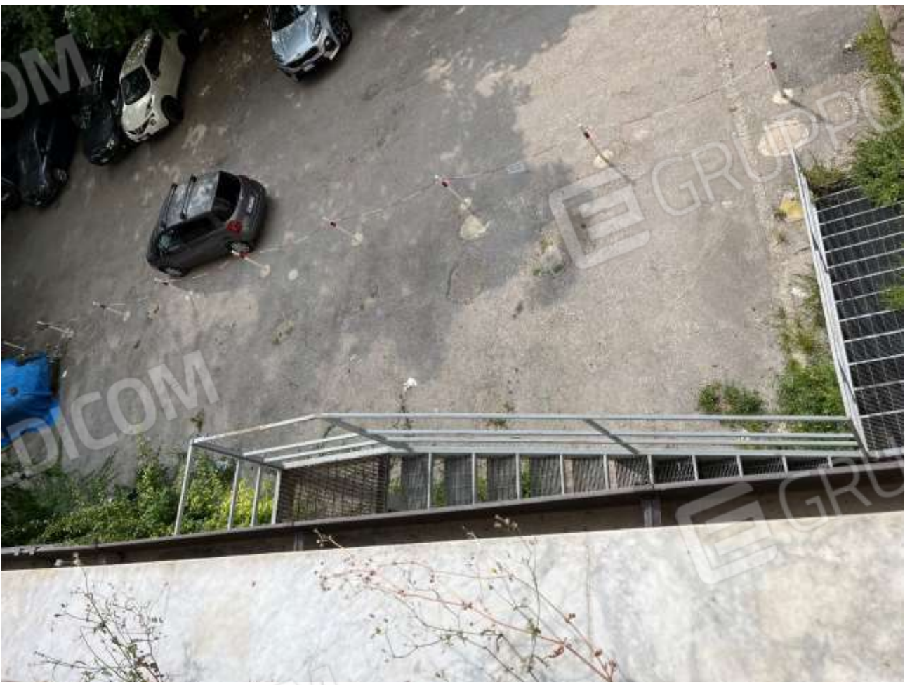
Vista dall'area a valle – Cavone Case Puntellate