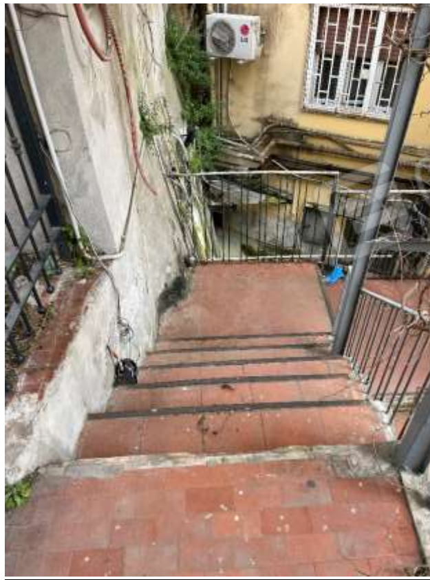
Vista da via M. Ruta dell'area pertinenziale ingresso principale