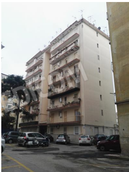
FOTO 2-3 VISTE DELL'EDIFICIO "E" DI CUI FA PARTE IL LOTTO 11, COMPOSTO DAI DUE APPARTAMENTI FUSI AL PIANO RIALZATO, INTERNI 1 E 5. IL PORTONE DI INGRESSO DELLA SCALA E.