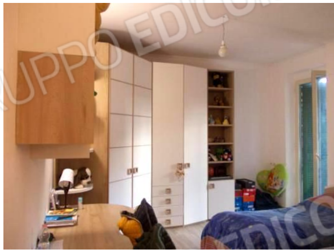
FOTO 23-26 VISTE DELLA ZONA NOTTE FIGLI CON ANNESSO BAGNO DI CAMERA. SUL FONDO LA PORTA DI INGRESSO DALL'INTERNO 5.