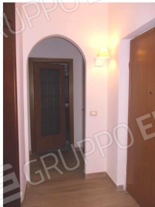
FOTO 9-10 VISTE DELLA ZONA NOTTE SULLA DESTRA DELLA PORTA ALL'INTERNO 1 . IL DISIMPEGNO CENTRALE E LA ZONA RIPOSTIGLIO-LAVANDERIA .