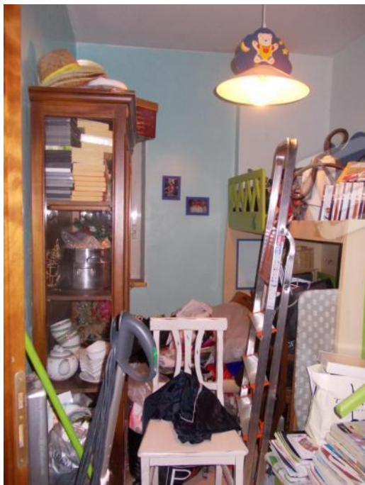
FOTO 8 VISTA DEGLI INTERNI DELLA CAMERETTA.