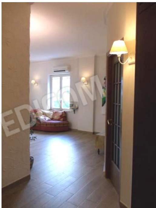
FOTO 6-7 VISTE DELLA ZONA INGRESSO DALLA PORTA ALL'INTERNO 1. LA CAMERETTA CON LA PARETE SAGOMATA, ORA UTILIZZATA COME STANZA DI SGOMBERO.