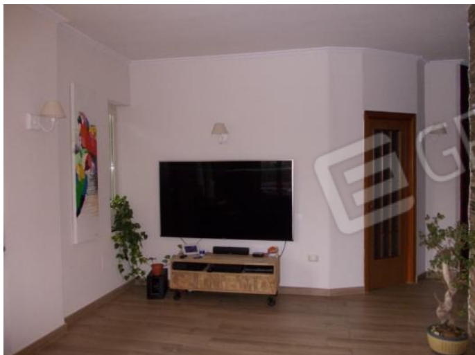
FOTO 17-19 VISTE DELLA ZONA GIORNO. IL SOGGIORNO- PRANZO.