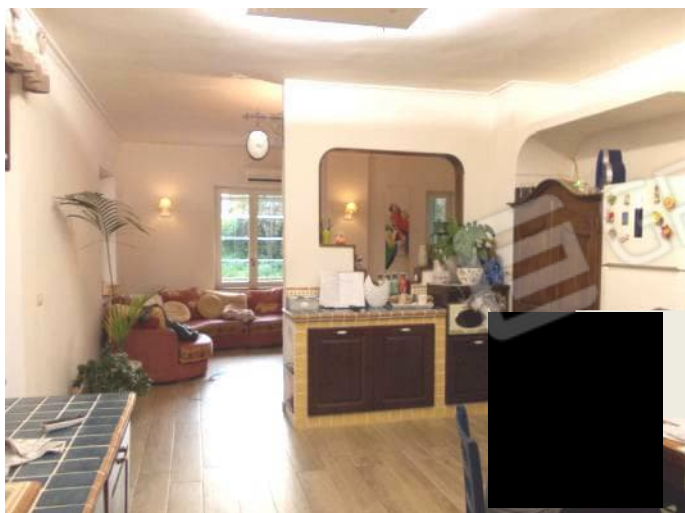
FOTO 20-22 VISTE DELLA ZONA GIORNO. LA CUCINA TINELLO ANNESSA AL SOGGIORNO-PRANZO