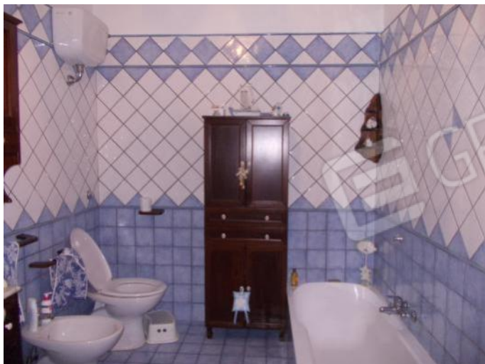
FOTO 14-16 VISTE DELLA ZONA NOTTE SULLA DESTRA DELLA PORTA ALL'INTERNO 1 . IL BAGNO.