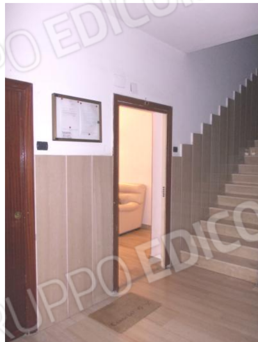
FOTO 4-5 VISTE DELLE DUE PORTE DI INGRESSO DELL'APPARTAMENTO, DALL'INTERNO 1 E DALL'INTERNO 5.