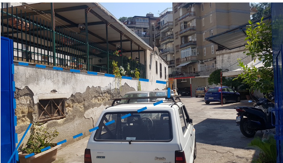
Prospetto su proprietà privata adiacente – particella 91