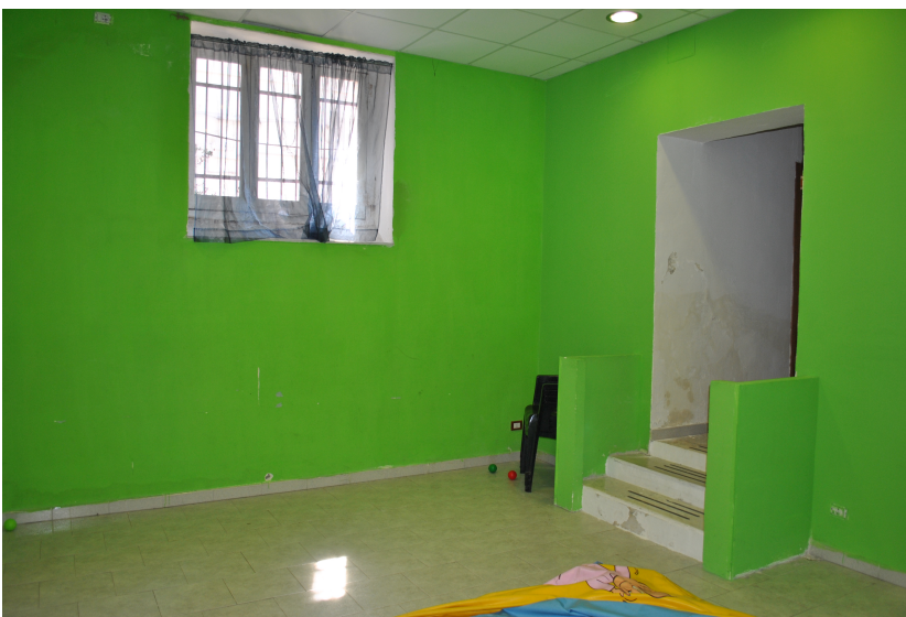
Area giochi (G1)