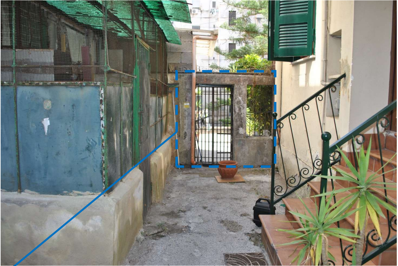
Delimitazione del viale interno con p.lla 94