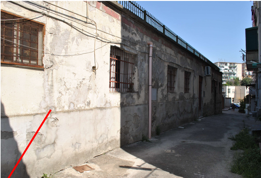
Prospetto su viale interno