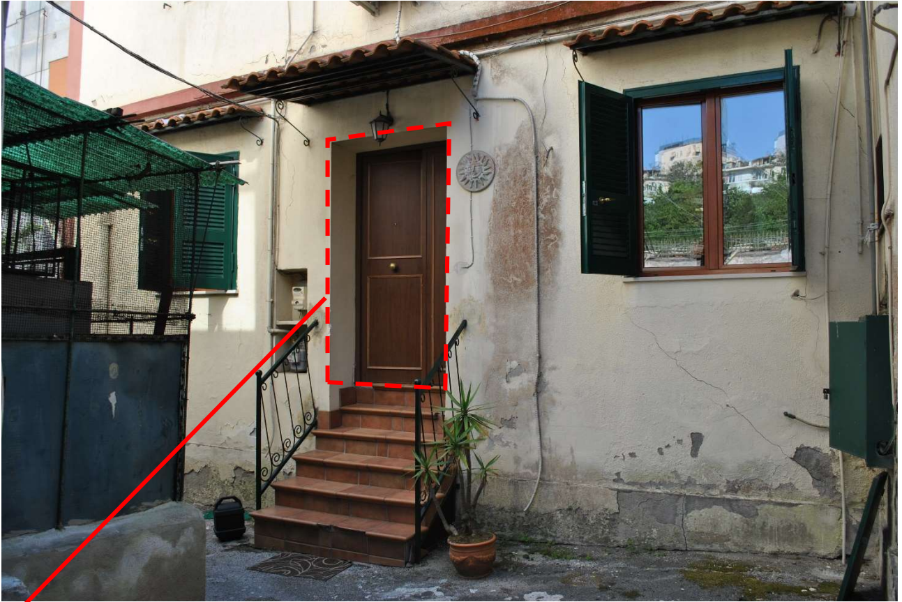
Accesso alla porzione B dell'immobile staggito sub 3 dislocato al piano rialzato