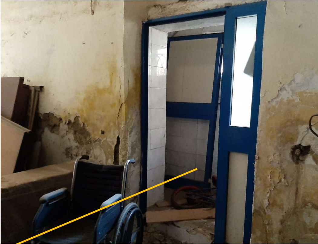
Accesso al bagno (WC) nel vano sottoscala