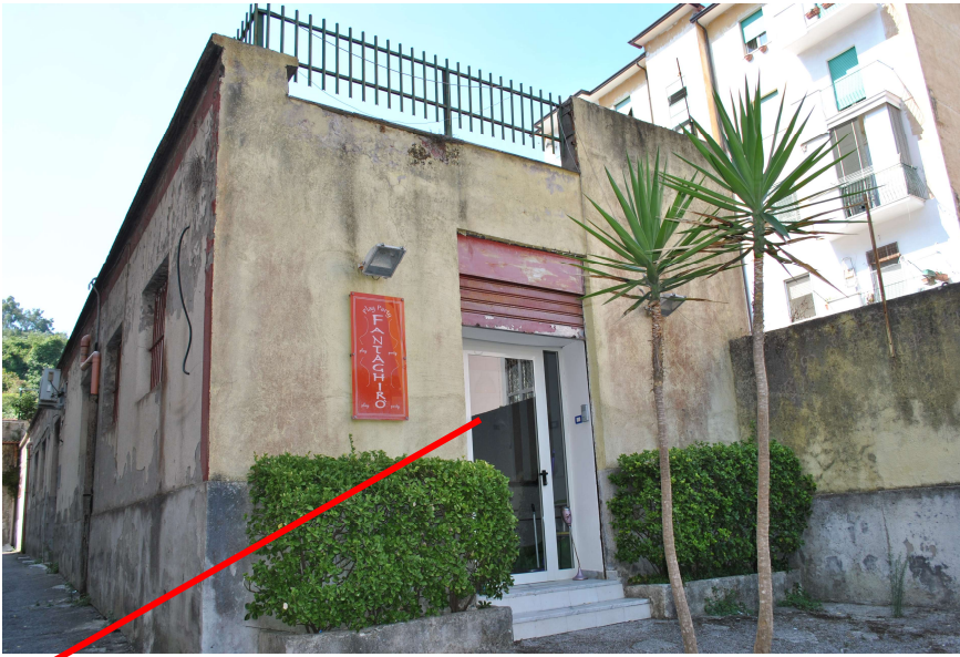
Accesso all'immobile staggito – area adibita a ludoteca