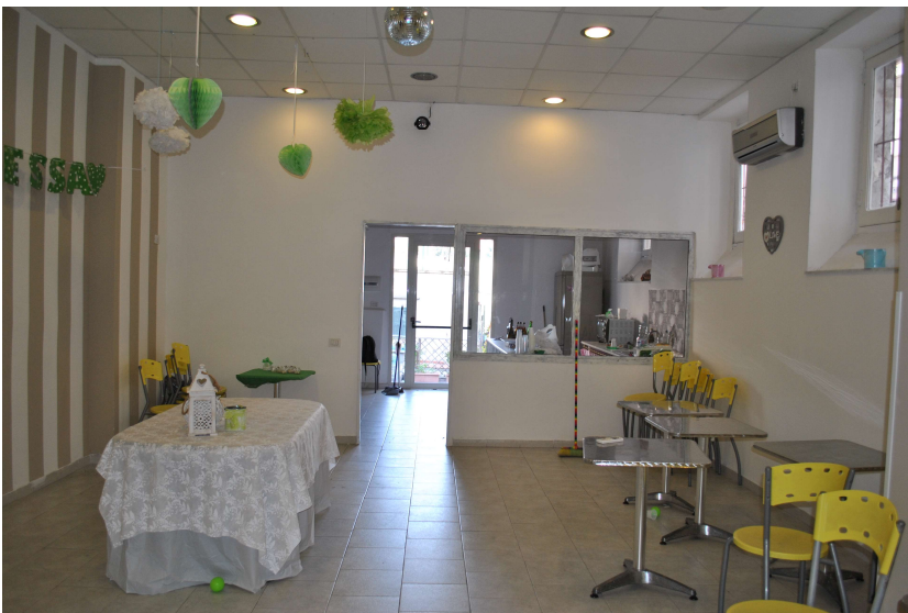
Sala Pranzo (Sp)