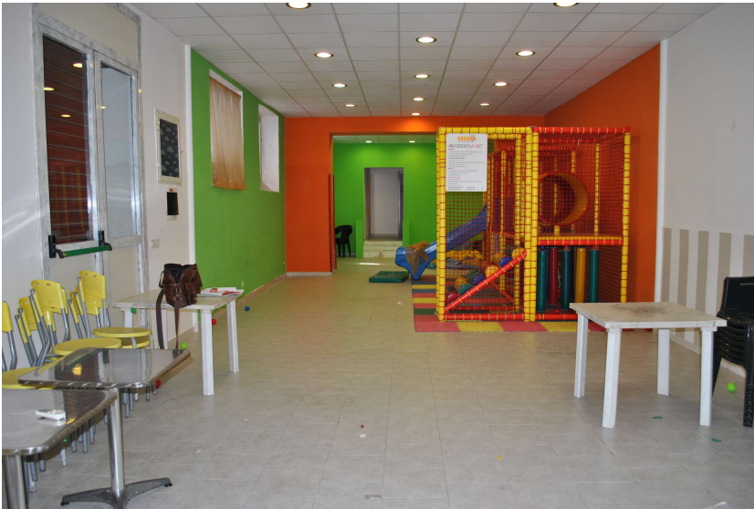
Area giochi (G)