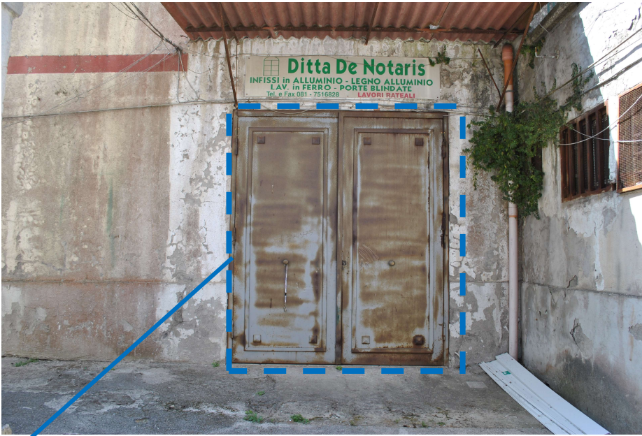
Accesso alla porzione d'immobile adibita a deposito