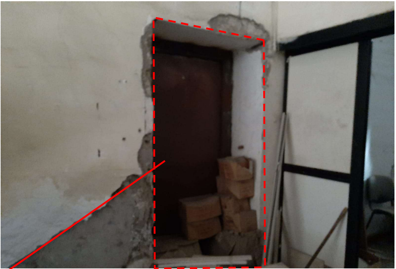
Collegamento, inaccessibile, tra la porzione del sub 3 adibita a deposito e quella adibita ad appartamento