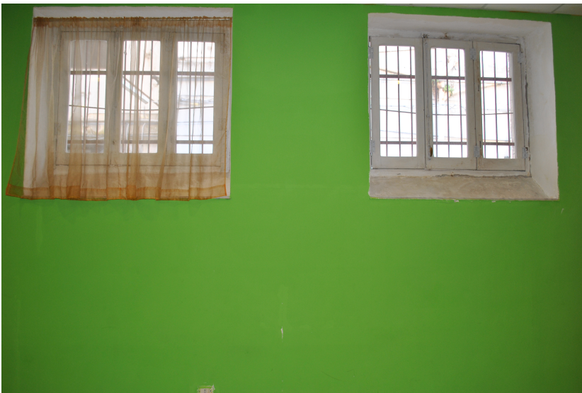
Area giochi (G)