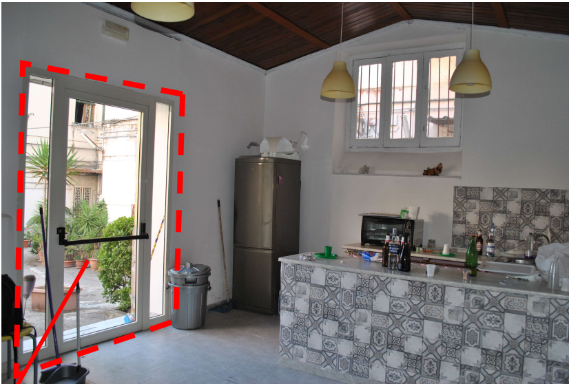
Porta d'Ingresso (I) - ludoteca