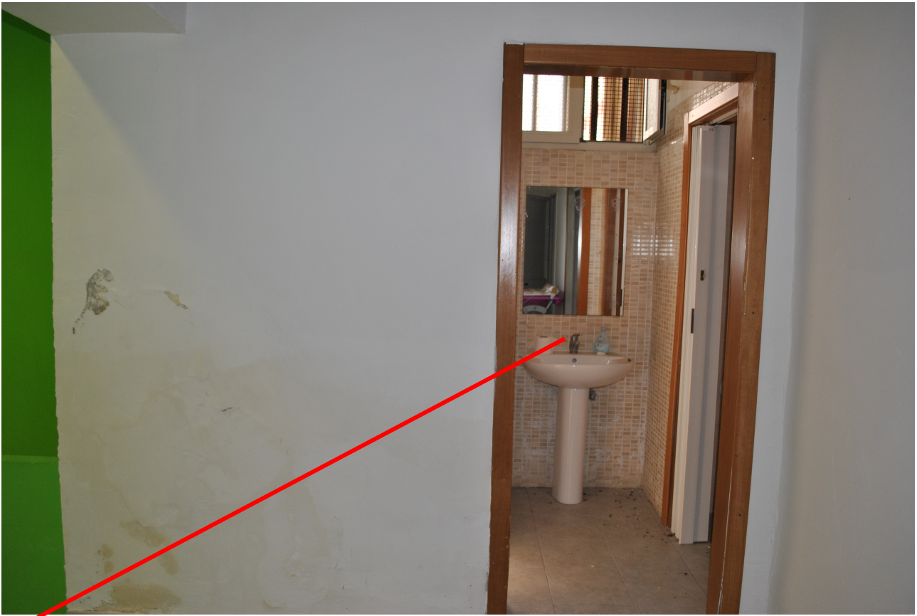
Accesso al bagno (WC) dal disimpegno (DIS)