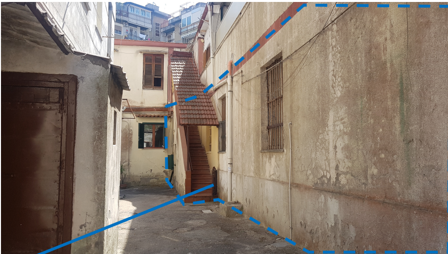
Prospetto su viale interno