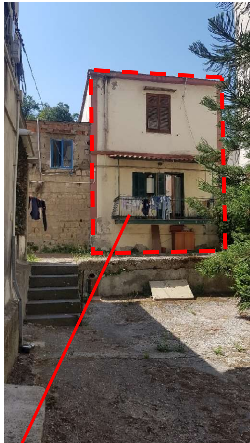
Prospetto su cortile della p.lla 94