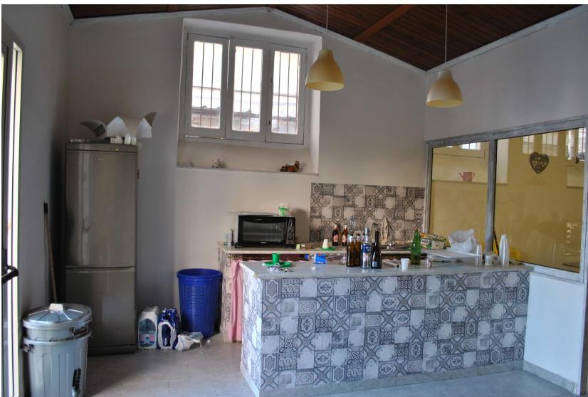
Angolo cottura (K)