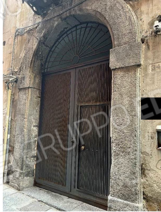
Foto n. 1 – portone di ingresso al fabbricato al Vico dei Corrieri n. 34

dott. ing. Benvenuto Suriano via V. Colonna 4 - 80121 Napoli tel./fax 081 665832 cell. 335 6062111 tinosuriano@gmail.com pec: benvenuto.suriano@ordingna.it CTU del Tribunale di Napoli n. 5836/86