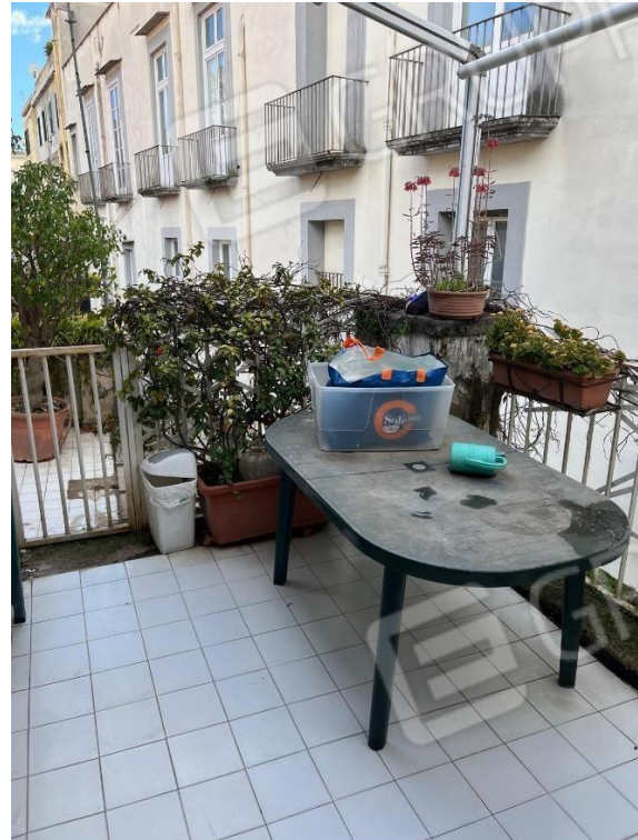
Foto n. 28 – terrazzo a servizio della cucina e del tinello con affaccio su vico Fico