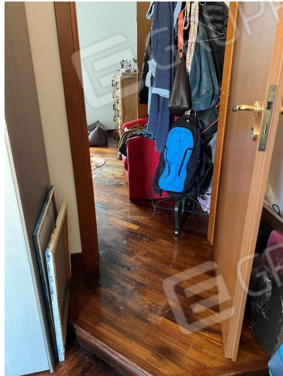
Foto n. 18 – vano di collegamento tra camera da letto 1 e camera da letto 2