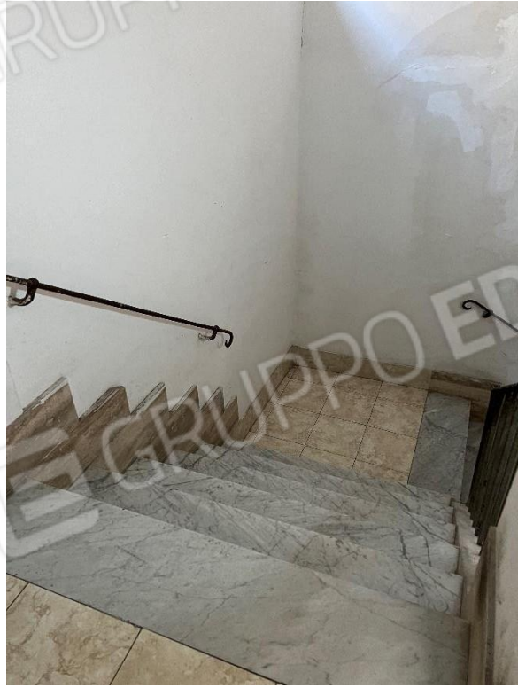
Foto n. 5 - rampa scala di accesso all'immobile