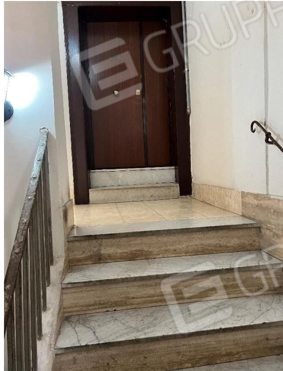
Foto n. 6 - Porta di caposcala dell'appartamento pignorato