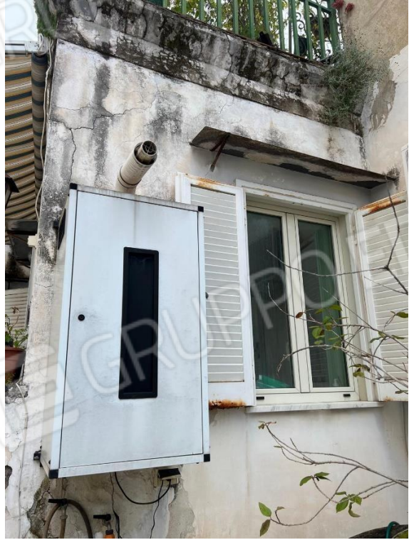
Foto n. 27 – facciata esterna con finestra da eliminare del tinello

dott. ing. Benvenuto Suriano via V. Colonna 4 - 80121 Napoli tel./fax 081 665832 cell. 335 6062111 tinosuriano@gmail.com pec: benvenuto.suriano@ordingna.it CTU del Tribunale di Napoli n. 5836/86