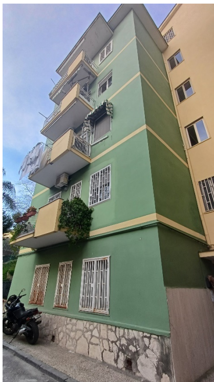
FIGURA 1 – FABBRICATO VIA CONSALVO 150, SCALA F

L'immobile appare in discrete condizioni manutentive, è dotato di impianto elettrico, impianto idrico di adduzione e di scarico, di riscaldamento con terminali a parete. L'immobile non è dotato di Ape (attestato di prestazione energetica). Non è dotato di certificazione impianti elettrici ed impianti termici.