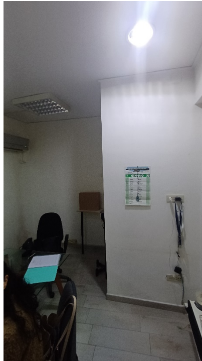
FIGURA 2- Camera

L'esperto allega la planimetria dello stato reale dei luoghi e rinvia le ulteriori foto all'allegato di rilievi fotografici.