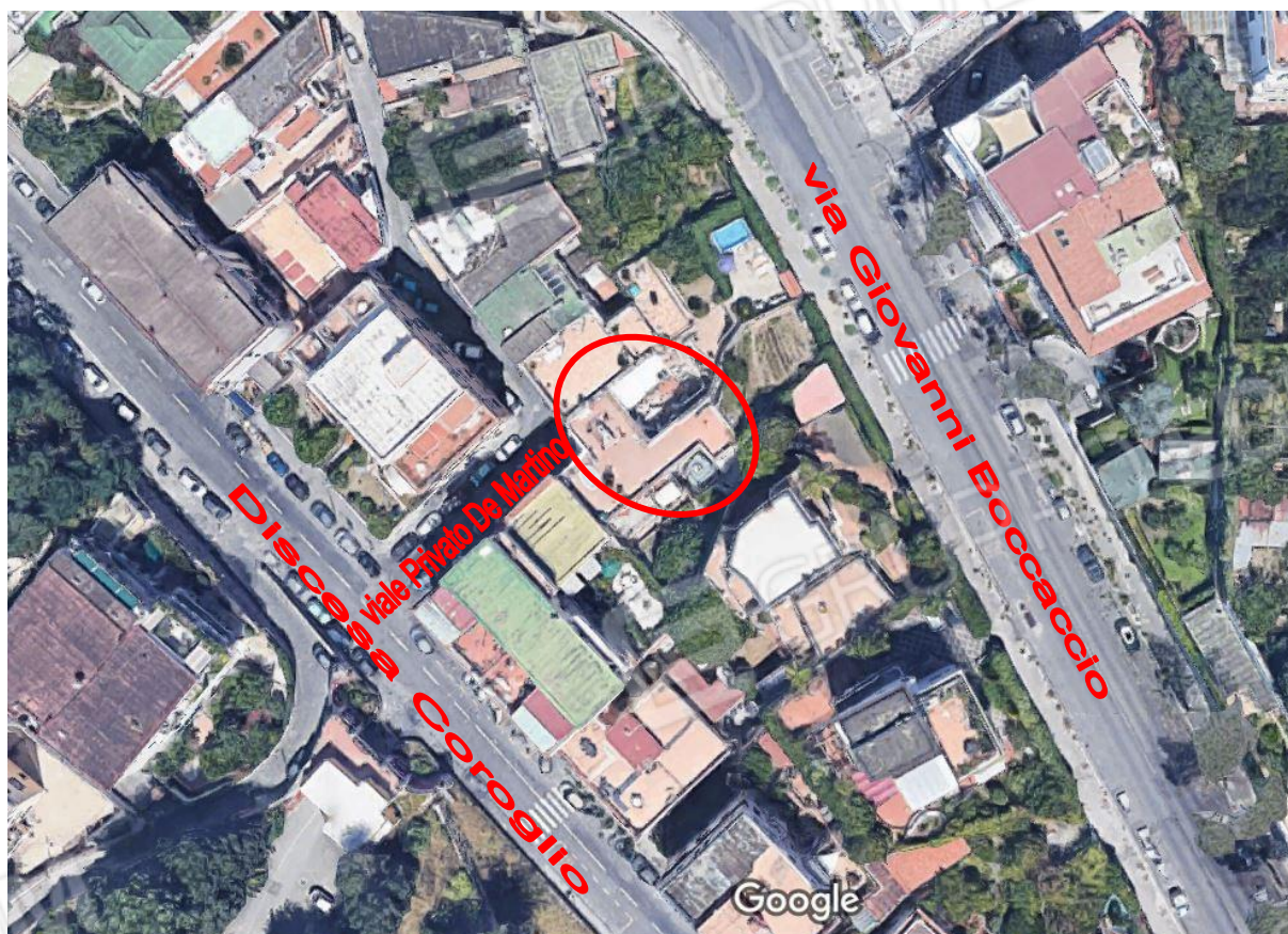
inquadramento territoriale - viale Privato De Martino fabbricato civico n. 22