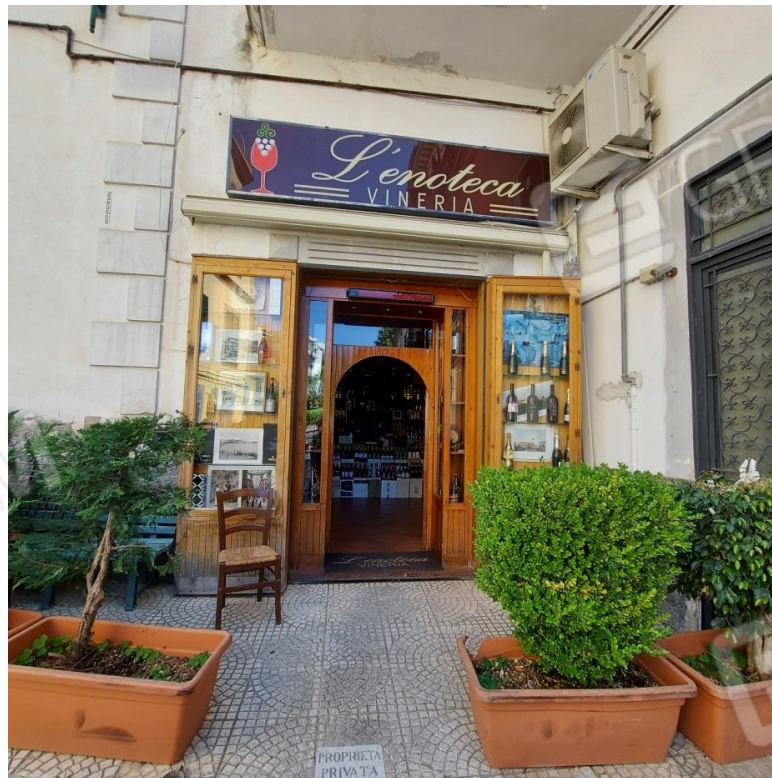
accesso cespite pignorato civ.22