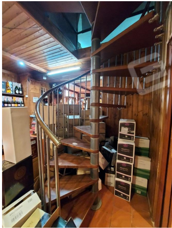
Scala che conduce al soppalco