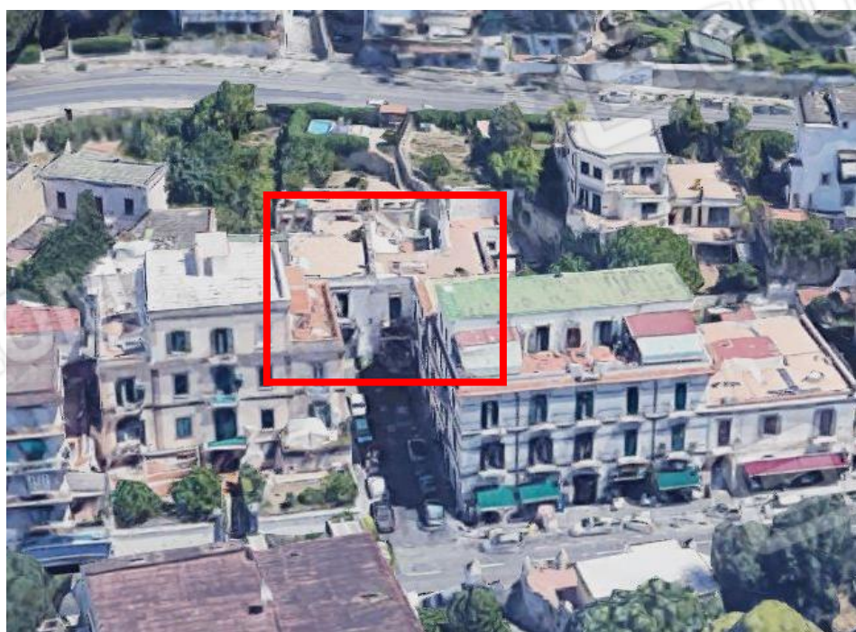
inquadramento territoriale - vista prospettica - individuazione fabbricato