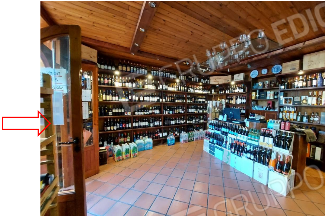
Locale L1 - indicazione accesso