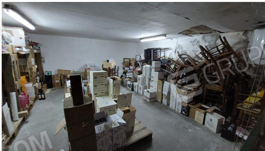
soppalco - Locale L2