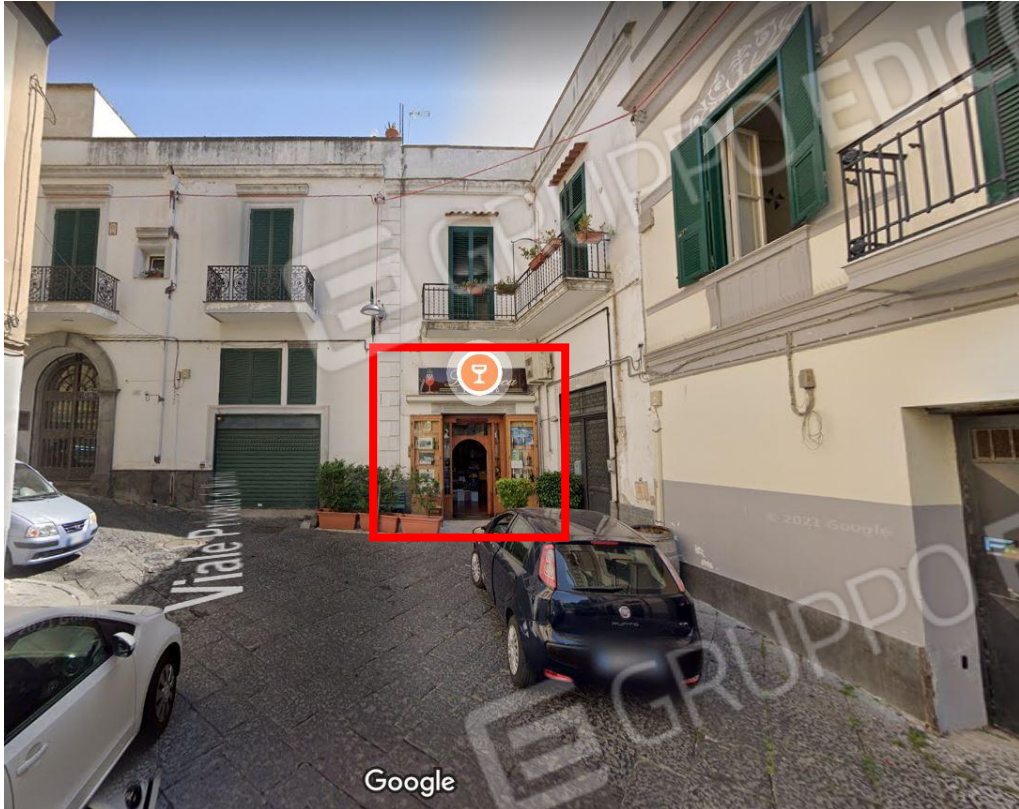
prospetto su strada privata - indicazione accesso cespite pignorato civ.22