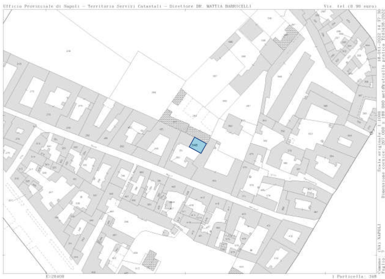
Mappa Catastale-NCT- F. 7- particella 348