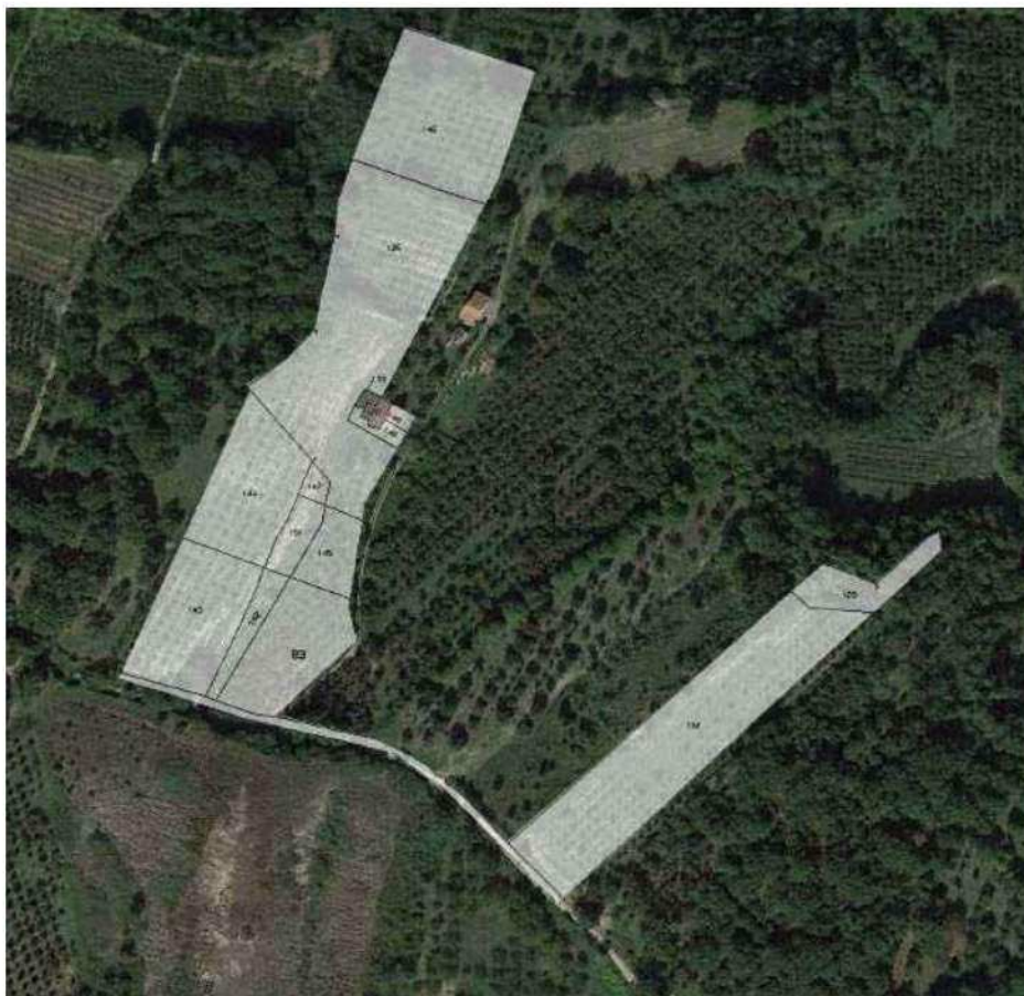
Aerofoto 4 sovrapposizione estrato di mappa catastale a aerofoto