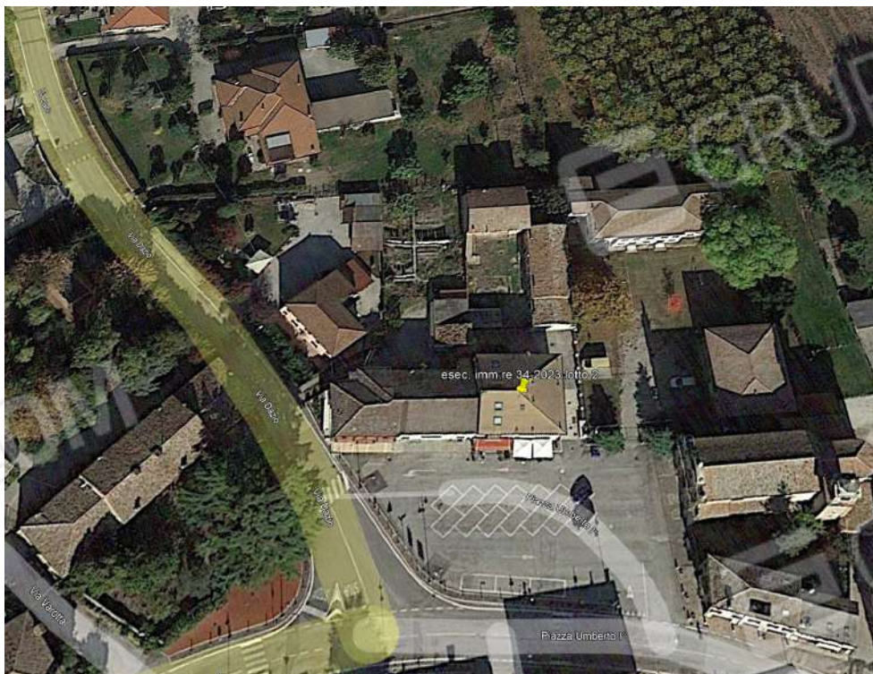
Foto satellitare particolare