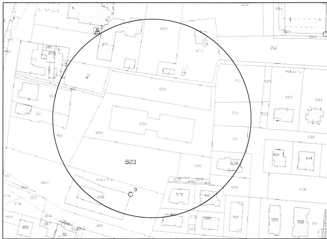
Stralci di mappa Comune di Argenta Fg. 4 Mapp. 666-659-623 parte