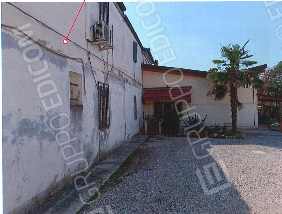
0.3 – appartamento visto da est