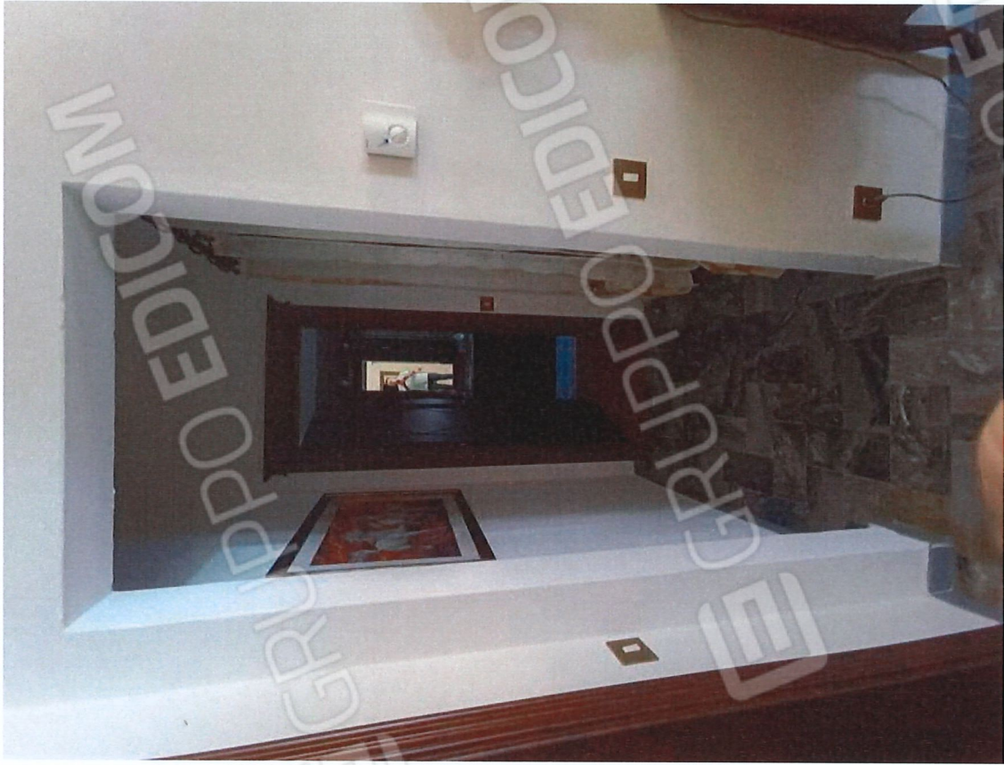
1.7 - ingresso/disimpegno