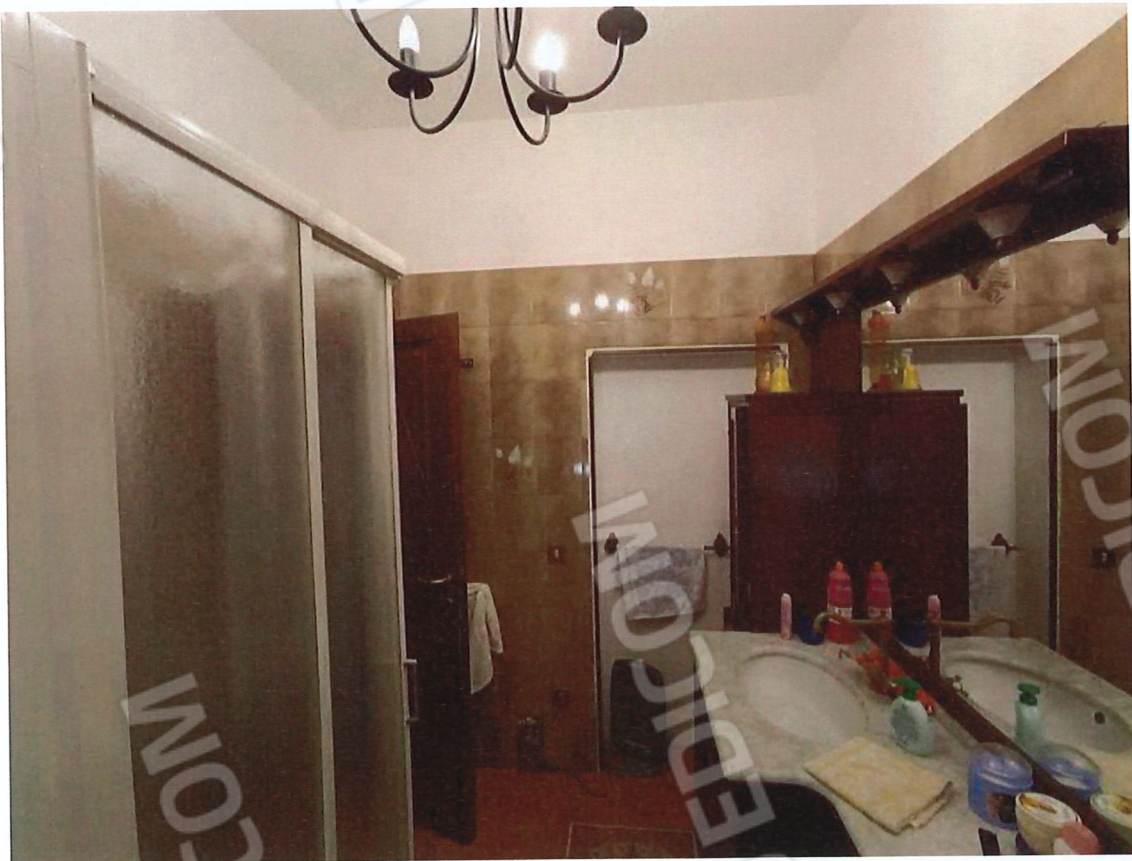
1.10 - bagno - vista 2