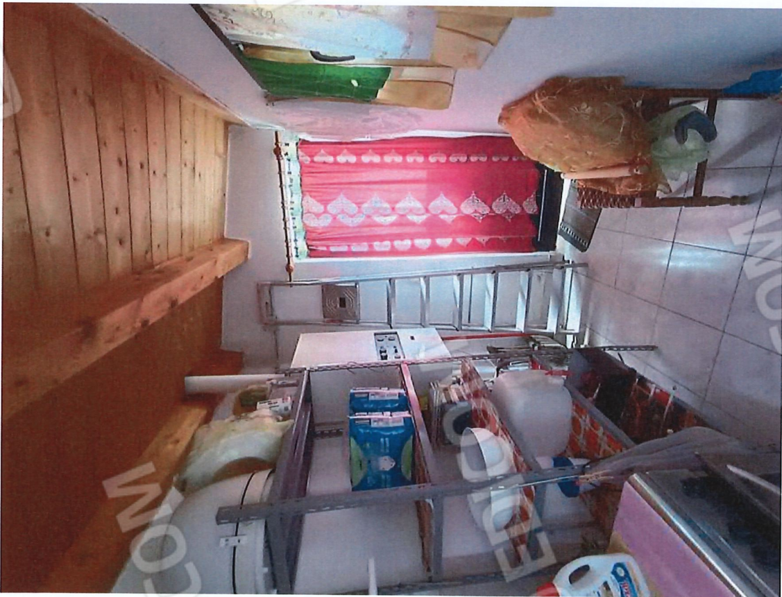
1.12 - centrale termica