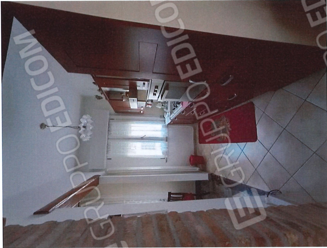
1.5 - pranzo-cucina - vista 1