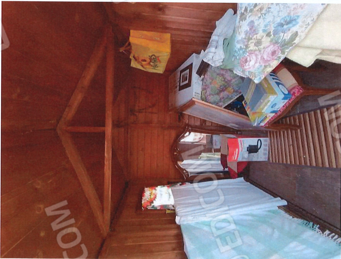
3.3 - vista interna