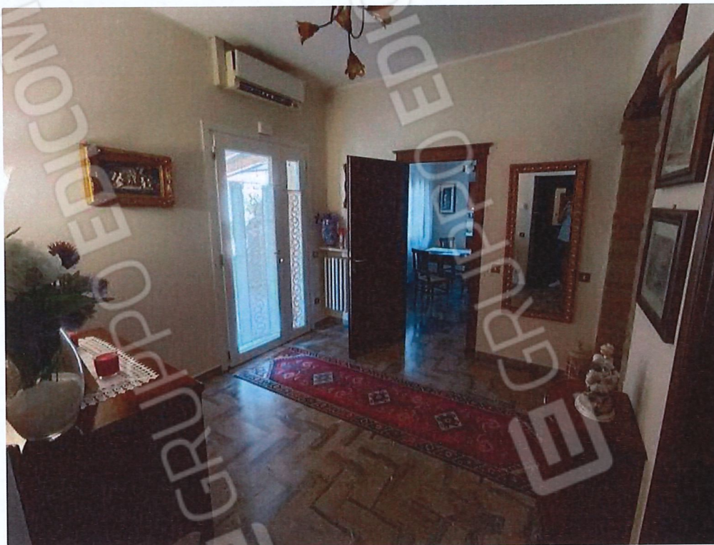
1.1 – ingresso - vista 1