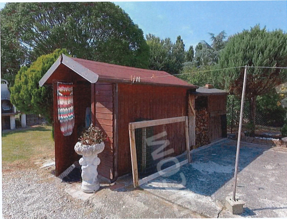
3.1 - vista da sud-est