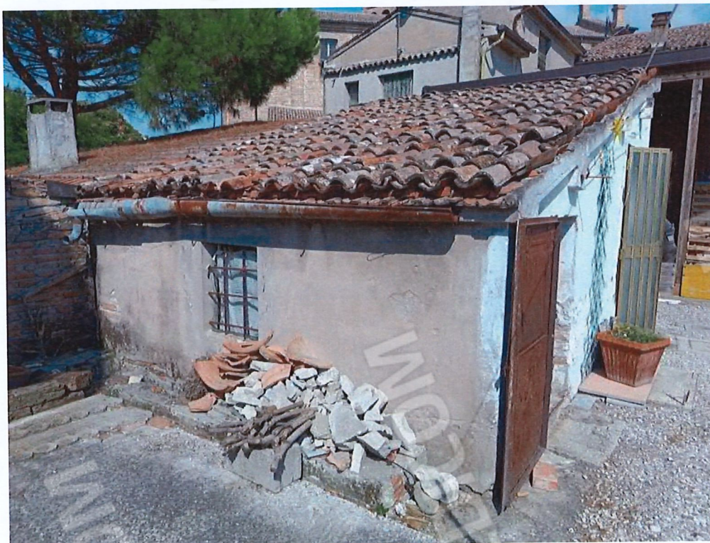
2.2 - vista da ovest