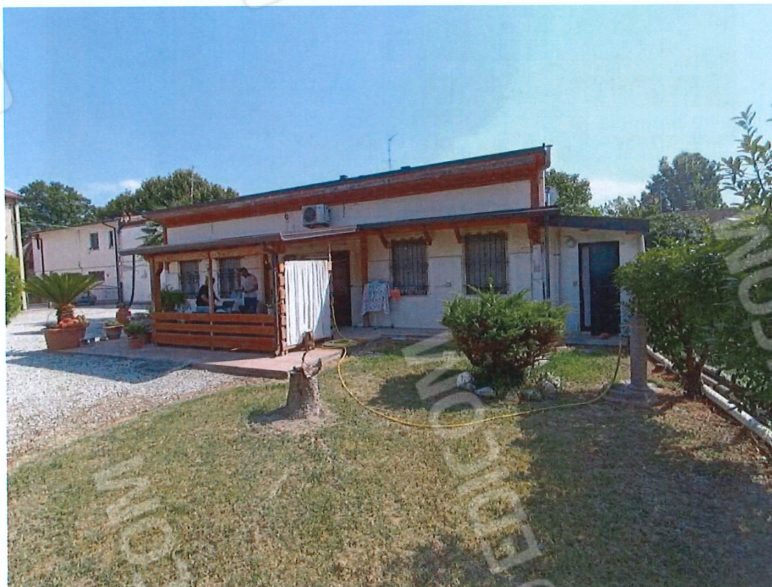
0.4 – appartamento visto da nord