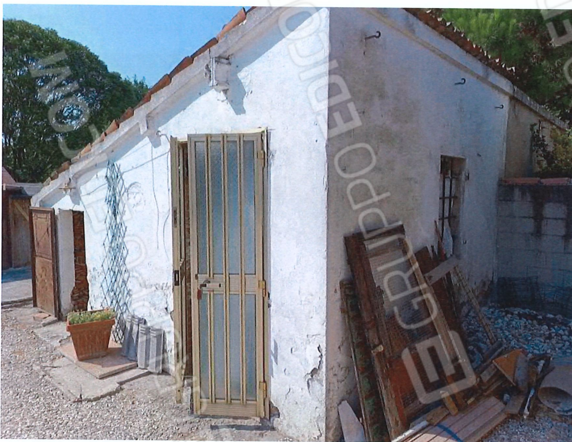
2.3 - vista da sud-est