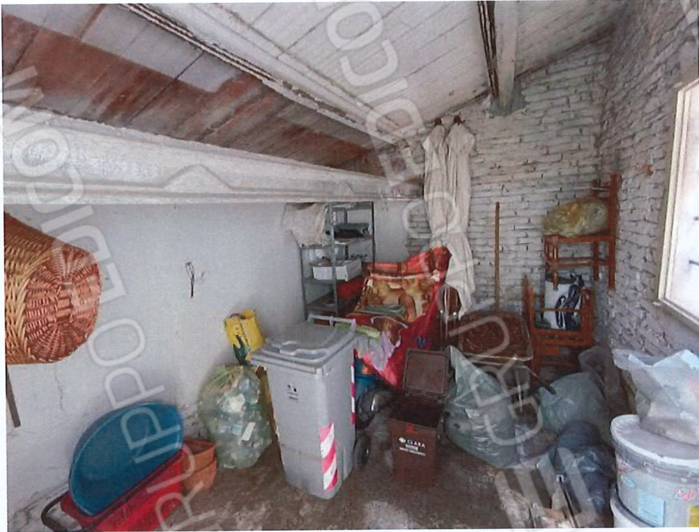
2.5 - interno ripostiglio 4