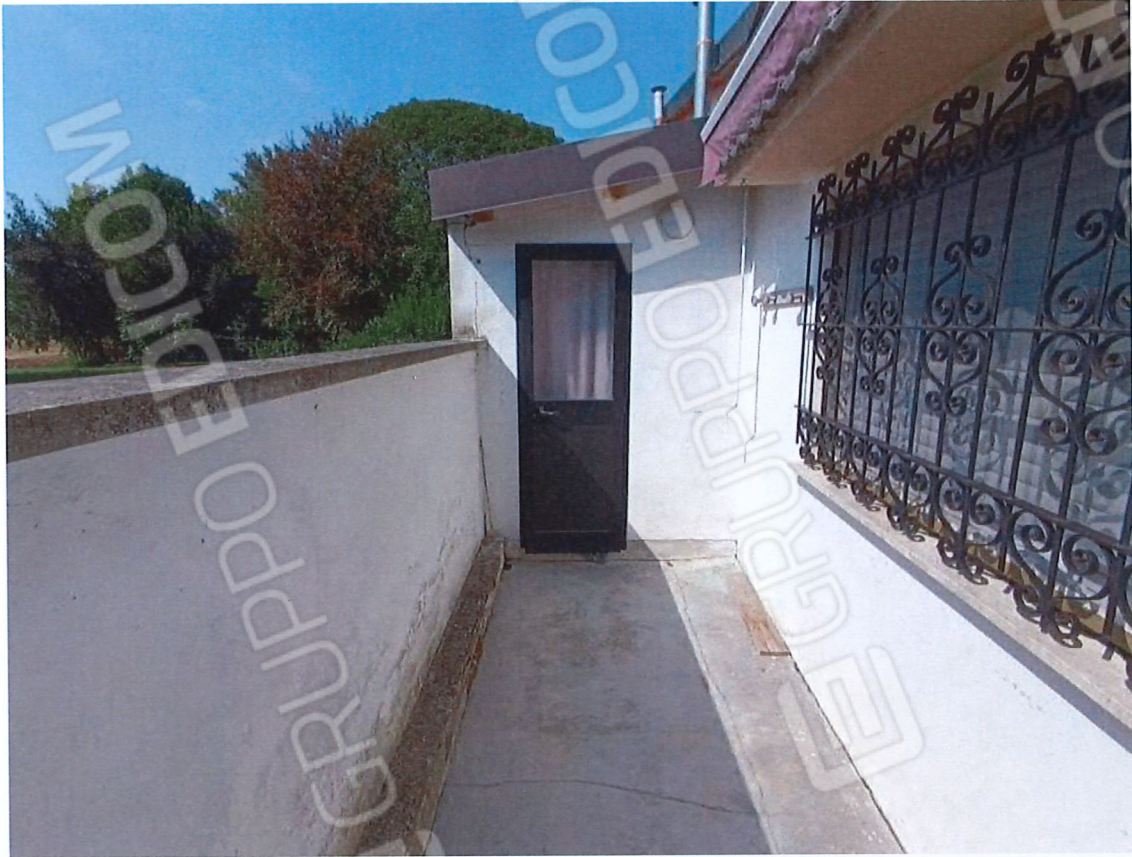
0.5 - corte interna ad ovest