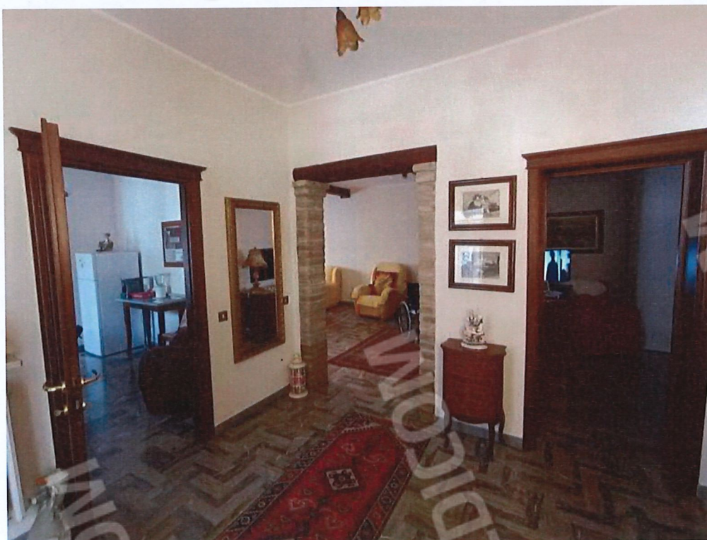
1.2 – ingresso - vista 2