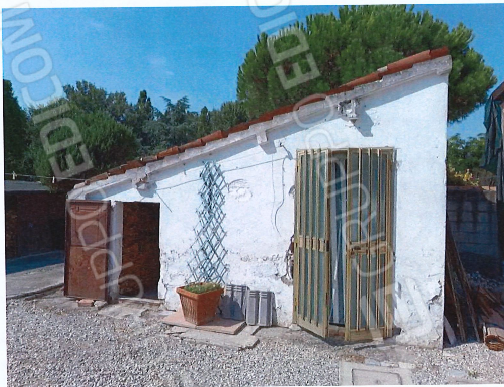
2.1 - vista da sud