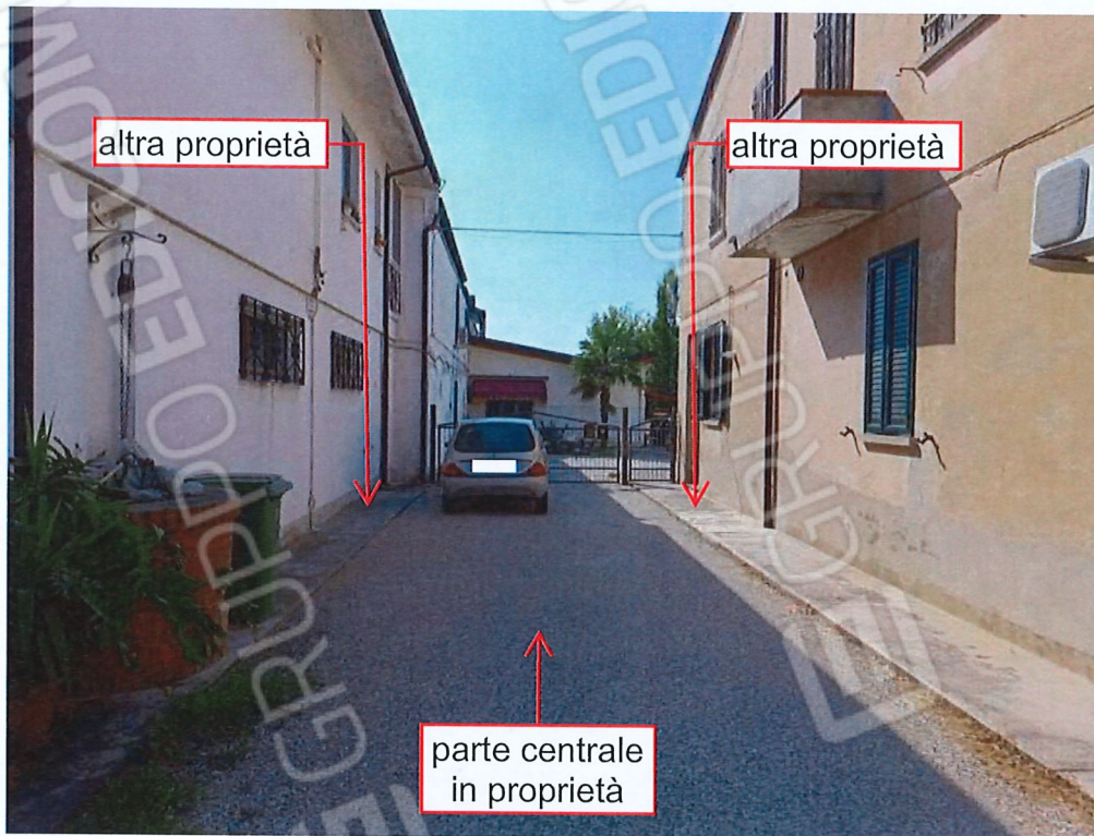
0.1 – accesso da P.zza XXI Giugno (da ovest)