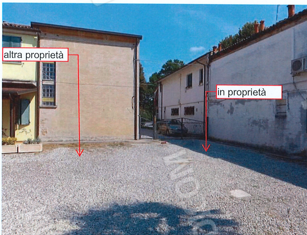
0.2 – vista dalla corte interna