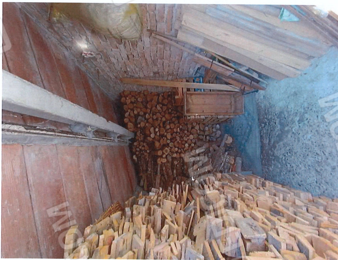
2.4 - interno ripostiglio 3