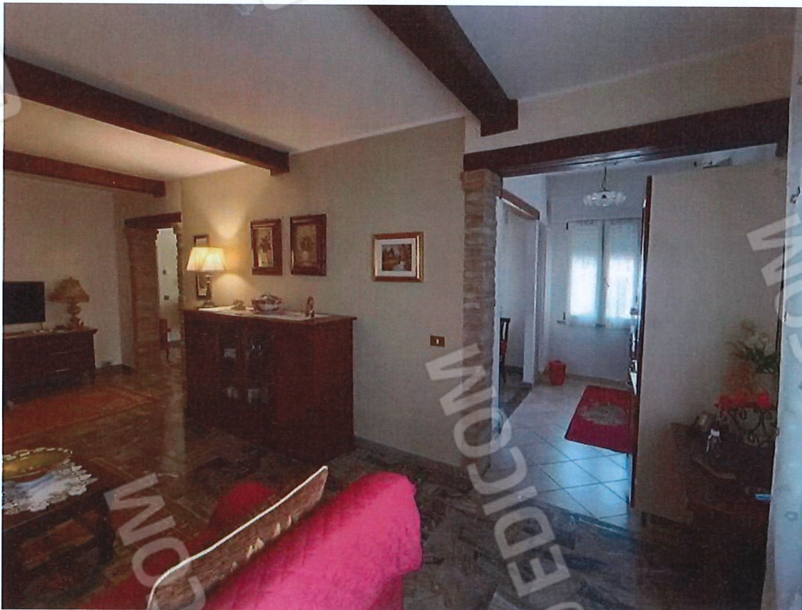
1.4 – soggiorno – vista 2