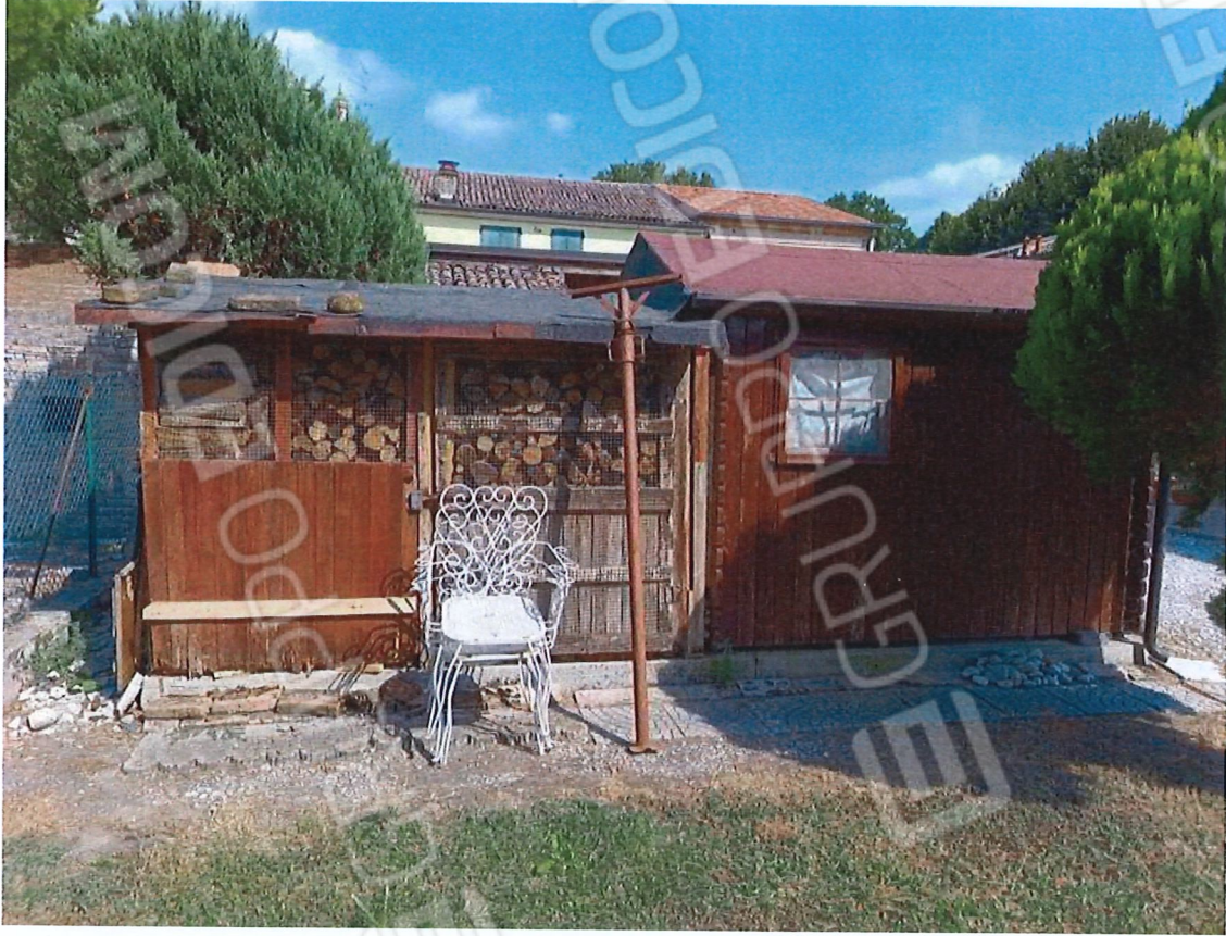
3.2 - vista da ovest