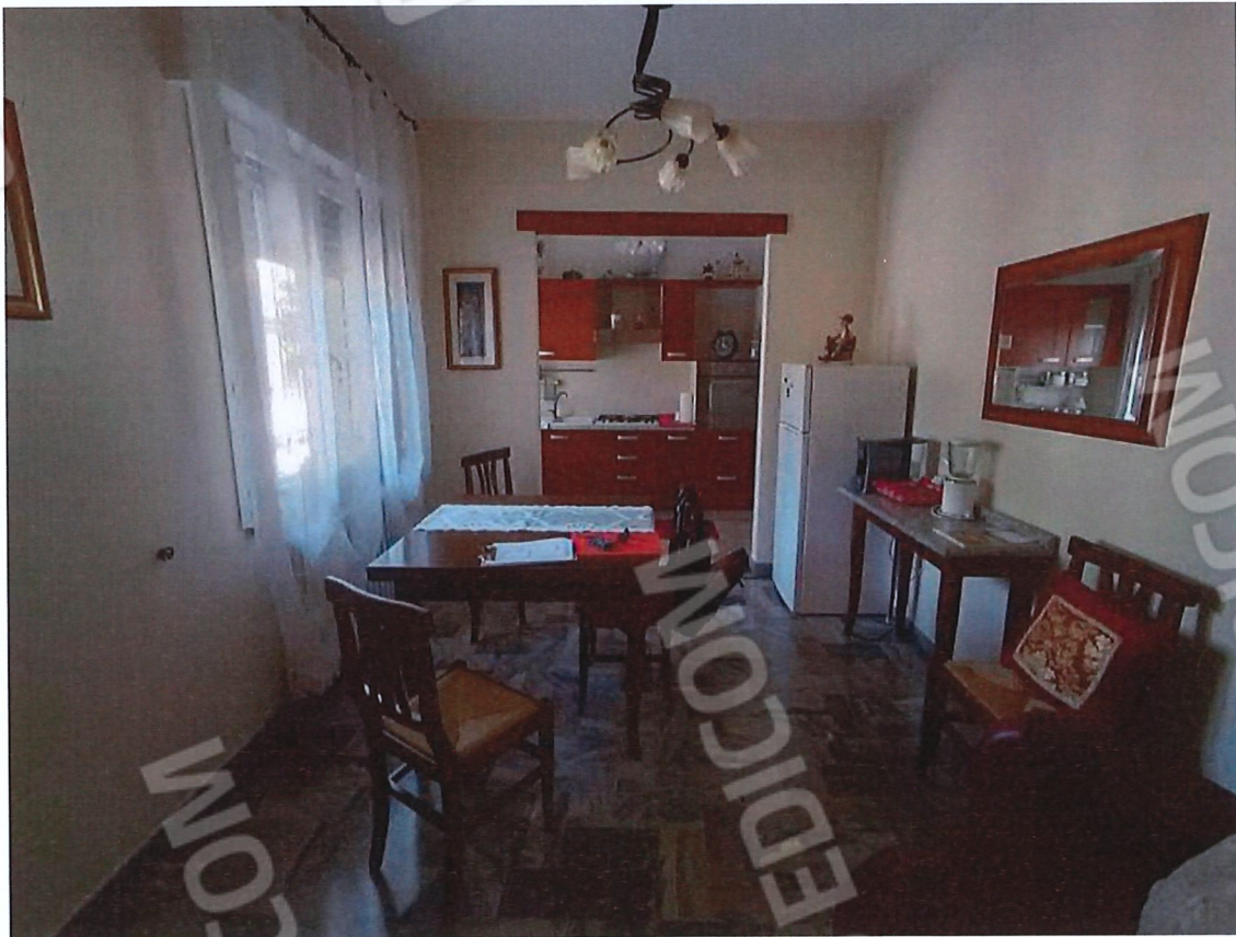
1.6 - pranzo-cucina - vista 2