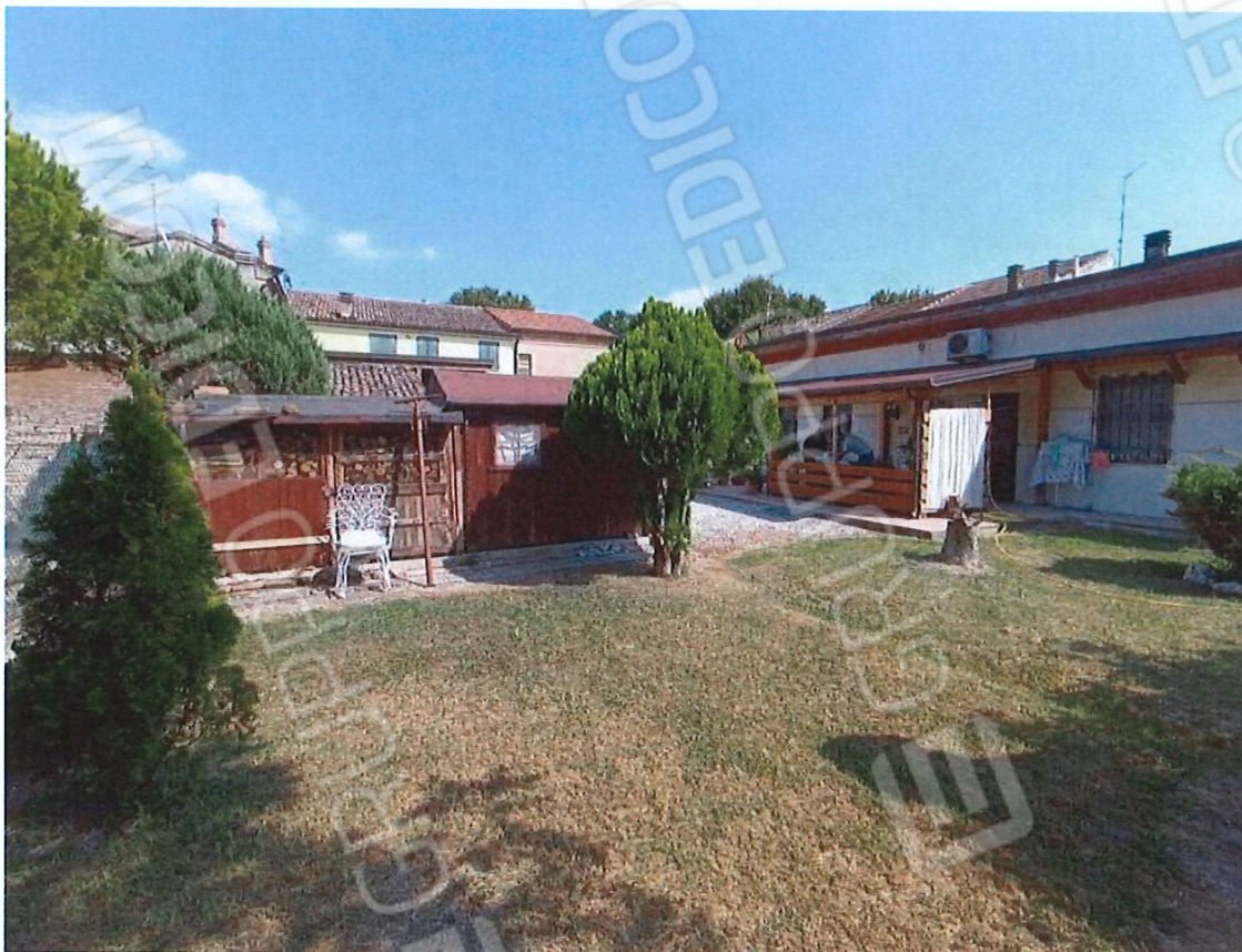
0.7 - proservizi e corte visti da nord-ovest