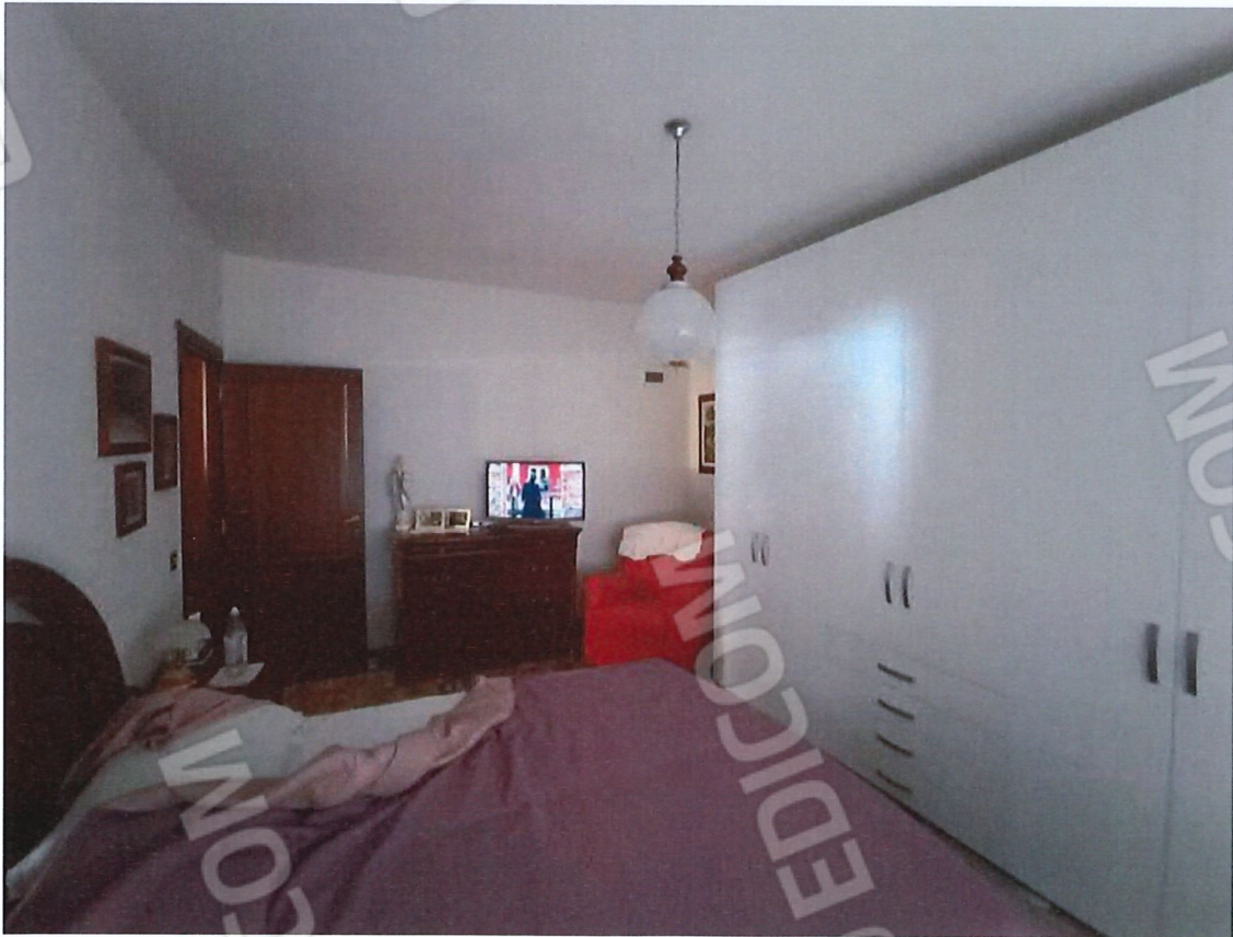
1.8 - letto