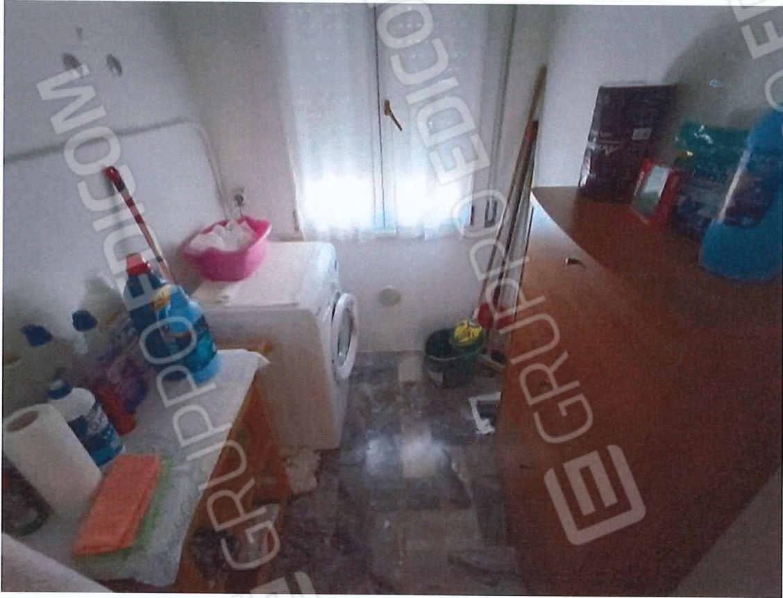
1.11 - ripostiglio