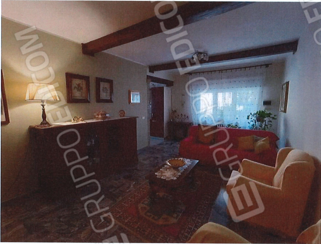
1.3 – soggiorno – vista 1