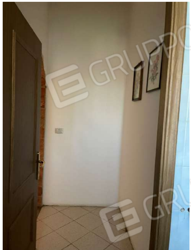
Anti bagno disimpegno P1