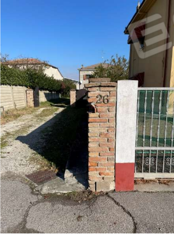
Ingresso su strada Via Piazza Garibaldi