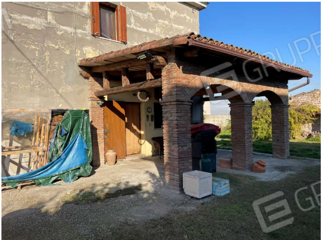
Portico lato sud