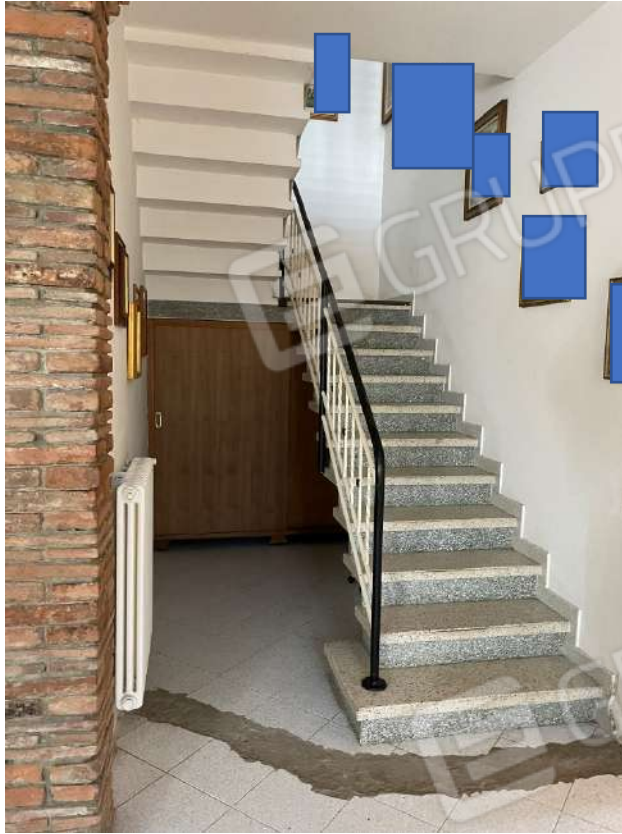
scala per piano primò