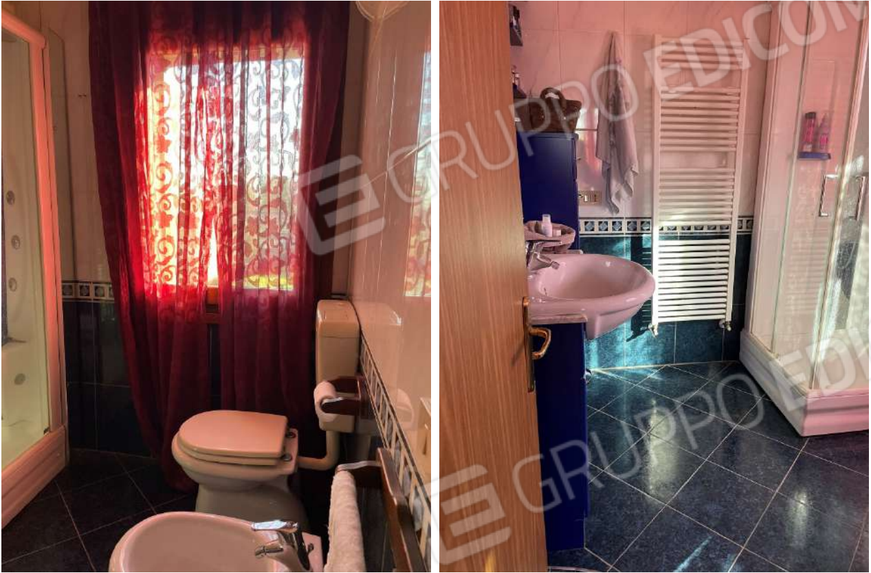
Bagno in camera