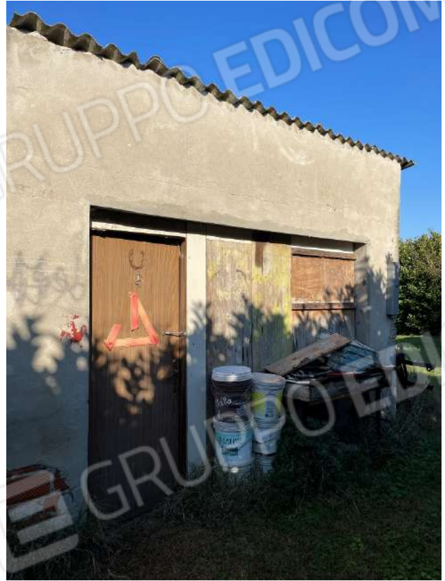
Fabbricato autorimessa in corte esclusiva