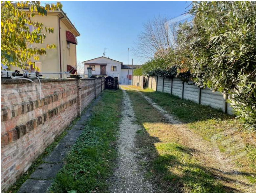
Area cortiliva accesso carraio e pedonale