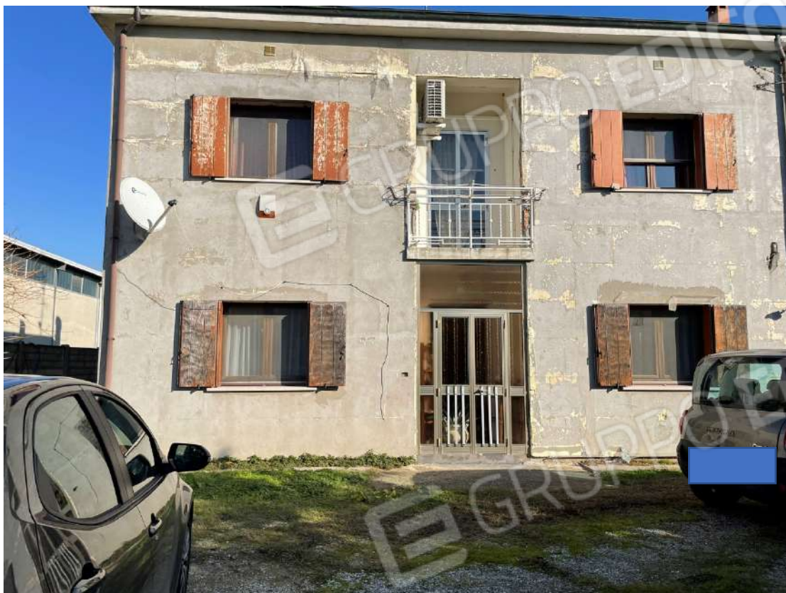
Prospetto principale lato est