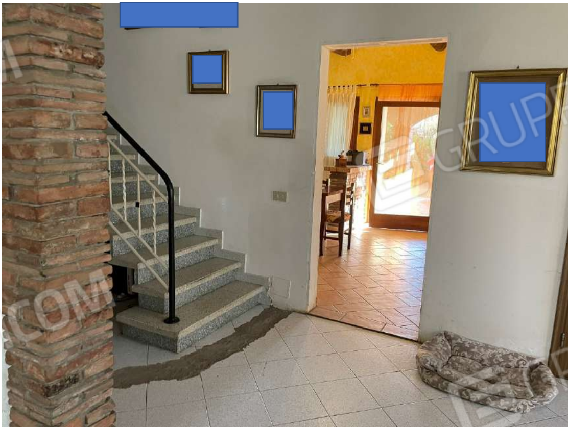
Ingresso, vano scala e accesso alla cucina