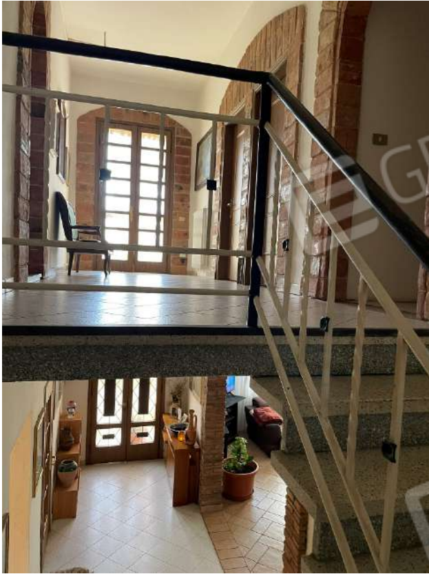
Ingresso scala e p1