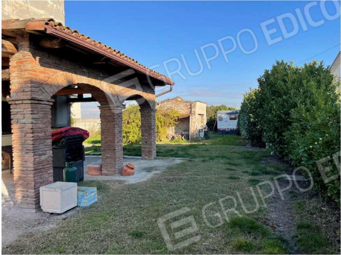
Area cortiliva esclusiva e prospetto Sud