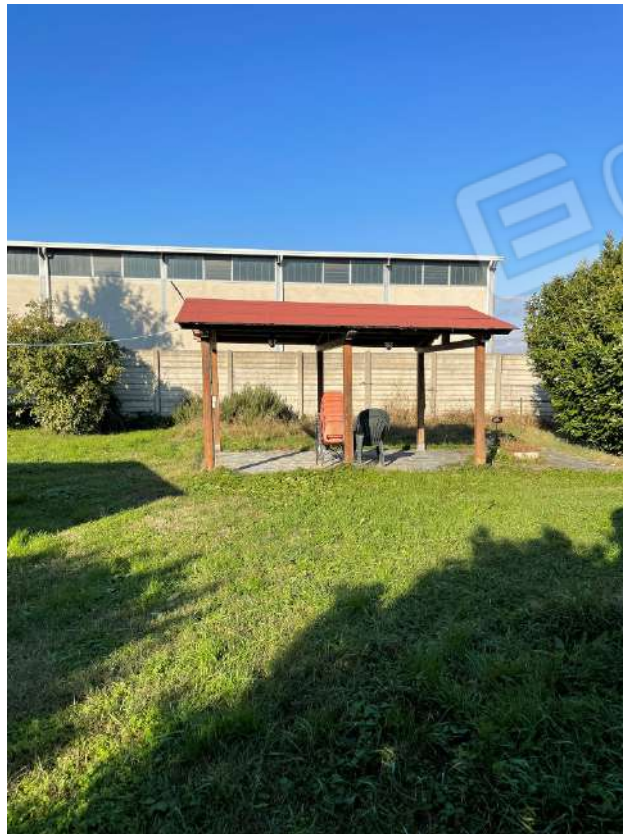
Tettoia in legno in corte esclusiva