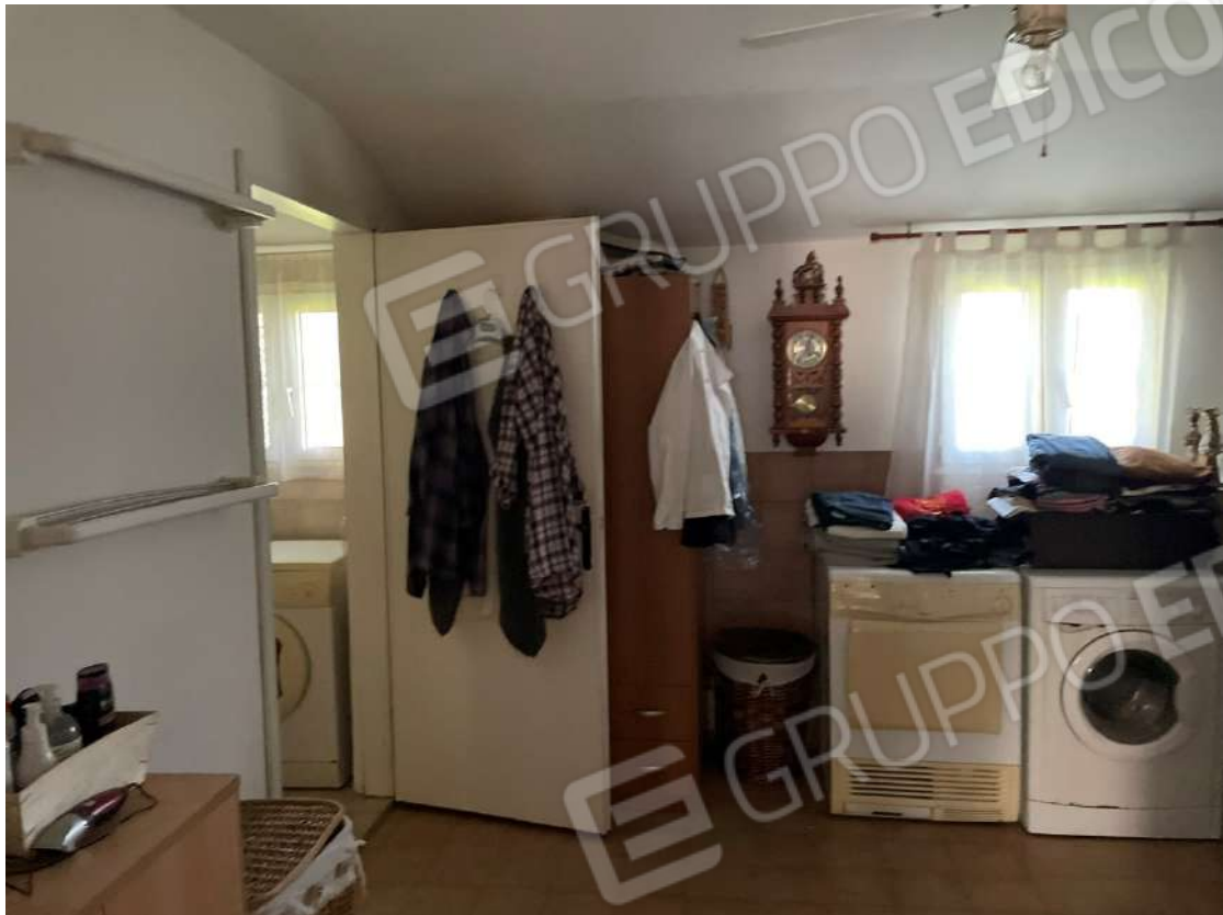
Ripostiglio con accesso al bagno