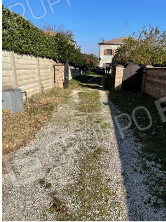
Accesso carraio e pedonale