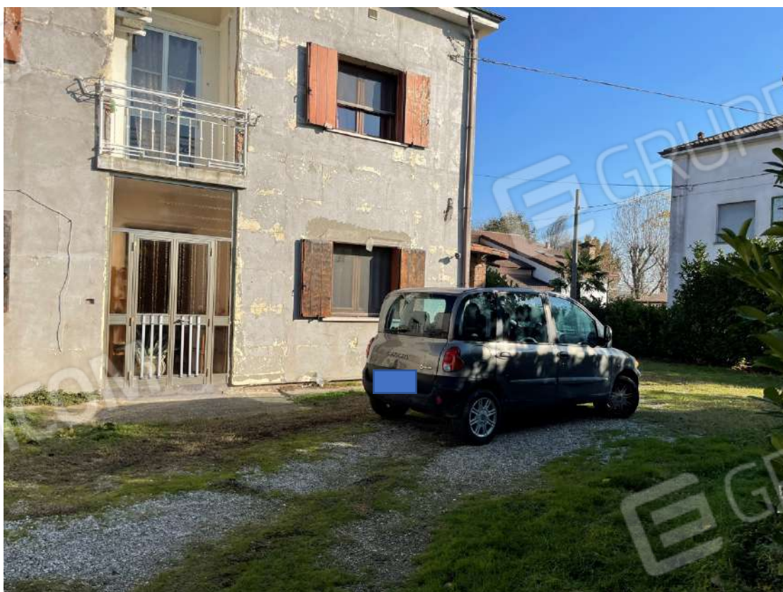
Prospetto principale lato est area cortiliva