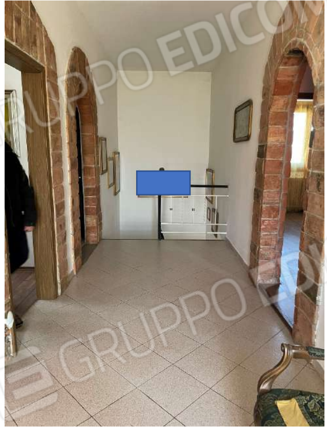
Corridoio piano primo