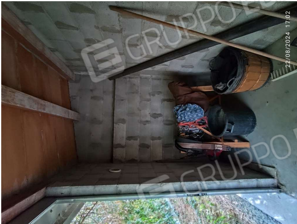
2.3 - ripostiglio