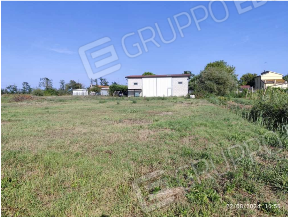
0.5 – Ricovero attrezzi lato ovest