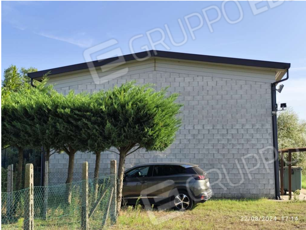
0.13 – Ricovero attrezzi lato nord