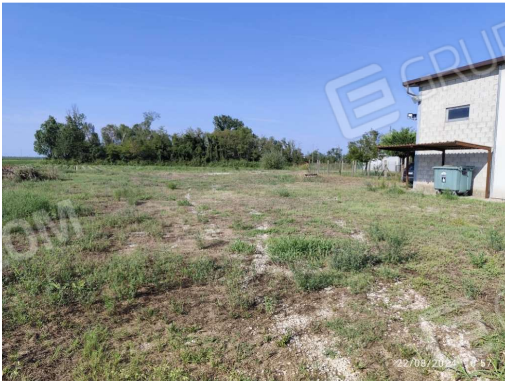
0.4 – area zona est