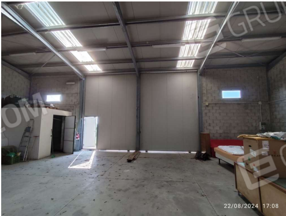
1.1 – portoni di accesso