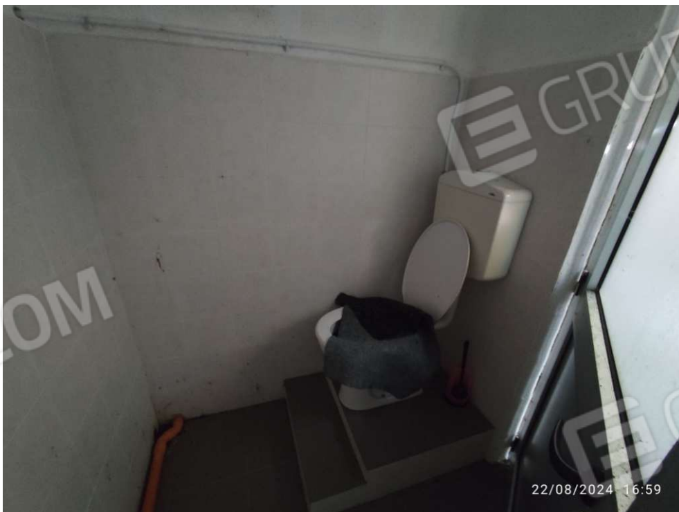
2.4 - w.c.