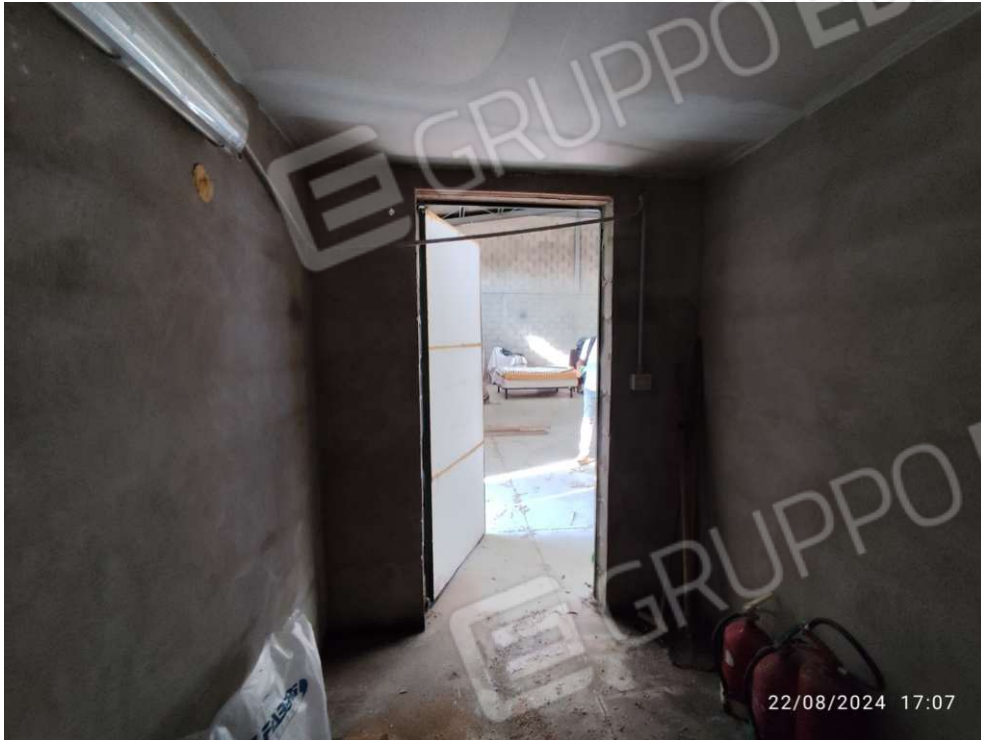
1.6 – deposito - vista 2