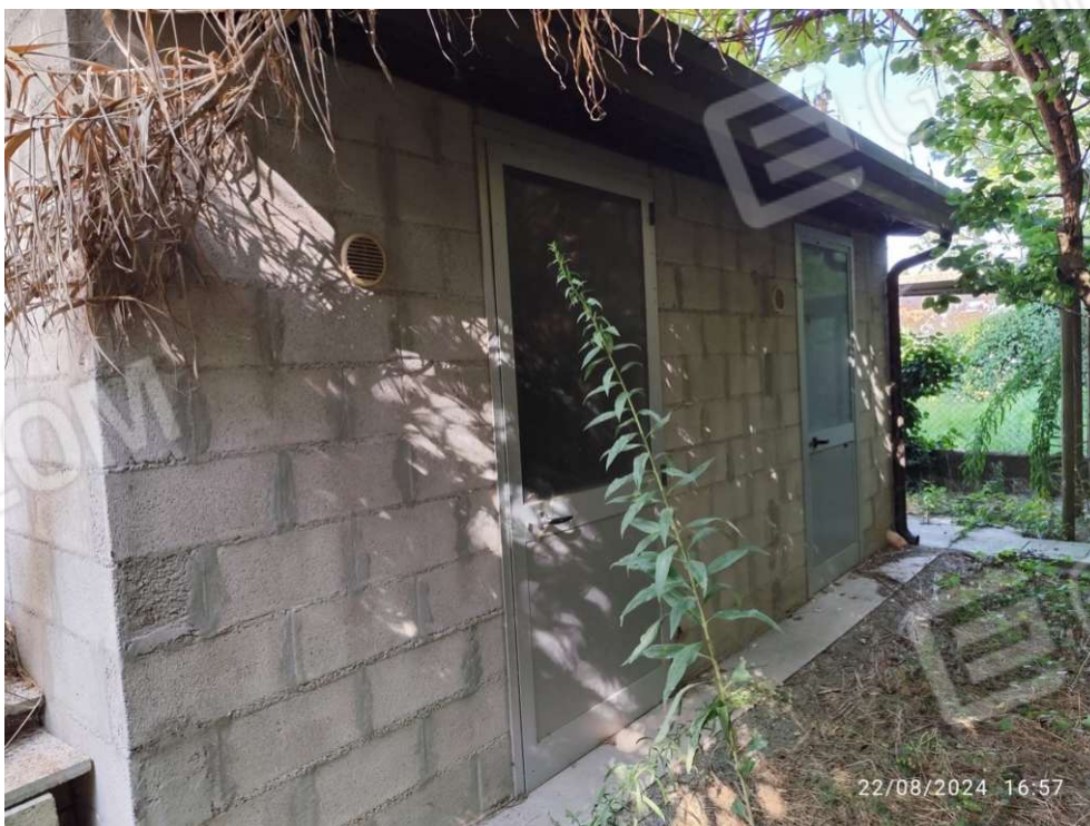
2.2 - vista esterna 2