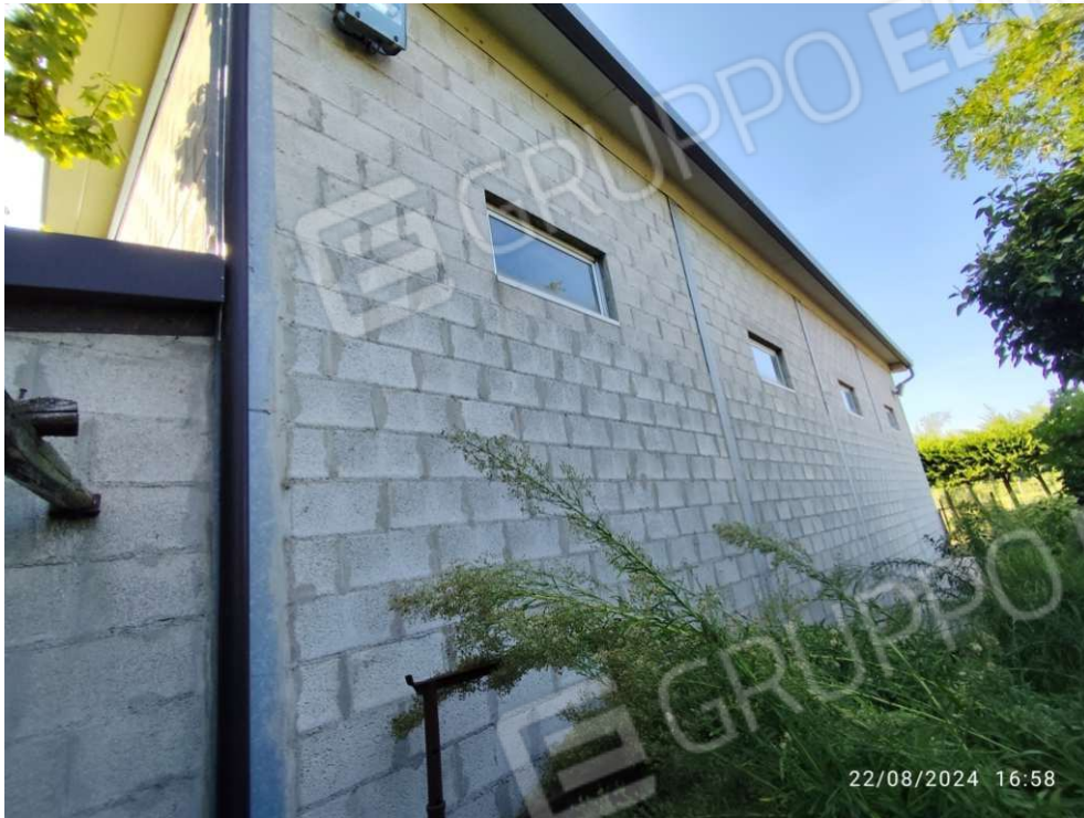
0.15 – Ricovero attrezzi lato est