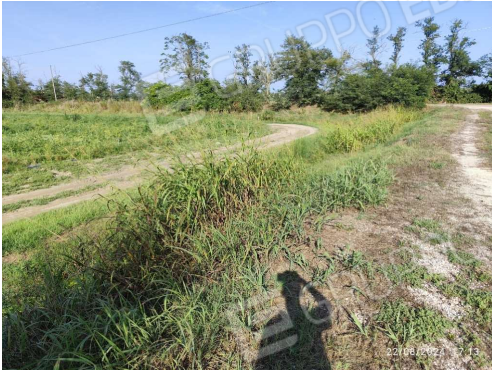
0.9 – confine lato nord