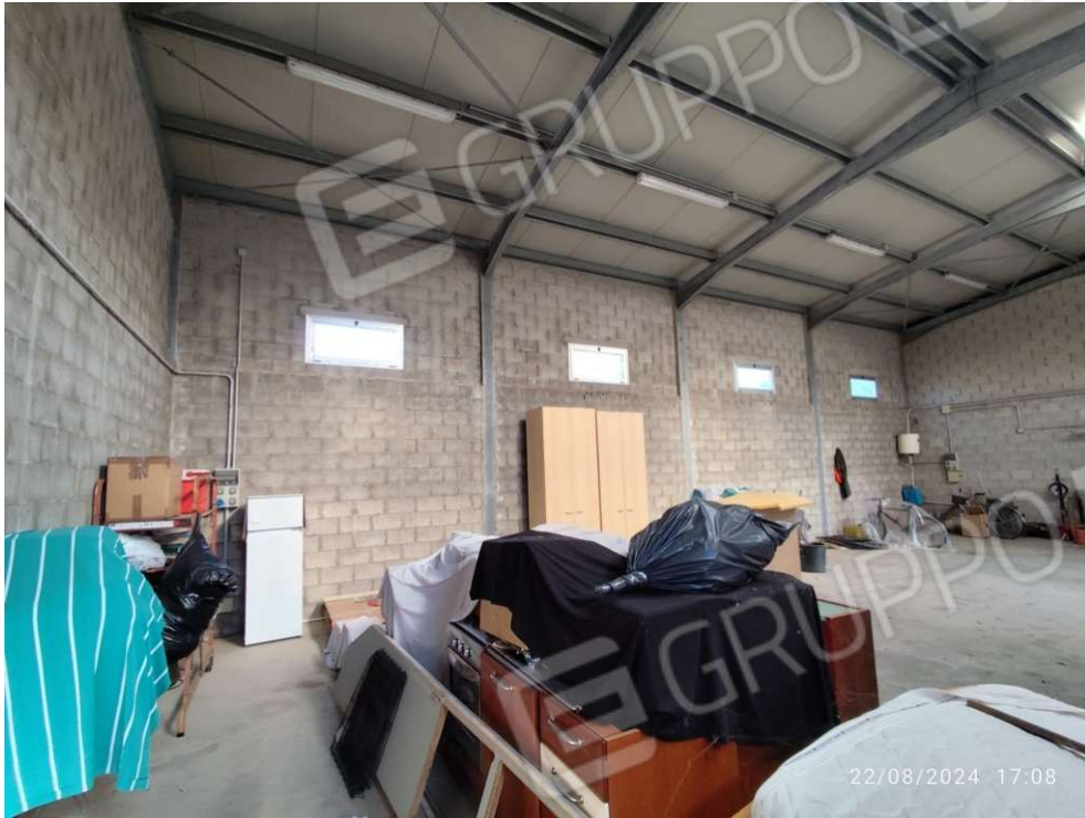
1.4 – vista 3