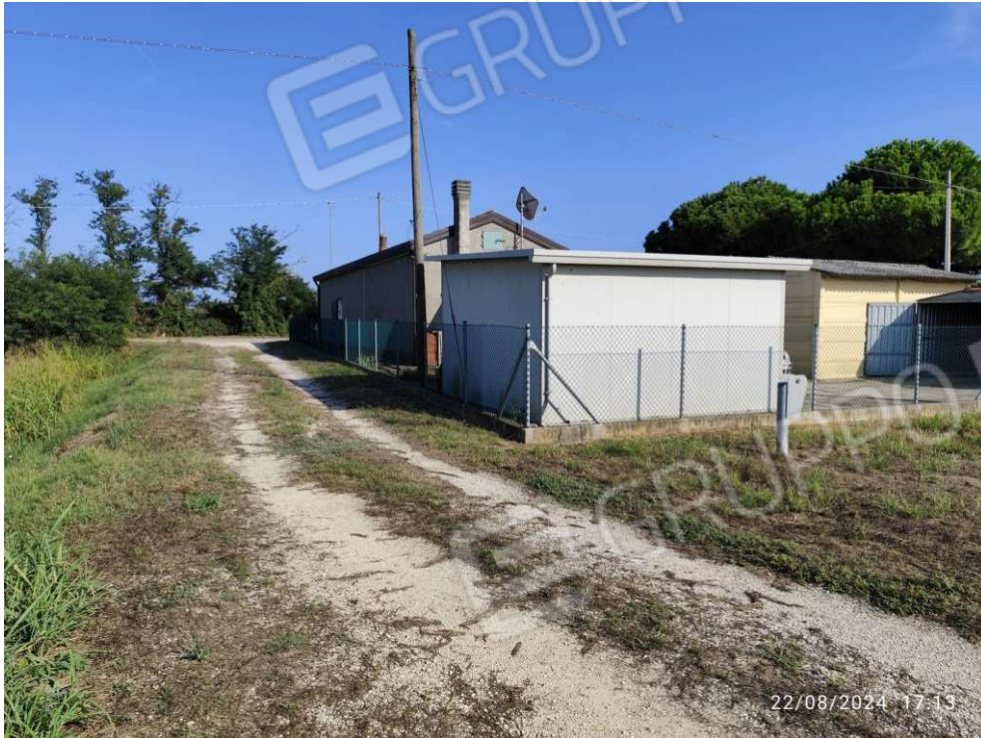
0.1 – accesso all'area