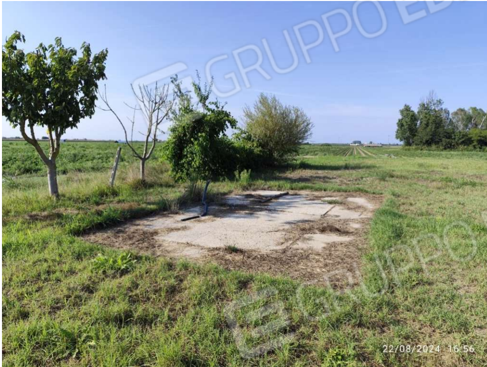
0.7 – area zona ovest