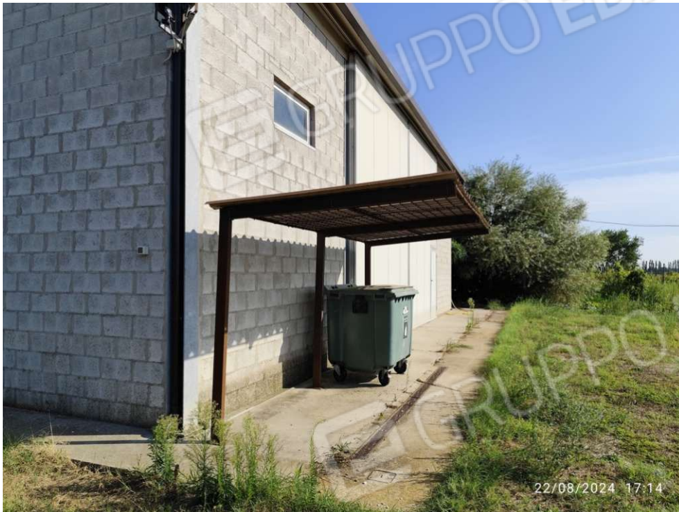
0.11 – pensilina