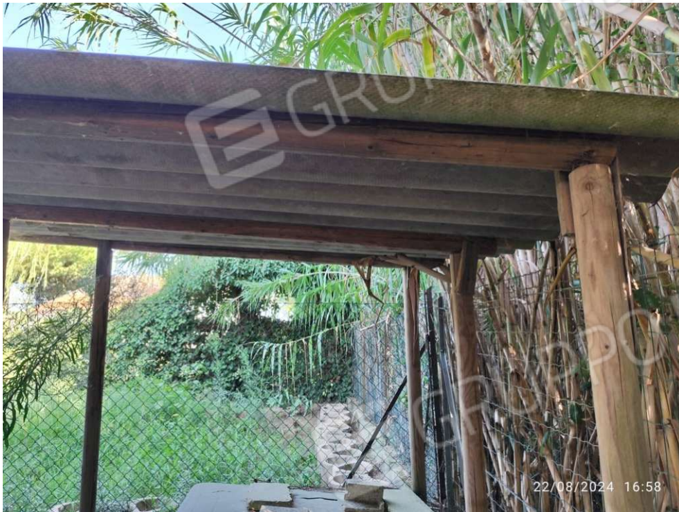
2.5 - tettoia - vista 1