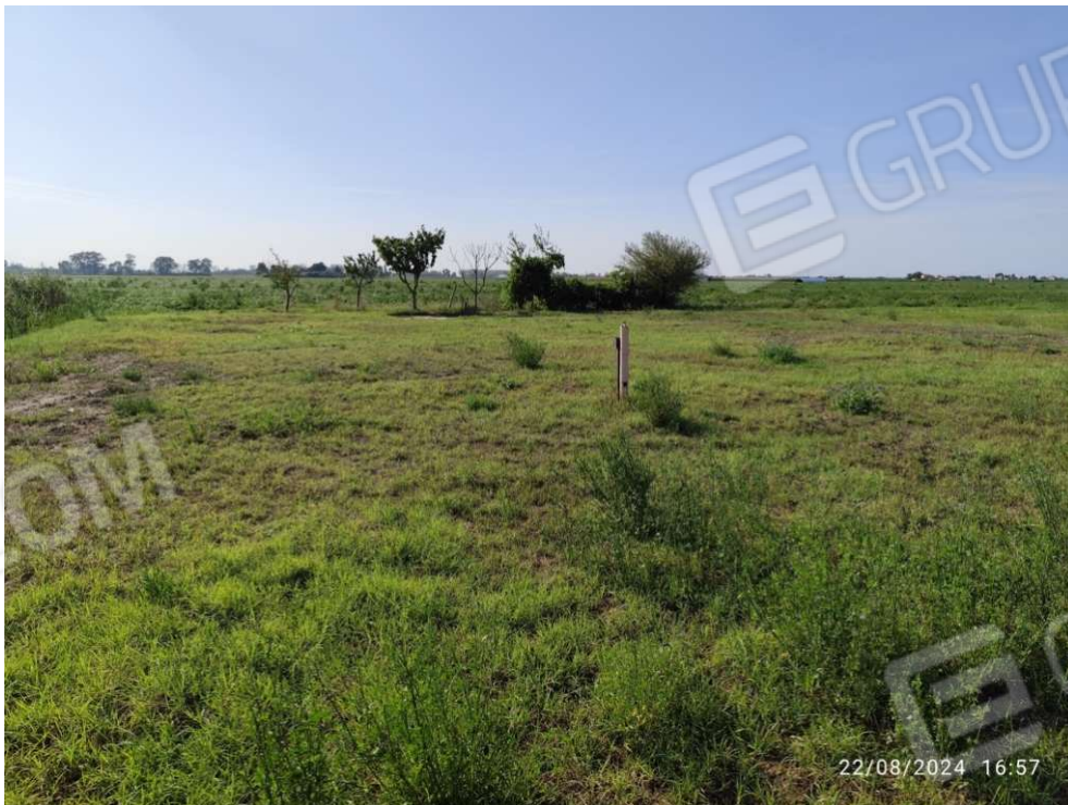
0.8 – vista area lato ovest