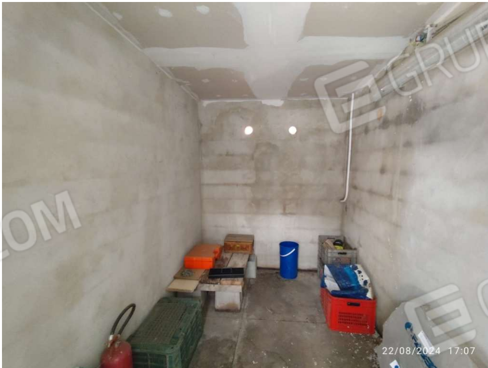
1.7 – deposito - vista 3