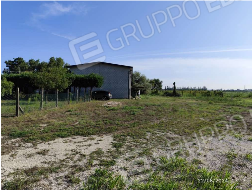
0.3 – Ricovero attrezzi lato nord