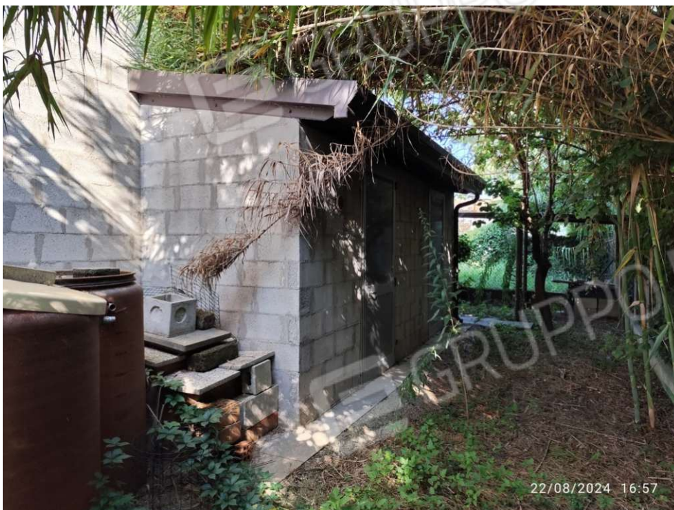
2.1 - vista esterna 1