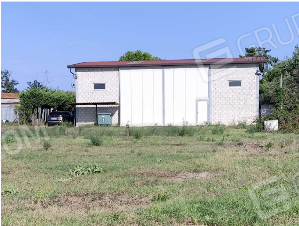
0.10 – Ricovero attrezzi lato ovest