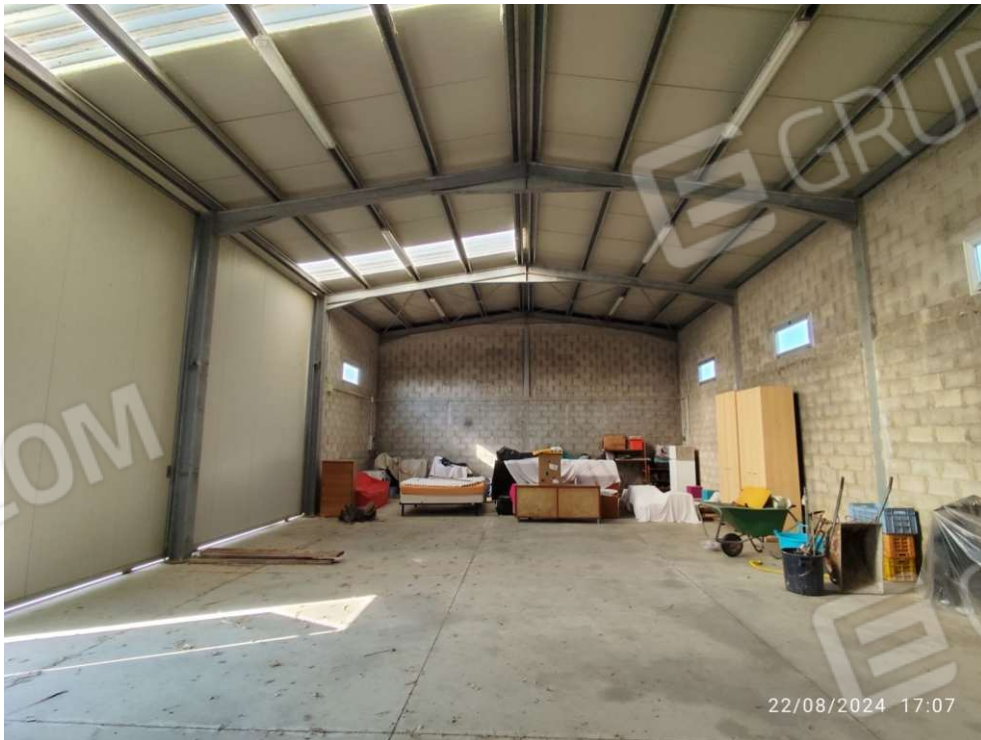
1.3 – vista 2