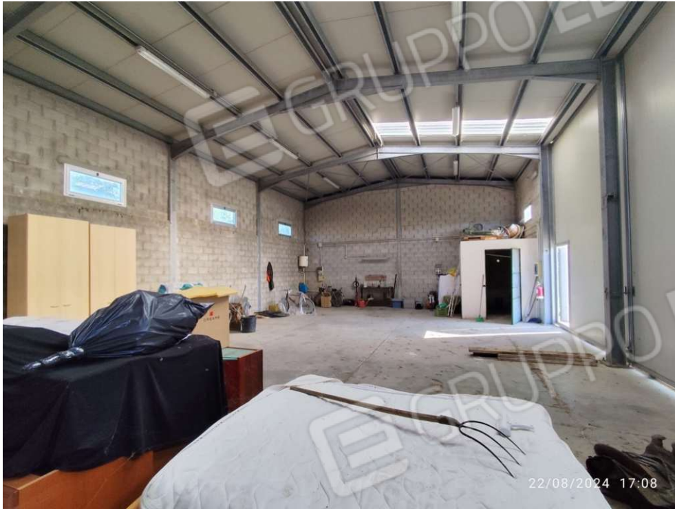
1.2 – vista 1