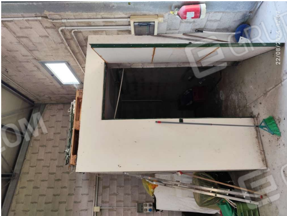
1.5 – deposito - vista 1