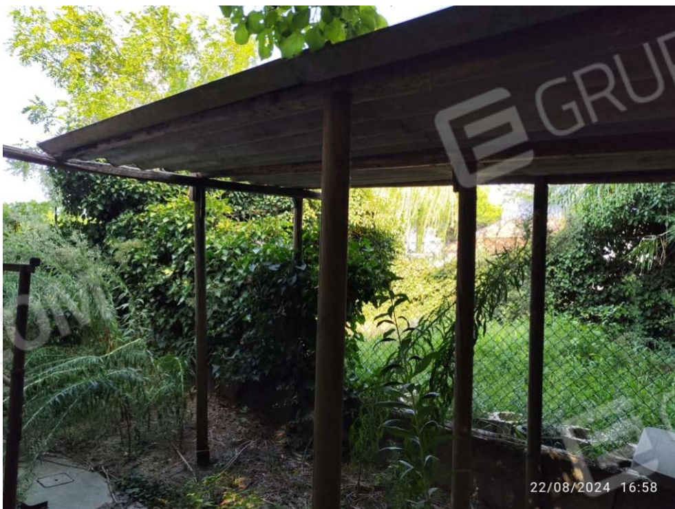
2.6 - tettoia - vista 2