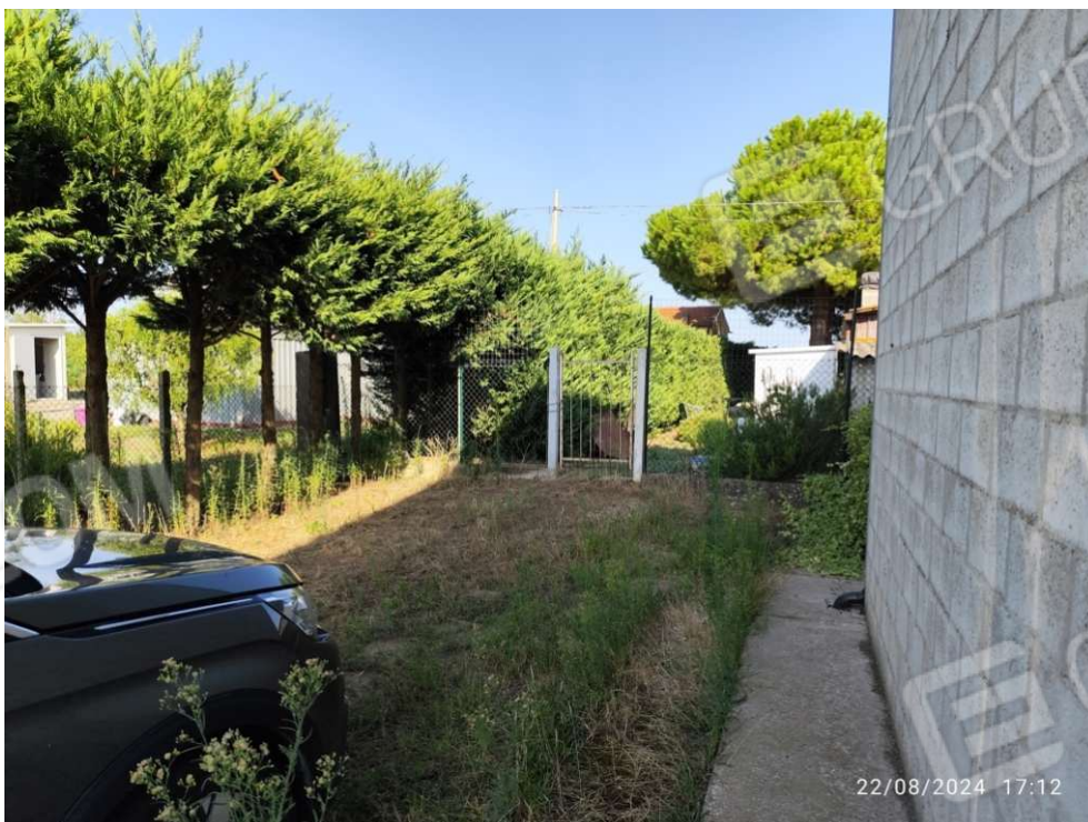
0.12 – area a nord del ricovero attrezzi