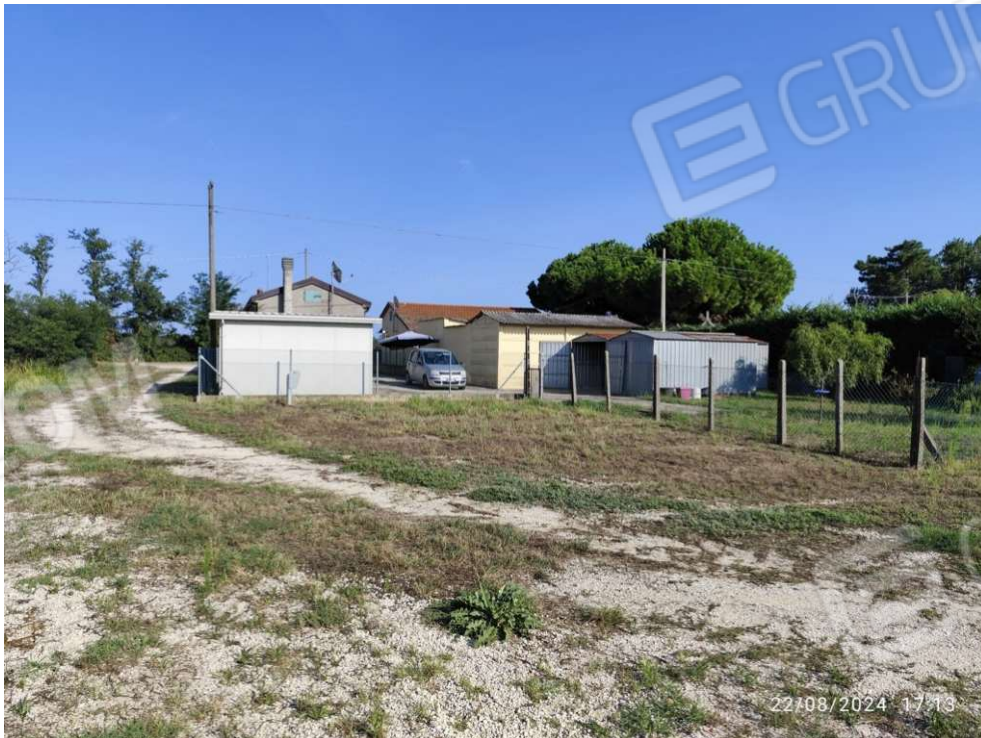
0.2 – area lato est