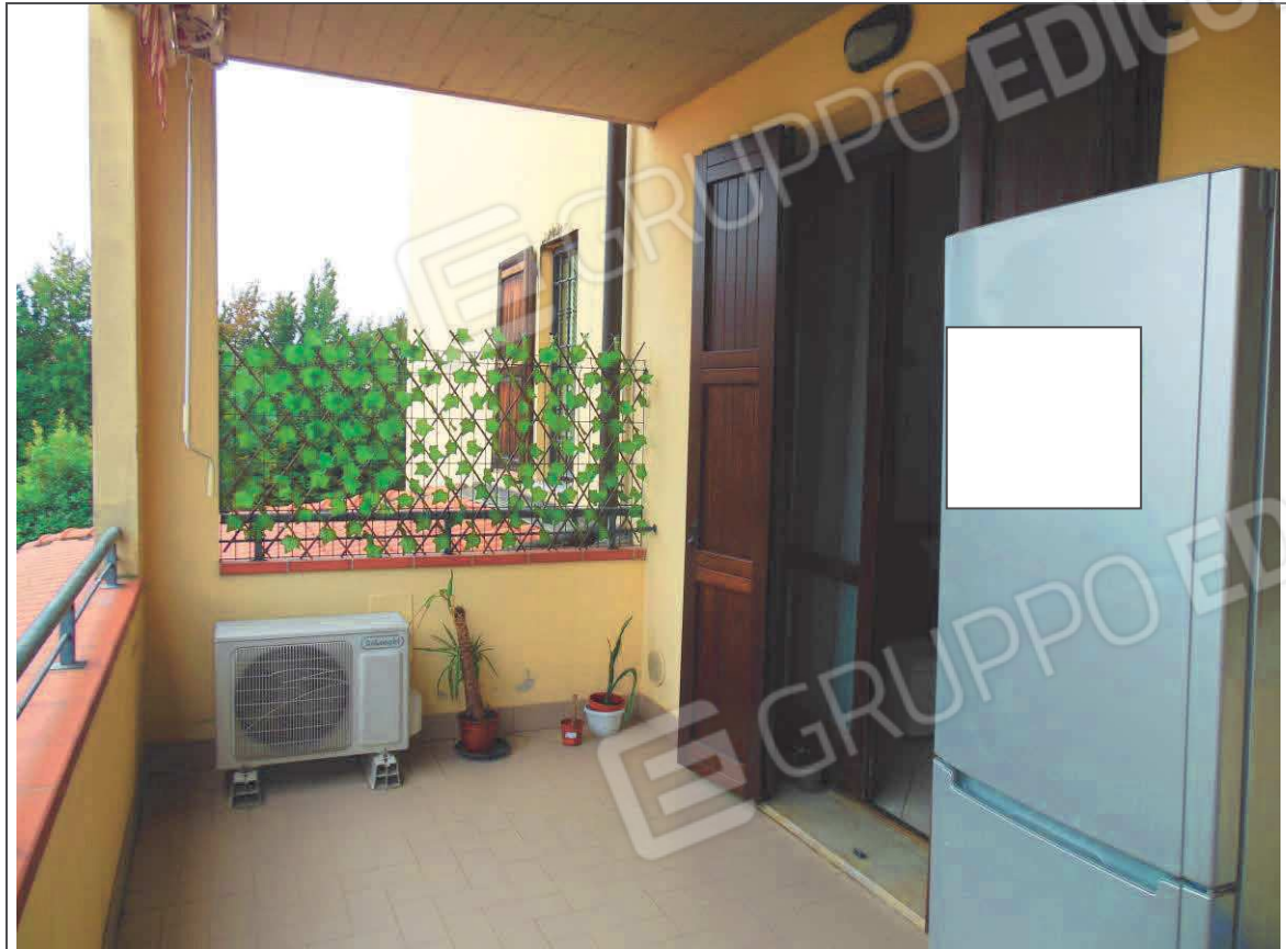
INTERNO APPARTAMENTO (LOGGIA SU SOGGIORNO)