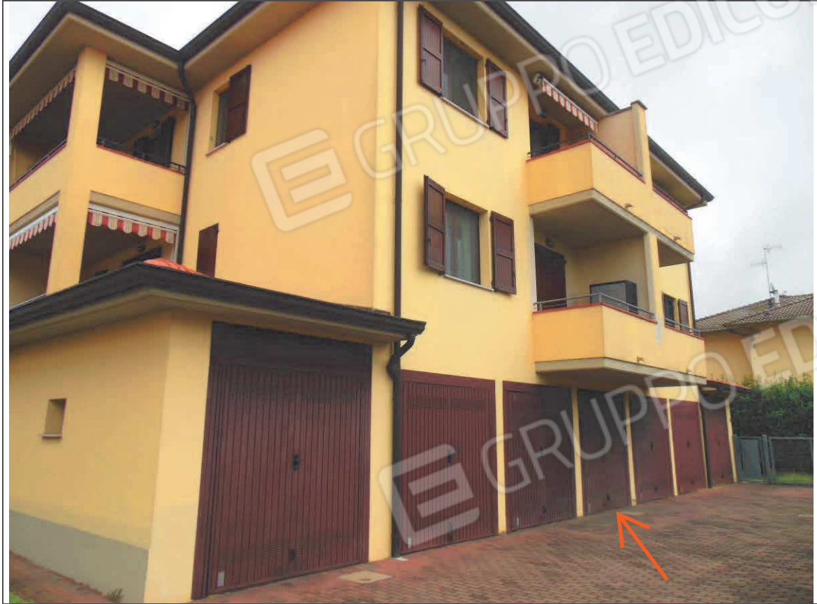
PROSPETTO SUD FABBRICATO - GARAGE