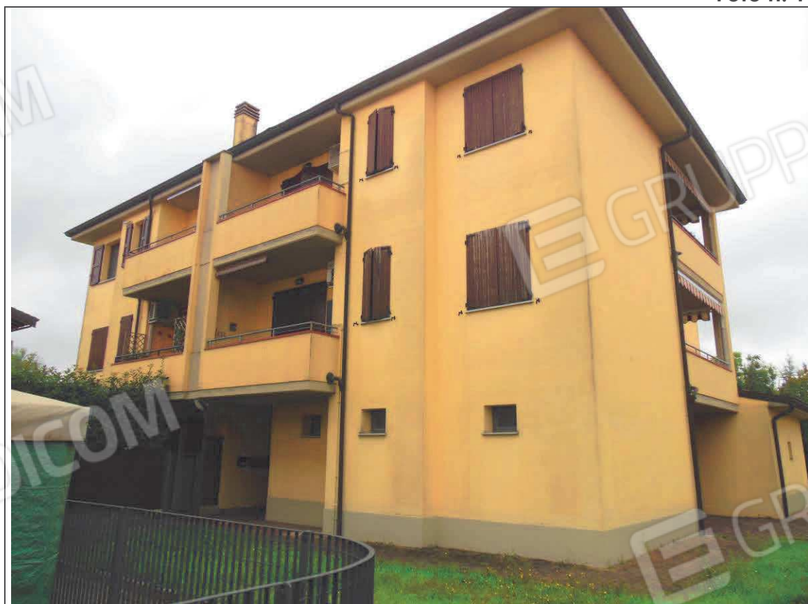
PROSPETTO GENERALE DEL FABBRICATO CONDOMINIALE - FRONTE DI INGRESSO