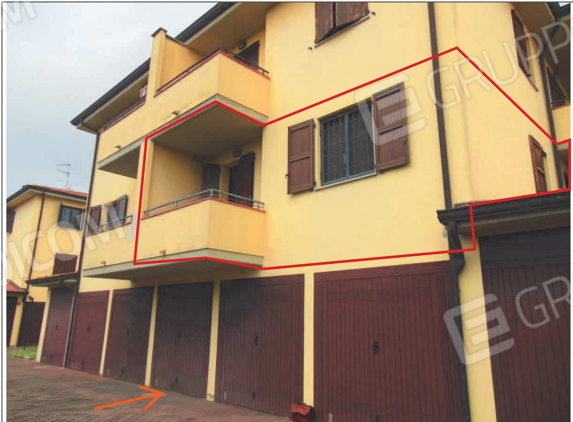
PROSPETTO SUD FABBRICATO – APPARTAMENTO AL P. 1 E GARAGE