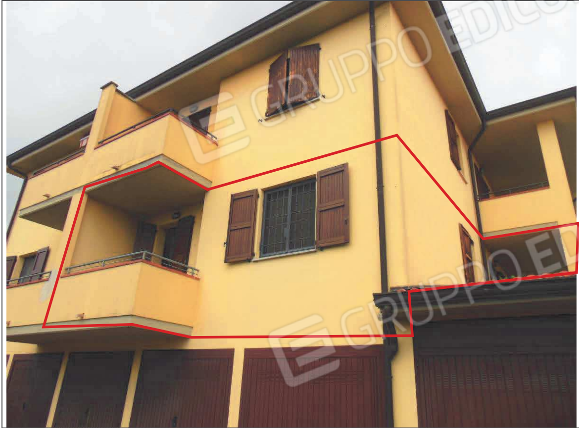
PROSPETTO SUD FABBRICATO – APPARTAMENTO AL P. 1