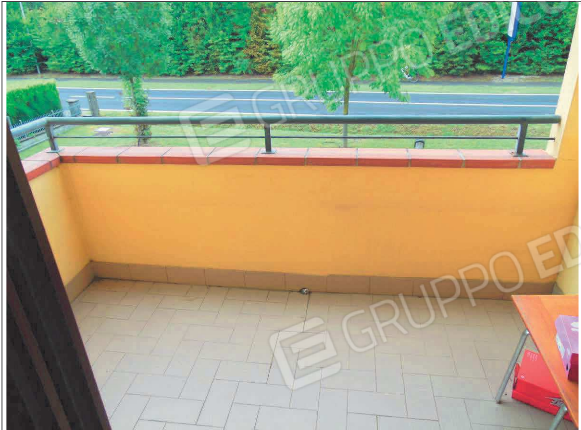
INTERNO APPARTAMENTO (LOGGIA SU CAMERA DA LETTO)