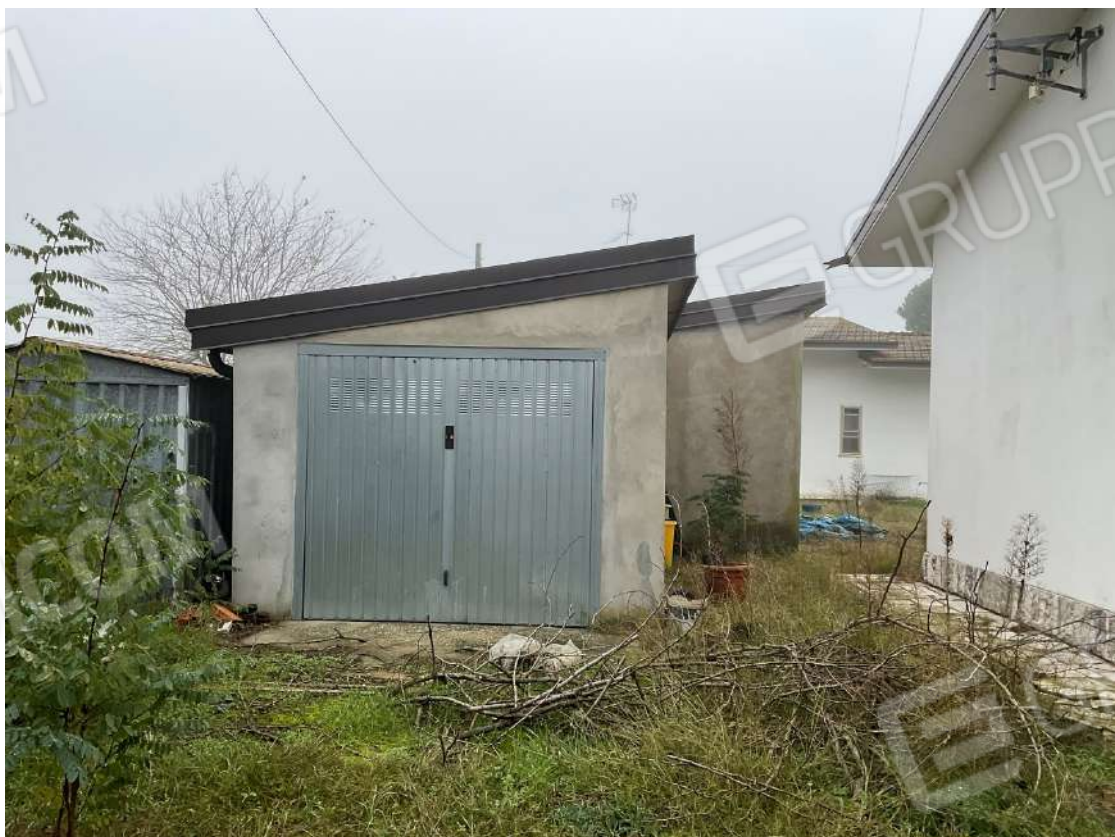
AUTORIMESSA SUB 8 PRIVA DI TITOLO EDILIZIO