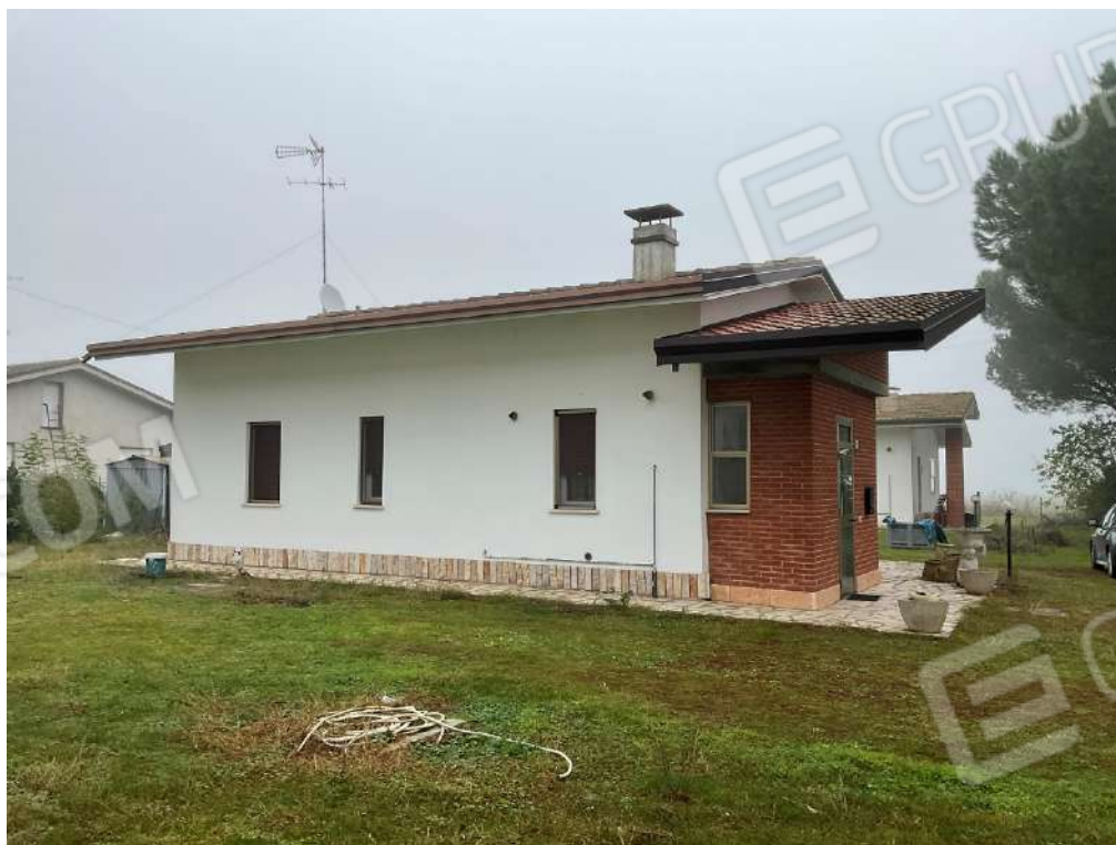
PROSPETTO LATO OVEST