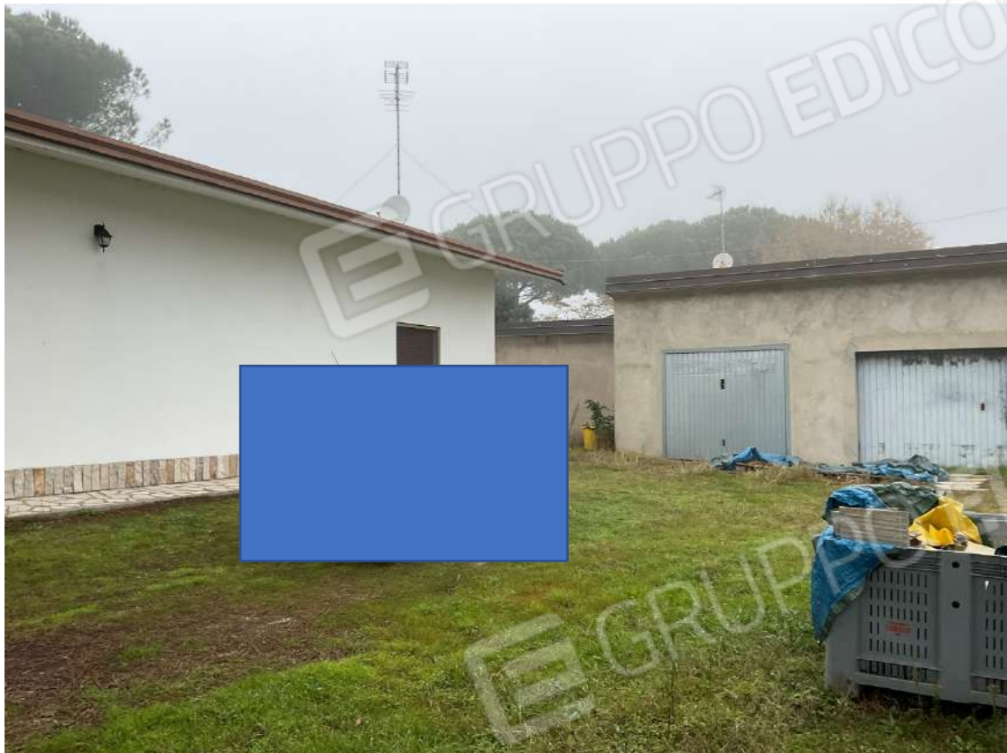
PROSPETTO LATO EST CON CORTE E AUTORIMESSA SUB 7