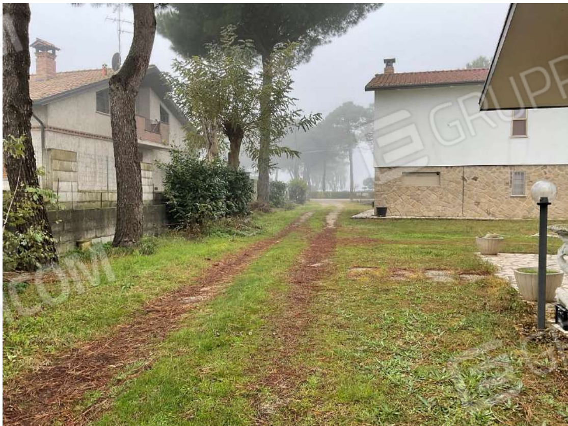
ACCESSO DALL VIA PROVINCIALE BOSCHETTO SUL MAPP 449