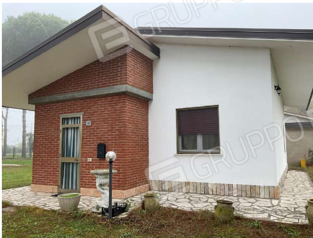
ROSPETTO FRONTE ABITAZIONE