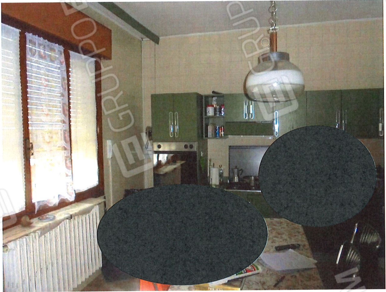
Foto 13. Abitazione. Particolare degli interni.