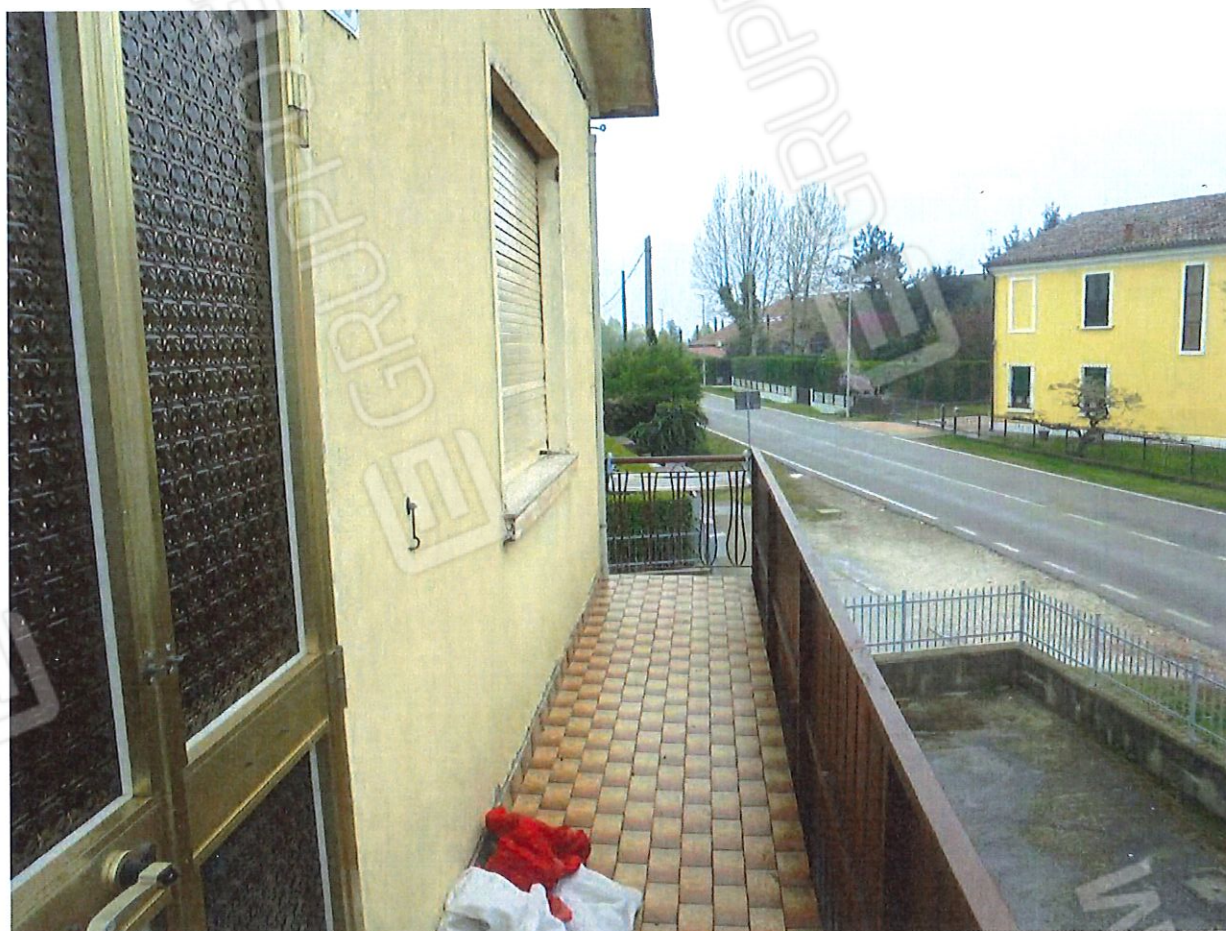
Foto 9. Abitazione. Particolare della terrazza