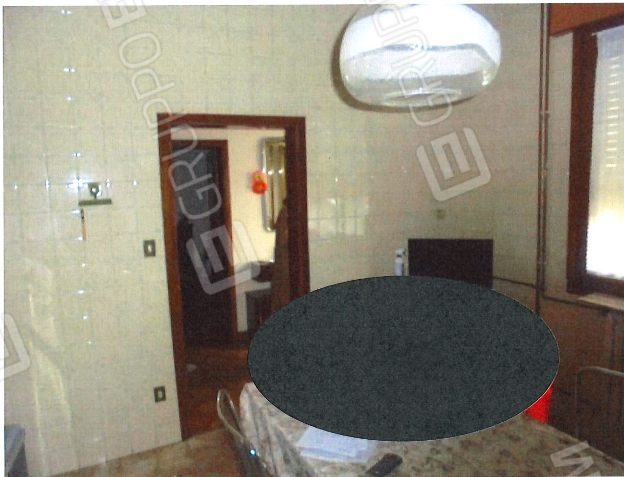
Foto 14. Abitazione. Particolare degli interni.