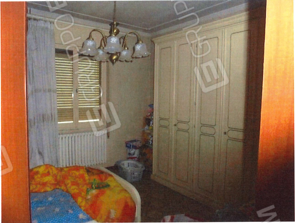
Foto 15. Abitazione. Particolare degli interni.