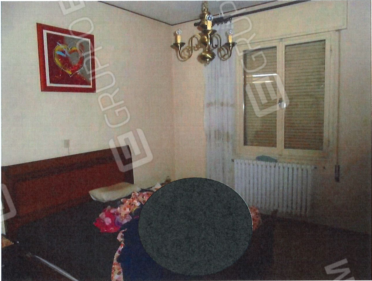
Foto 17. Abitazione. Particolare degli interni.