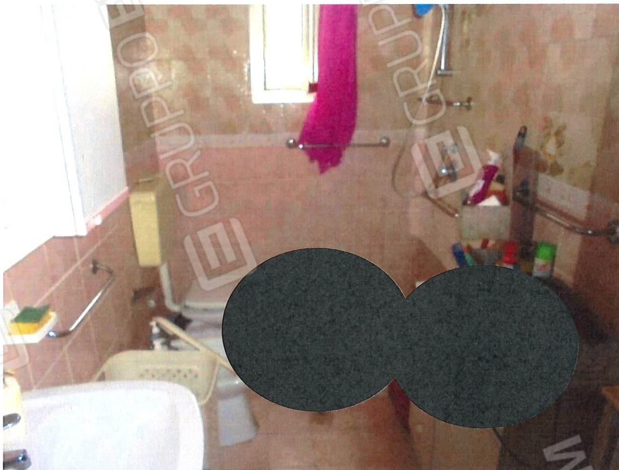
Foto 18. Abitazione. Particolare degli interni.