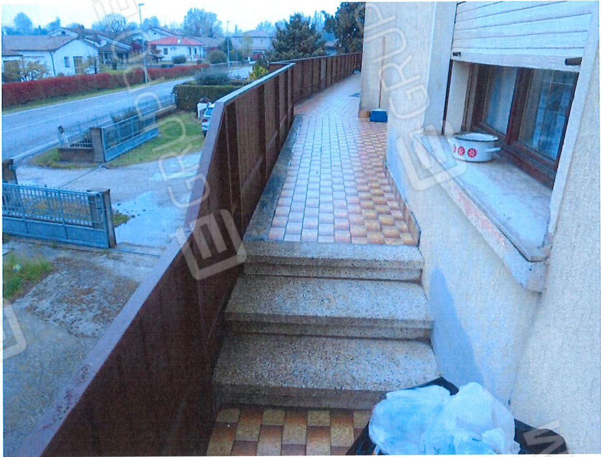
Foto 8. Abitazione. Particolare della terrazza