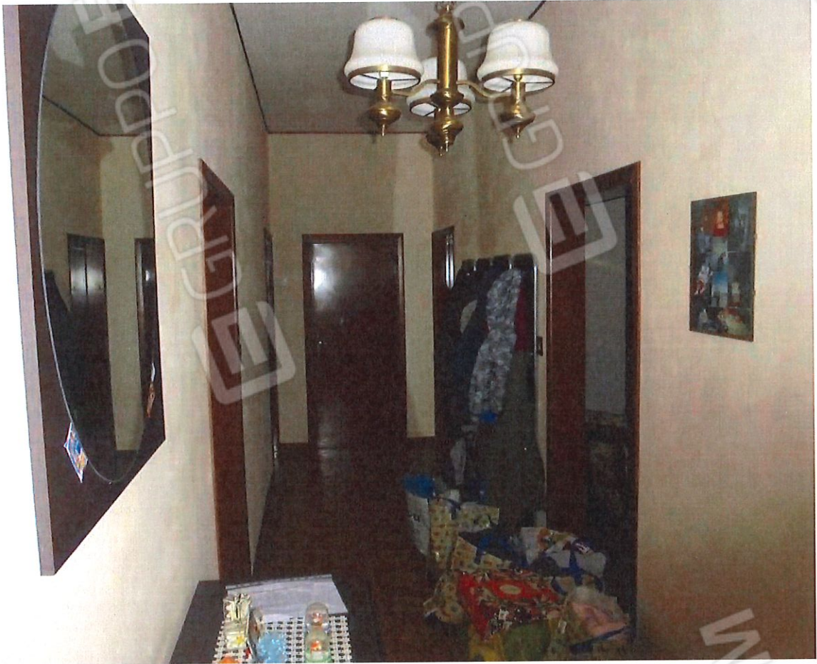
Foto 12. Abitazione. Particolare degli interni.