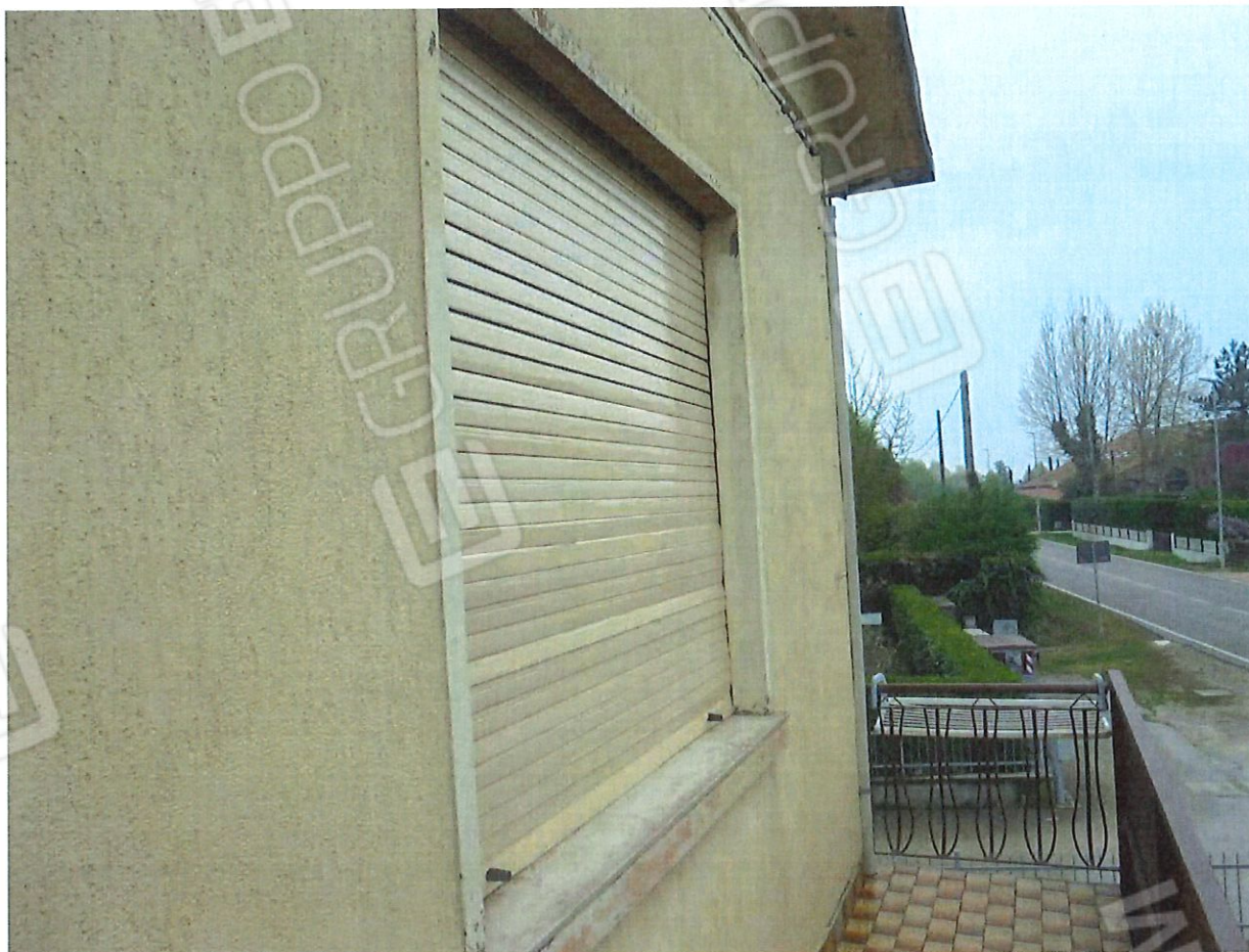
Foto 10. Abitazione. Particolare della terrazza