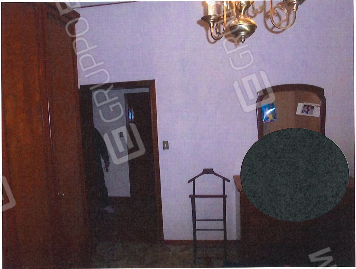
Foto 16. Abitazione. Particolare degli interni.