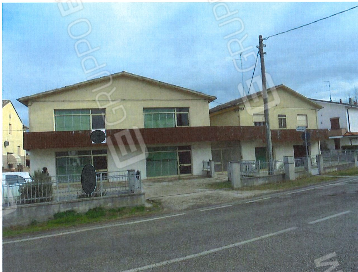
Foto 1. Ingresso. Vista da Via Provinciale.