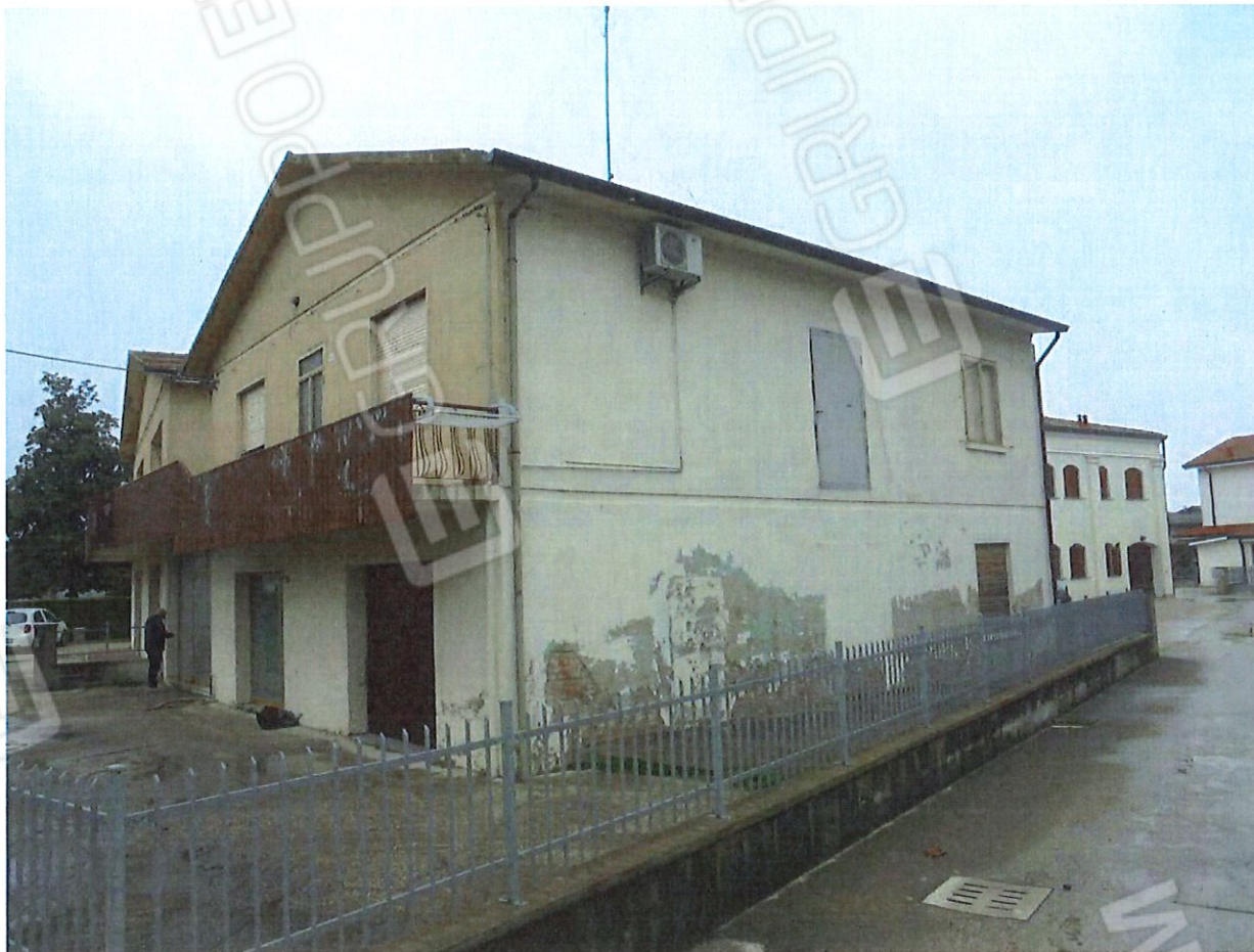
Foto 4. Prospetto Sud.