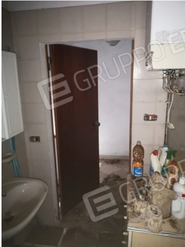
BAGNO P1 RETRO