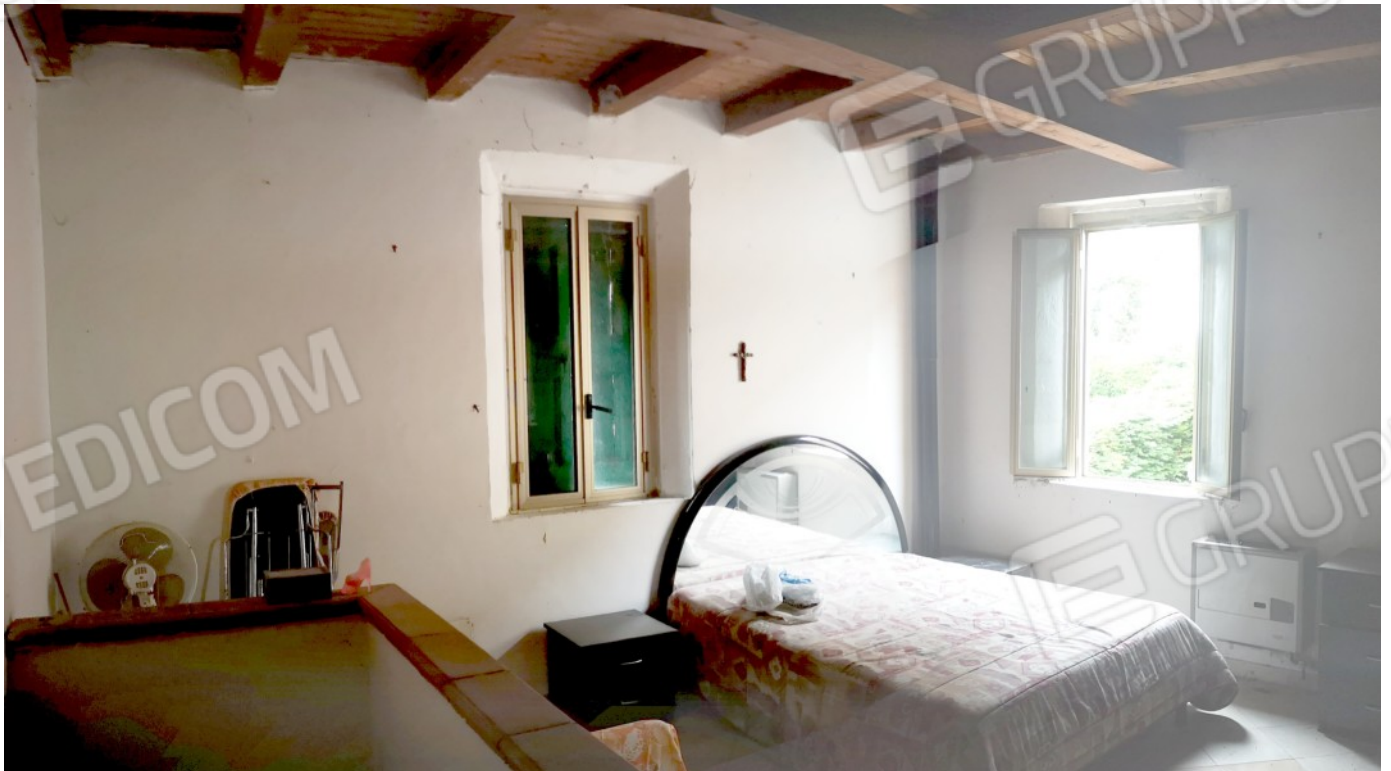
P1 - FRONTE