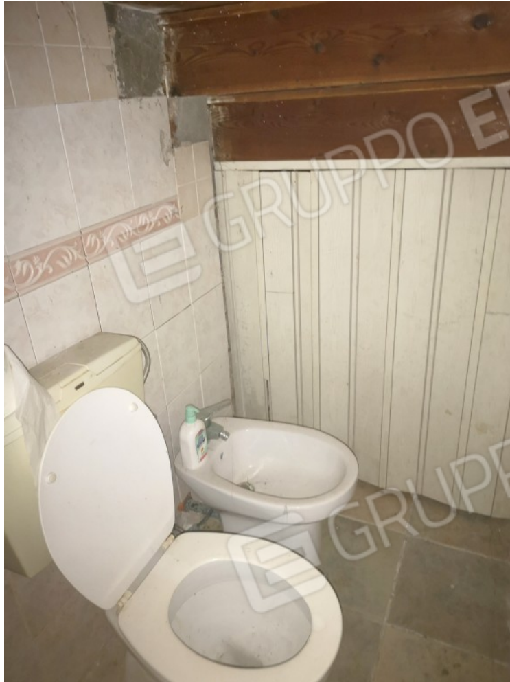
BAGNO PT FRONTE