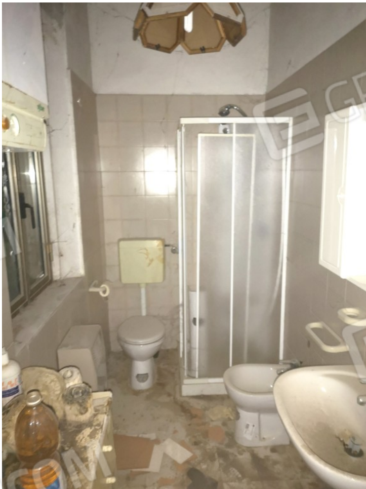
BAGNO P1 RETRO