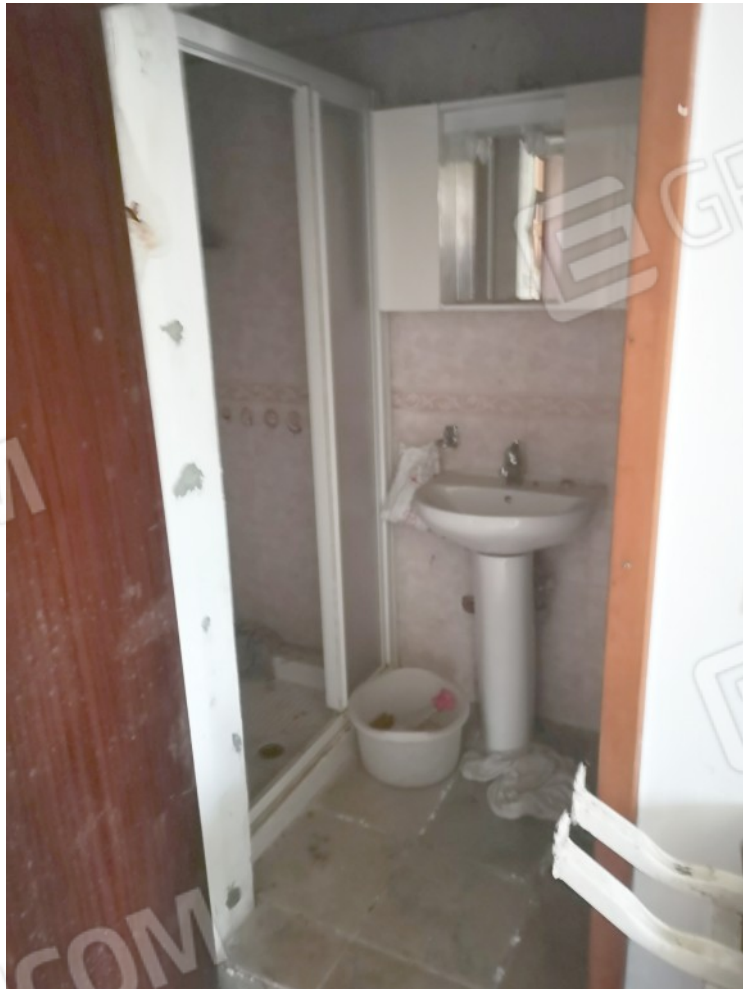
BAGNO PT FRONTE