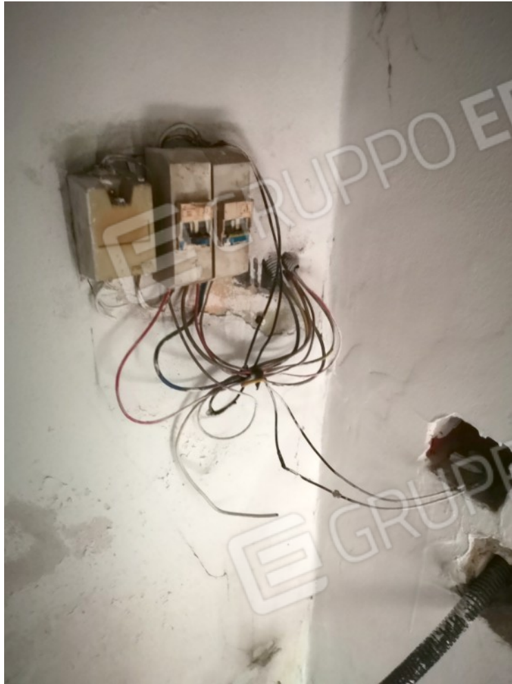
IMPIANTO - FRONTE