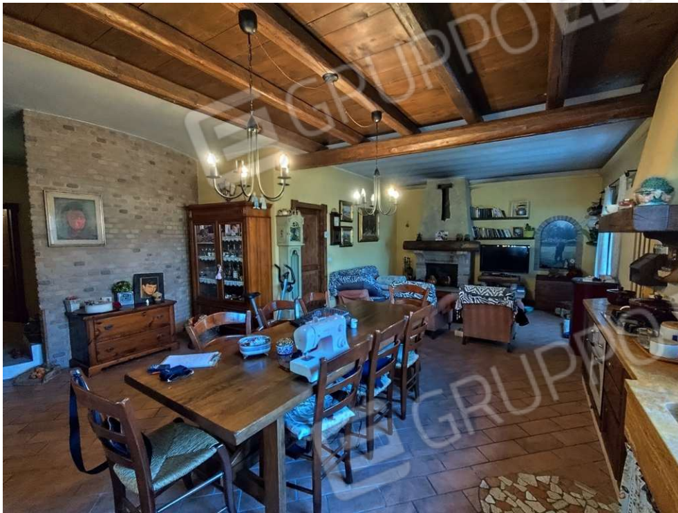
1.4 - zona giorno – vista 2