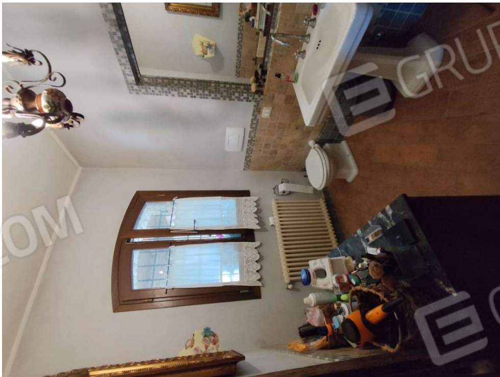
1.7 - bagno - vista 1