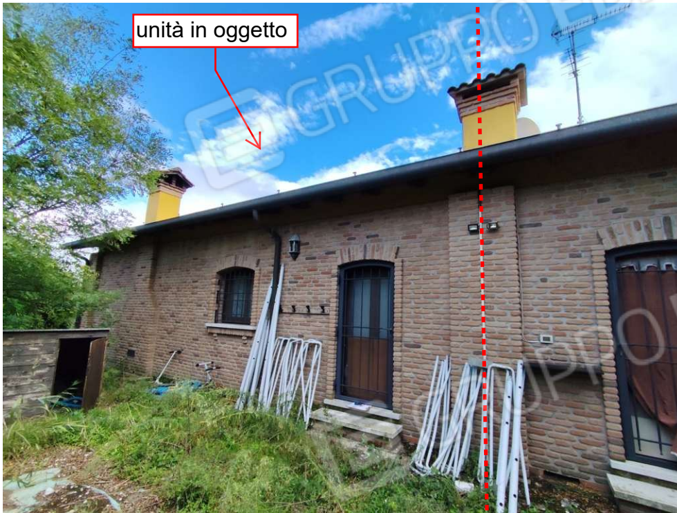
0.7 - lato nord