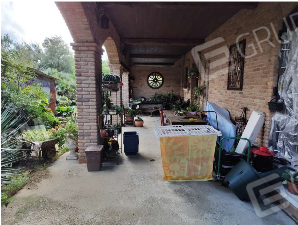
0.4 – portico lato sud