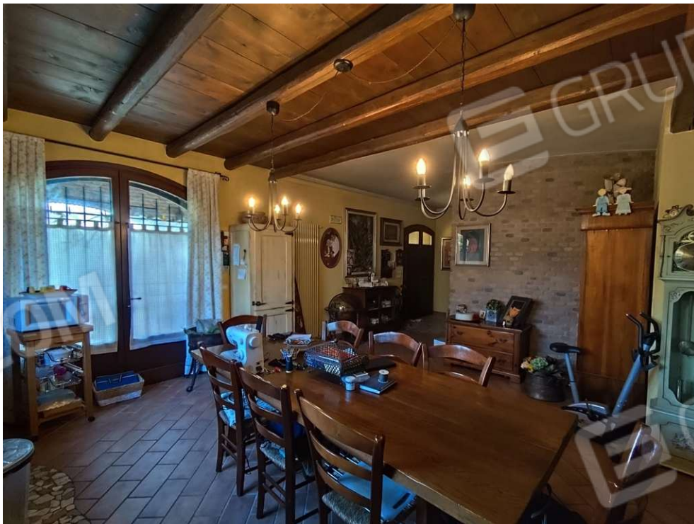
1.3 – zona giorno – vista 1