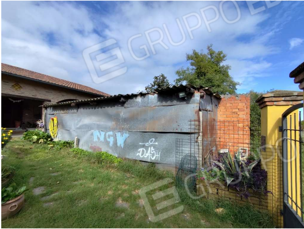
2.2 - vista da interno corte