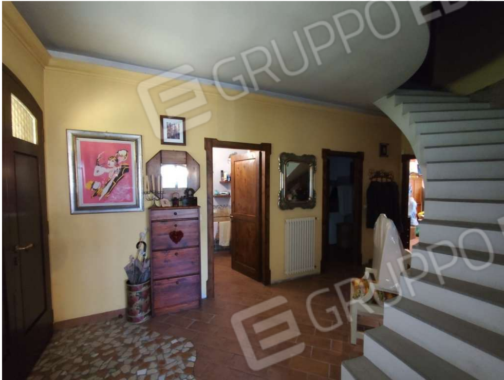
1.2 – zona giorno/ingresso – vista 2