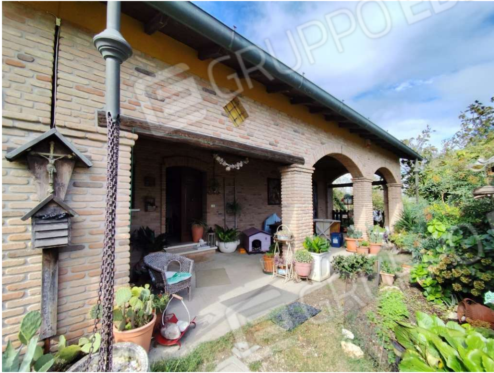
0.3 – lato sud