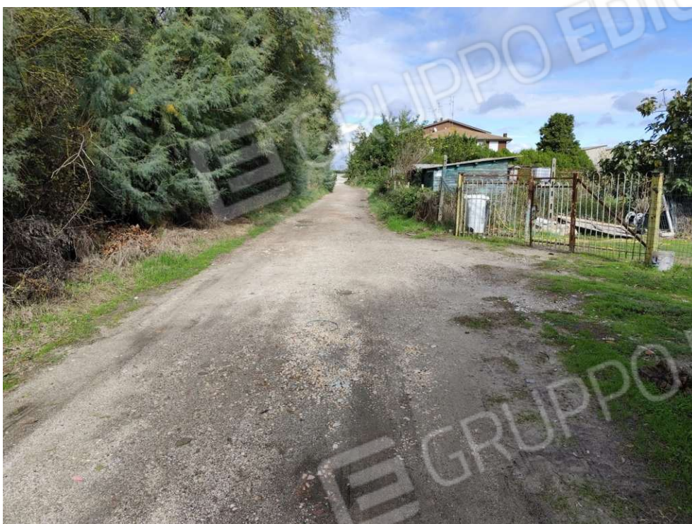
0.13 - strada di accesso