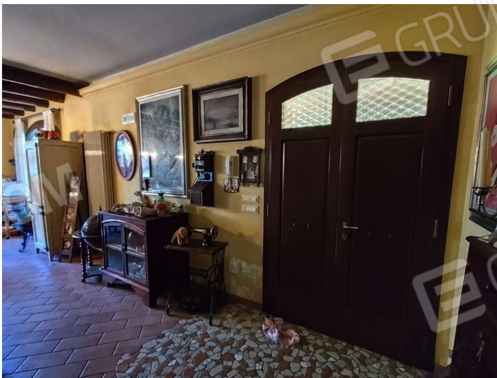
1.1 – zona giorno/ingresso – vista 1