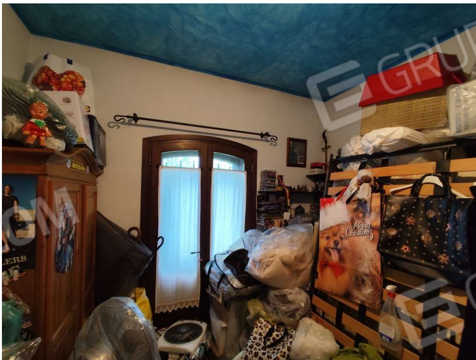
1.11 - letto - vista 1