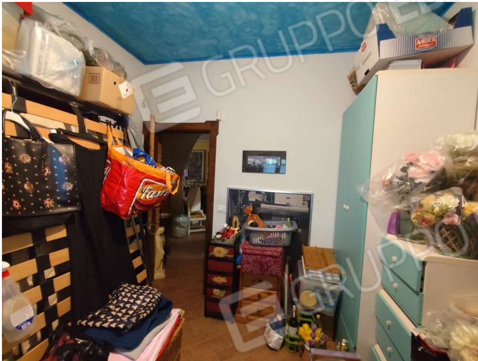
1.12 - letto - vista 2