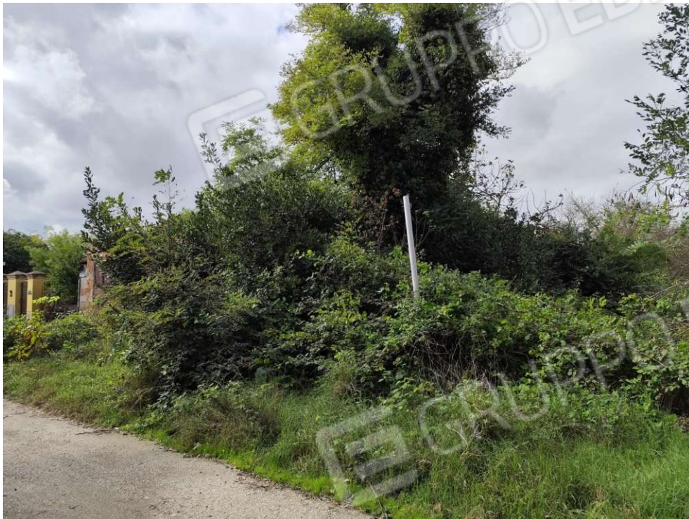
0.11 - confine lato est da esterno