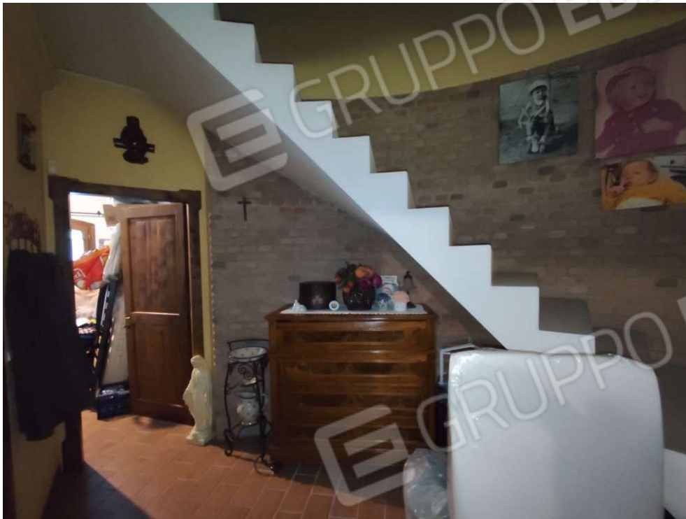
1.10 - zona giorno/ingresso – vista 3