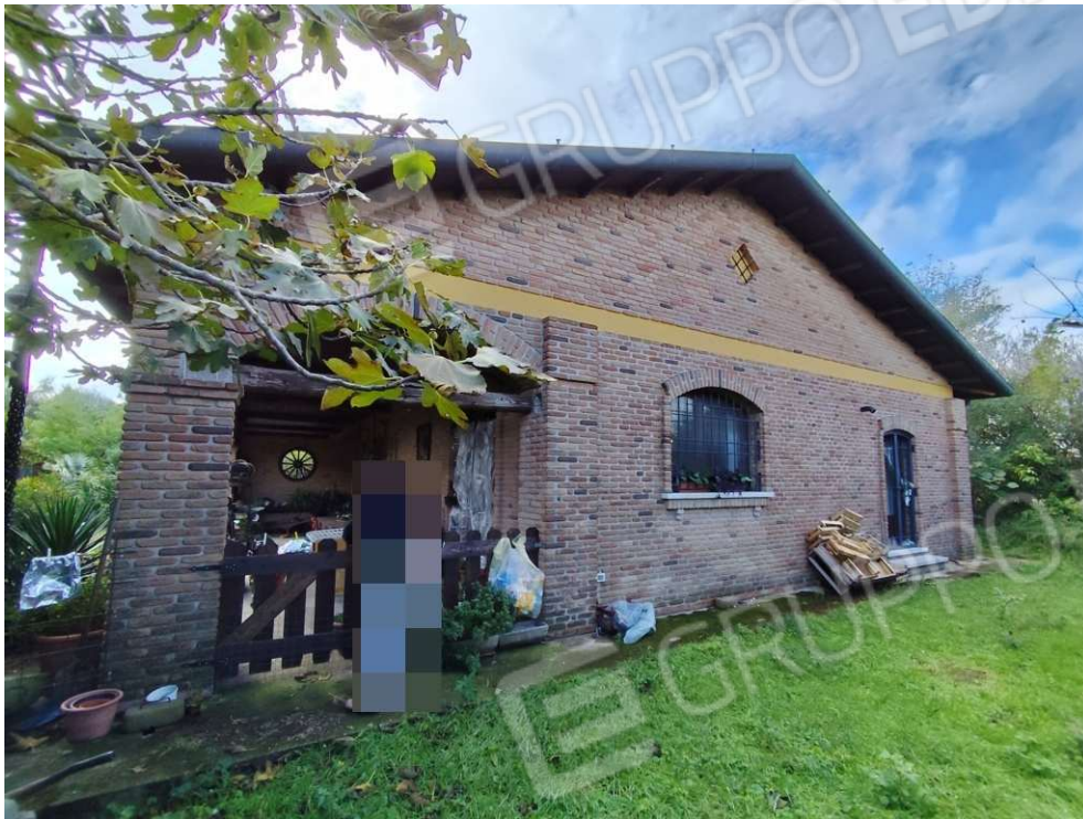
0.5 – lato est