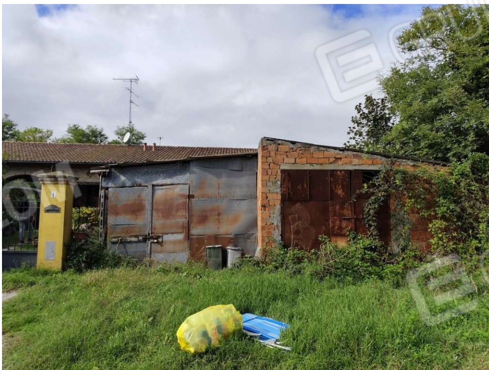
2.1 - vista da esterno proprietà