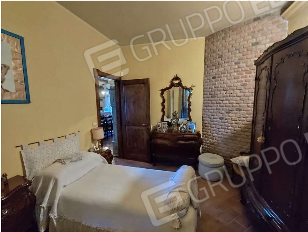
1.6 - studio - vista 2