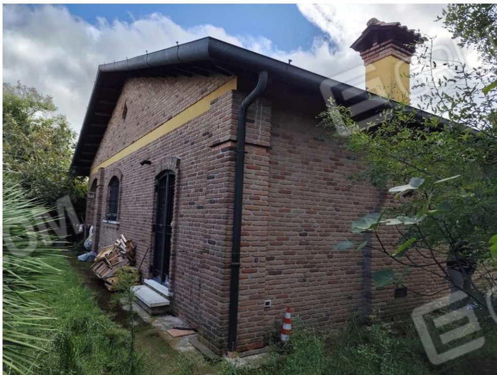
0.6 - lati est e nord