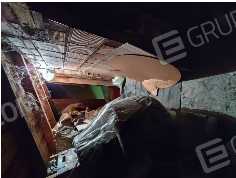
1.13 - sottotetto - vista 1