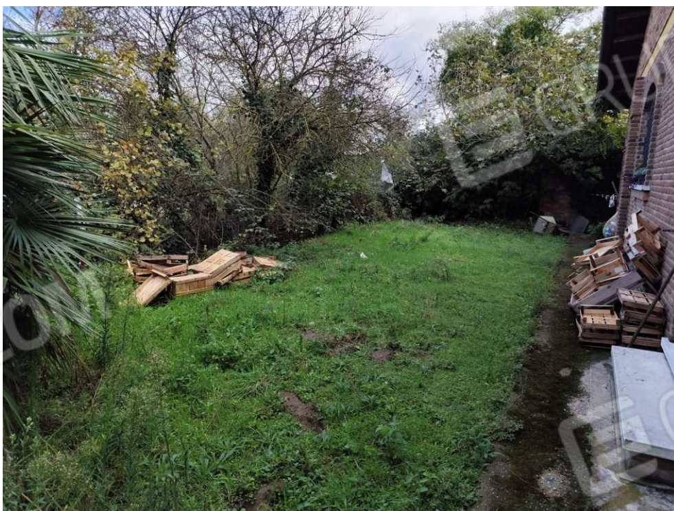
0.10 - confine lato est