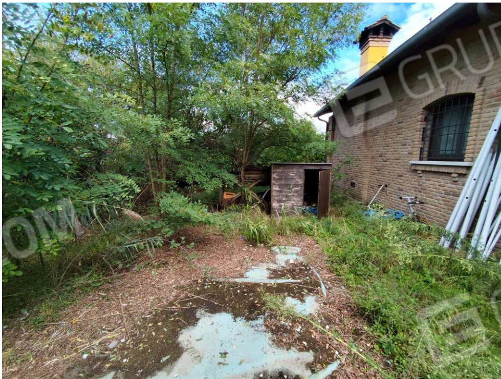
0.8 - corte lato nord