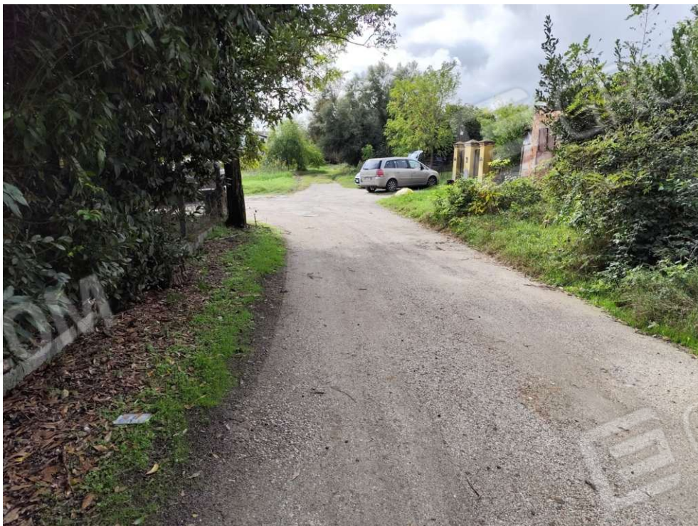
0.12 - strada di accesso