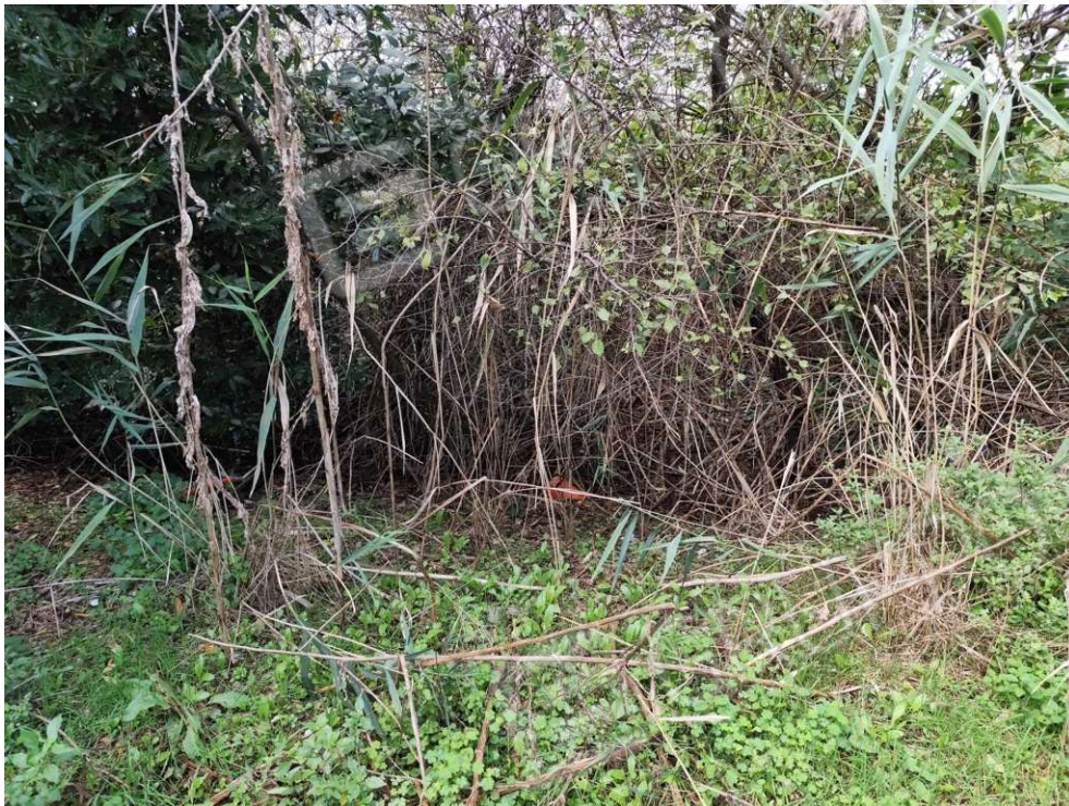
0.9 - confine lato nord