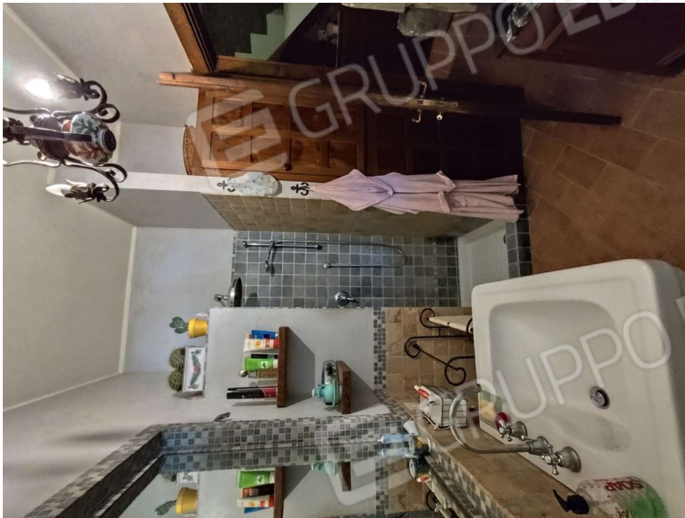
1.8 - bagno - vista 2