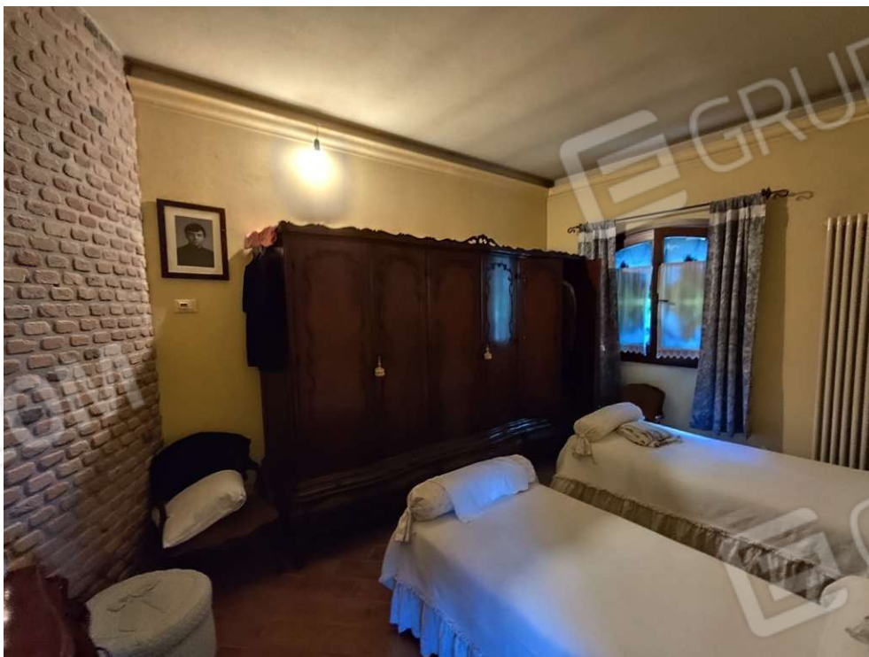
1.5 - studio - vista 1