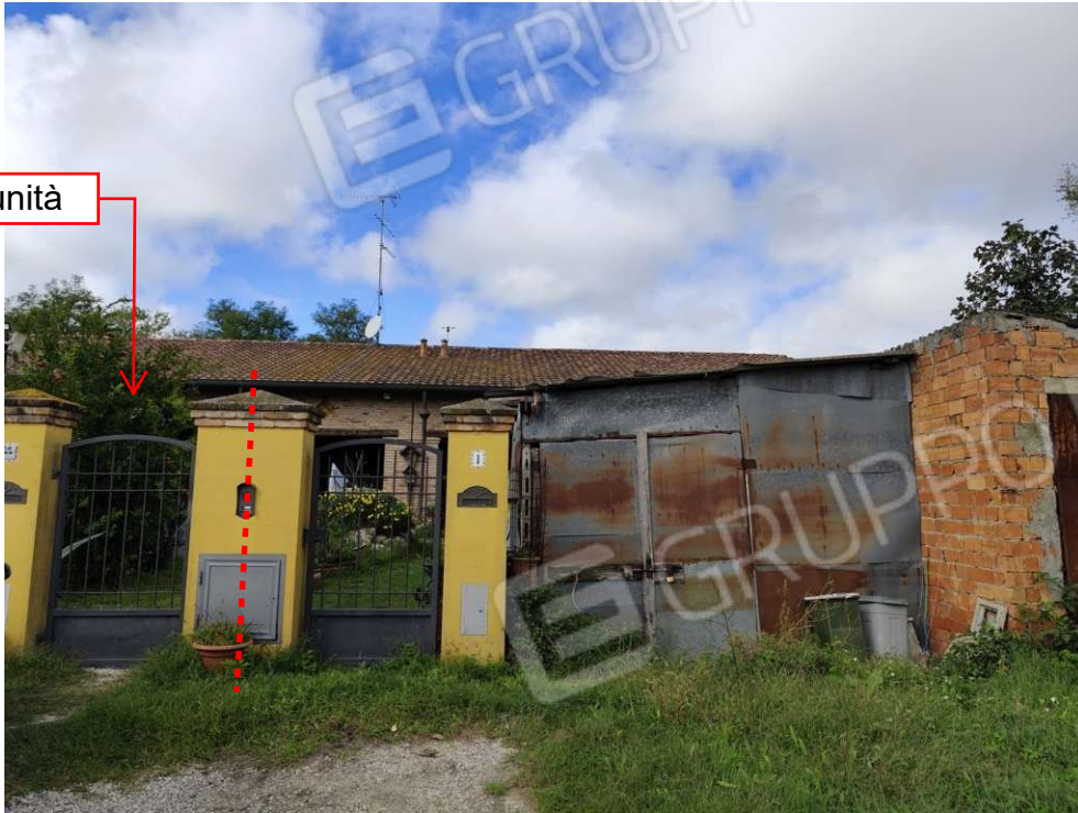
0.1 – vista da via Valle Raibosola