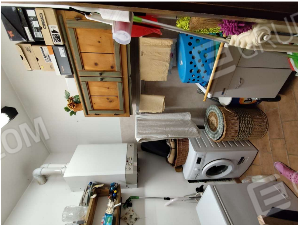
1.9 - ripostiglio - vista 1