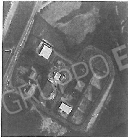
Ubicazione nel Comune / Identificazione degli immobili

Si tratta di un'area in parte a destinazione produttiva, in parte ubicata in zona di rispetto del paesaggio fluviale. La porzione edificabile è composta da 4 lotti già urbanizzati (corrispondenti a 4 mappali catastali). Trattandosi di lotti in linea, possono essere tra loro accorpati o venduti separatamente.