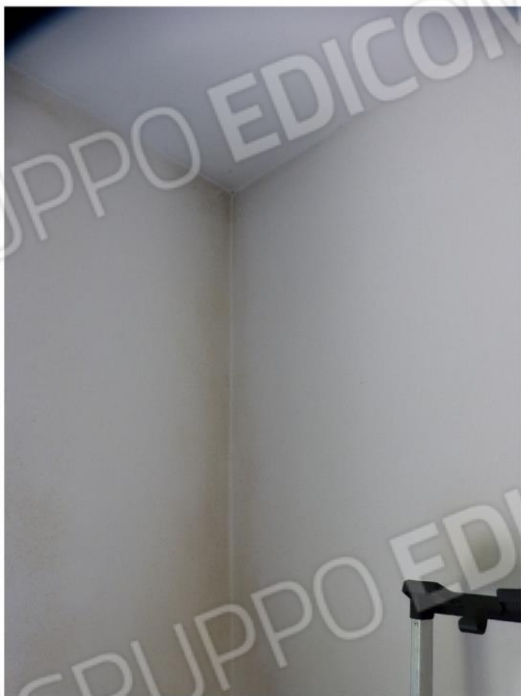
porzione di intonaco interessato da muffe/condense