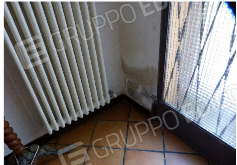
porzione di intonaco /muratura interessata da umidità di risalita