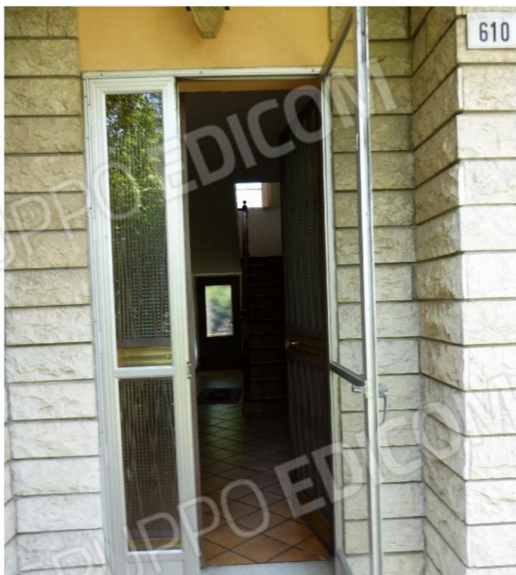
portoncino di ingresso