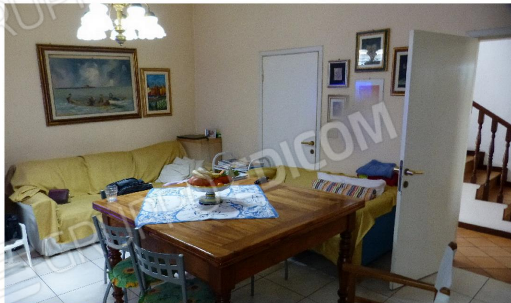
locali al piano terra