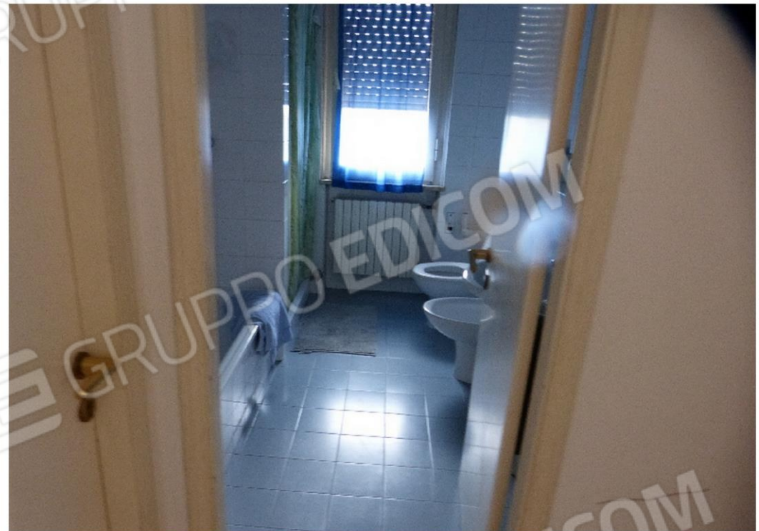
particolari finiture interne