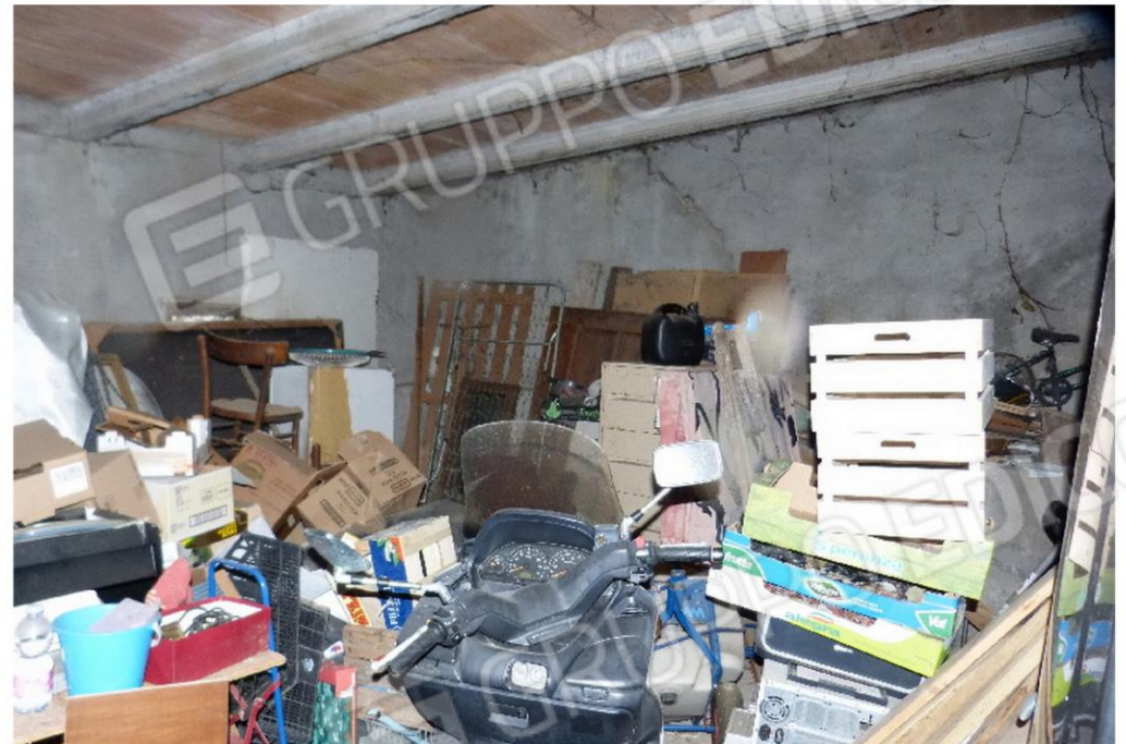
vista interna locale autorimessa