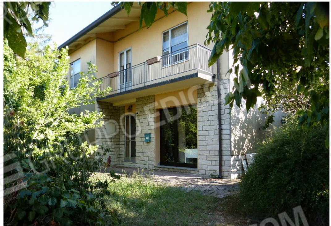
fronte verso via montanari