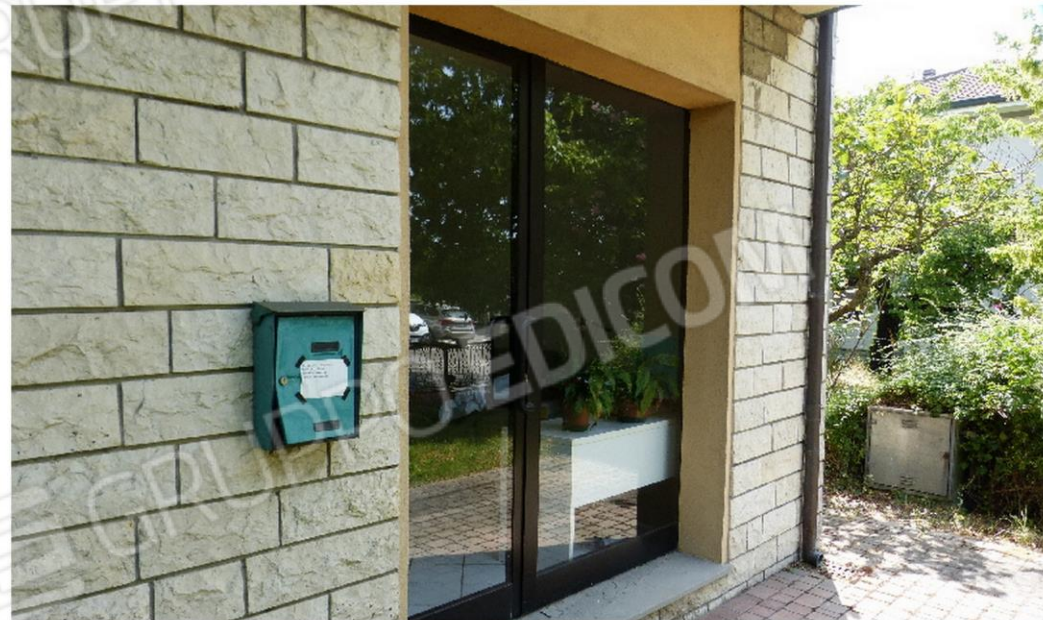
vista esterna - apertura vetrata