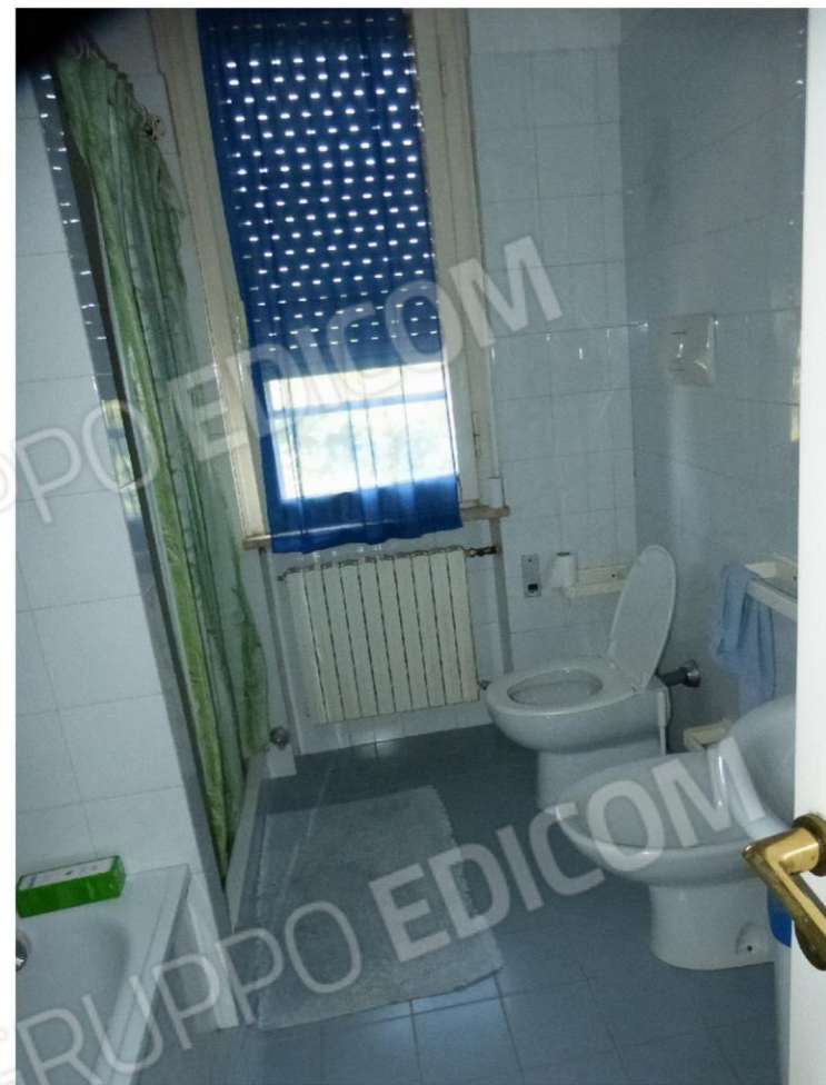
locali al piano 1°