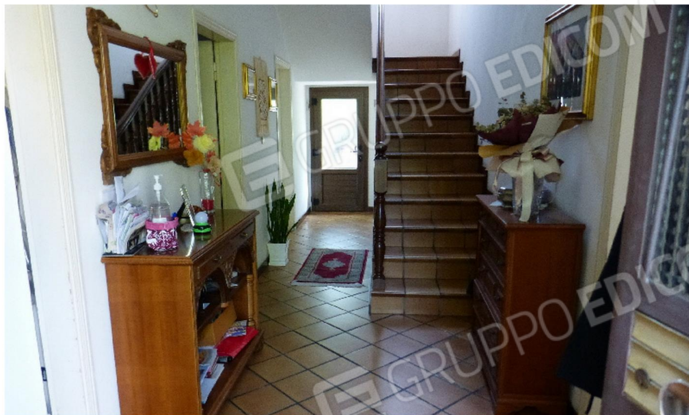
piano terra - ingresso disimpegno