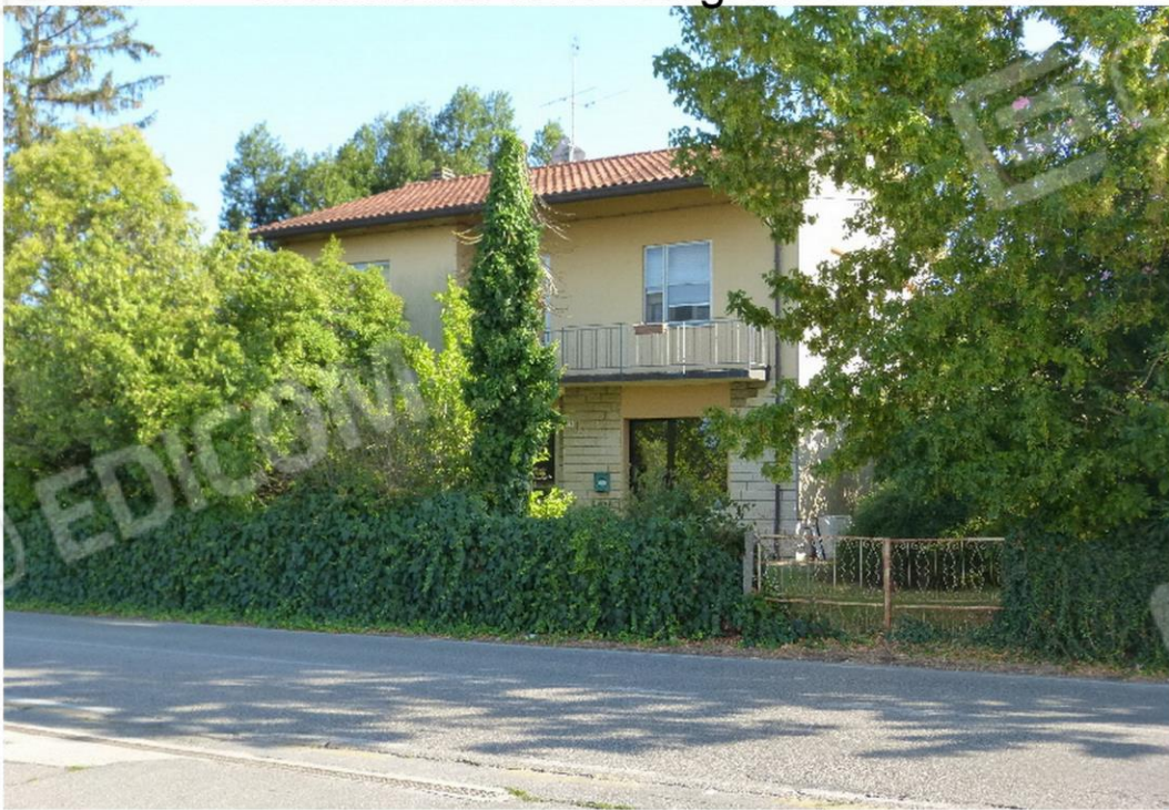
vista esterna da via montanari