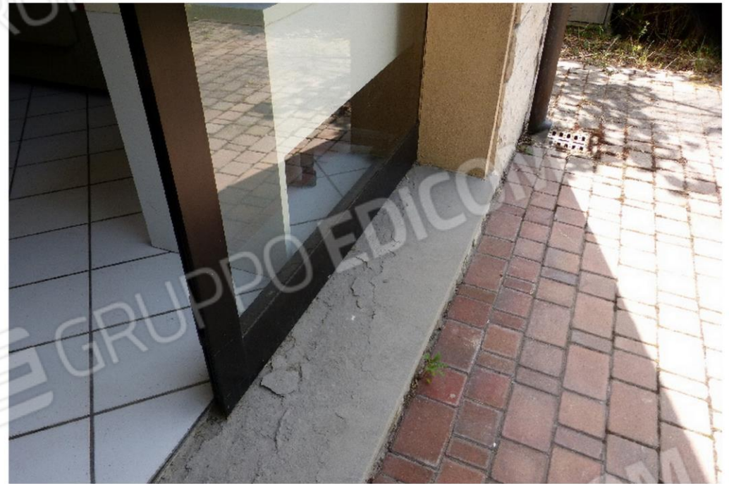
pavimentazione area esterna e marciapiedi