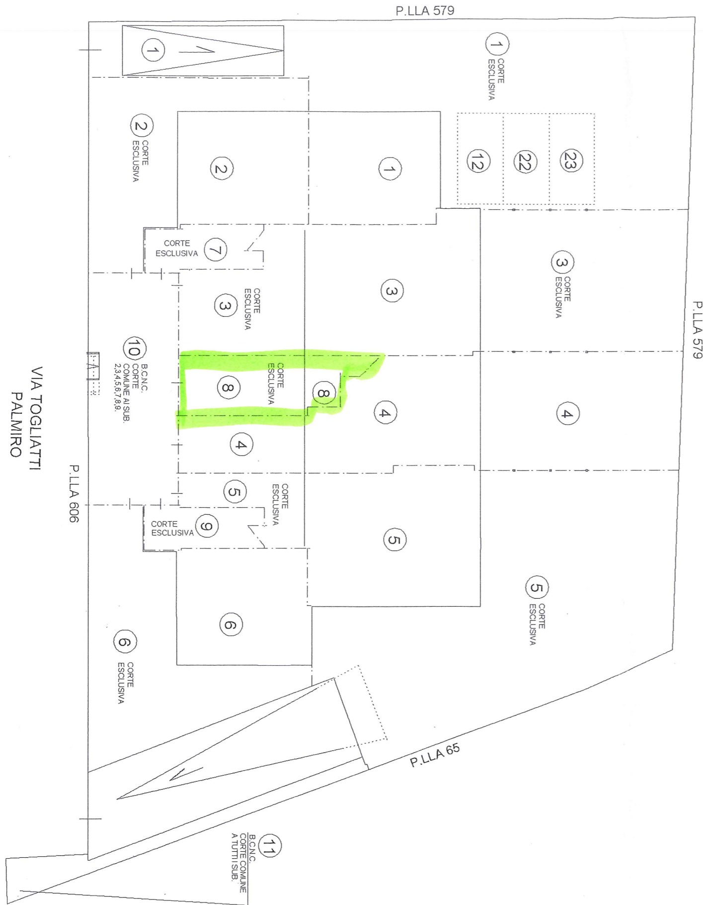
PIANO TERRA H = 2.70