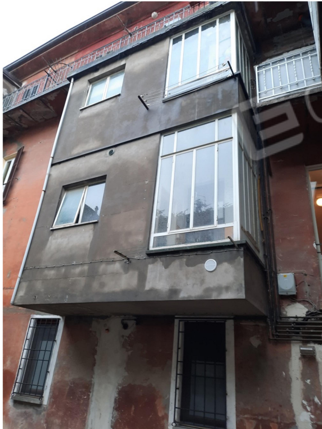
5 VISTA ESTERNA SU CORTE COMUNE E RETRO PROSPETTO