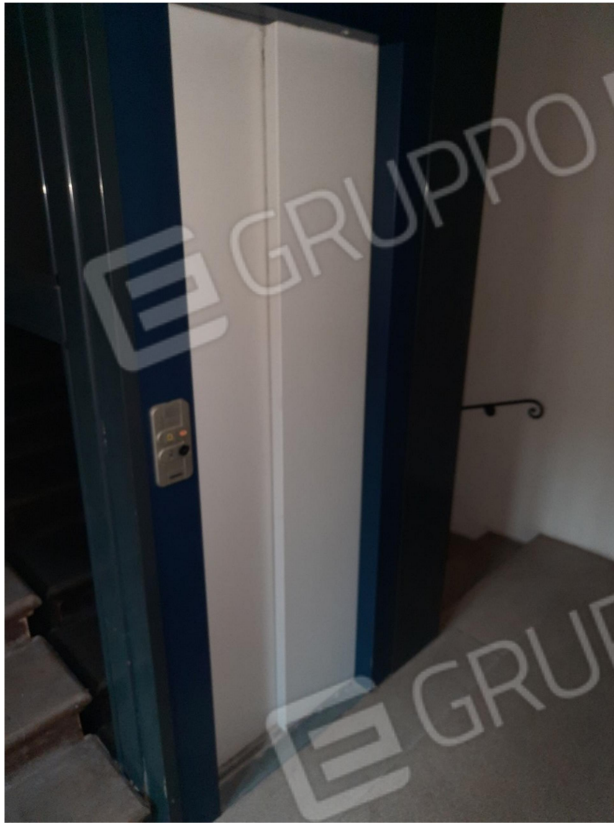
8 – ASCENSORE E VANO SCALA COMUNE (per l'interno 3)