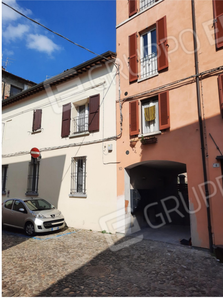
2 - VISTA ESTERNA Via Merlini, 10