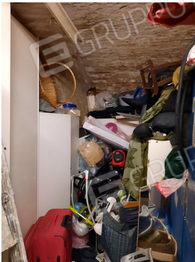
10 – CANTINA