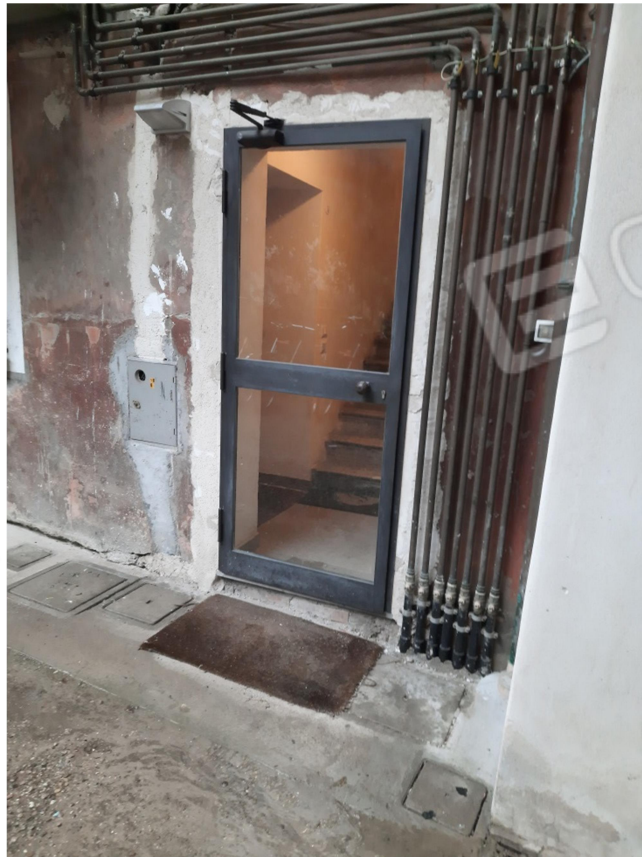
7- VISTA ACCESSO A SCALE COMUNI DAL CORTILE (per l'interno 4)