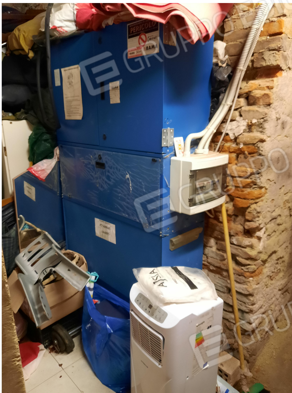
12 – CANTINA – DETTAGLIO DELLE MACCHINE ASCENSORE CONDOMINIALE (POSTE IN PROPRIETA' PRIVATA)