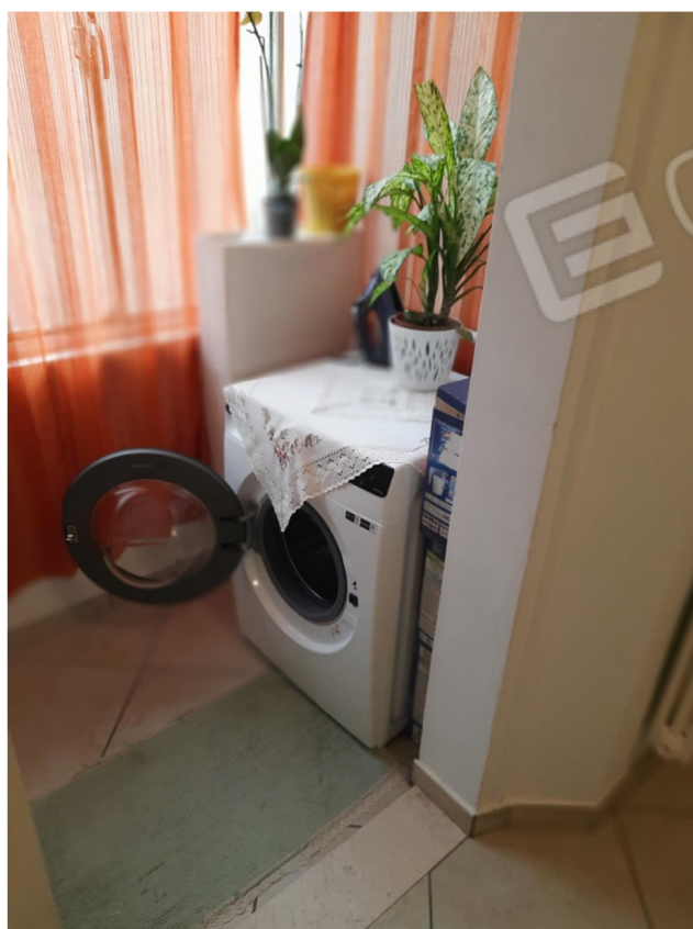
11 – PIANO SECONDO - ANTIBAGNO DA INGRESSO 3