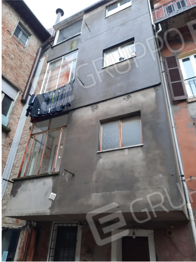
4 – VISTA ESTERNA SU CORTE COMUNE E RETRO PROSPETTO