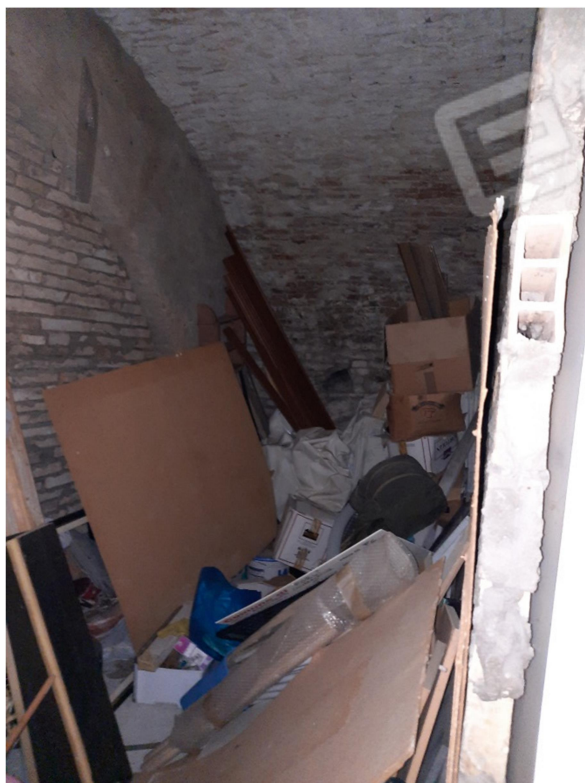
11 – CANTINA