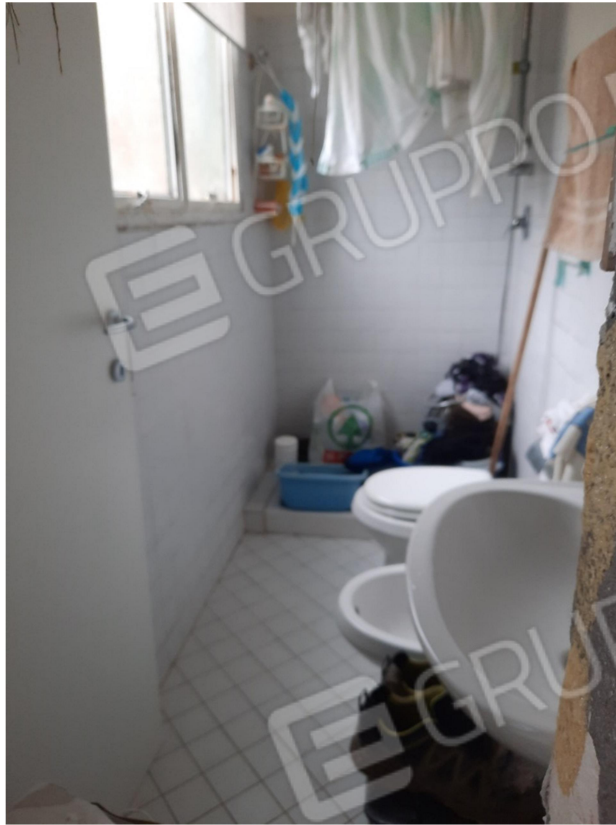
14 – PIANO SECONDO - BAGNO DA INGRESSO 4