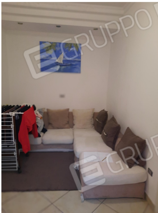
10 – PIANO SECONDO - SOGGIORNO (CUCINA) DA INGRESSO 3

Foglio 178 Particella 138 Subalterno 106 (APPARTAMENTO INTERNI 3 E 4)