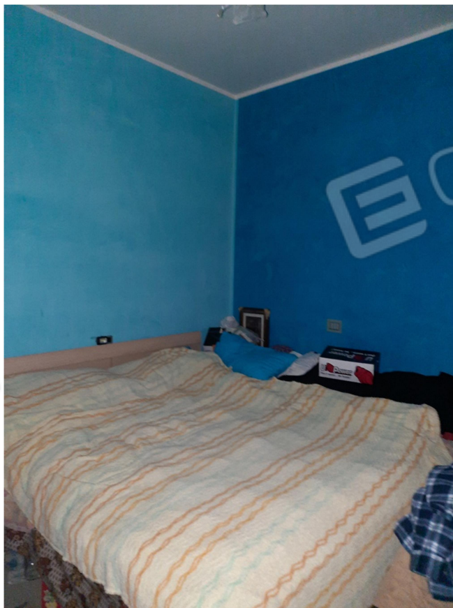
15 – PIANO SECONDO - CAMERA DA INGRESSO 4