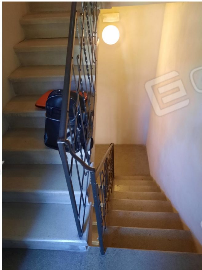
9 – VANO SCALA COMUNE (per l'interno 4)