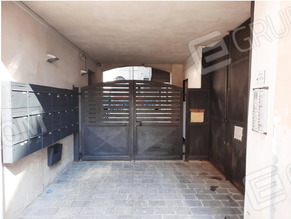
3 - VISTA ESTERNA ingresso da via Merlini, 10