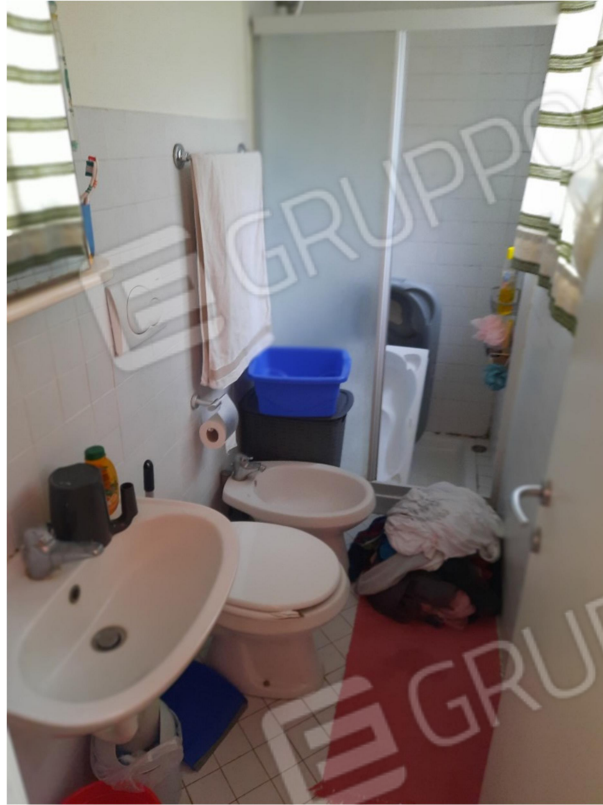
12 – PIANO SECONDO - BAGNO DA INGRESSO 3