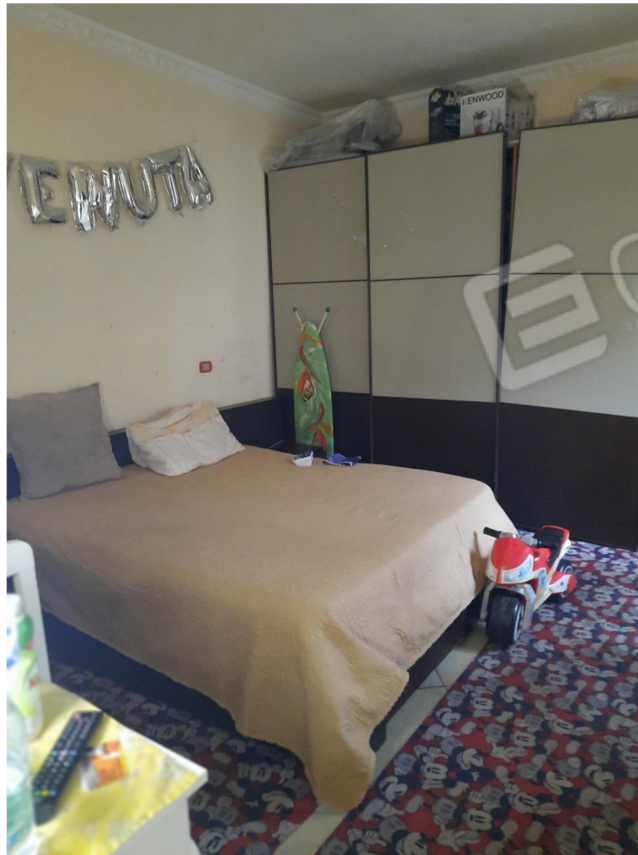
13 – PIANO SECONDO - 1 CAMERA