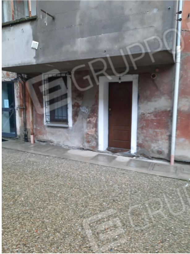
6- VISTA ACCESSO A SCALE COMUNI DAL CORTILE (per l'interno 3)