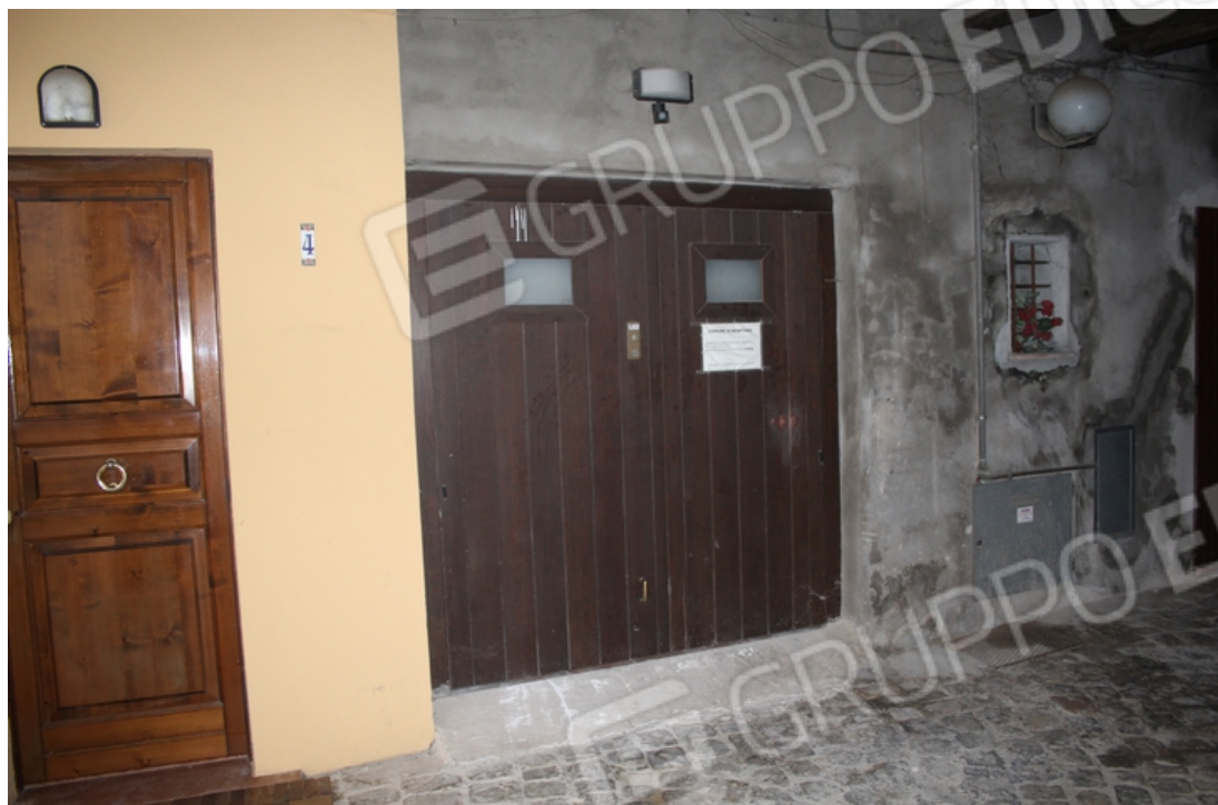
vano scale comune