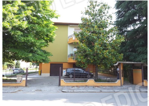
Vista ingresso del fabbricato condominiale che ospita le porzioni immobiliari oggetto di esecuzione