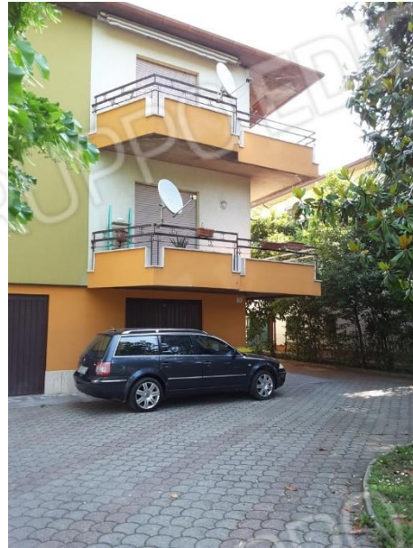
Vista esterna del fabbricato condominiale che ospita le porzioni immobiliari oggetto di esecuzione