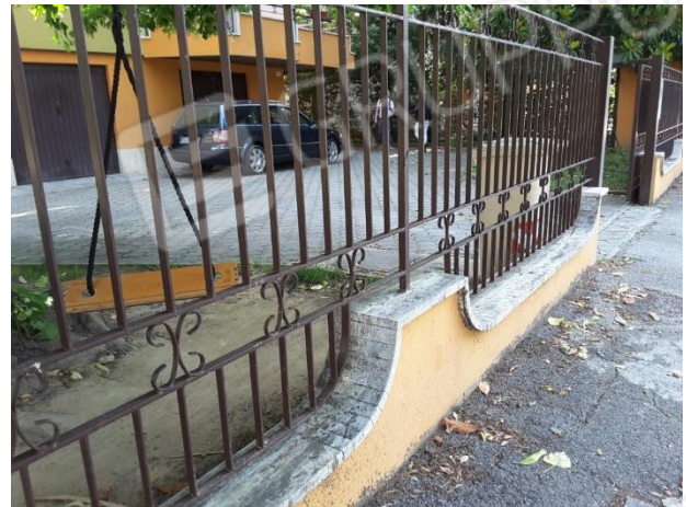
Vista recinzione del fabbricato condominiale che ospita le porzioni immobiliari oggetto di esecuzione