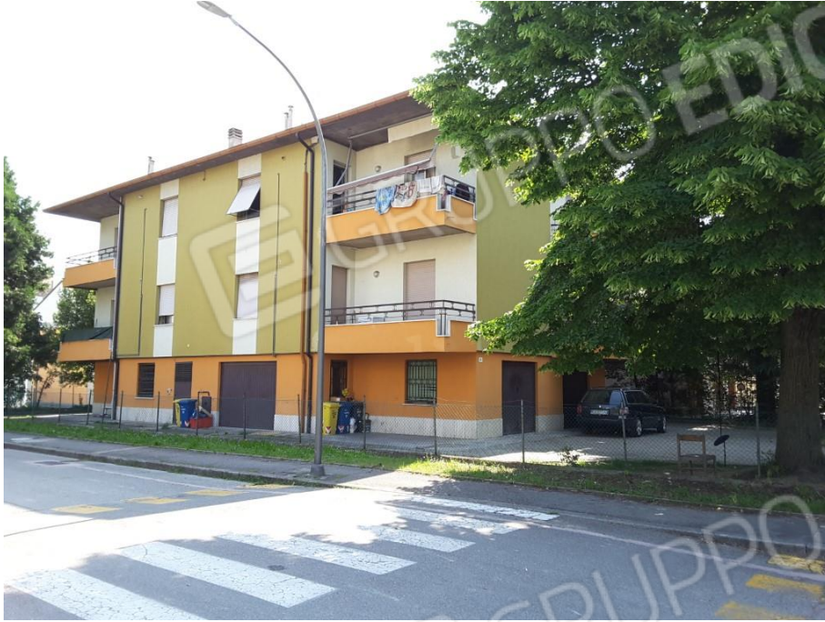
Vista esterna del fabbricato condominiale che ospita le porzioni immobiliari oggetto di esecuzione