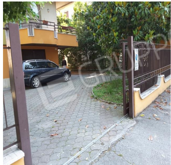
Vista area cortilizia del fabbricato condominiale che ospita le porzioni immobiliari oggetto di esecuzione