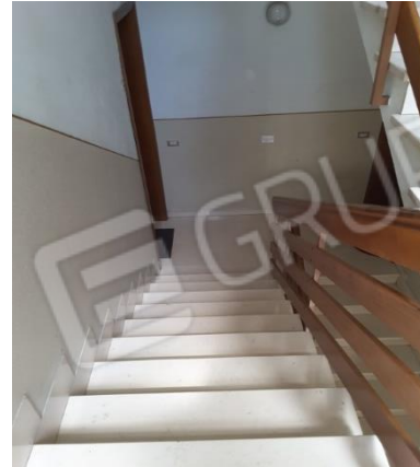
Vista ingresso e vano scala comune del fabbricato condominiale che ospita le porzioni immobiliari oggetto di esecuzione