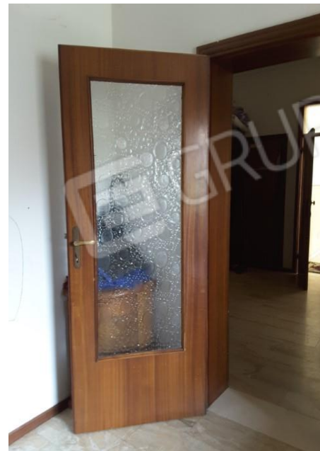
Vista porte interne