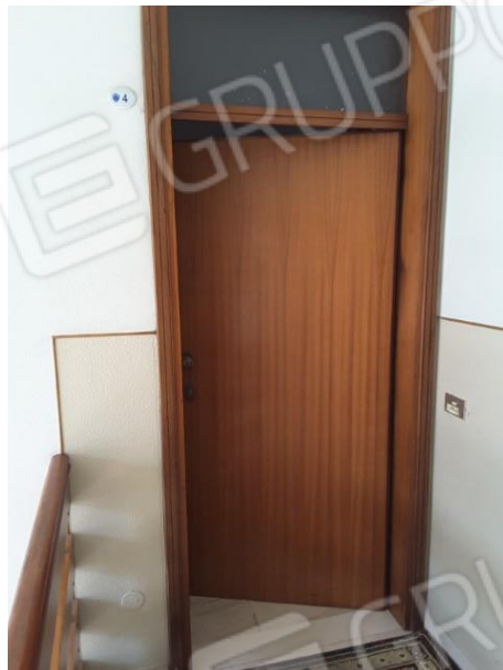
Vista ingresso all'alloggio oggetto di esecuzione