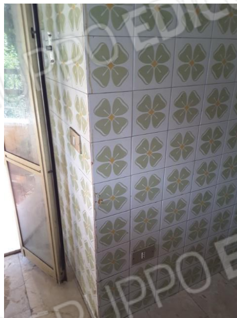
Vista pareti cucina