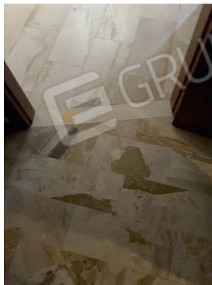
Vista pavimentazione interna