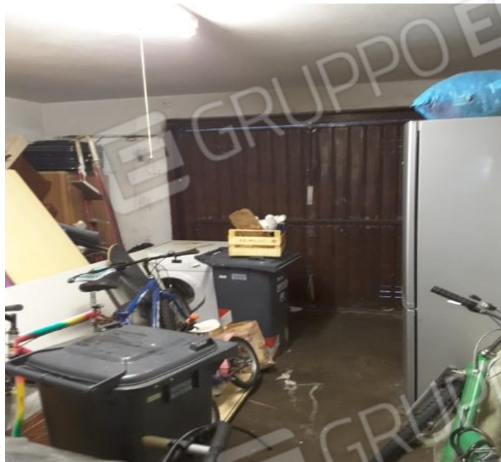
Vista interna autorimessa