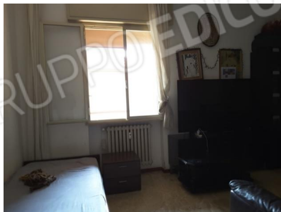
Vista impianto di riscaldamento