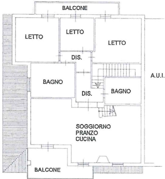
PIANO PRIMO H:2.80