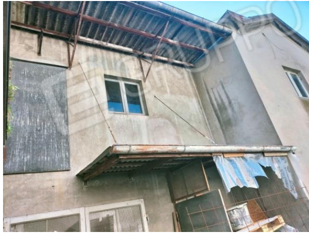
Copertura dei servizi a falde in travi varesi e tavelloni in laterizio con sovrastante manto di copertura in lastre di fibra di eternit