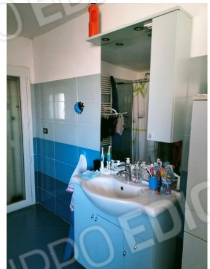
Bagno ricavato senza titolo autorizzativo nel locale concessionato a lavanderia