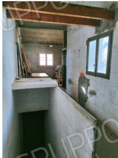
Servizi annessi all'alloggio