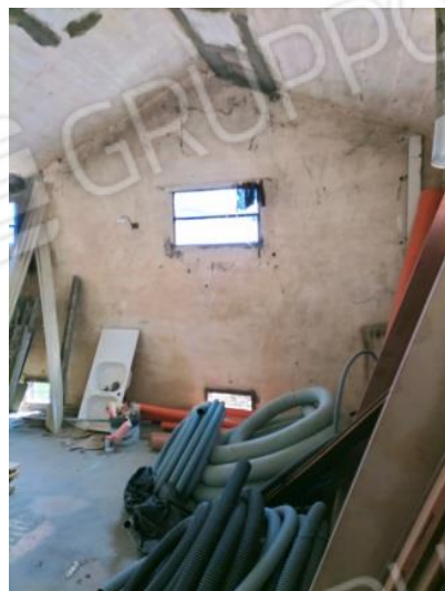
Servizi annessi all'alloggio