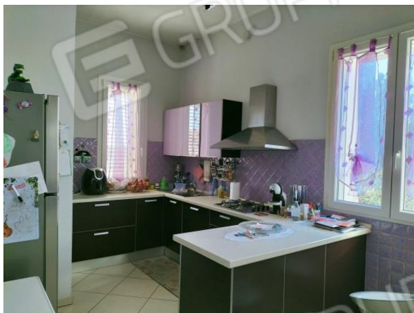
Parete attrezzata cucina