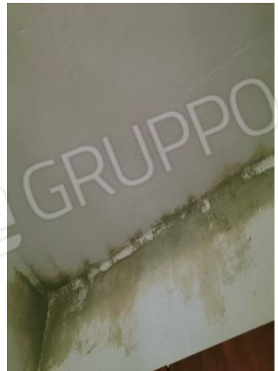
Stato manutentivo: nella camera da letto sono state accertate estese infiltrazioni di umidità e insalubrità della muratura e di parte del soffitto con evidenti zone macchiate di colore verdastro