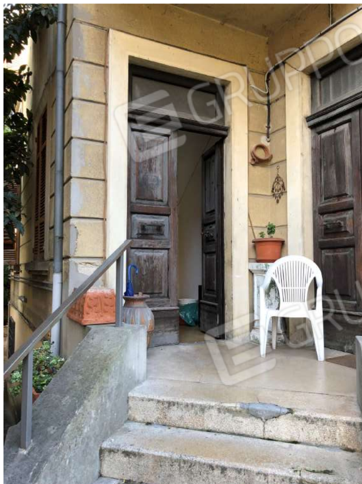
Foto 10- Portone comune