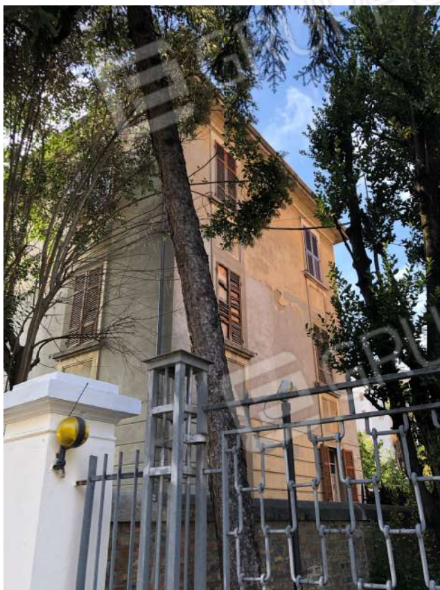
Foto 2- veduta prospetto nord-ovest