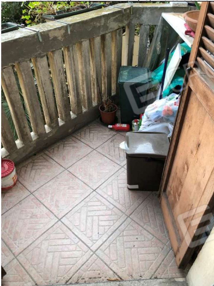
Foto 19- terrazzo

Galleria Cotogni n° 3 – 47121 Forlì (FC) – Tel.0543-033402 fax 0543-031250 Mail: stpadovano@libero.it