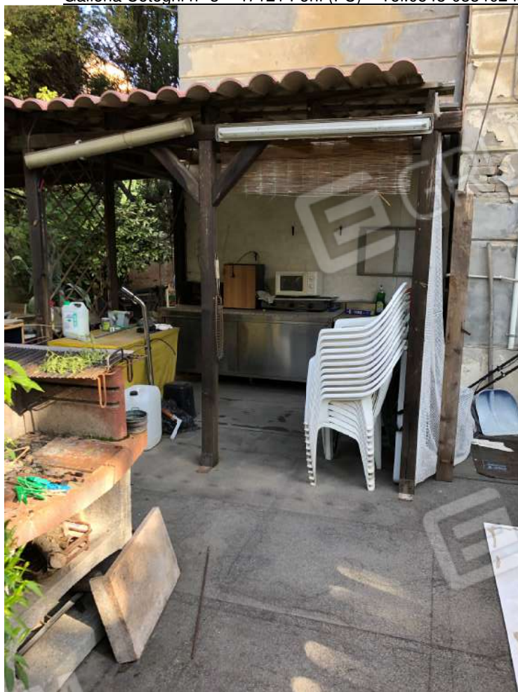
Foto 7- tettoia