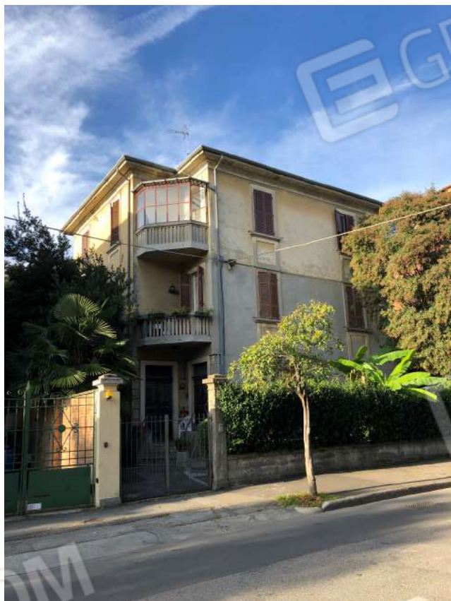
Foto 1- veduta da viale Oriani