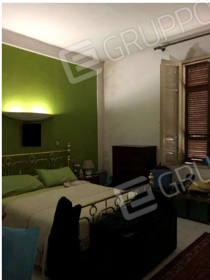
Foto 27- camera matrimoniale