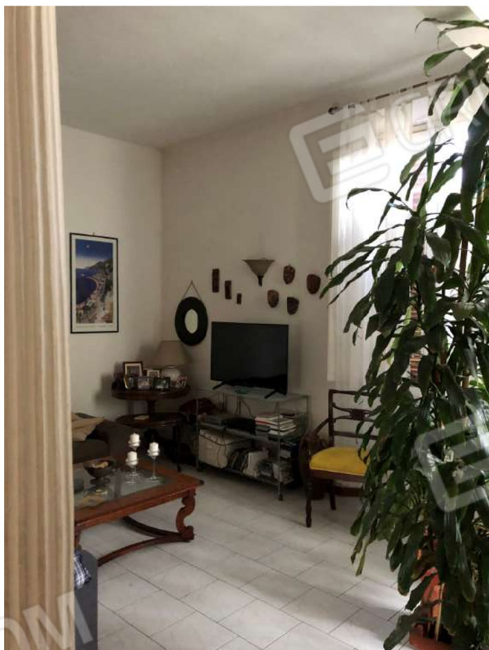
Foto 17- soggiorno