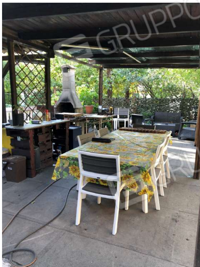
Foto 6- tettoia