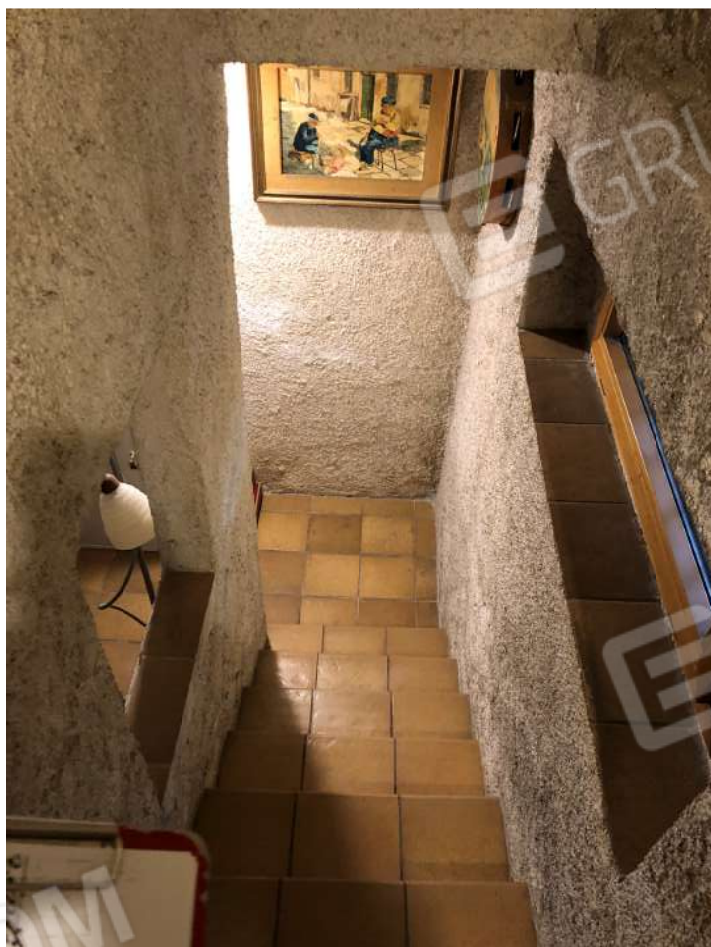
Foto 11- scala alla cantina