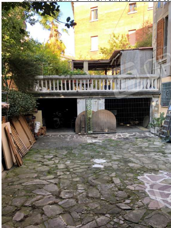
Foto 9- corte retro

Galleria Cotoigni n° 3 – 47121 Forlì (FC) – Tel.0543-033402 fax 0543-031250 Mail: stpadovano@libero.it