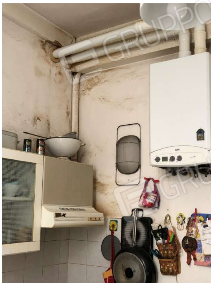
Foto 22- cucina