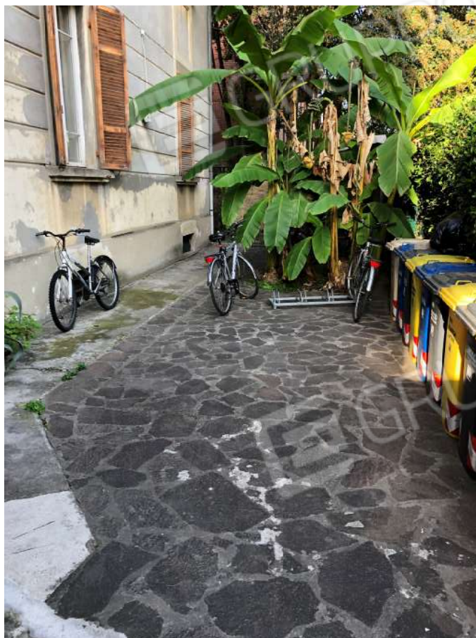
Foto 4- corte sul fronte