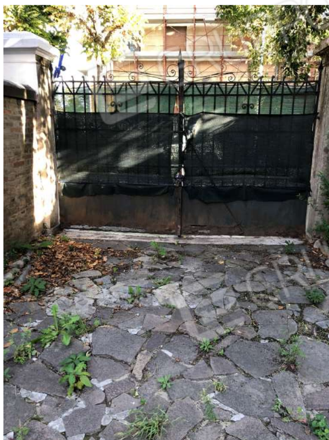
Foto 8- accesso carrabile