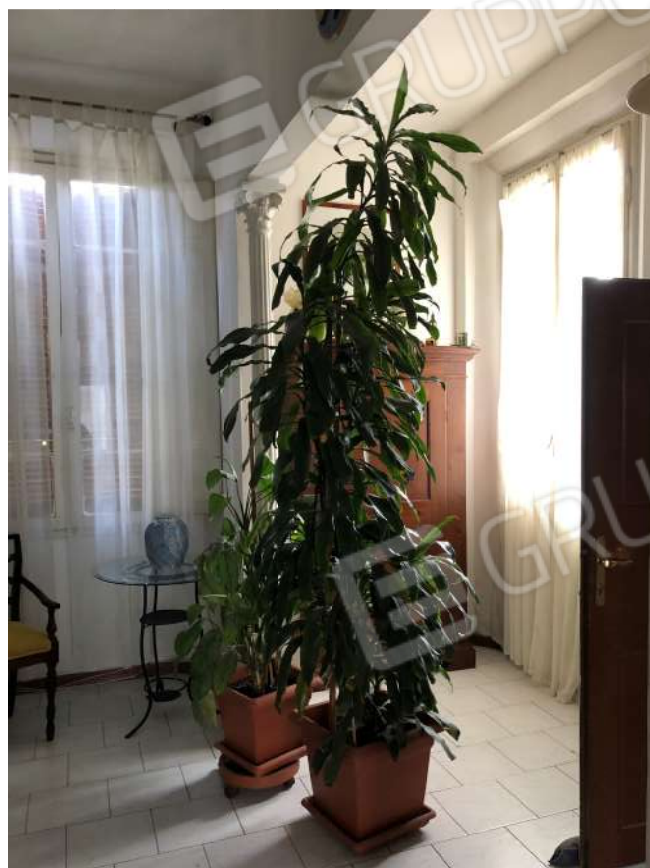
Foto 18- soggiorno