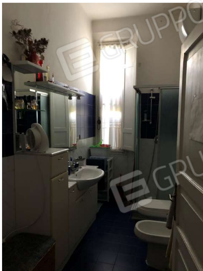
Foto 25- bagno