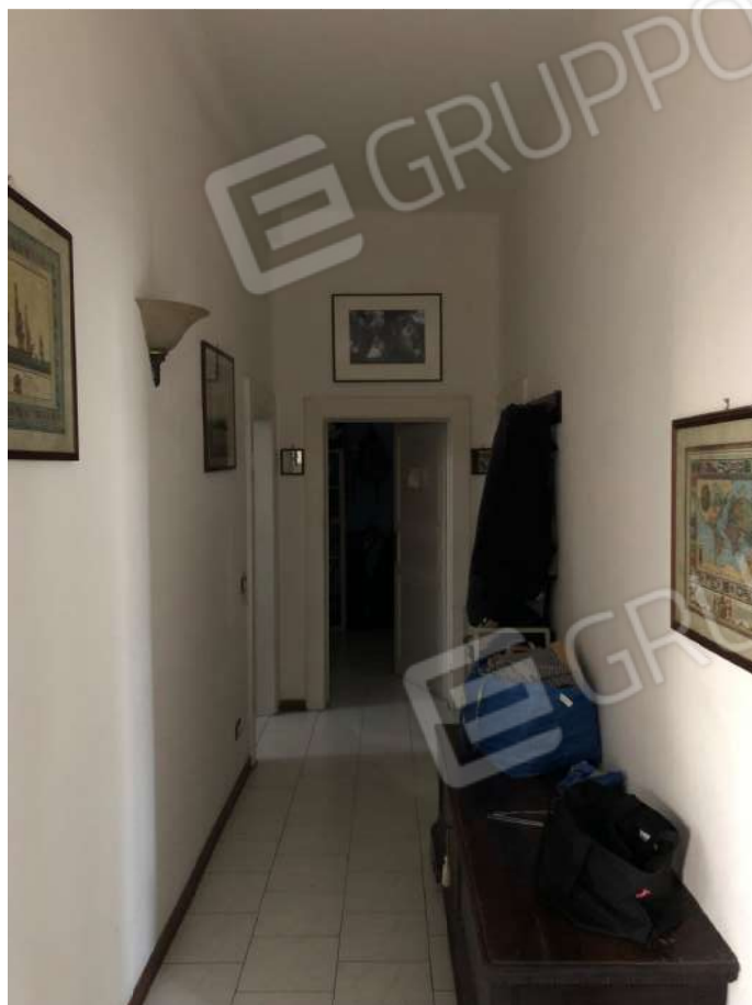
Foto 20- corridoio