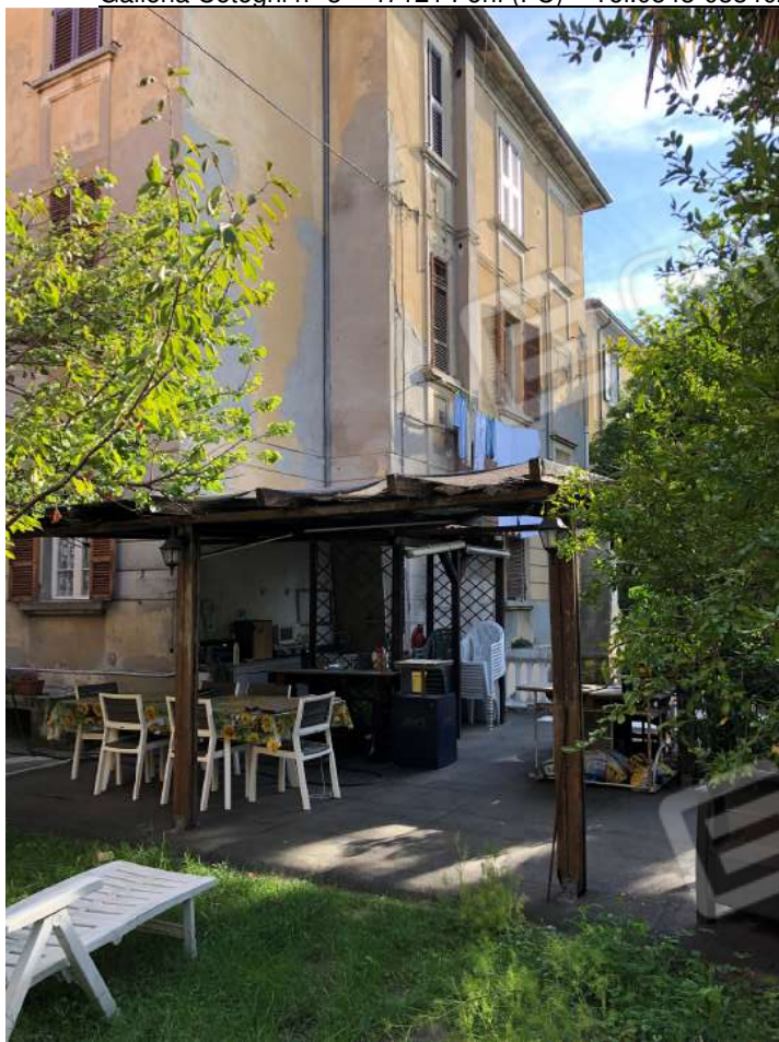
Foto 3- Retro prospetto e corte

Galleria Cotoigni n° 3 – 47121 Forlì (FC) – Tel.0543-033402 fax 0543-031250 Mail: stpadovano@libero.it