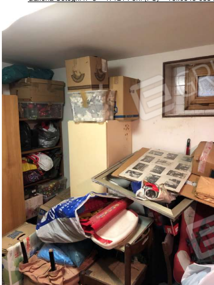
Foto 15- cantina

Galleria Cotoigni n° 3 – 47121 Forlì (FC) – Tel.0543-033402 fax 0543-031250 Mail: stpadovano@libero.it