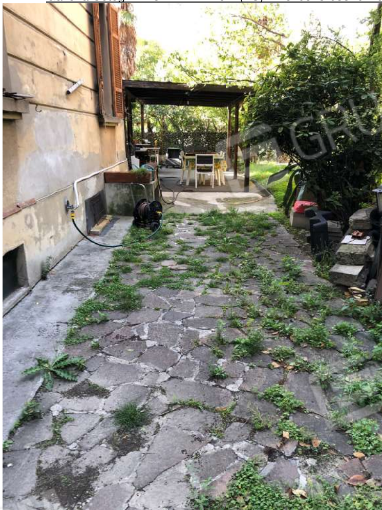
Foto 5- corte lato nord-ovest