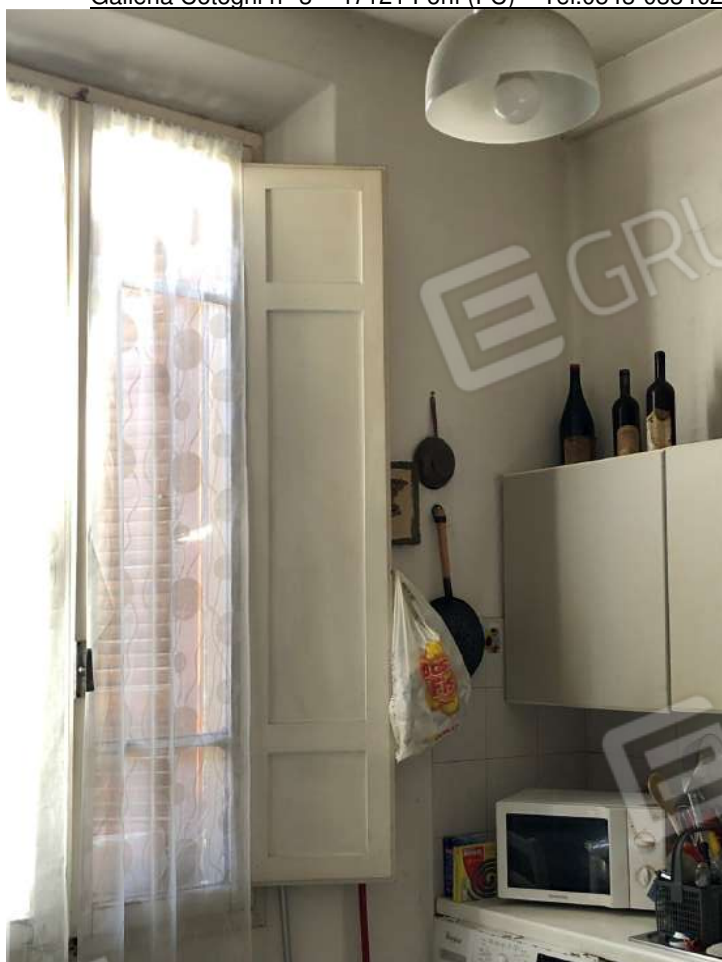
Foto 21- cucina