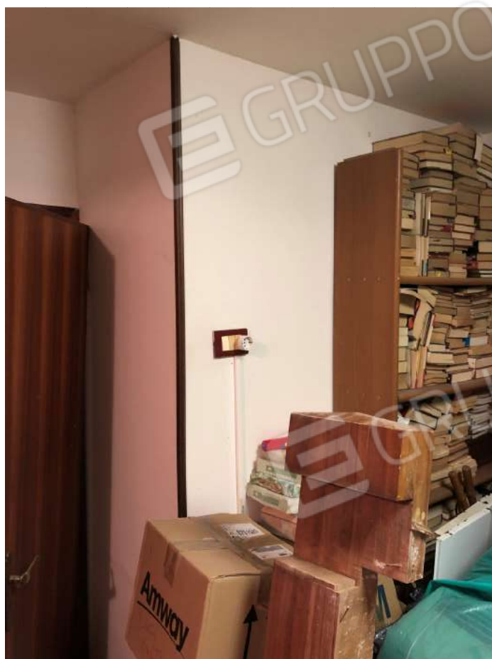
Foto 16- cantina