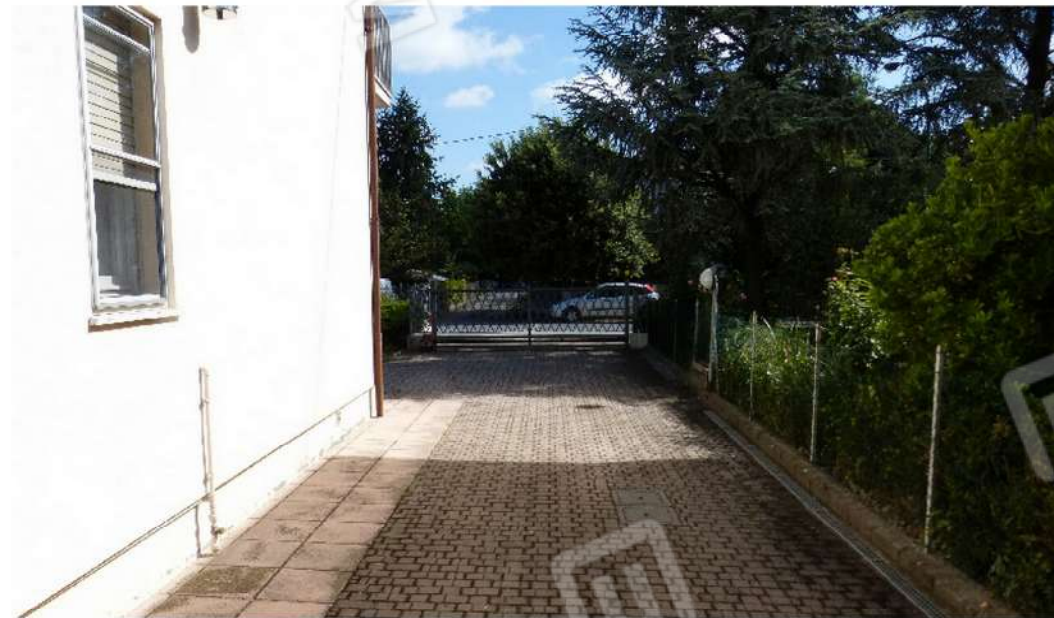
vista esterna viale di accesso carrabile e pedonale