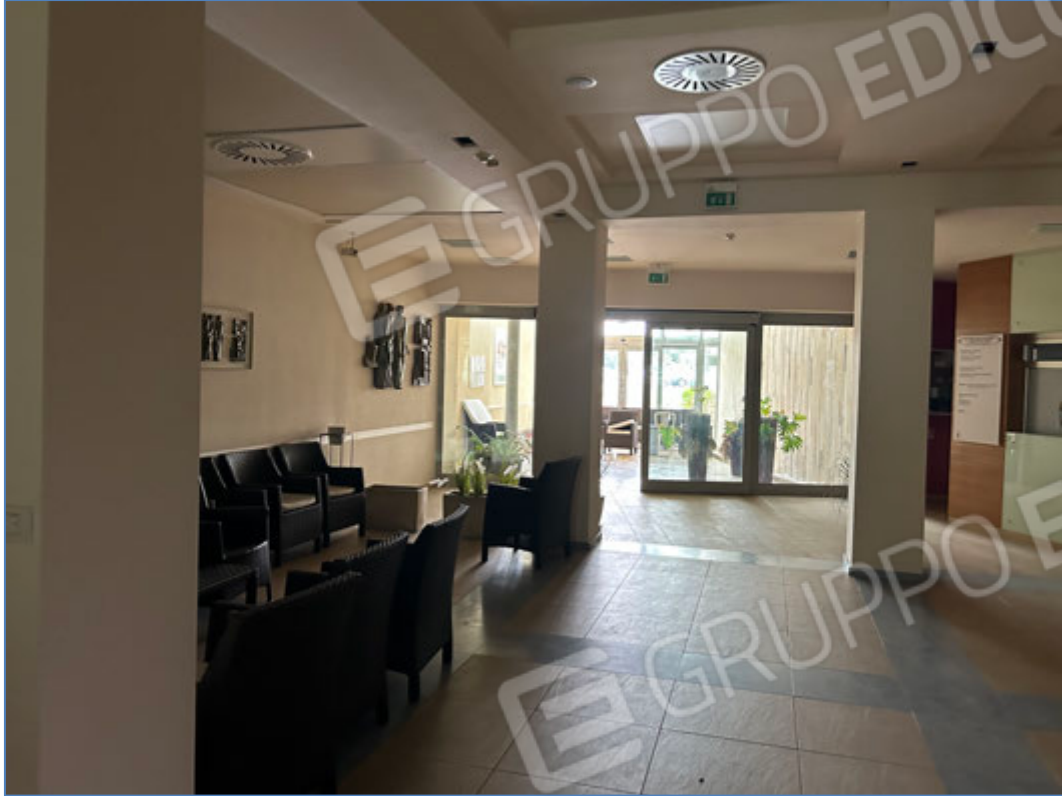
Interni dell'hotel - Centro benessere