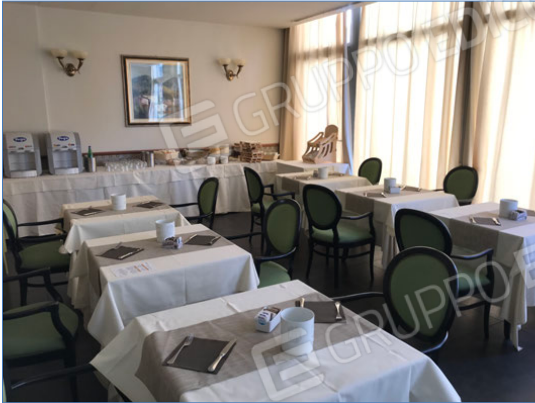
Interni dell'hotel - Seconda sala da pranzo