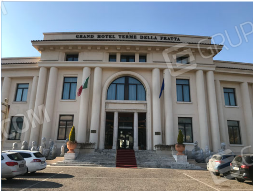
Fronte principale dell'hotel