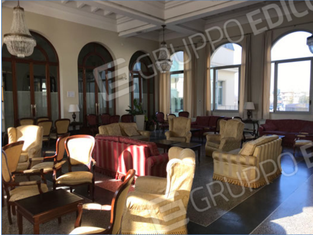
Interni dell'hotel - Salotto