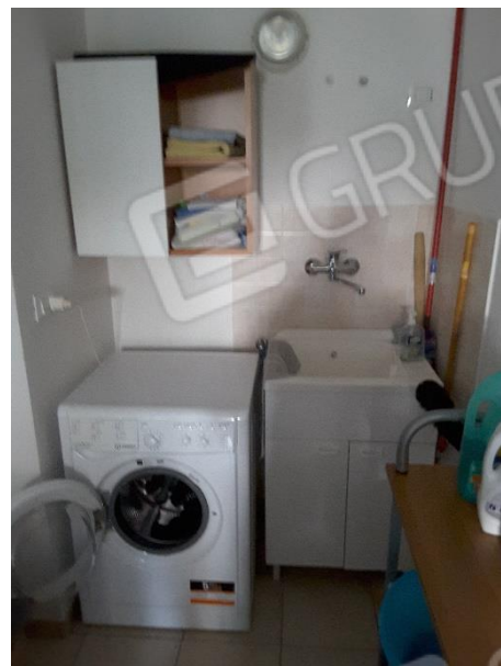
Vista impianto elettrico nell'autorimessa oltre alla presenza di lavello e lavatrice