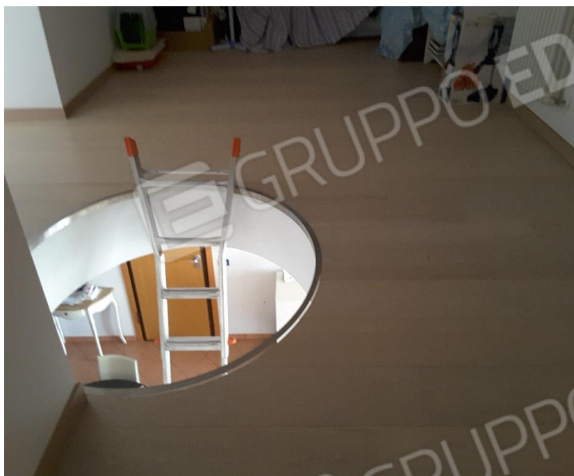
Vista foro presente sul pavimento del sottotetto