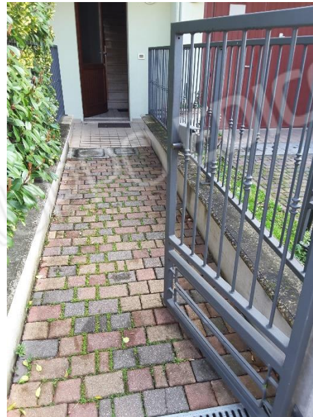
Vista accesso carrabile e pedonale al fabbricato condominiale dalla via Luigi Bernardini