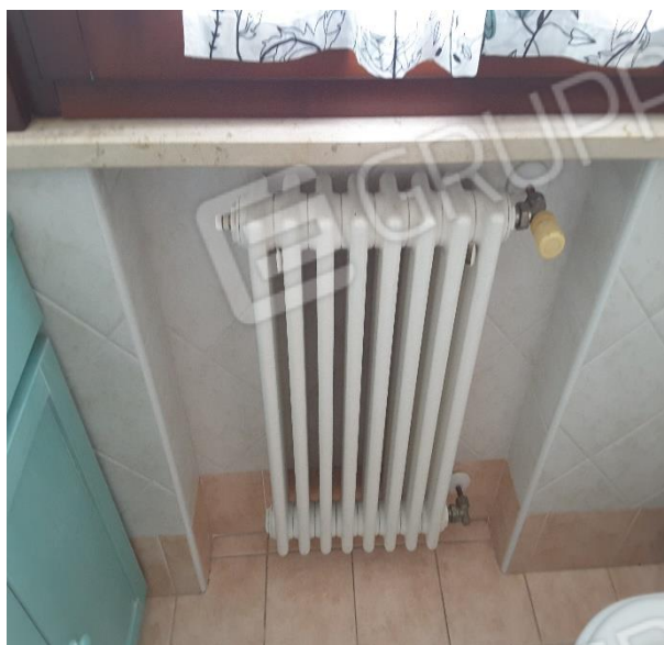
Vista impianto di riscaldamento con termosifoni in acciaio