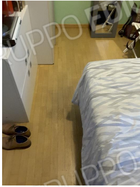
Vista pavimentazione delle camere da letto