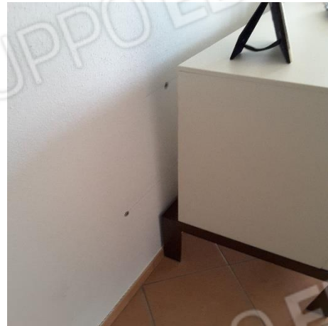
Vista presenza di alcuni fori nelle pareti sia del soggiorno sia delle camere da letto