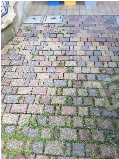
Vista area scoperta del fabbricato condominiale in parte di proprietà esclusiva di alcune porzioni immobiliari ed in parte è di uso comune condominiale