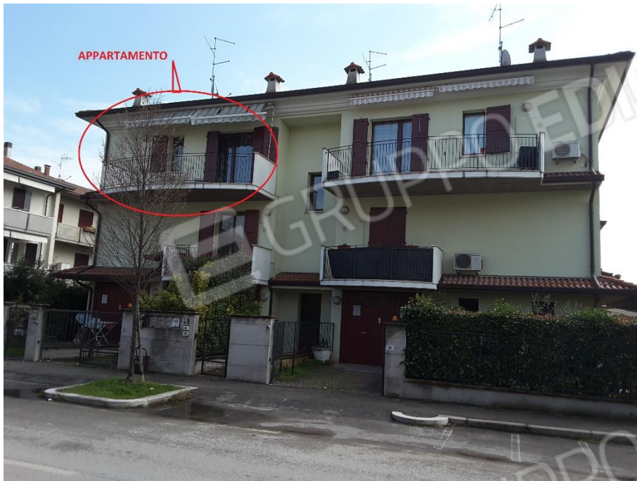
Vista esterna del fabbricato che comprende la proprietà immobiliare oggetto di procedura di liquidazione costituita dalla quota di 600/1000 di proprietà indivisa