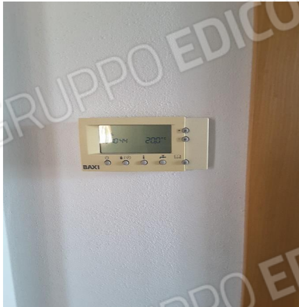
Vista impianto di riscaldamento con termoarredo e termostato di caldaia