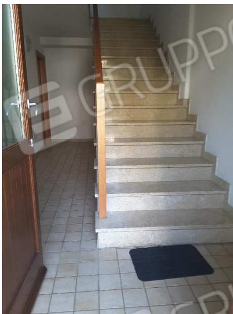
Vista scala comune condominiale