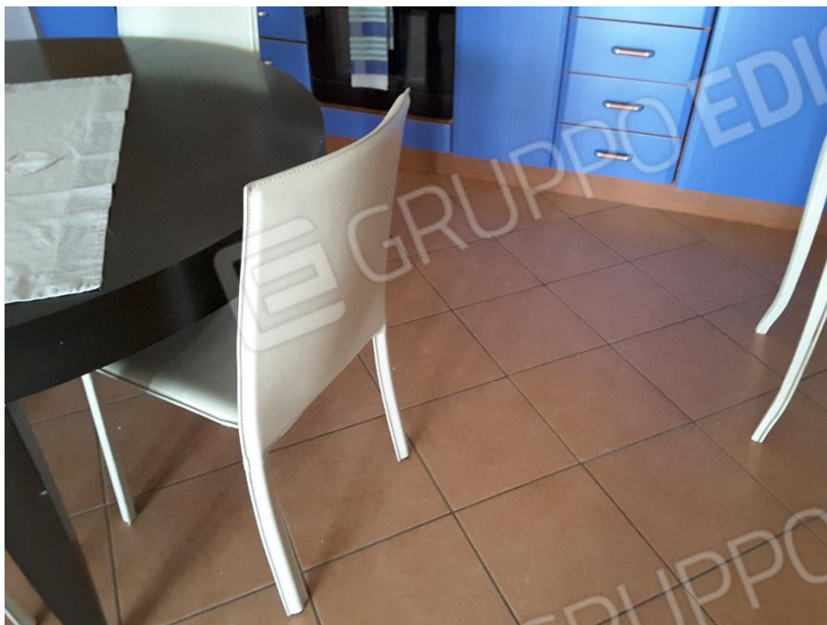
Vista pavimentazione appartamento zona giorno