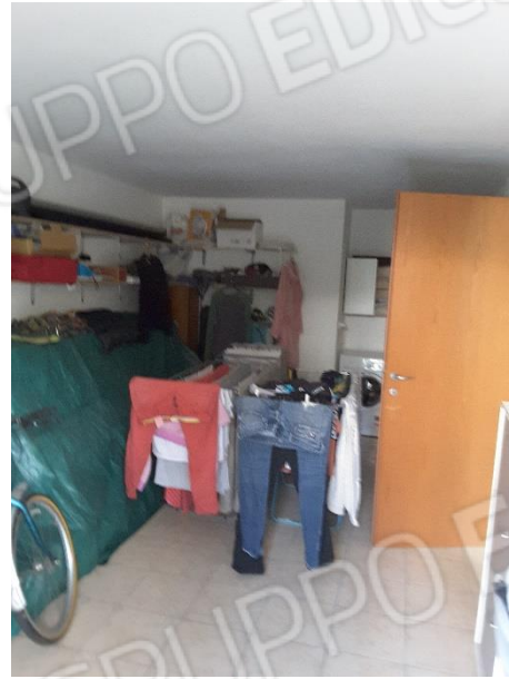
Vista interna autorimessa