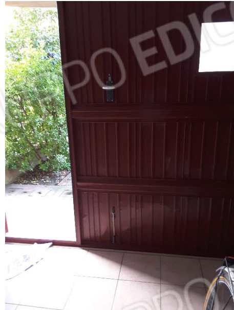
Vista esterna autorimessa