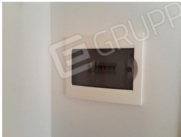
Vista impianto elettrico, del tipo sottotraccia con salvavita