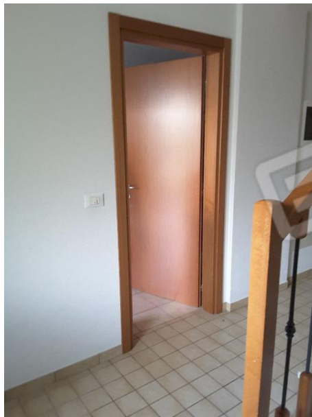
Vista porta di accesso all'autorimessa dal vano scale condominiale