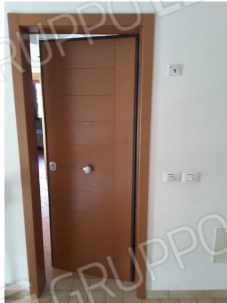
Vista portoncino d'ingresso