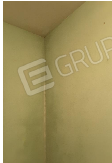
Vista segni di umidità nella parete esterna della camera da letto singola