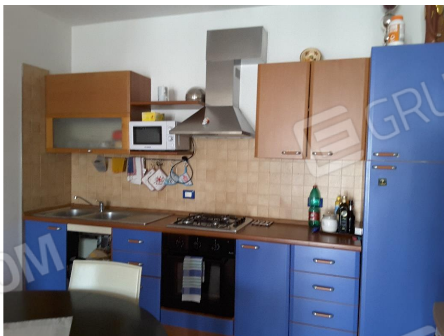
Vista parete attrezzata della cucina