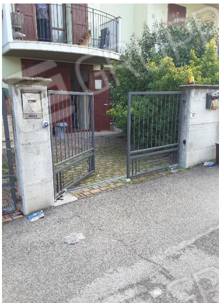
Vista ingresso autorimessa dalla via Luigi Bernardini