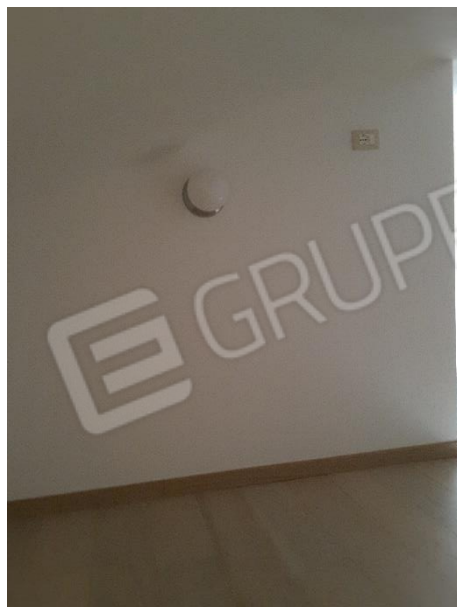
Vista impianto elettrico al piano sottotetto