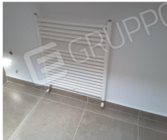
Vista impianto di riscaldamento nel sottotetto