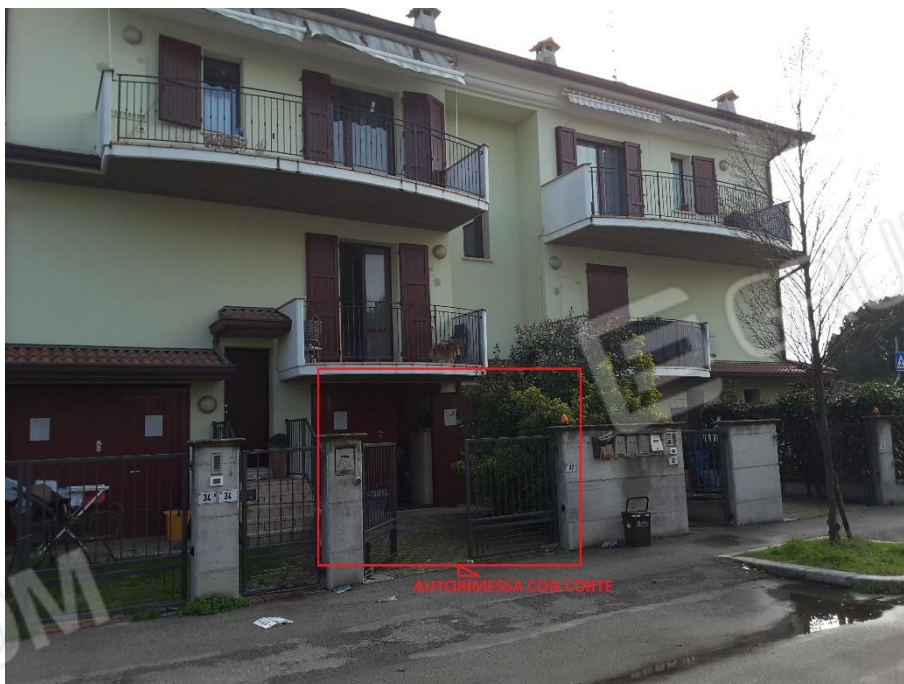
Vista esterna del fabbricato che comprende la proprietà immobiliare oggetto di procedura di liquidazione costituita dalla quota di 600/1000 di proprietà indivisa