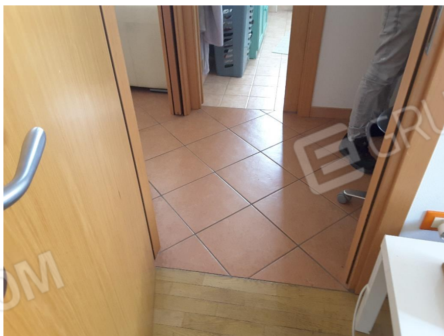
Vista porte interne