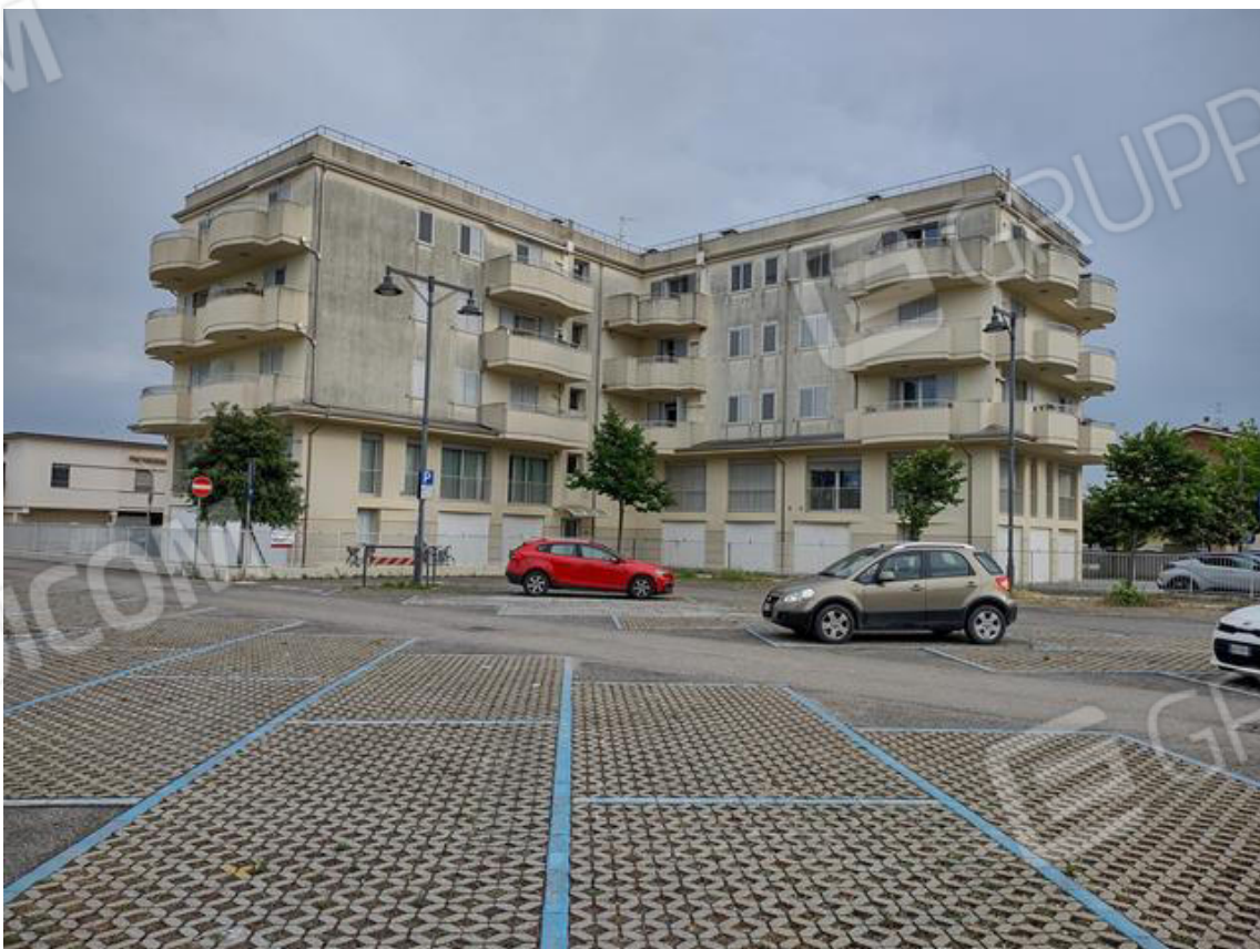
FOTO 2. Il condominio: vista dal parcheggio pubblico di Via Ravenna