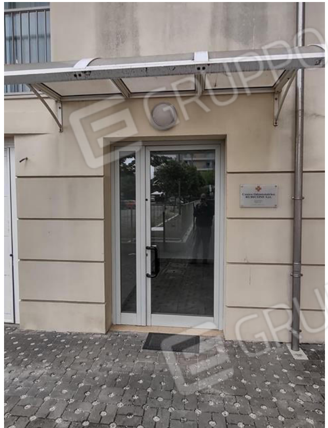
FOTO 5 e 6. Il condominio: vista del percorso pedonale e dell'ingresso comune