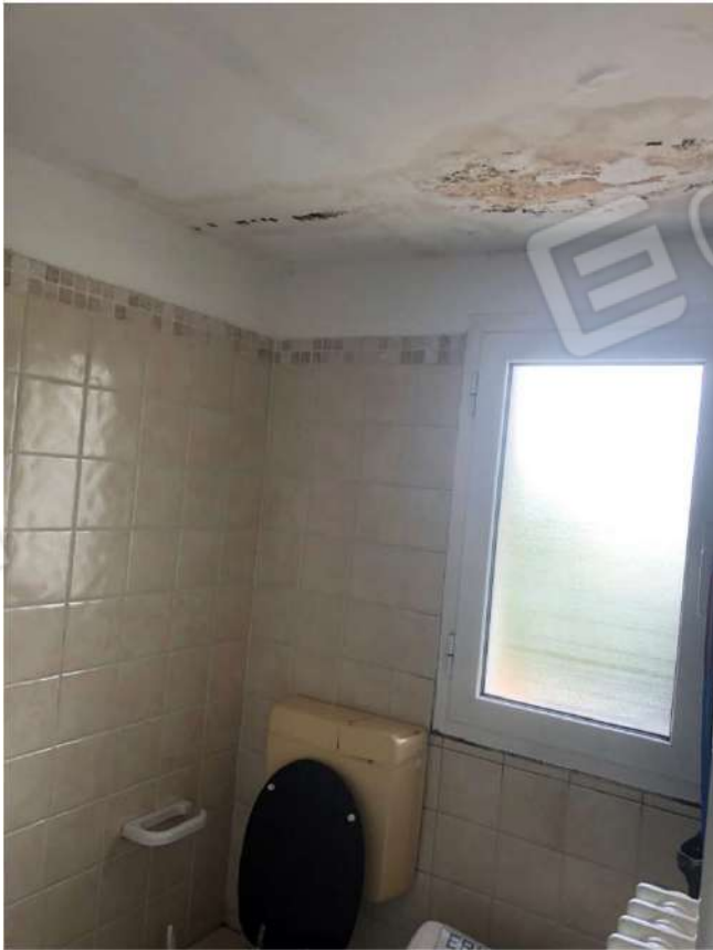
Foto 12 - sottotetto