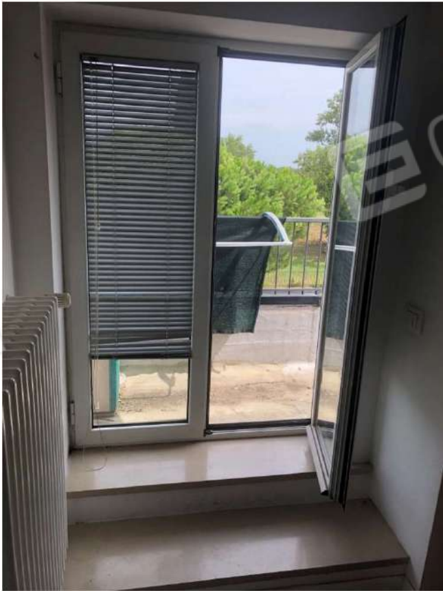
Foto 18 - terrazzo