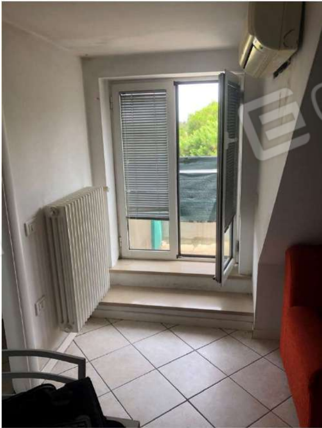
Foto 8 - sottotetto