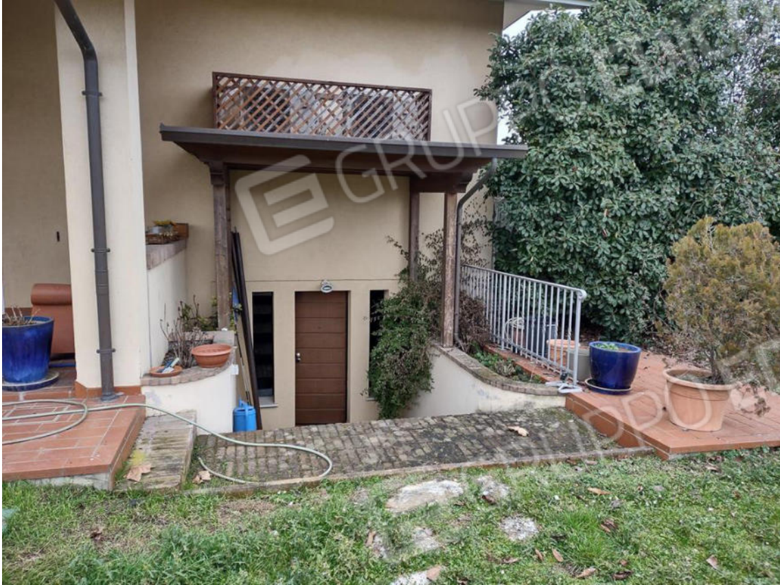
FOTO 24. L'accesso esterno al piano interrato