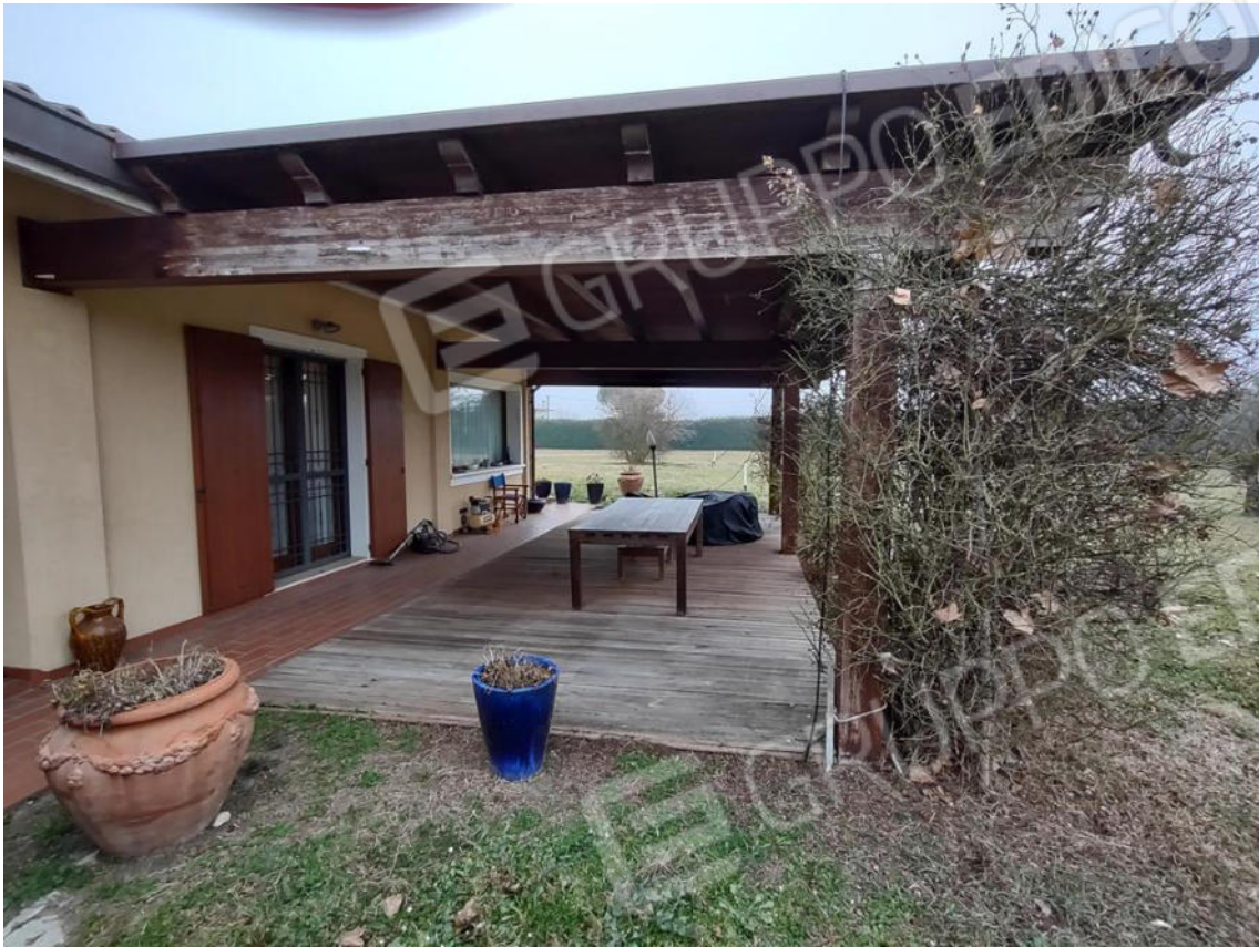
FOTO 7. La tettoia in legno ( non autorizzata) addossata al prospetto sud