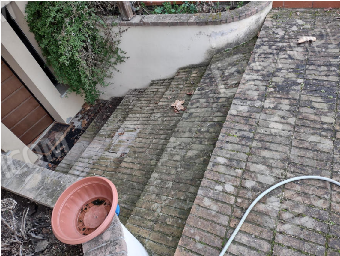
FOTO 25. L'accesso esterno al piano interrato: ex rampa trasformata in scala