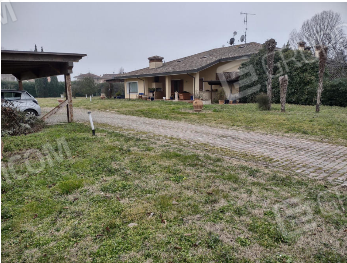
FOTO 4. L'abitazione vista dalla corte