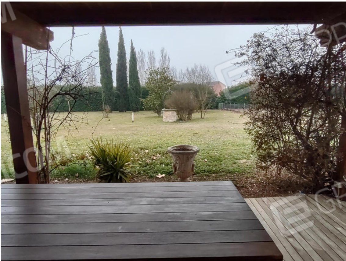
FOTO 8. L'interno della villa con corte di pertinenza e terreno di altra proprietà