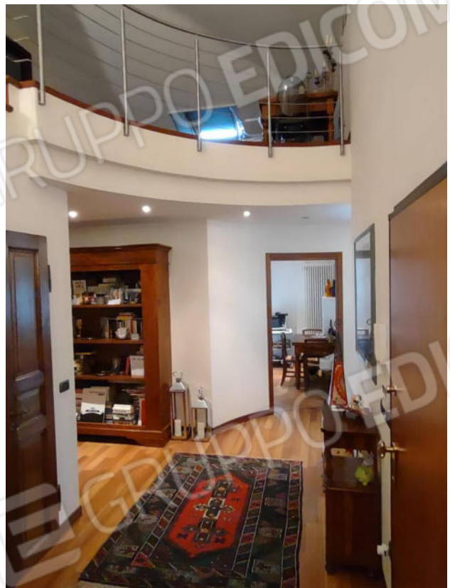
FOTO 17 e 18. Piano terra: l'ingresso, la scala per il sottotetto e il soppalco