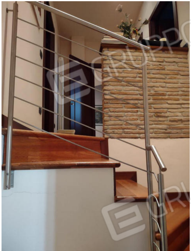
FOTO 31 e 32. Piano interrato: il ripostiglio e la scala interna per il piano primo