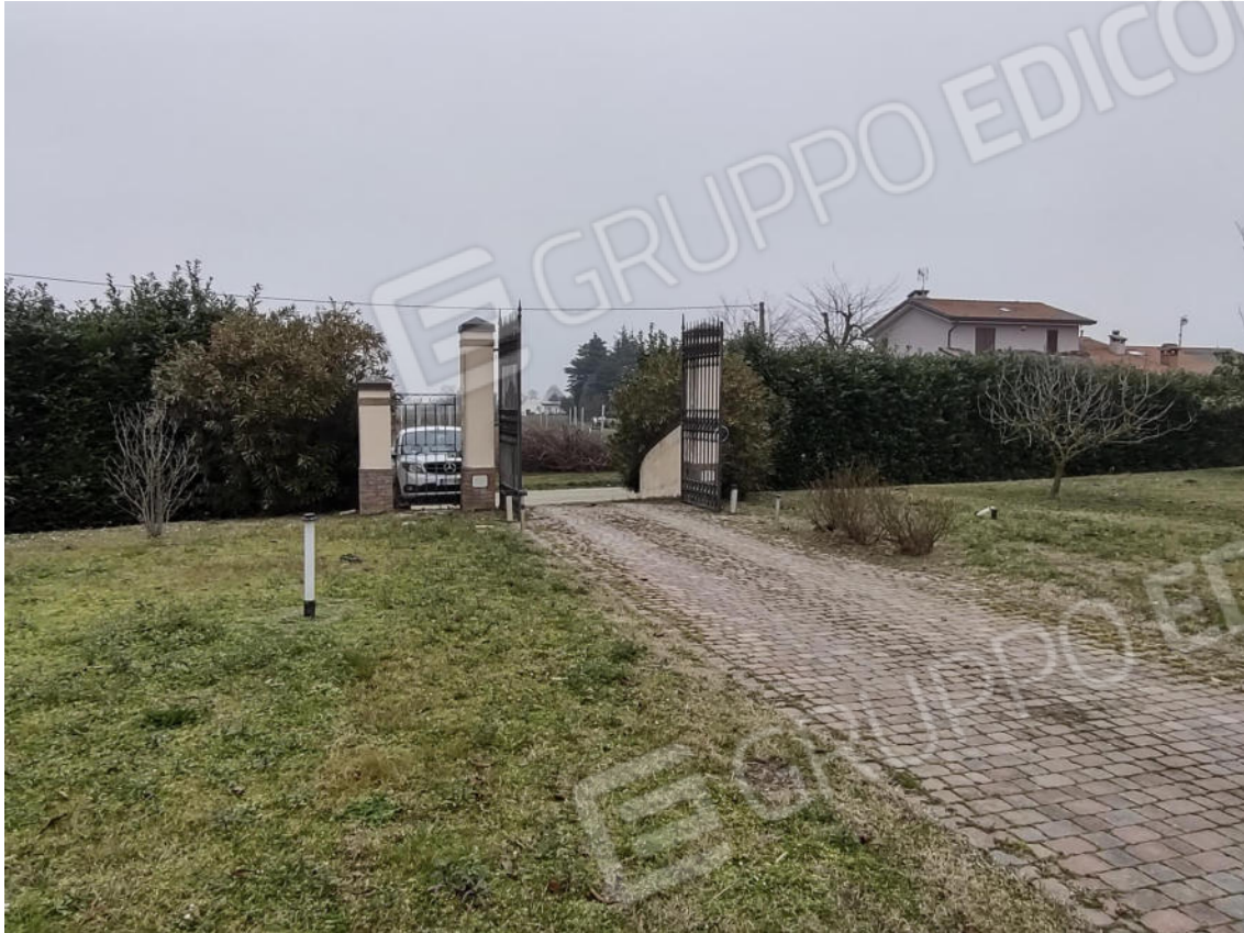
FOTO 3. I cancelli di accesso alla proprietà e il percorso carrabile interno