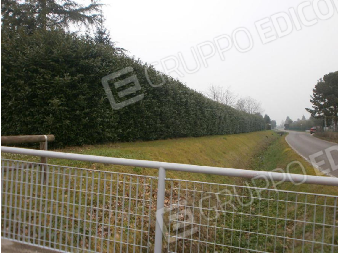
FOTO 1. La recinzione dello spazio intorno alla villa bifamiliare(corte e terreni di altra proprietà)