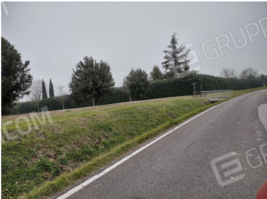
FOTO 2. La recinzione dello spazio intorno alla villa bifamiliare (corte e terreni di altra proprietà)