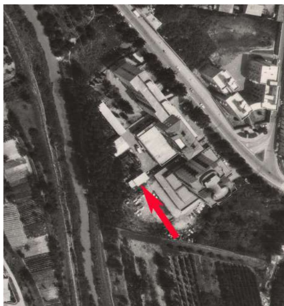
Stralcio foto 1971 – volo basso