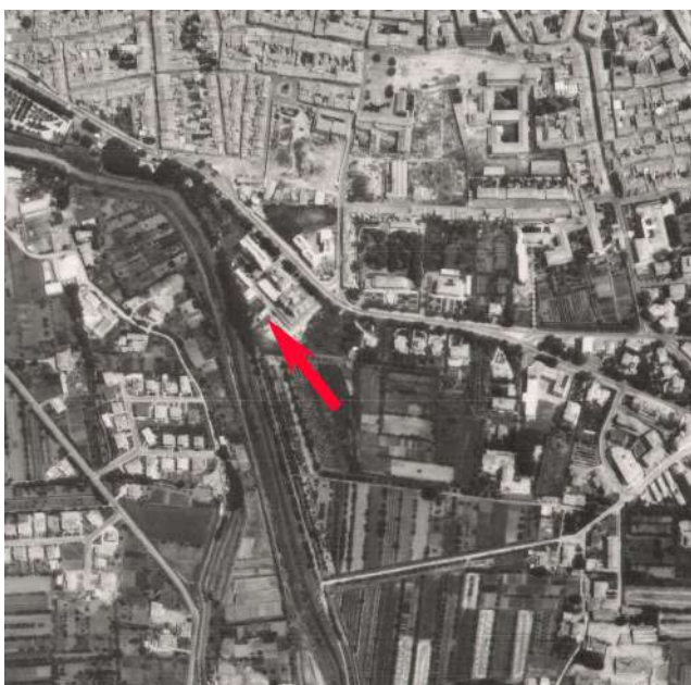
Stralcio foto 1971

prot. gen. n. 2077/69, 22544/69, 14498/71, 62546/86, 62545/86, Fascicolo n. 46278/1999, 40600/00, 33175/01, 38743/07, 44500/07 e 79395/10; fascicolo n. 11115/00 e 61611/05, prot. gen n. 59250/09 risulta depositato presso gli Uffici comunali, ma al momento irreperibile. Poiché i locali dell'Archivio sono stati resi inagibili dagli eventi alluvionali del maggio 2023, al momento sono indisponibili/irreperibili. (ved. All.11 Comunicazione Servizio edilizia) . Per quanto riguarda la verifica di legittimità specificatamente riferita all'unità immobiliare catastalmente identificata al Fg.200 particella 1009 sub.17, non essendo possibile verificarne la presenza attraverso l'esame dei titoli edilizi, si è provveduto all'acquisizione delle foto aeree storiche onde verificarne l'esistenza al 1971 (come richiesto dalle linee guida del Comune): dall'esame delle foto aeree storiche (vedere sotto) si è potuta accertarne l'esistenza anche se non è possibile determinarne compiutamente caratteristiche, consistenza e dimensioni.