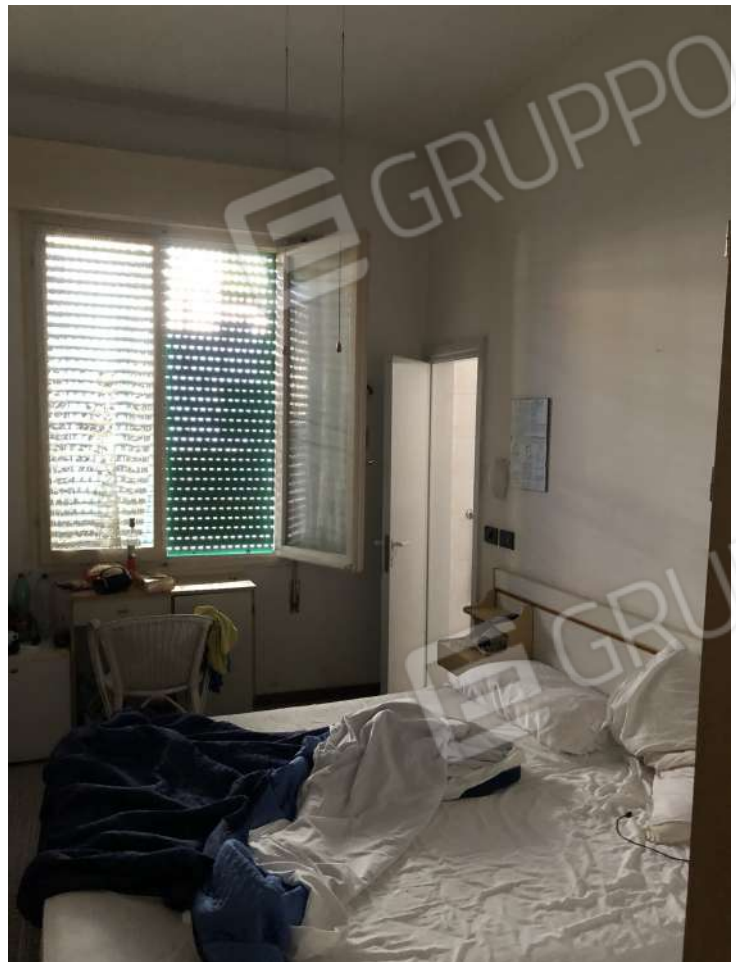
Foto 18- Camera 4