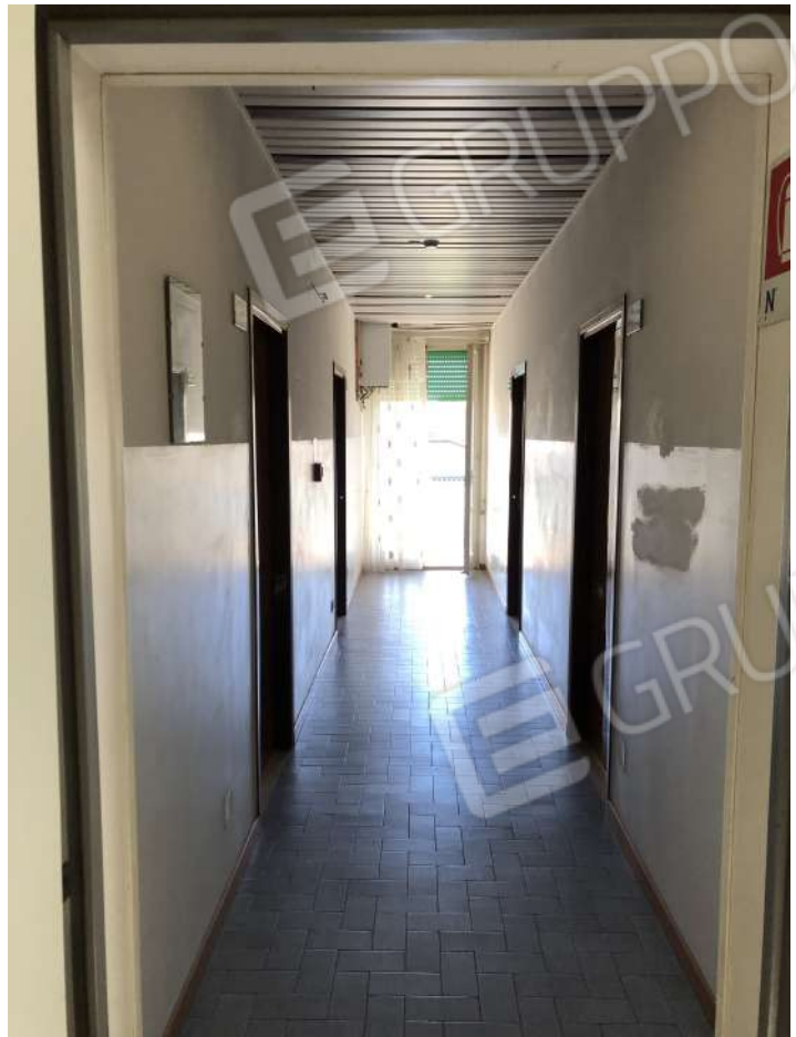
Foto 38- Corridoio camere