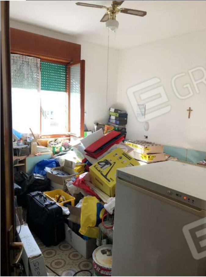
Foto 17- camera 3