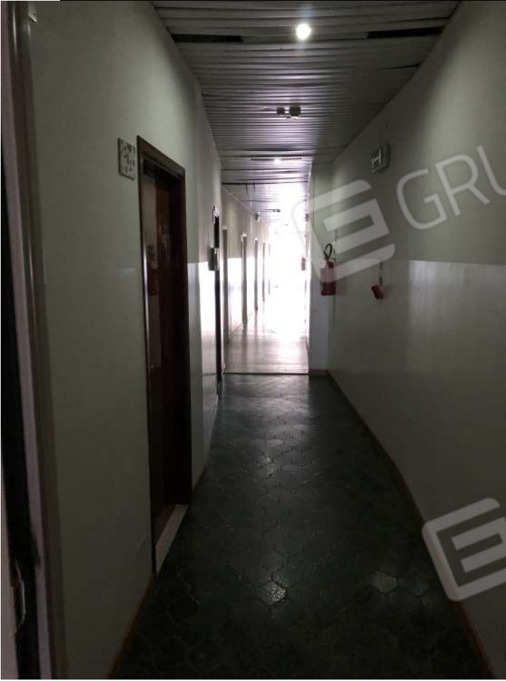
Foto 29- Corridoio camere