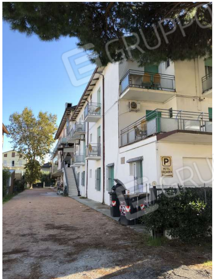
Foto 6- Corte lato nord-ovest