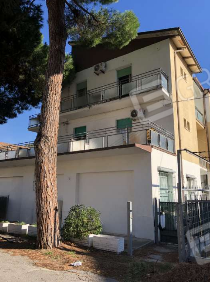
Foto 3- prospetto sud-ovest