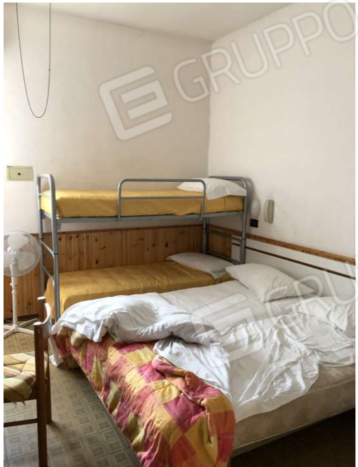
Foto 16- Camera 2