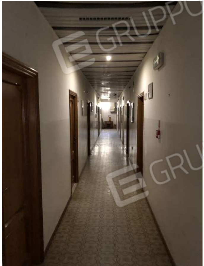
Foto 14- corridoio camere