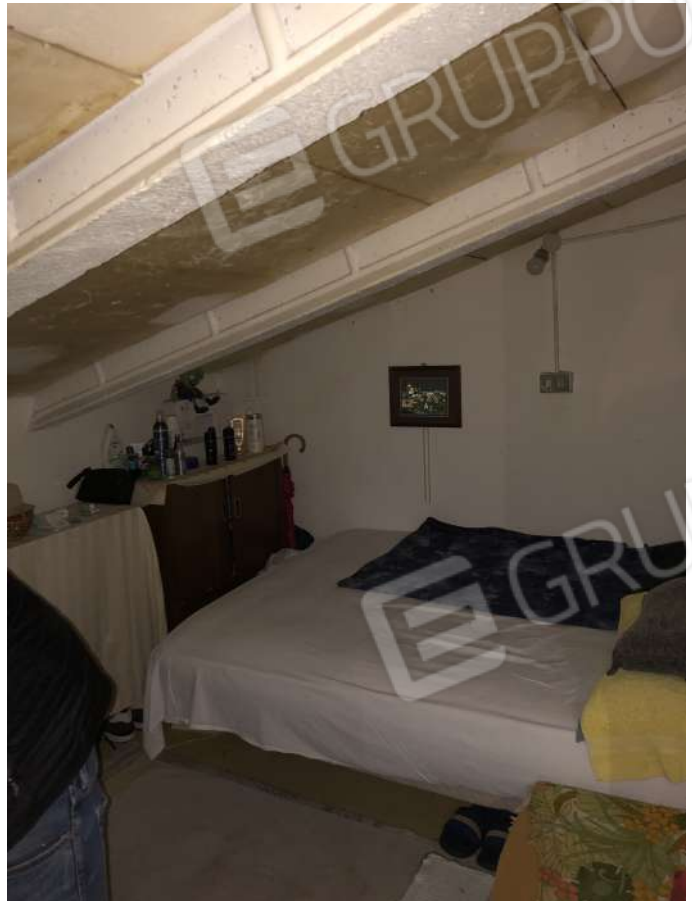
Foto 54- porzione adibita a camera