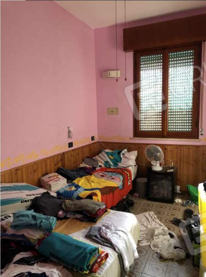
Foto 15- Camera 1