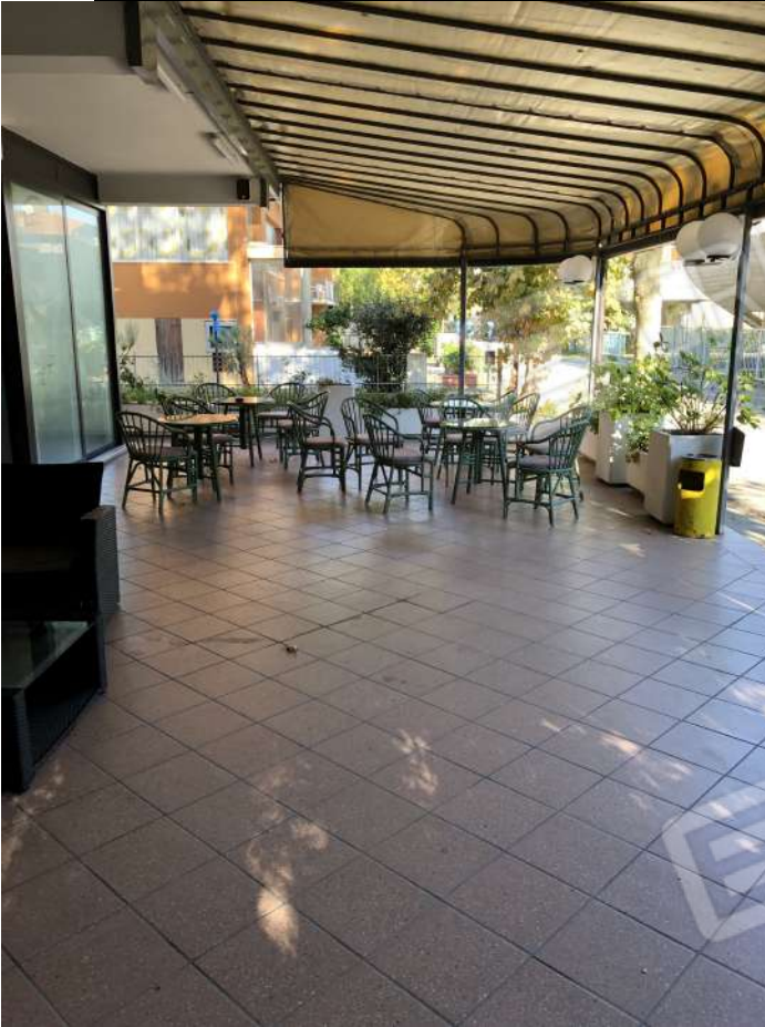
Foto 5- area esterna lato ingresso