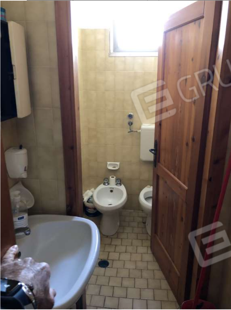
Foto 27- bagno di servizio alla cucina