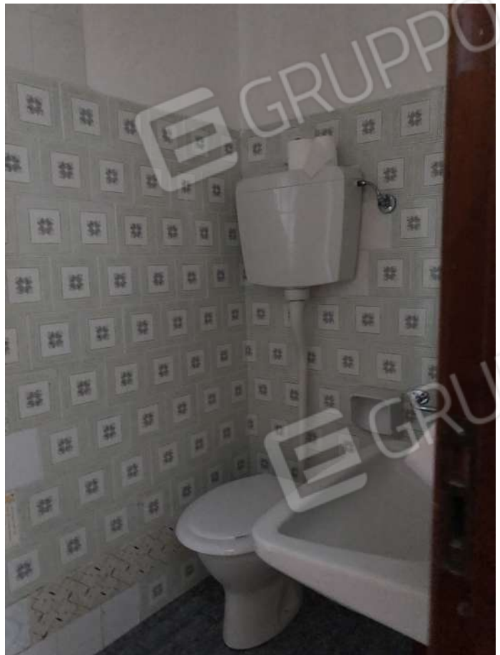
Foto 40- bagno camera tipo