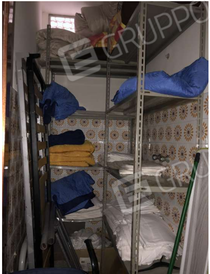
Foto 42- ripostiglio