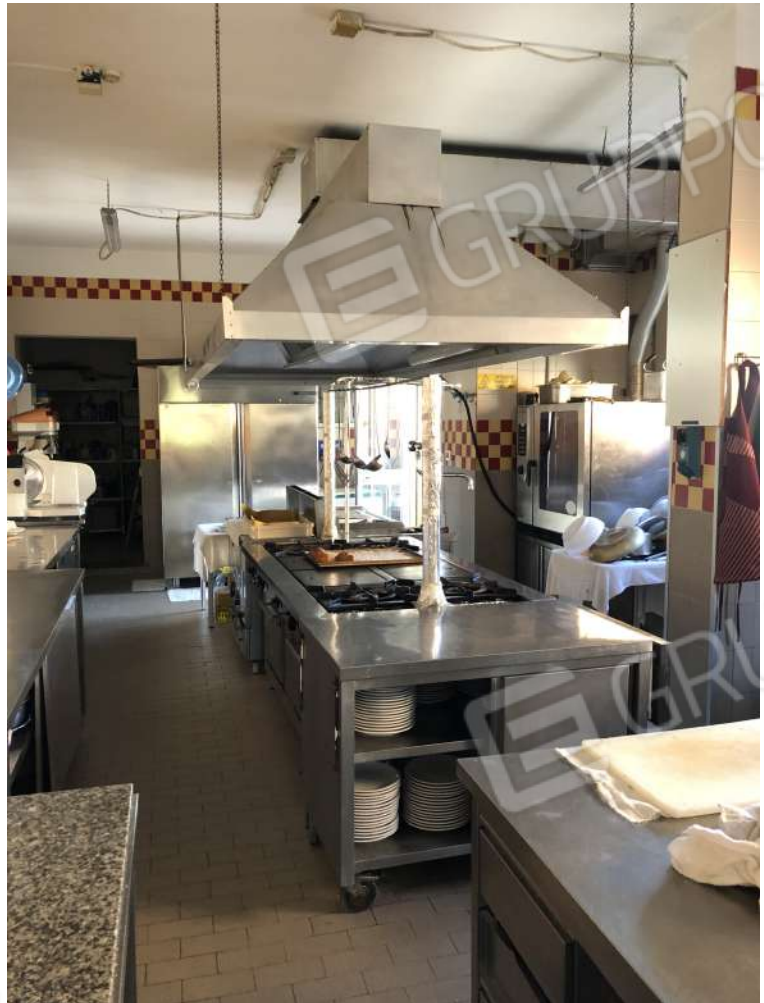
Foto 26- cucina