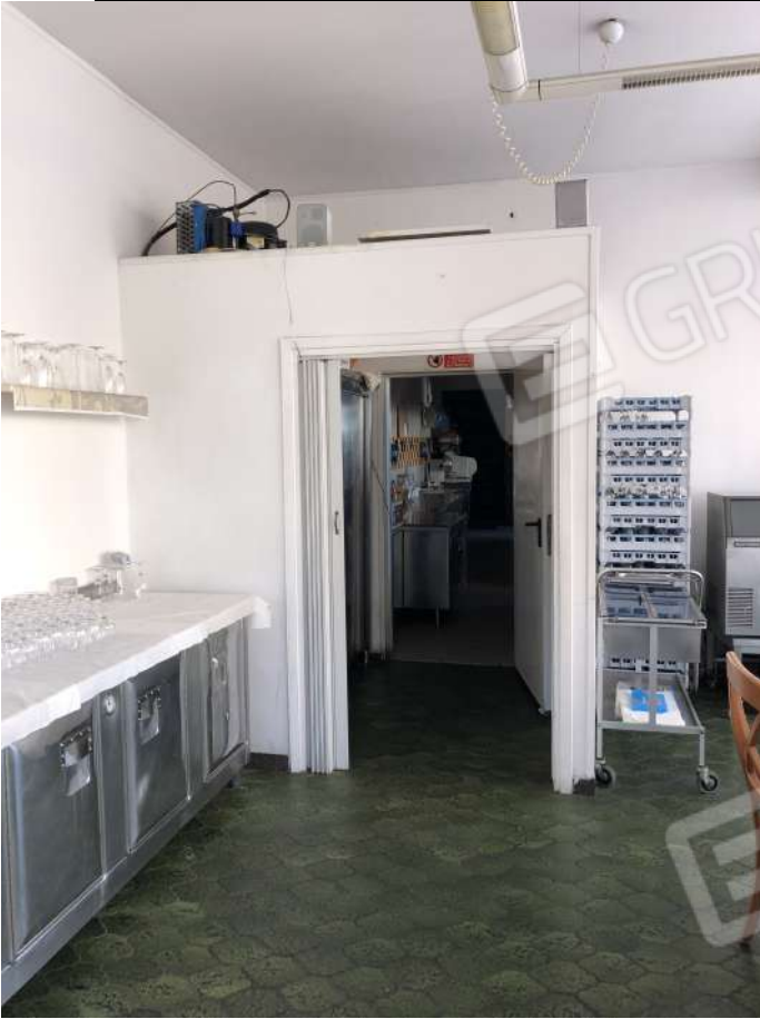
Foto 25- Office alle cucine