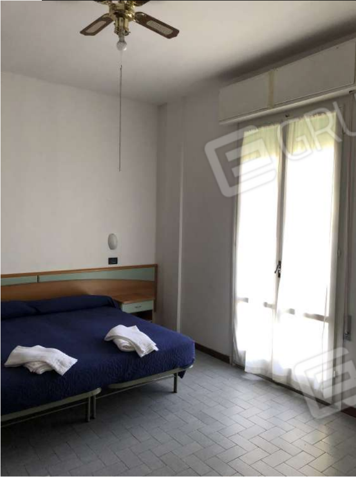
Foto 39- camera tipo