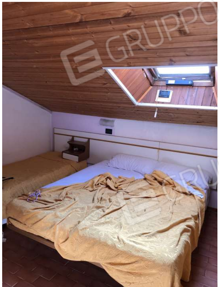
Foto 48- camera tipo 1