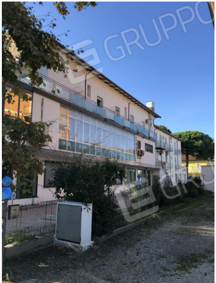
Foto 2- Prospetto Nord Ovest