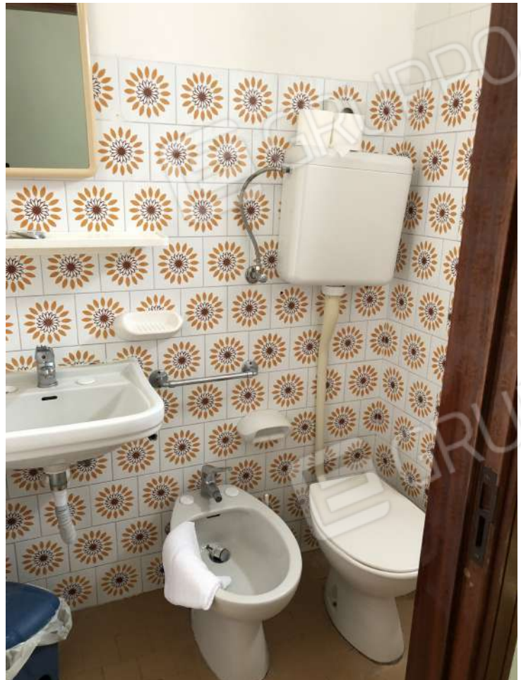
Foto 34- bagno Camera tipo 2