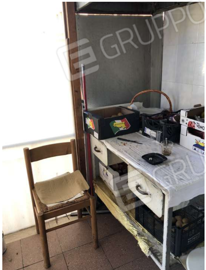
Foto 28- balcone cucina con scala verso corte