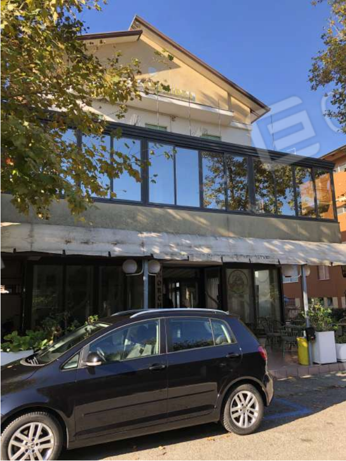
Prospetto su via Archimede