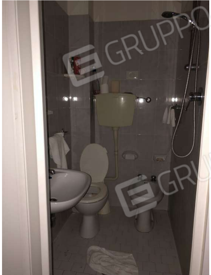
Foto 50- bagno tipo