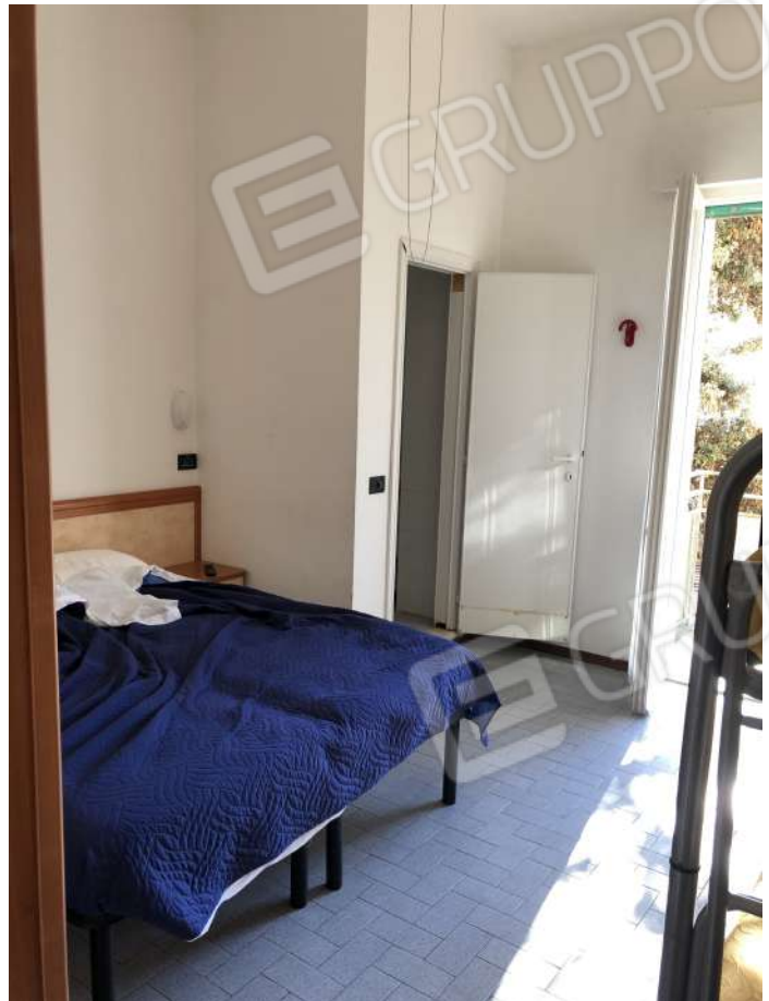
Foto 30- Camera tipo 1