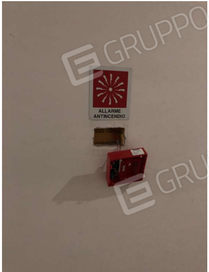
Foto 36- Dettaglio impianto antincendio