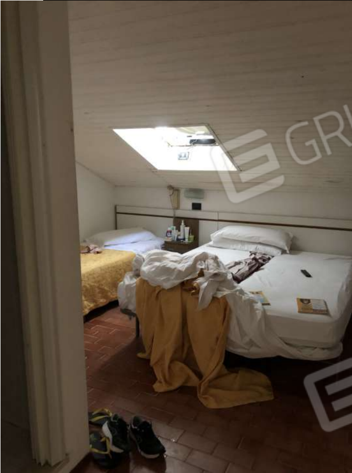
Foto 49- camera tipo 2