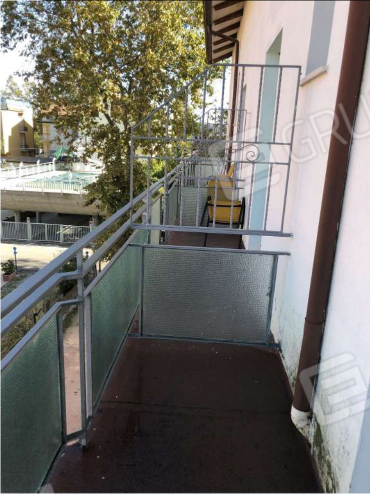
Foto 41- balconi laterali