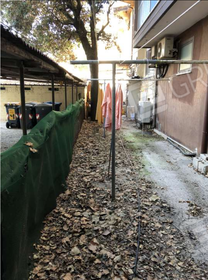
Foto 7- Corte lato sud est