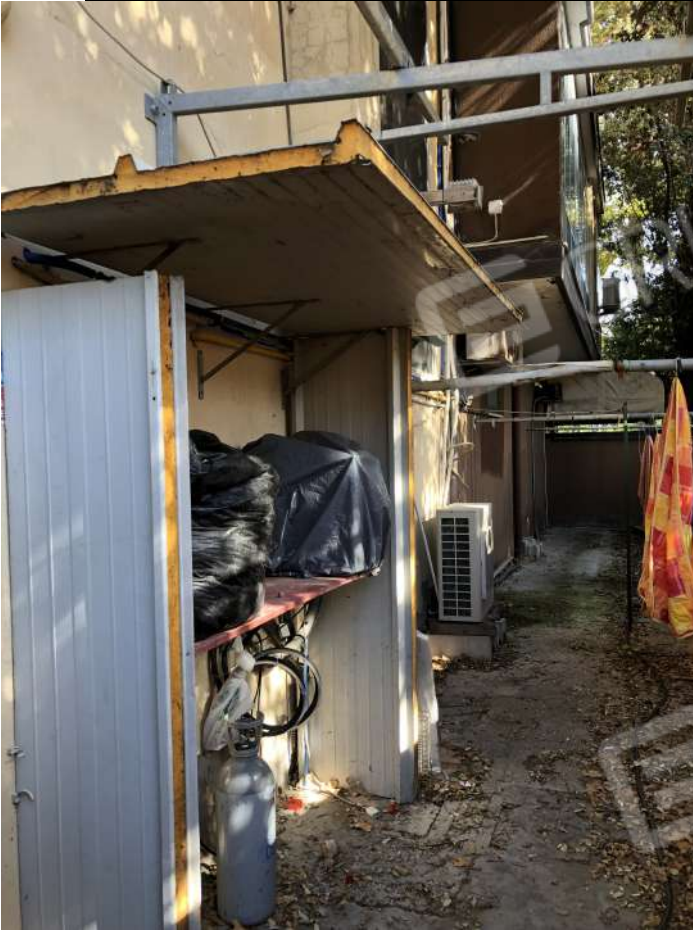
Foto 9- lato sud est - tettoia