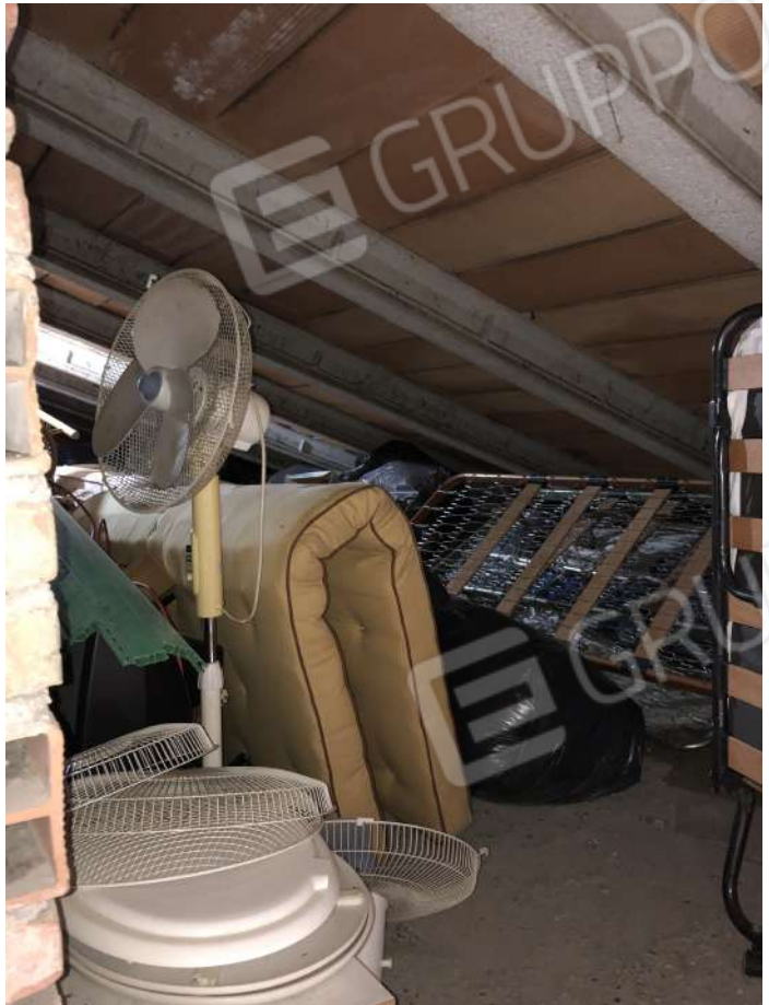
Foto 56- porzione sottotetto