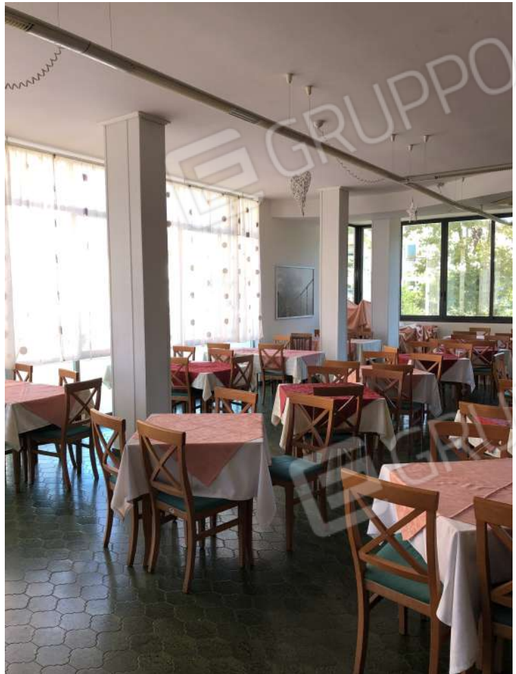
Foto 24- Sala da pranzo