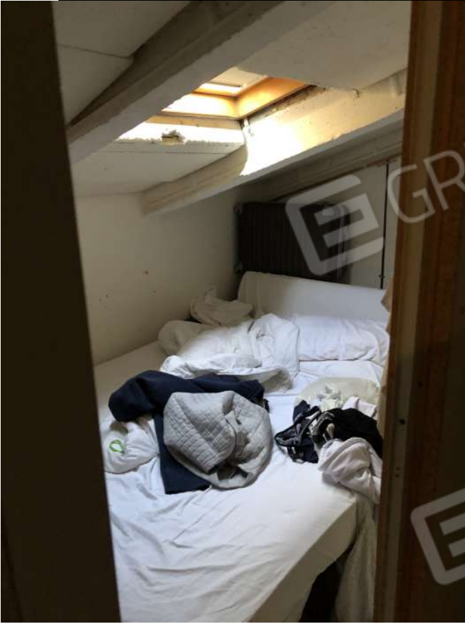
Foto 55- porzione adibita a camera