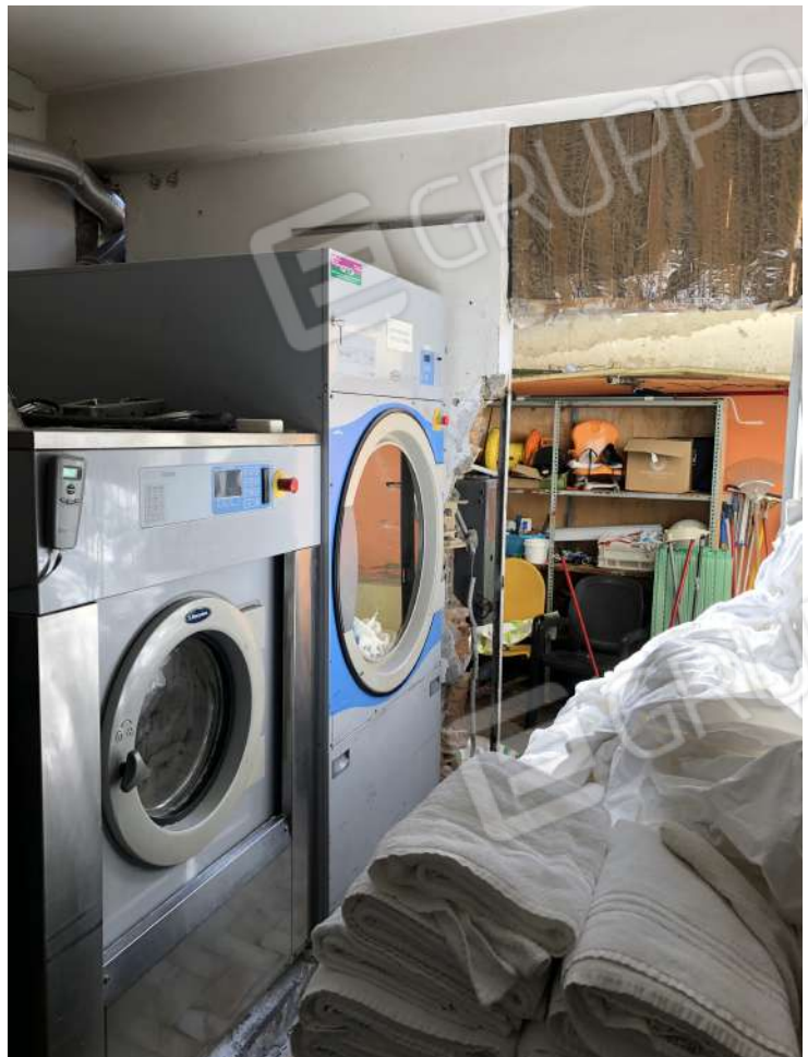
Foto 22- Locale di servizio - lavanderia