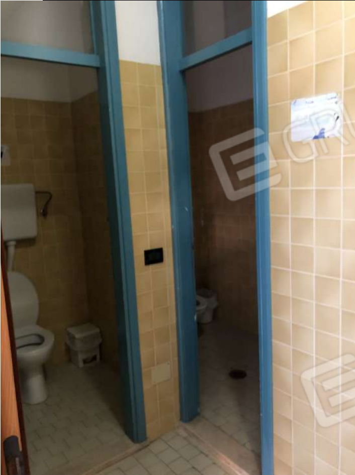
Foto 13- bagni ospiti