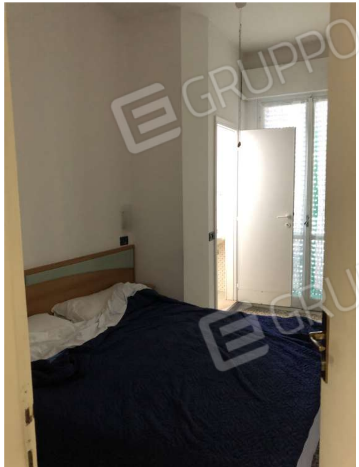
Foto 44- camera tipo 2