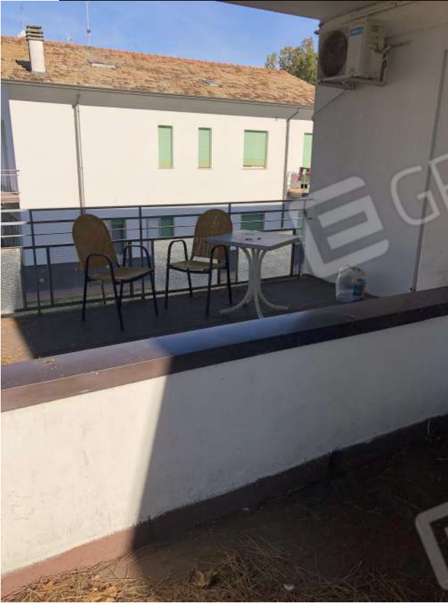
Foto 35- balconi camere sul retro