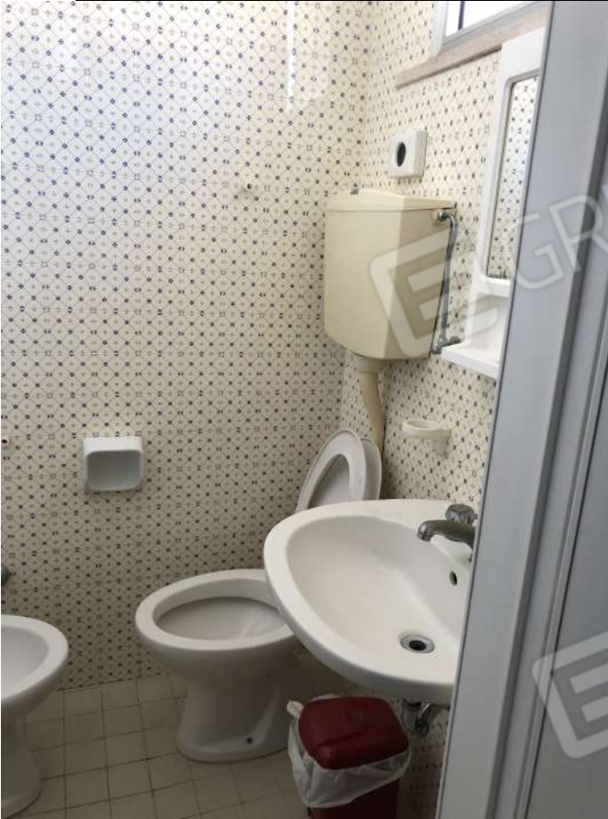
Foto 45- bagno camera tipo 2