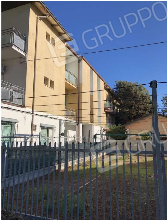
Foto 4- Prospetto sud-est