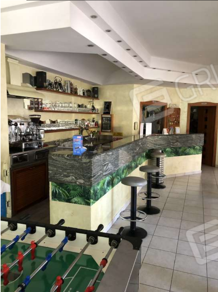
Foto 11- sala bar e reception