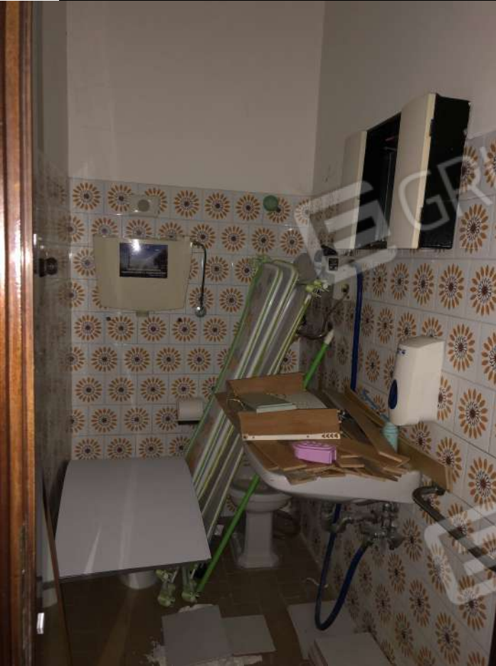
Foto 43- bagno non funzionante