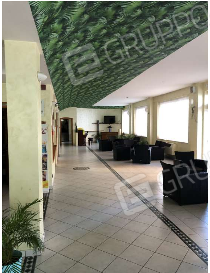
Foto 10- Hall/soggiorno