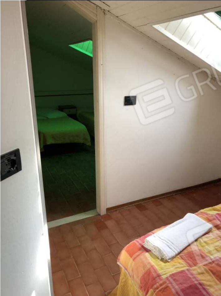
Foto 51- Dettaglio camere