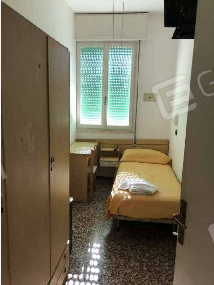
Foto 33- Camera tipo 2