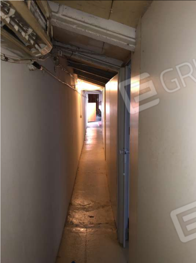
Foto 53- secondo tratto corridoio