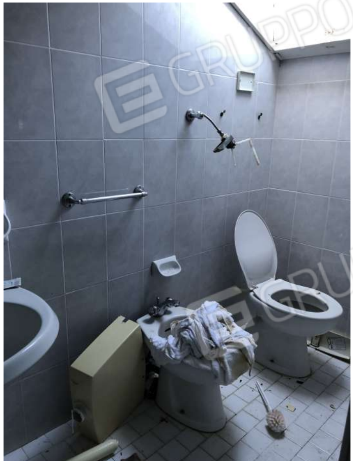
Foto 52- Altro bagno tipo