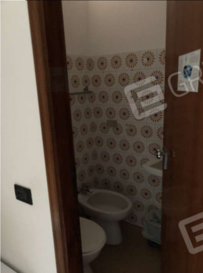
Foto 31- Bagno Camera tipo 1