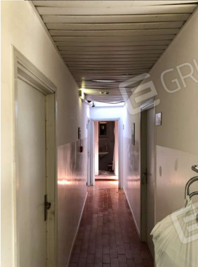
Foto 47- corridoio centrale