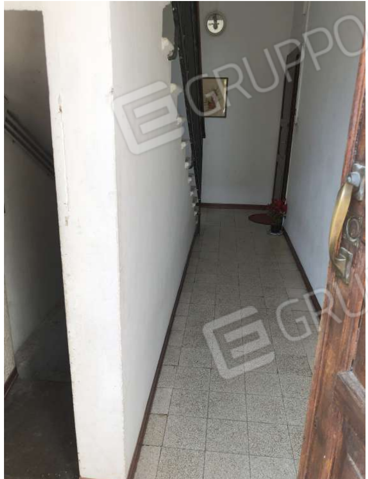
Foto 6- Androne comune