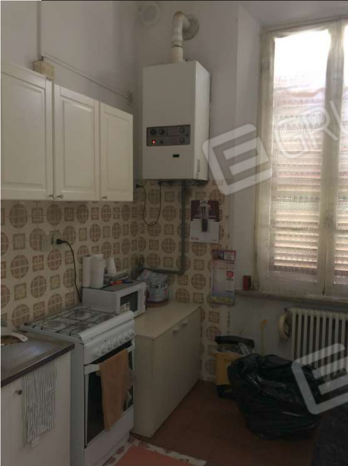
Foto 9- Sub.1 - cucina