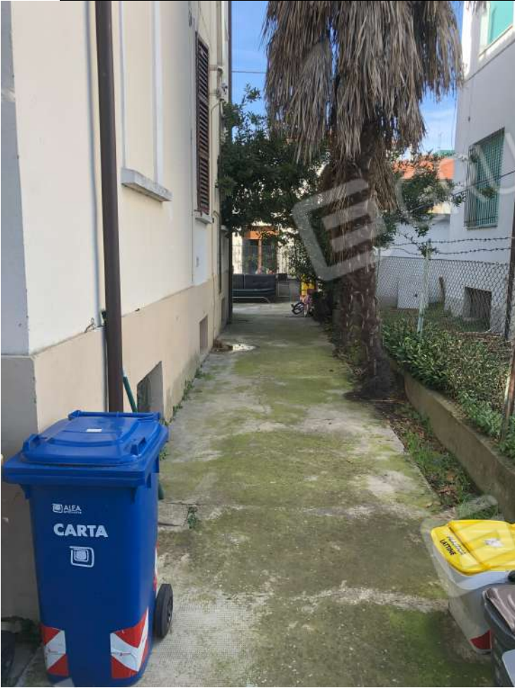
Foto 3- corte comune