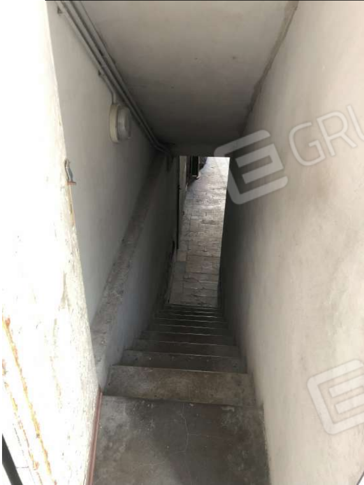
Foto 7- scala interna comune al seminterrato