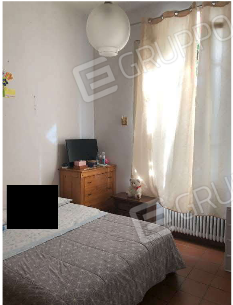
Foto 10- Sub.1 - camera da letto