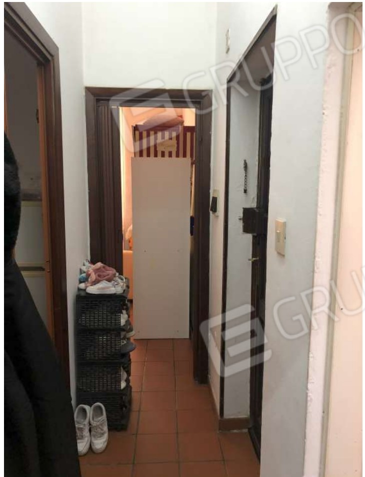
Foto 8- Sub.1 - disimpegno/ingresso