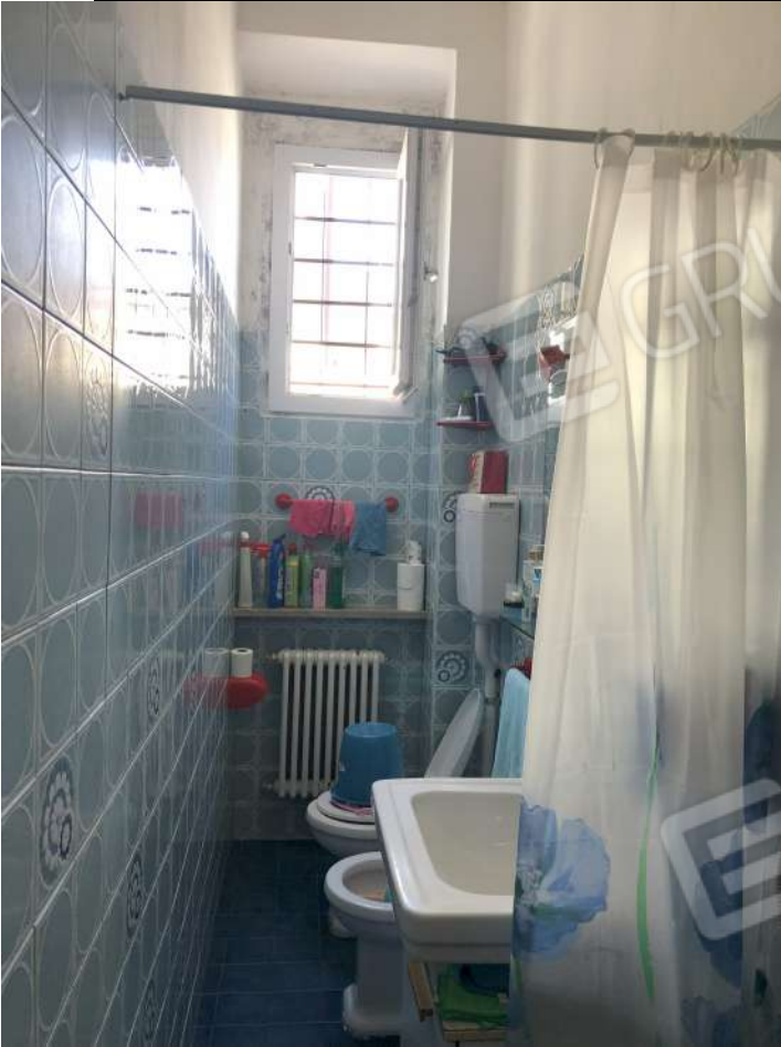
Foto 11- Sub.1 - bagno