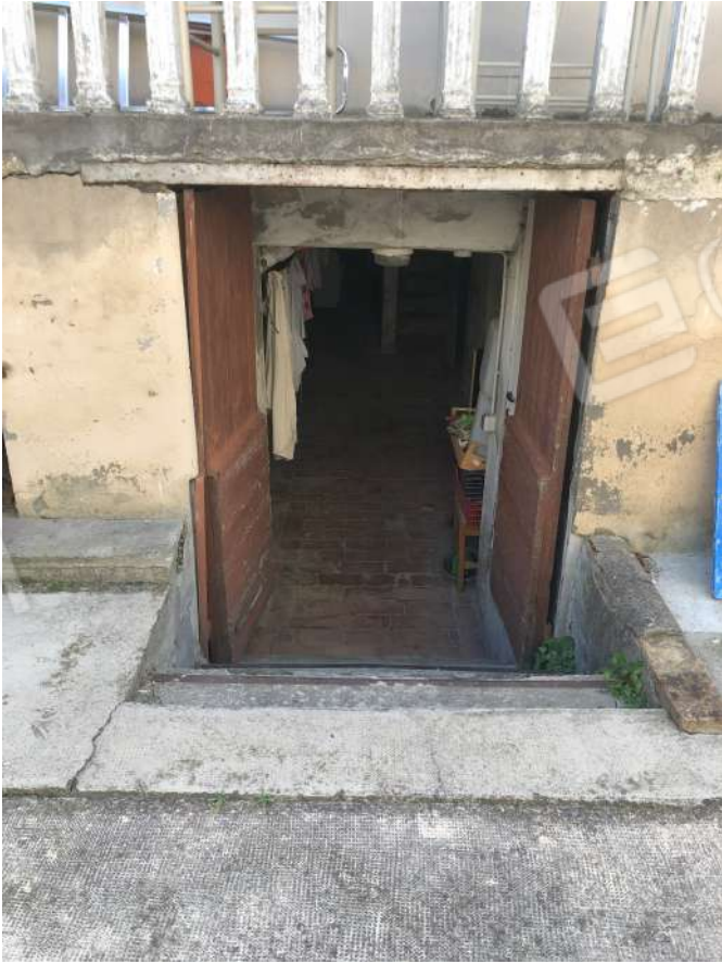
Foto 5- Accesso esterno al piano seminterrato