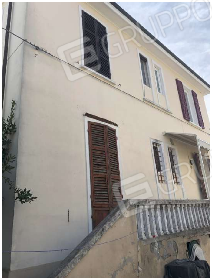
Foto 4- retro prospetto