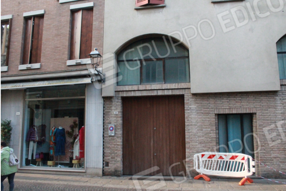
Ingresso del fabbricato dalla pubblica Via delle Torri