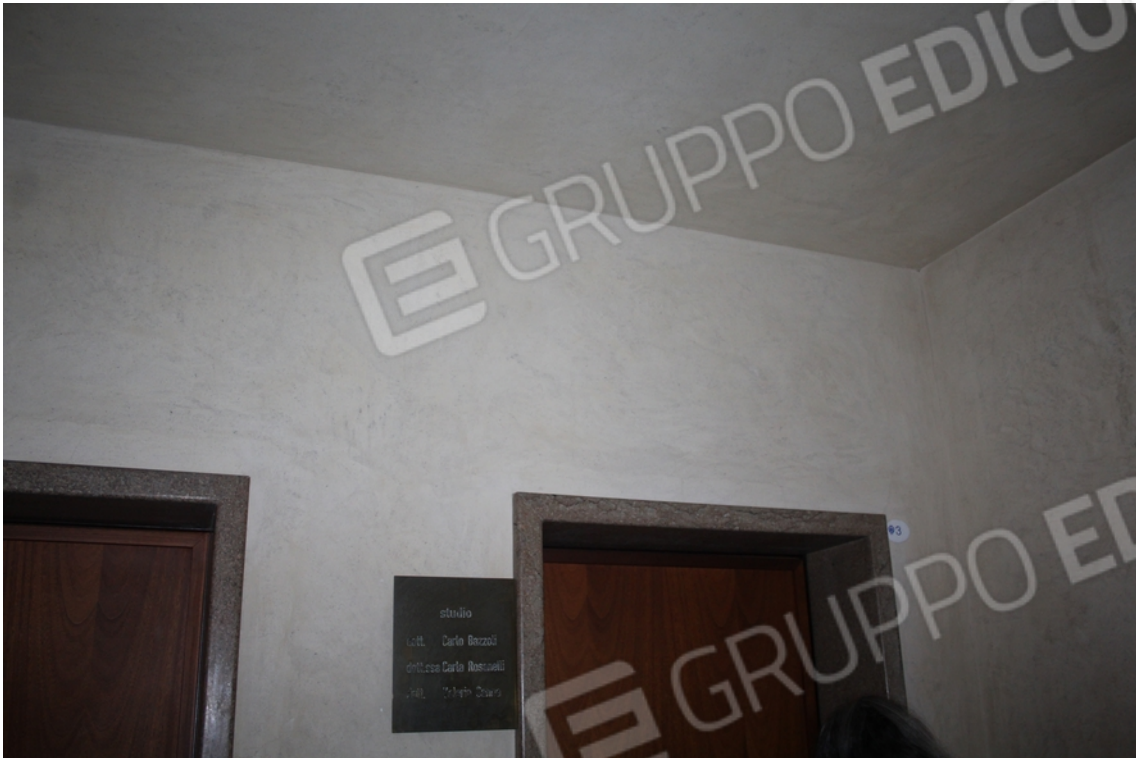
ingresso studio piano primo interno 3