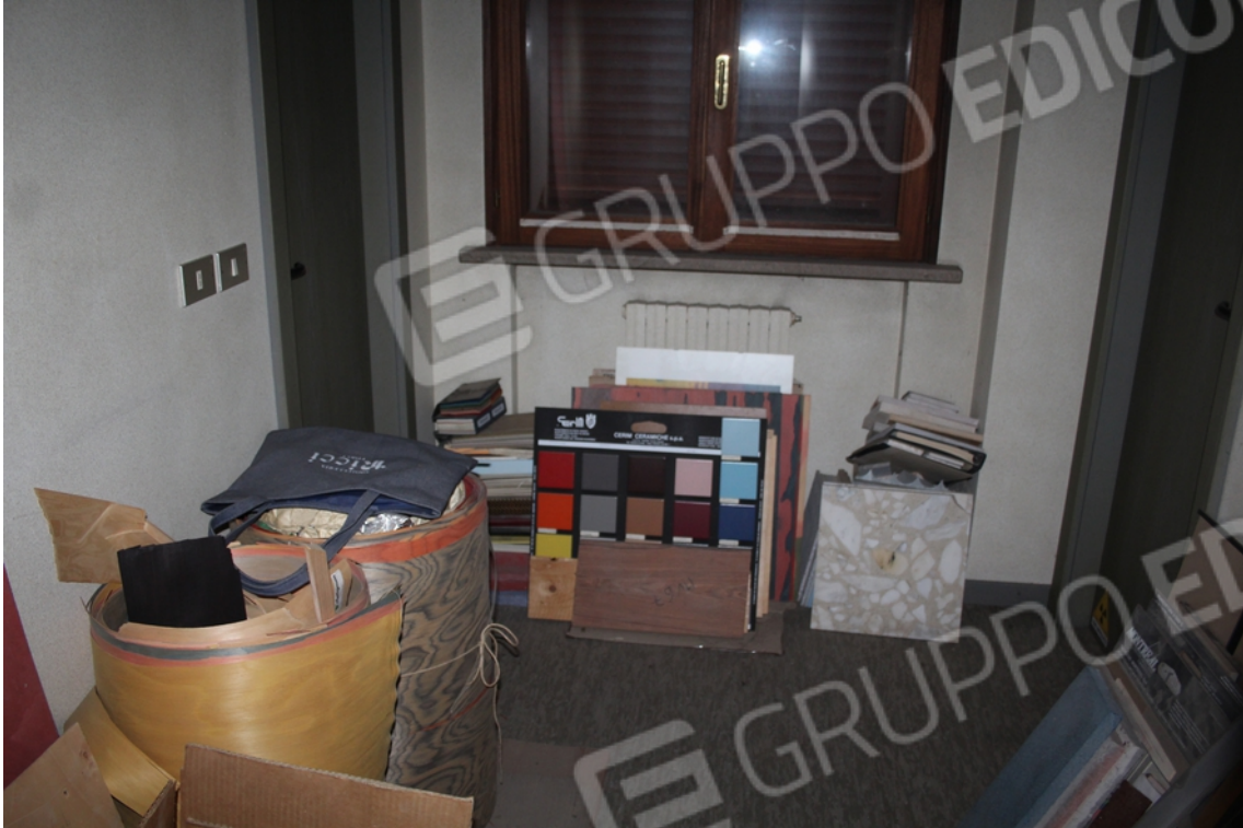
vano ex sterilizzazione