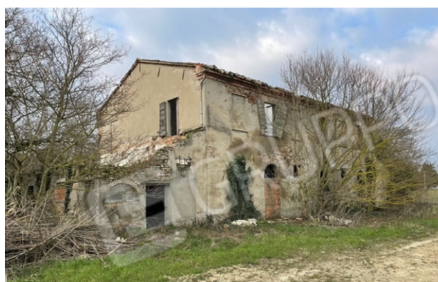
la casa - lato Sud