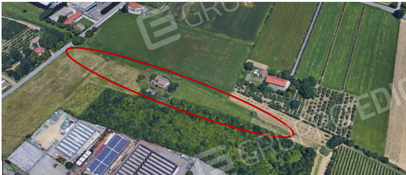
Forlì – vista satellitare "Villa Fronticelli"

Comparto: "Villa Fronticelli e Scolo Ausa" - Ampliamento Mattei 1 Ovest – Tav. P29