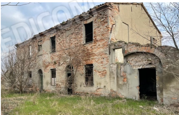
la casa - lato Nord