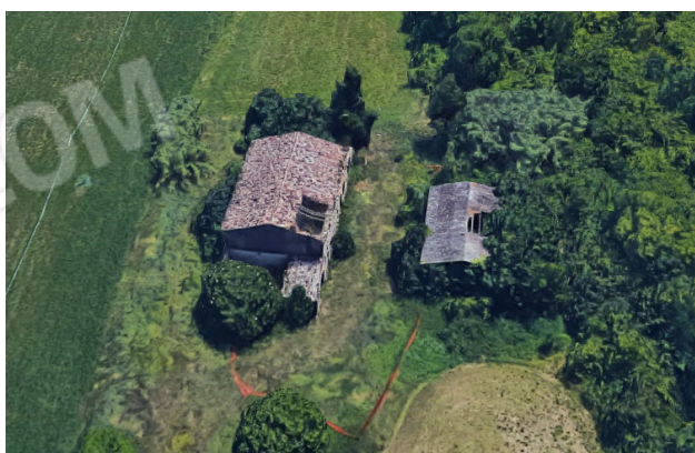
Villa Fronticelli – la casa e il fienile