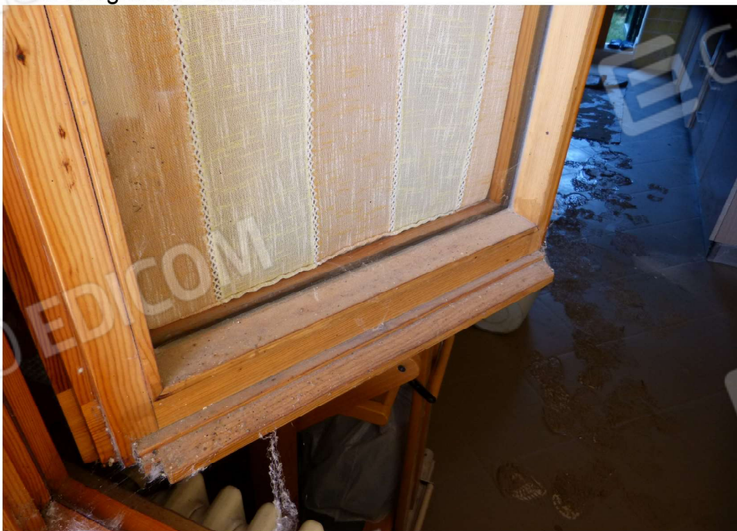
particolare infissi esterni