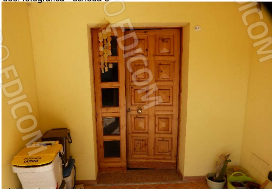
vista portoncino di ingresso