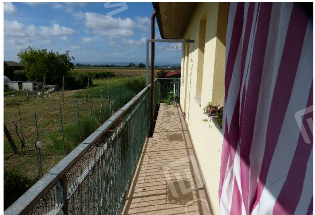
locali al piano primo