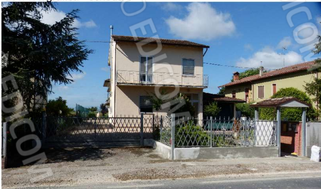
vista esterna accesso carrabile e pedonale