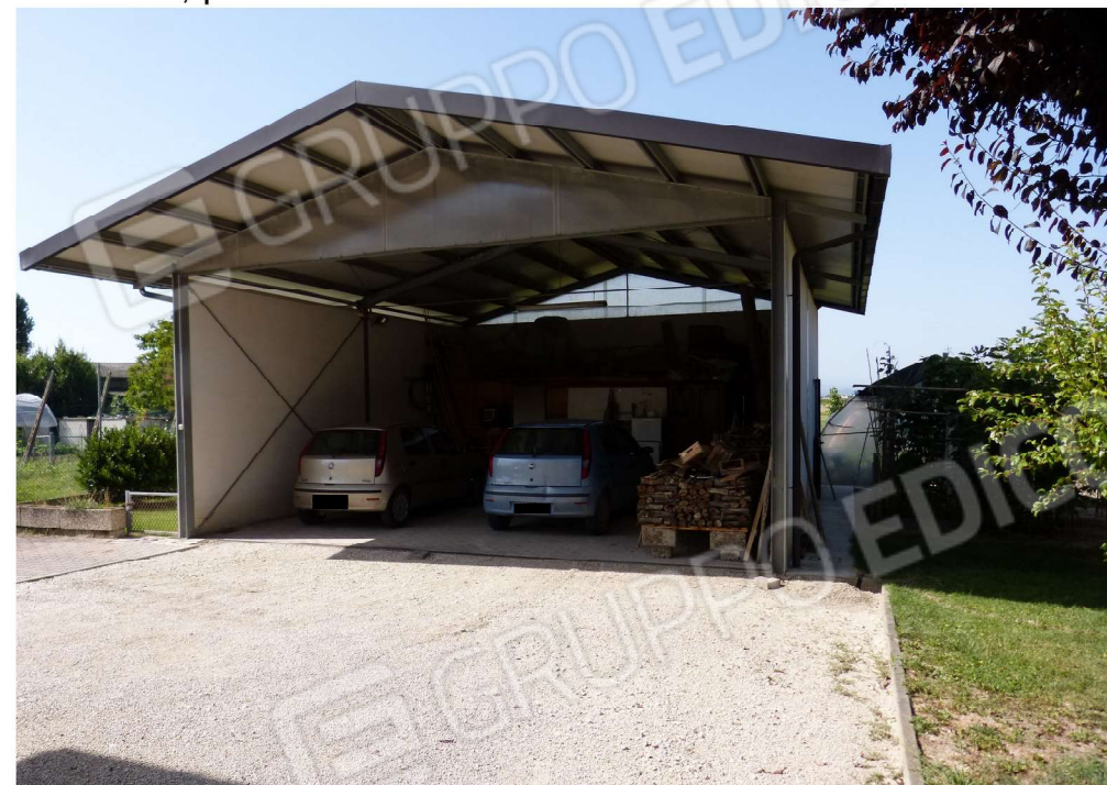
vista autorimessa lato sud (n.b.esclusa dal pignoramento)