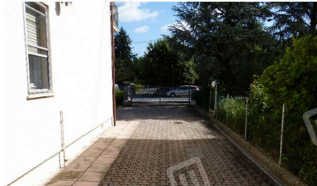
vista esterna viale di accesso carrabile e pedonale