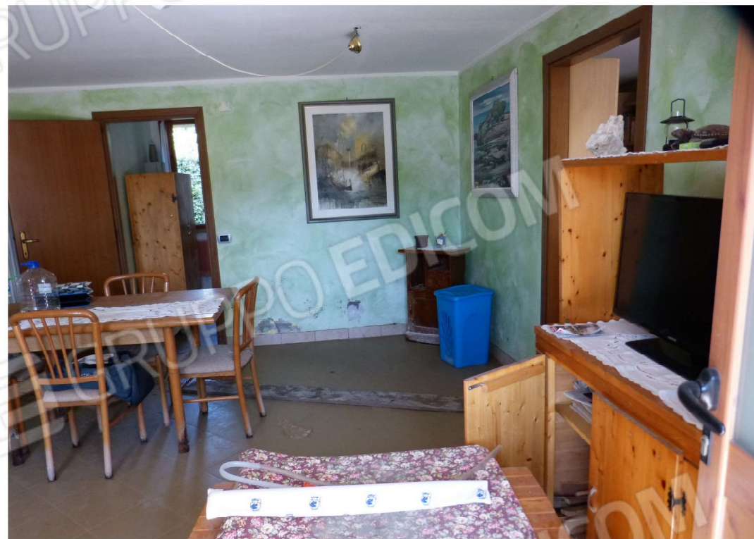
locale interno, piano terra