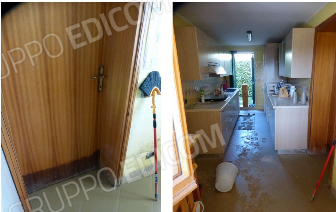
porte piano terra, degradate causa alluvione