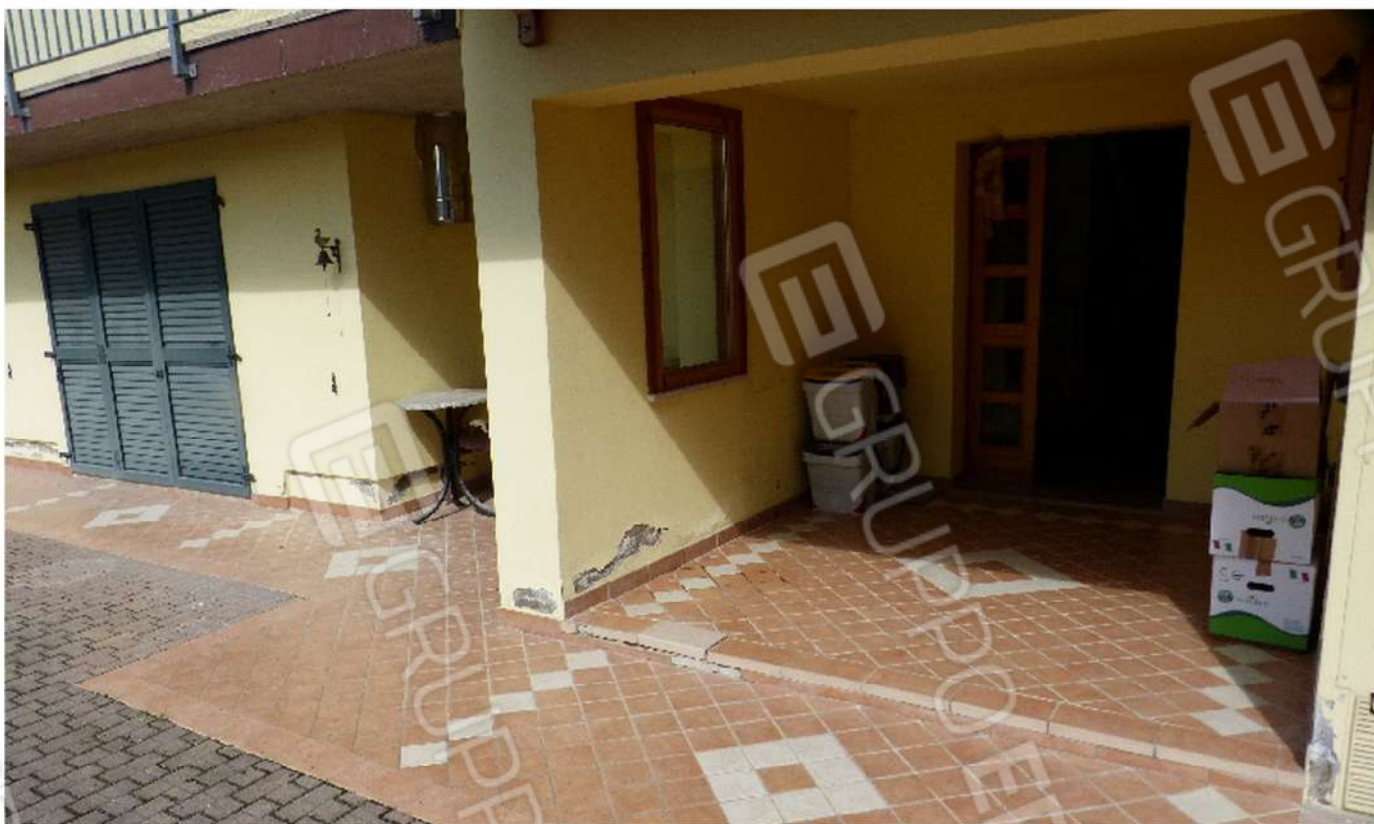
vista esterna ingresso alla abitazione ed ai servizi