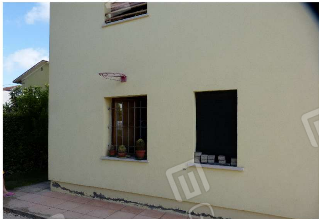
vista esterna fabbricato