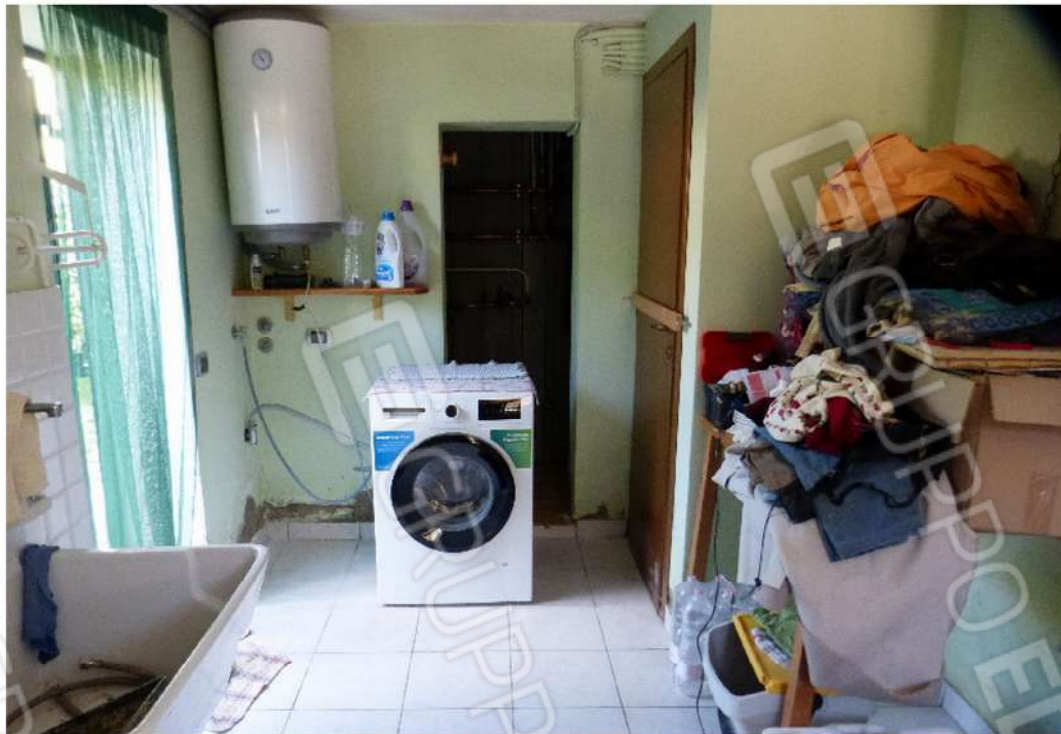
locali di servizio al piano terra