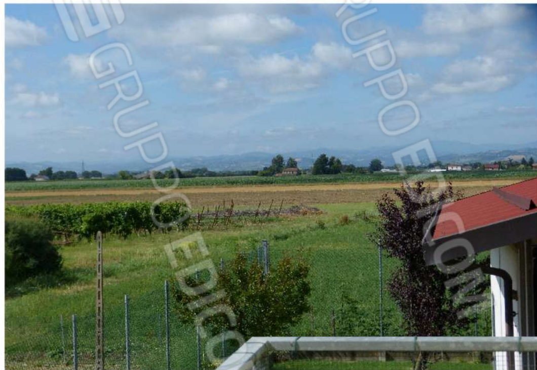
confine lato sud ovest