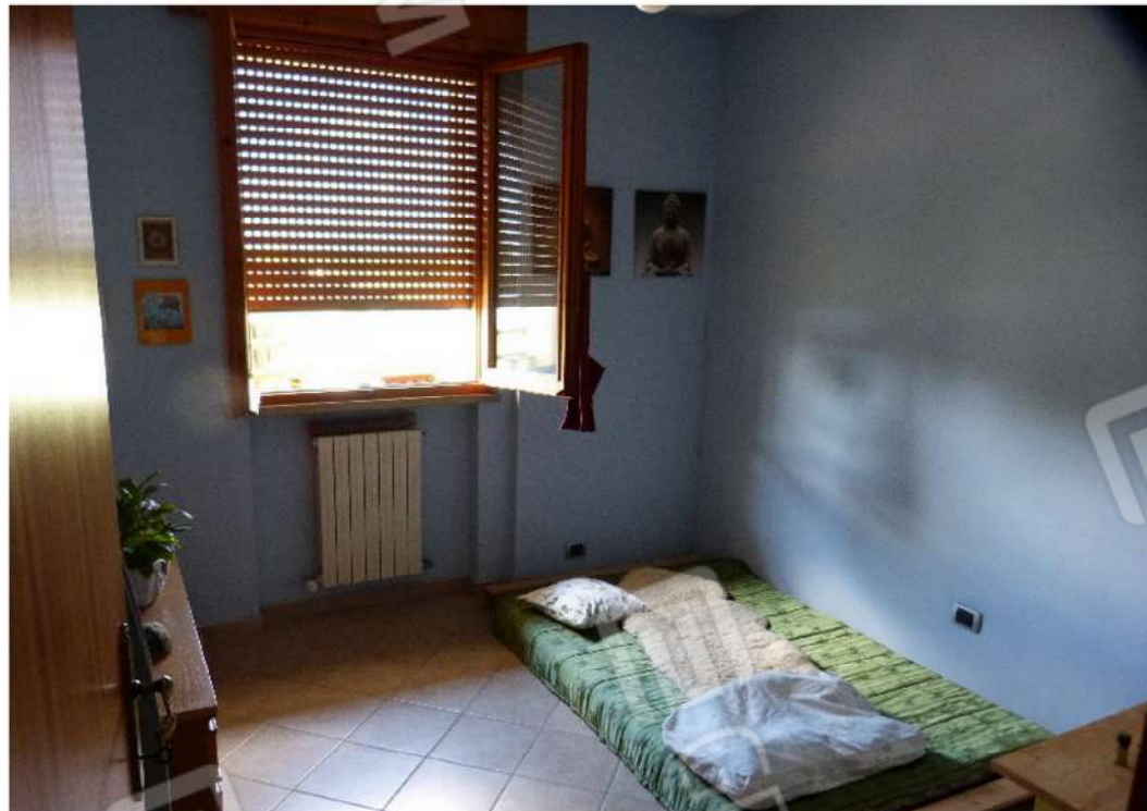
locali al piano primo