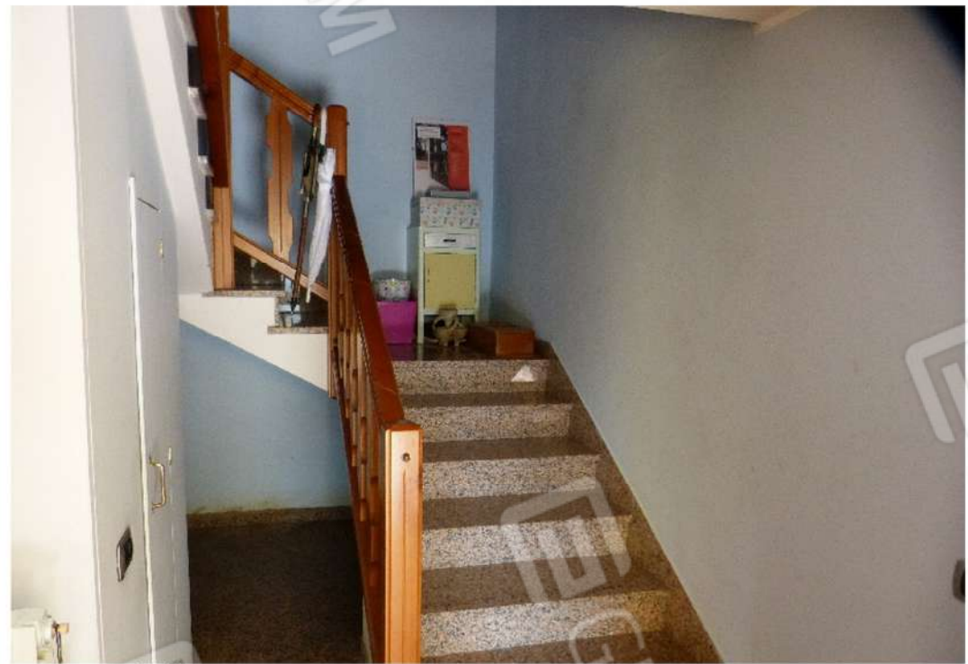
vano scale interno