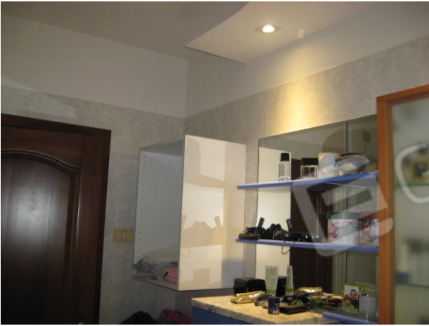
Bagno e camera da letto (piano primo)