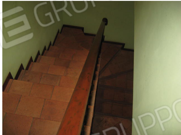
Arco a tutto sesto nel vano soggiorno-pranzo e scala dal piano primo