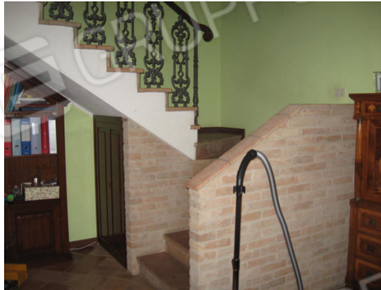
Cucina/attrezai in scorcio l'accesso alle scale per la cantina e porta per il portico esclusivo. Particolare scala accesso al piano primo