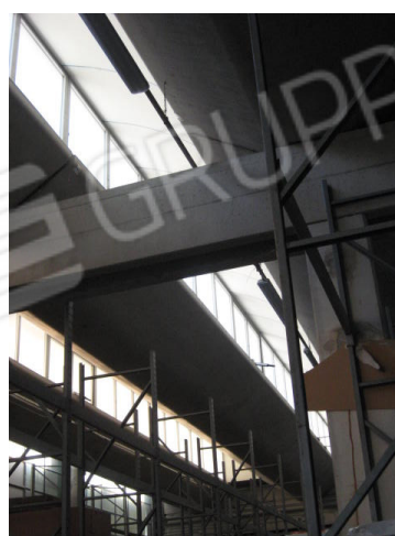
Vista interna del