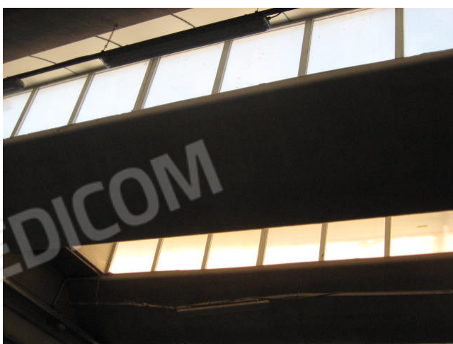
Shed/copertura corpo centrale