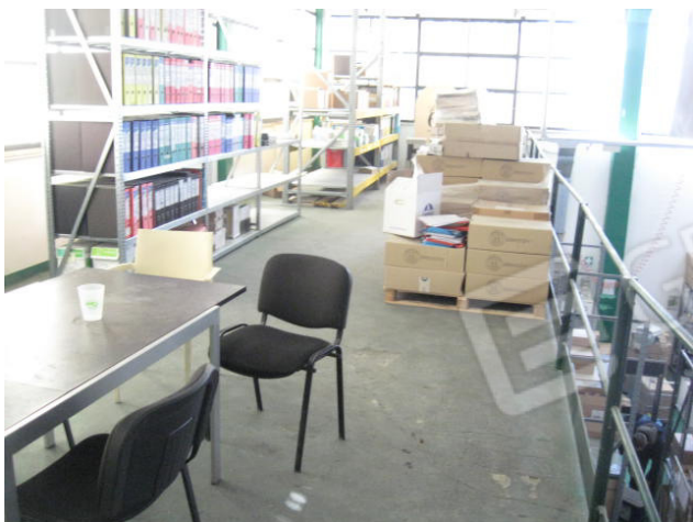
soppalco e particolare uffici/spogliatoi