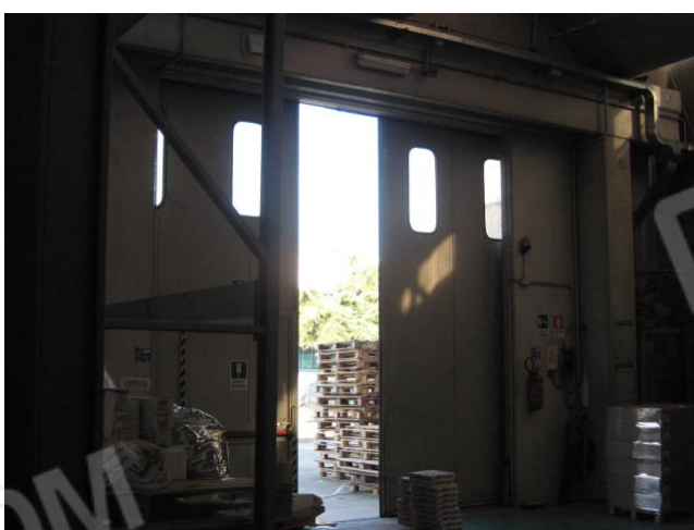
corpo centrale e copertura