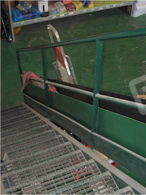
accesso sottopiano e particolare ammaloramenti soffitto