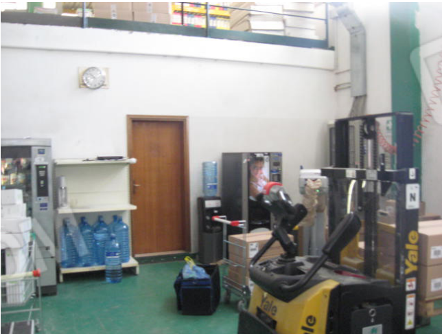
uffici/spogliatoi e particolare servizi igienici