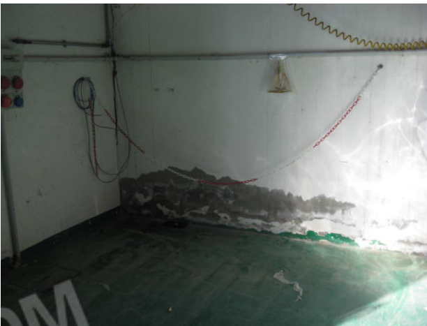
particolare ammaloramento da umidità e pavimento adiacente zona di uscita