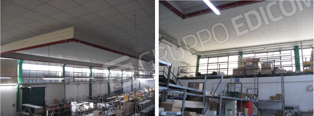
Panoramica edificio tangente ad altra proprietà e vista del soppalco (lato sud est)