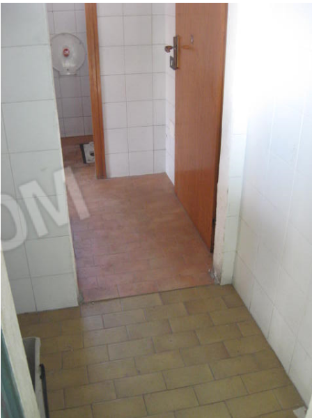
igienici e zona uffici/spogliatoio