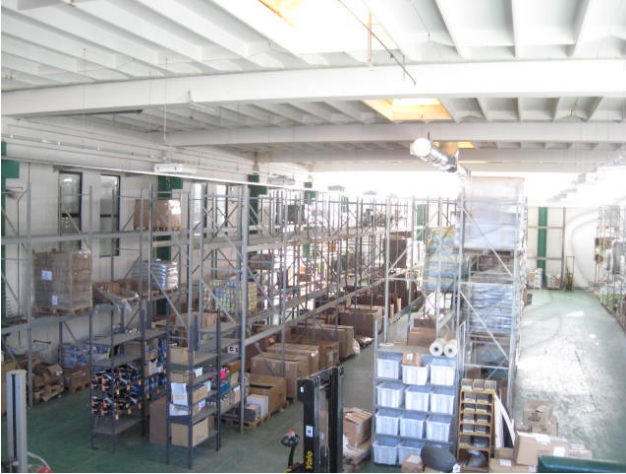
Panoramica e particolare elemento di riscaldamento