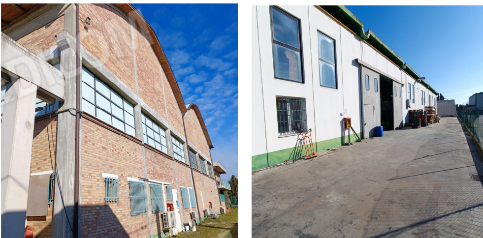
Sud est e scorcio lato ovest