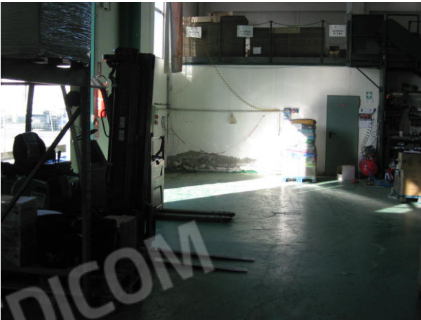
Porzione zona soppalco della zona a ovest e particolare della copertura e lucernario