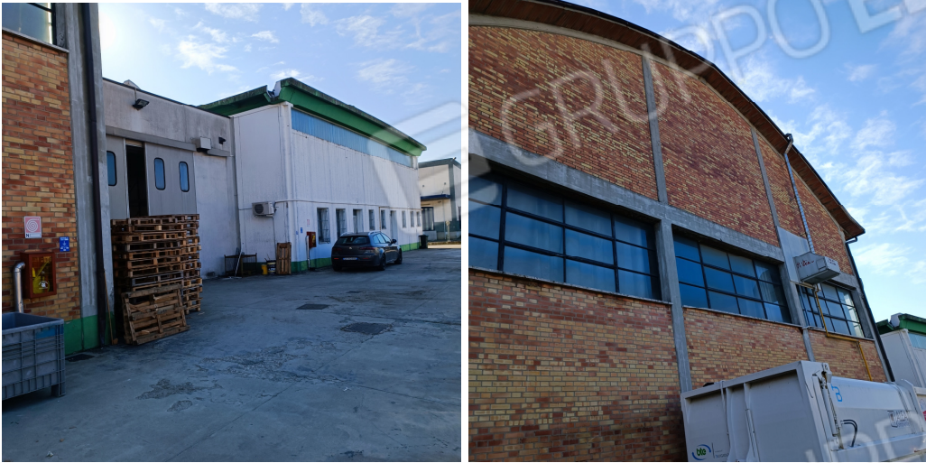
Scorcio lato nord ovest