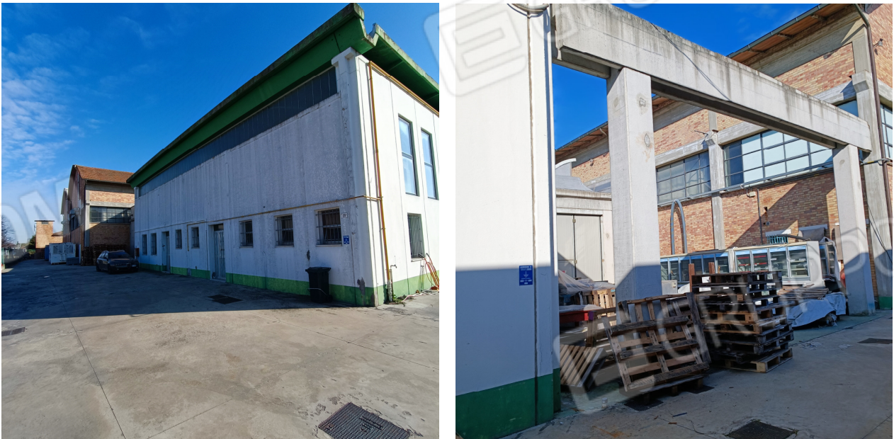
Scorcio fianco nord ovest e particolare sud est