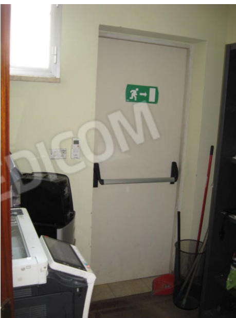
uffici/spogliatoi e attraversamenti tra capannoni