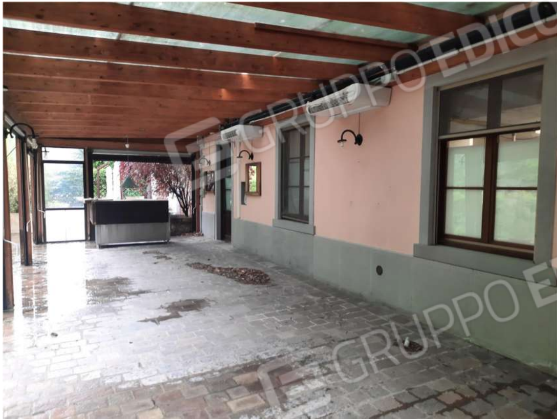
26 – PT- VERANDA ESTERNA