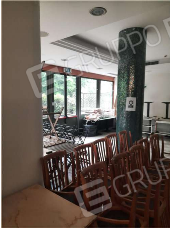
13 - PT - SALA DA PRANZO