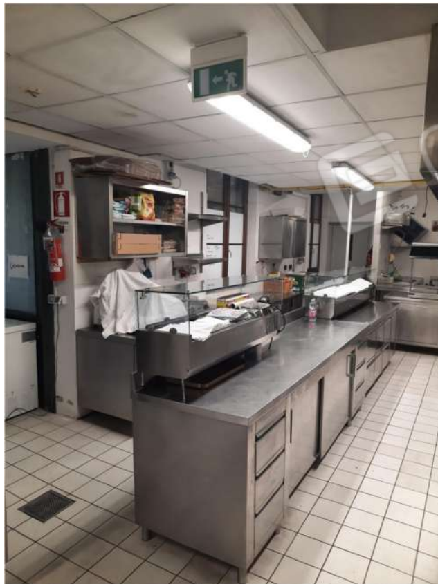
14 - PT - CUCINA