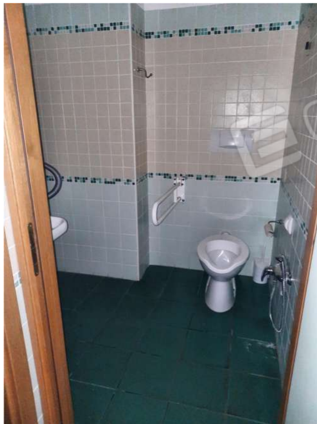
18 – PT – SERVIZI IGIENICI