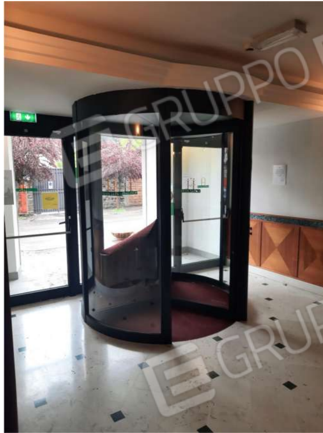
24 – PT – BUSSOLA D'INGRESSO