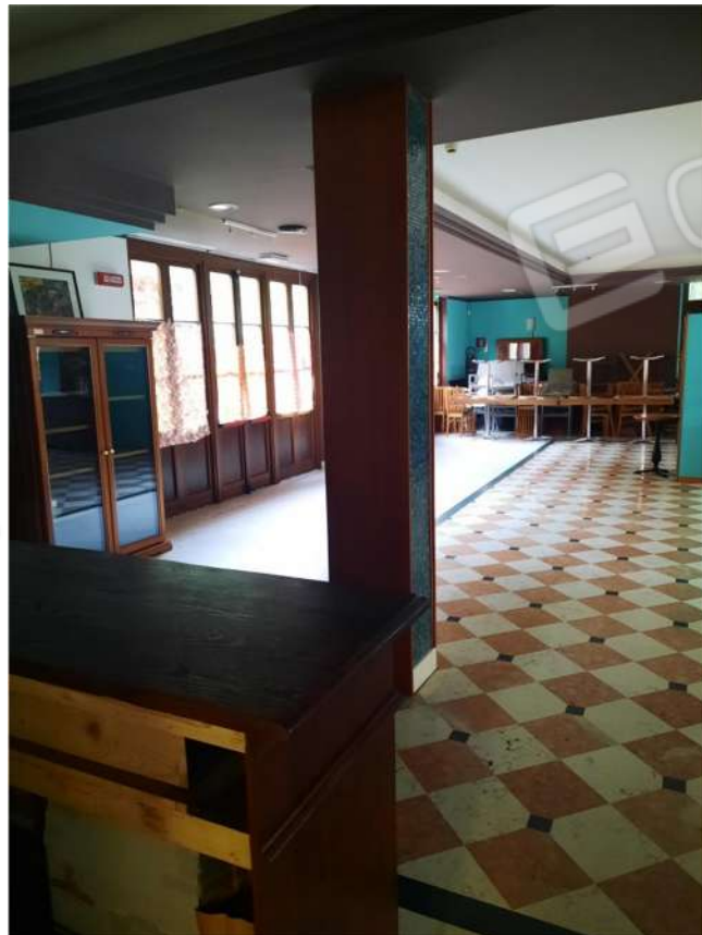
16 – PT – SALA DA PRANZO