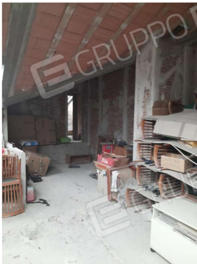
36 – P3- SOTTOTETTO (SUB.5) IN RISTRUTTURAZIONE