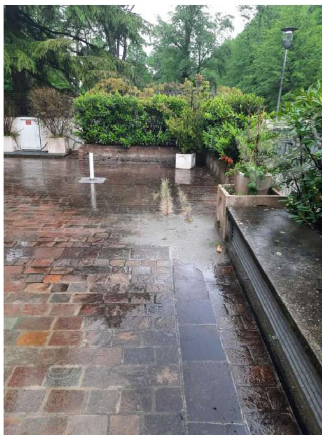
4 – VISTA ESTERNA Area esterna retro