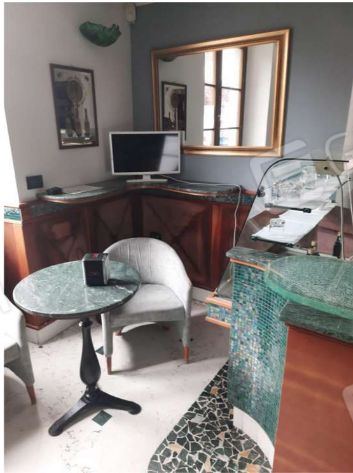
10 - PT - SALA BAR