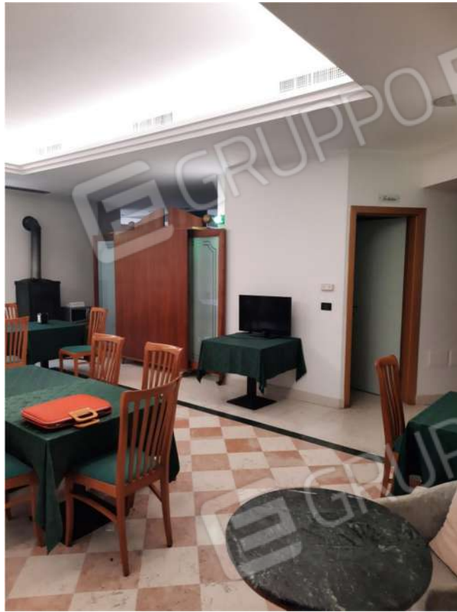
11 – PT – SALA COLAZIONI