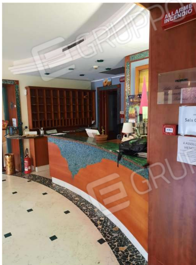
23 – PT – RECEPTION