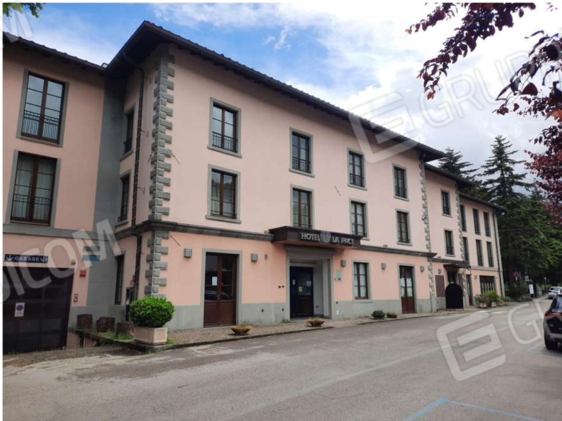
2 - VISTA ESTERNA Fronte principale