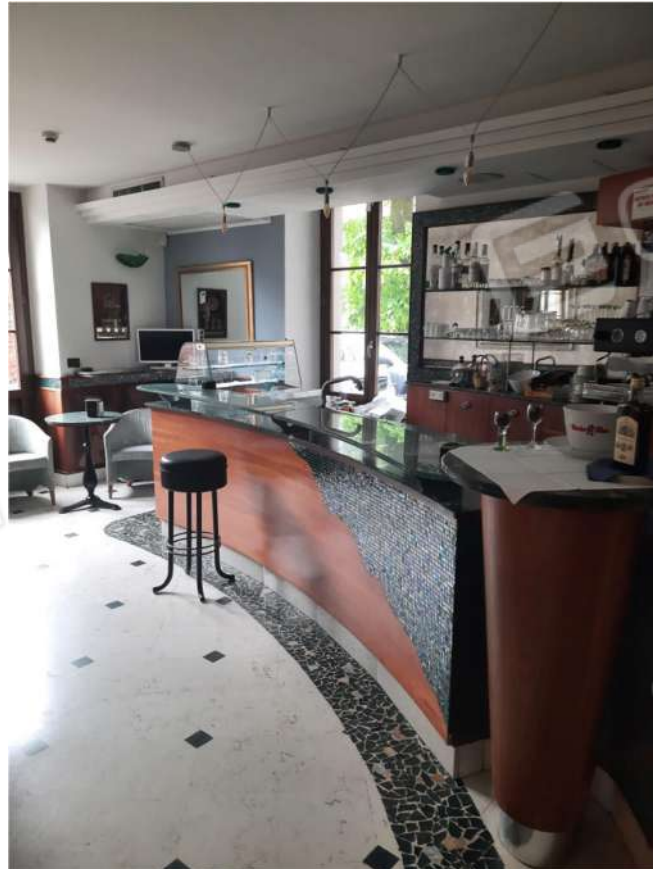
25 – PT- BAR