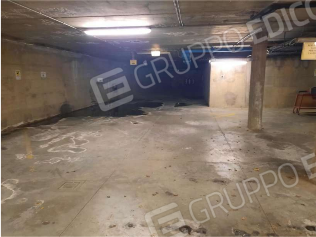
5 PS1 - AUTORIMESSA