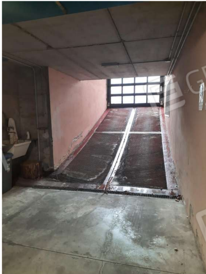
6- PS1 – RAMPA DI ACCESSO