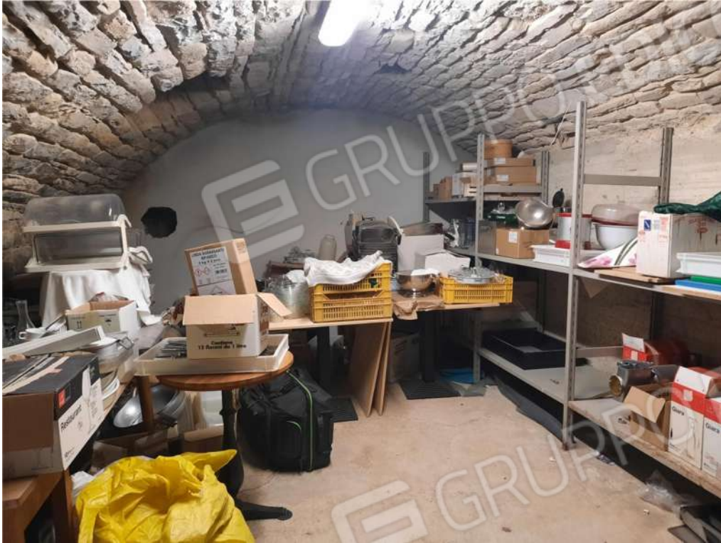
7- PS1 – RIPOSTIGLIO