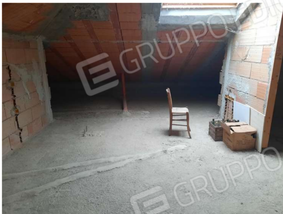
38 – P3- SOTTOTETTO (SUB.5) IN RISTRUTTURAZIONE