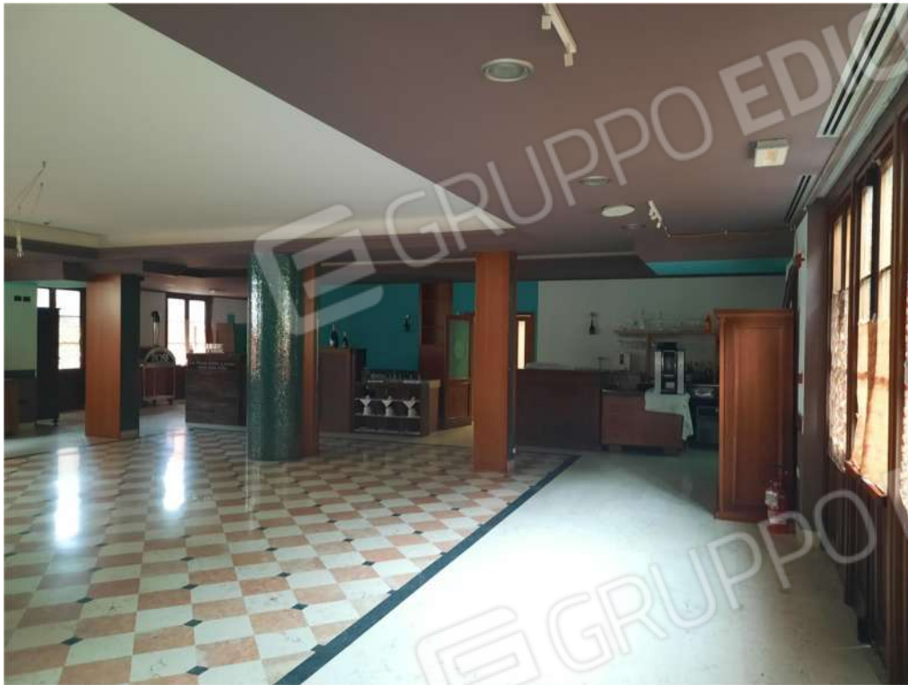
17 – PT – SALA DA PRANZO