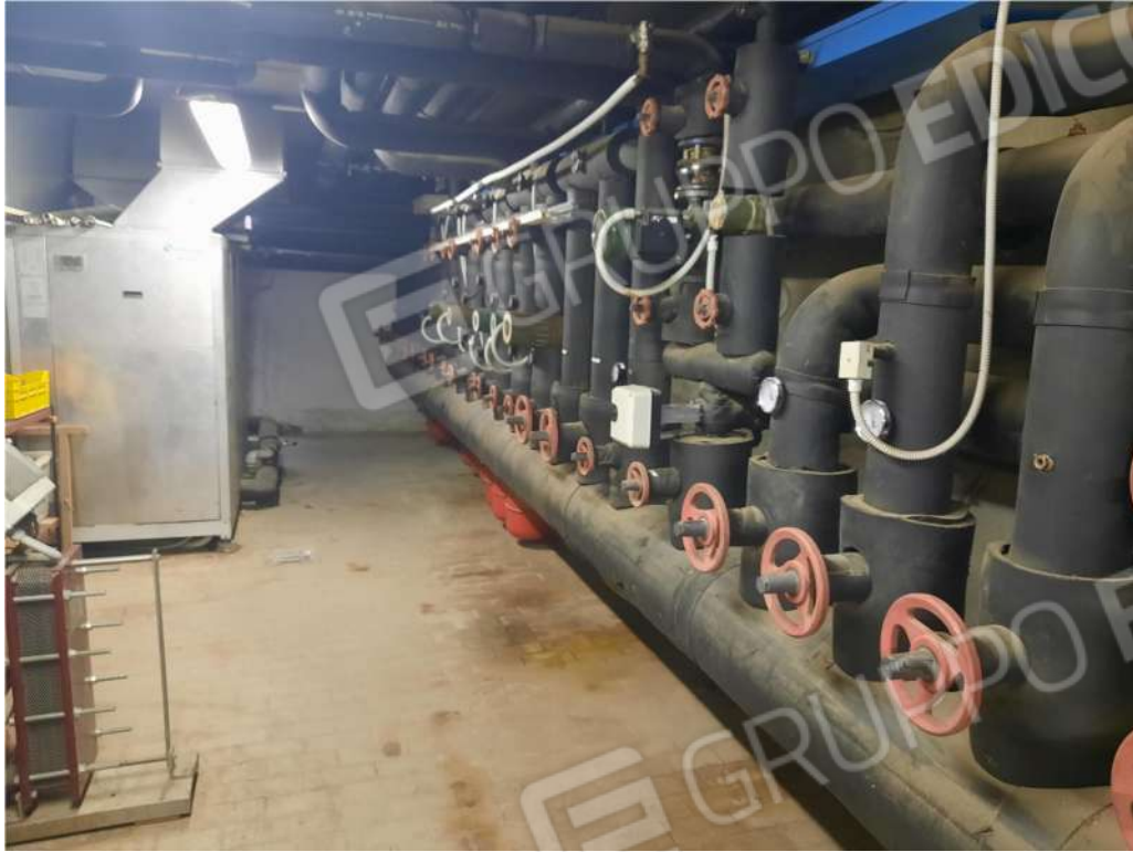
9- PS1 - C.T.