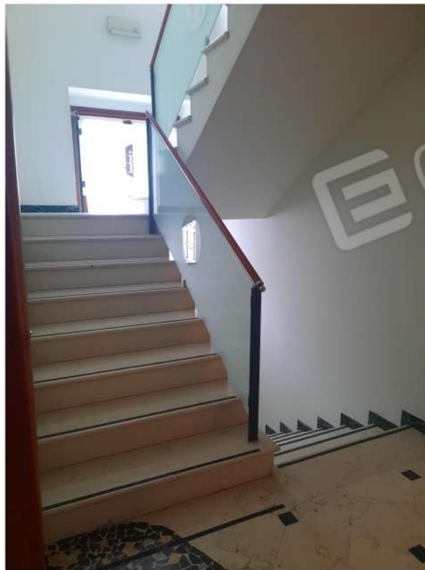
20 - PT - VANO SCALA