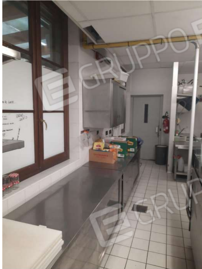
15 – PT - CUCINA