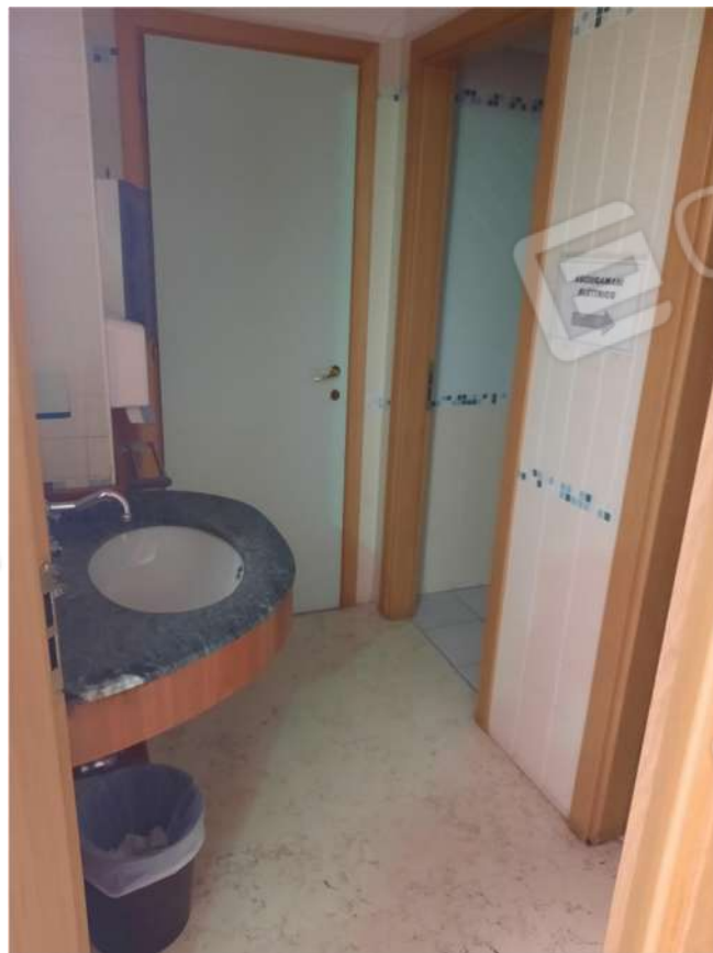
12 – PT – SERVIZI IGIENICI