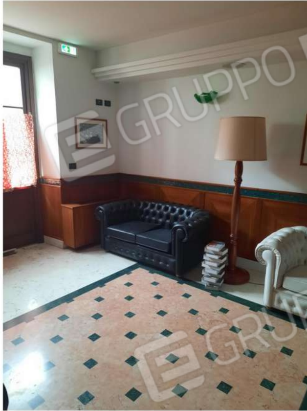
19 - PT - SALA LETTURA