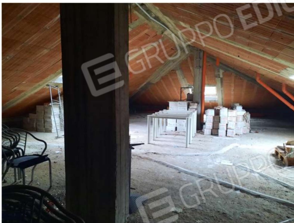
40 – P3- SOTTOTETTO (SUB.5) IN RISTRUTTURAZIONE