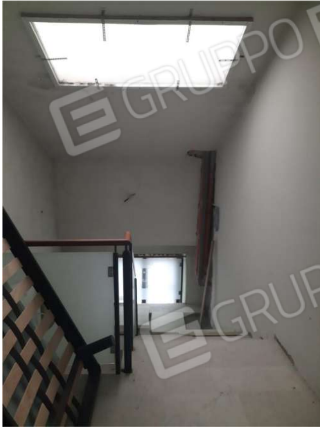
34 – P3 (SUB.5) - SCALA DI ACCESSO