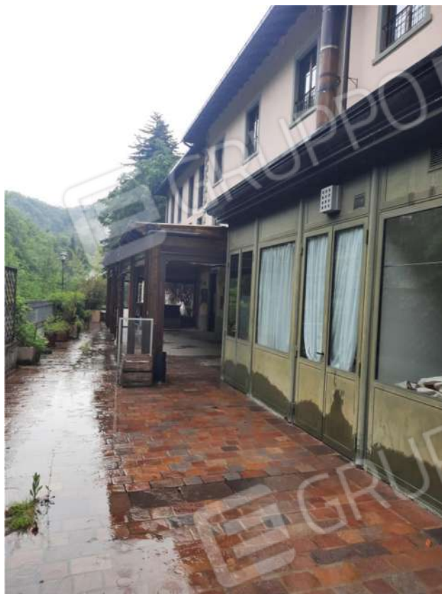
3 – VISTA ESTERNA Retro-prospetto ed area esterna