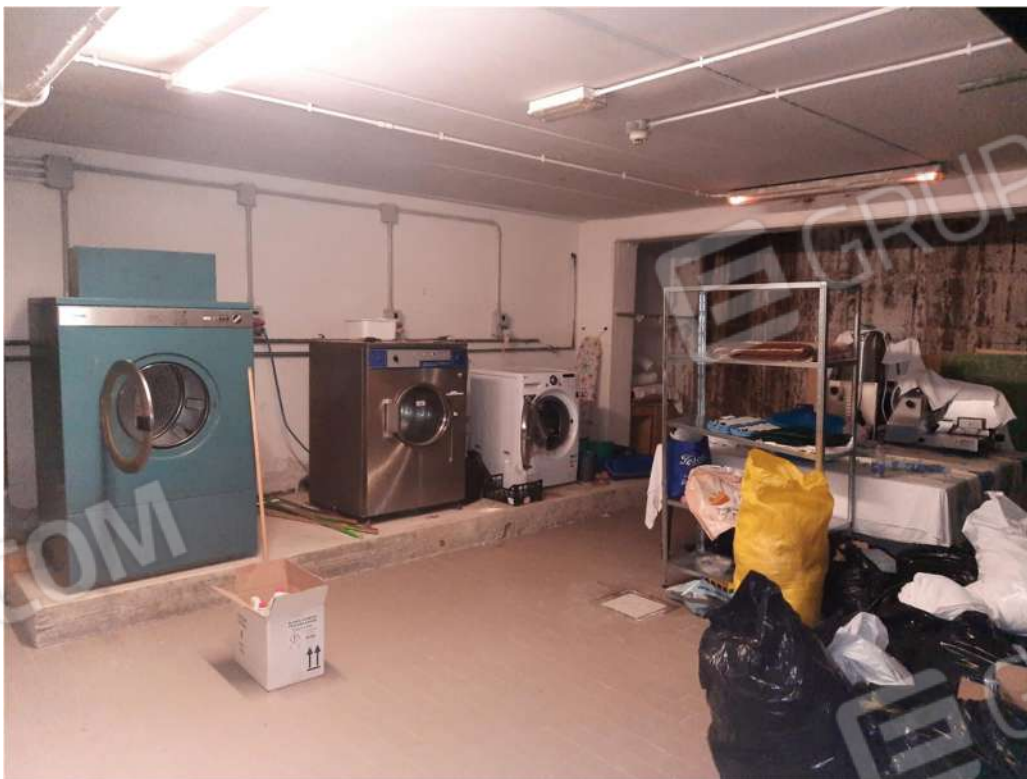
8 – PS1 - LAVANDERIA