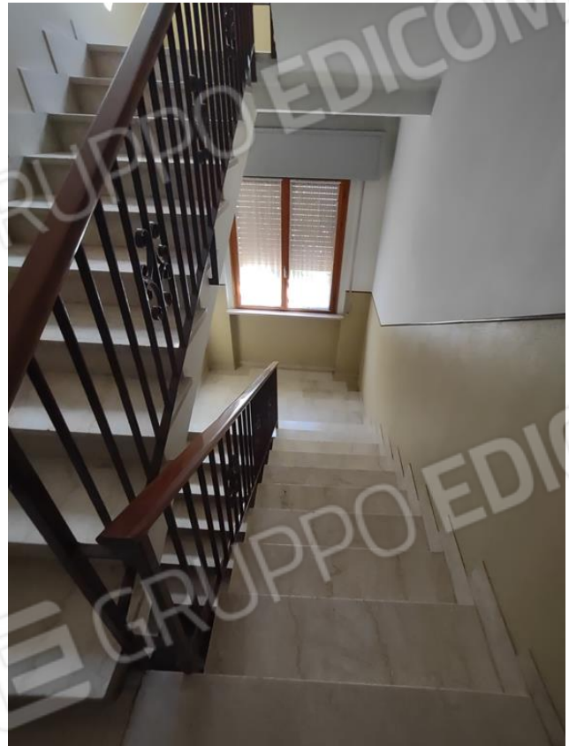
FOTO 7 e 8. La palazzina condominiale: il portoncino comune e le scale condominiali