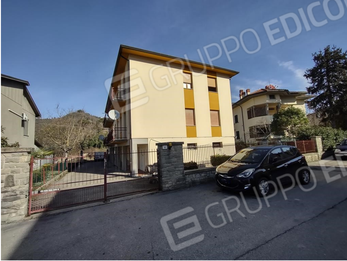
FOTO 1. La palazzina condominiale: prospetto laterale su Via XXV Aprile