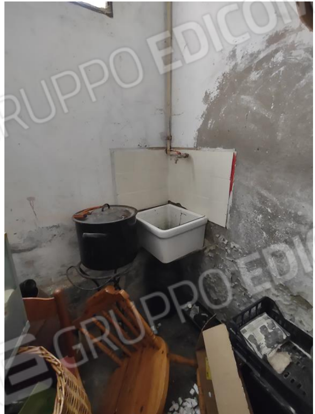
FOTO 20 e 21. La cantina