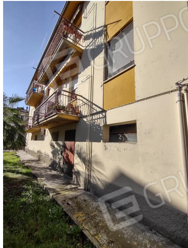
FOTO 5 e 6. La palazzina condominiale: il cancello pedonale d'ingresso alla corte e il retro