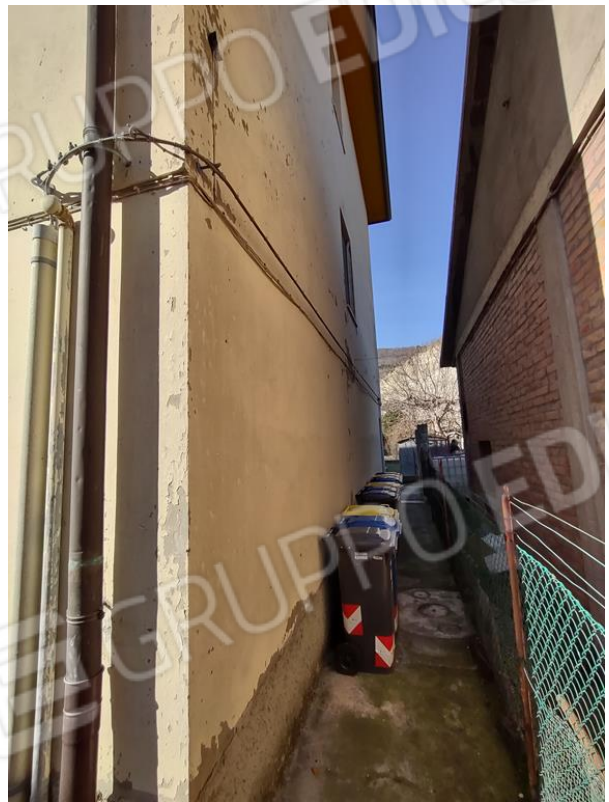
FOTO 3 e 4. La palazzina condominiale: il fronte e il prospetto laterale a confine con il LOTTO DUE