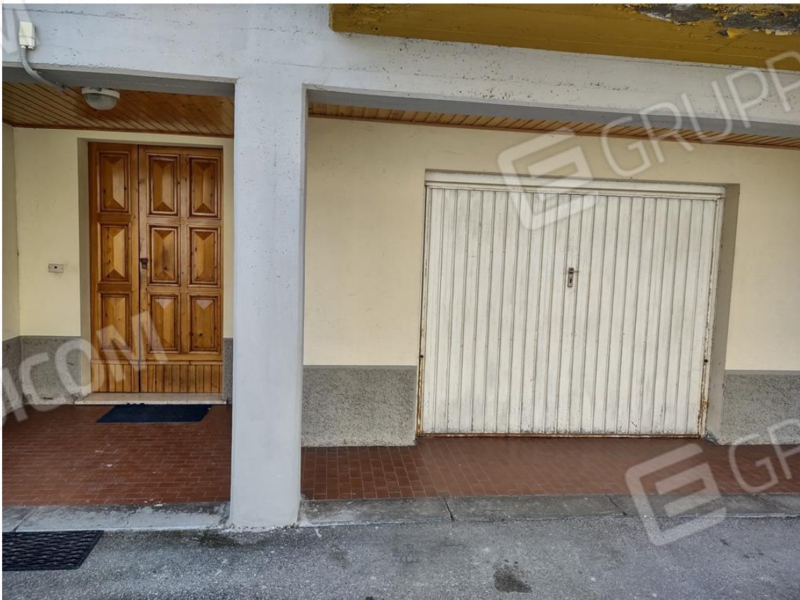
FOTO 22. Il garage