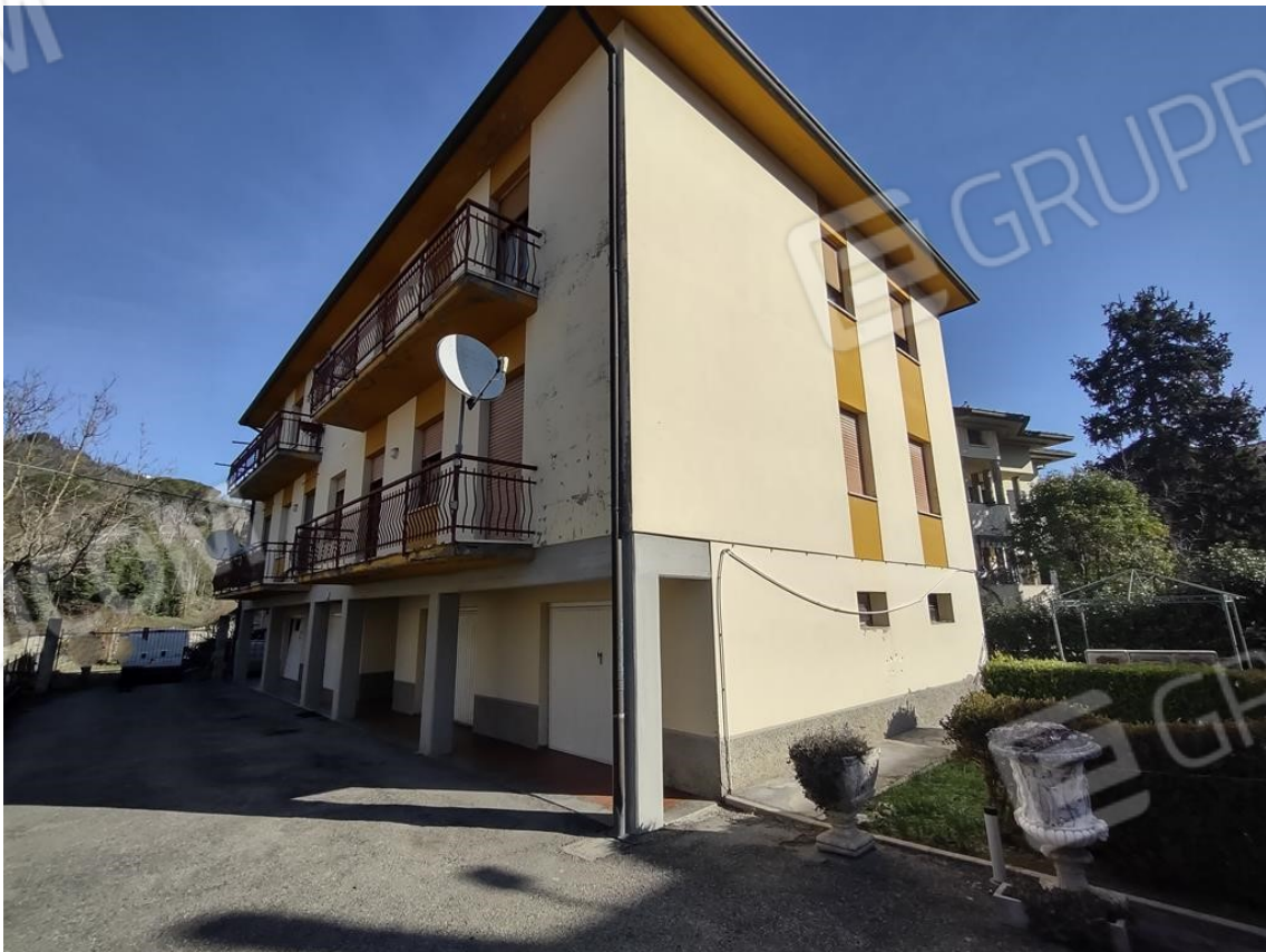
FOTO 2. La palazzina condominiale: il fronte con l'ingresso agli appartamenti