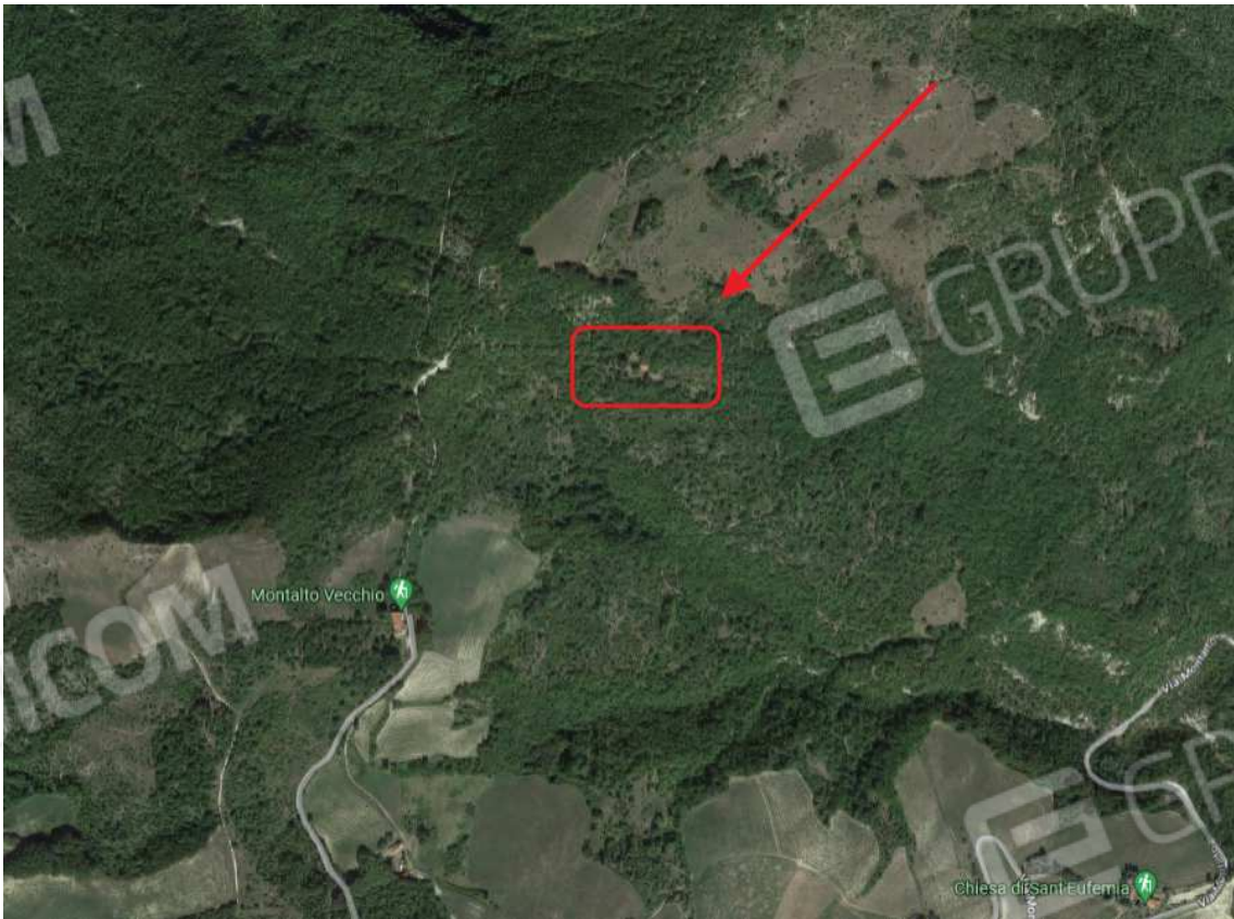
VISTA AEREA 2