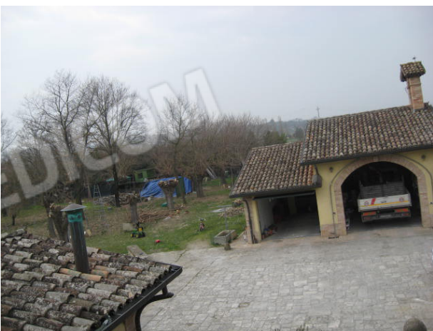
Vista esterna del garage esclusivo e deposito comune. Interno garage/attrezzaia