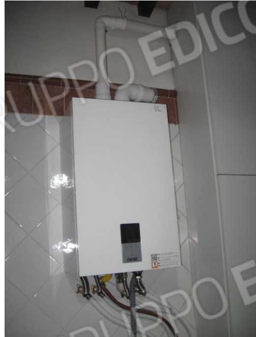
Bagno e caldaia per impianto di riscaldamento abitazione nel fabbricato autonomo (ovest9 di fronte all'ingresso abitazione)