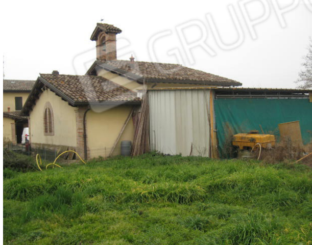
Manufatto realizzato sul lato posteriore del fabbricato a servizi