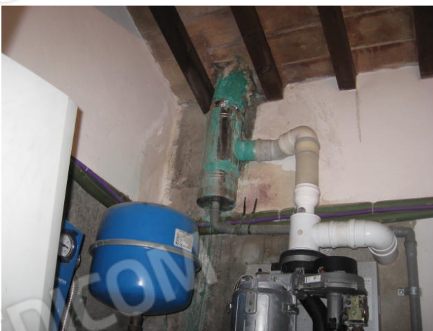
Zona centrale termica nel manufatto autonomo (ovest) e bagno