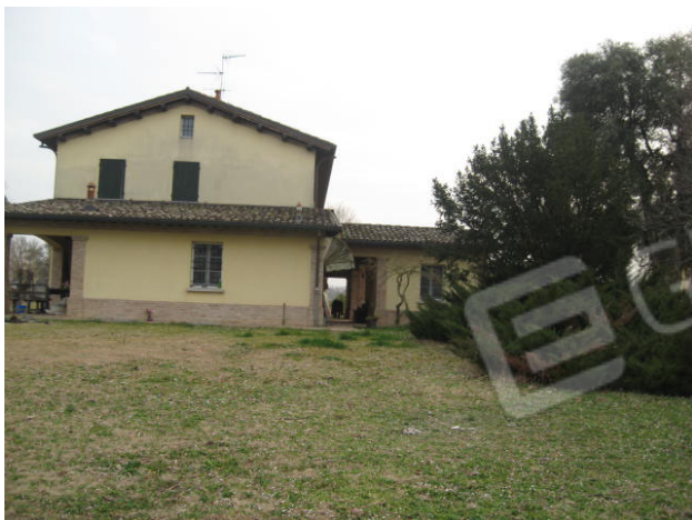
Prospetto nord e corpi autonomi e portico (ovest)