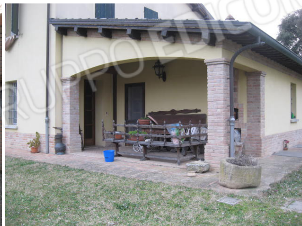
Accesso su via Monda e prospetto est. Scorcio parziale nord est