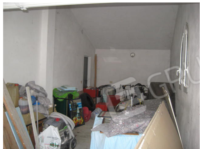
Porzione esterna del fabbricato di pertinenza delle abitazioni con vista ingresso garage/attrezzaia e interno autorimessa