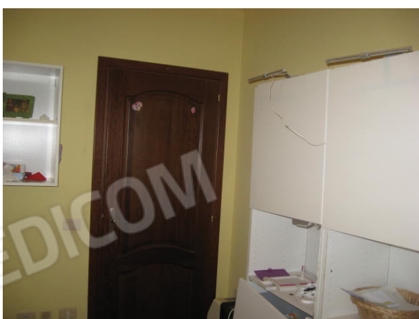
Camere da letto (piano primo)