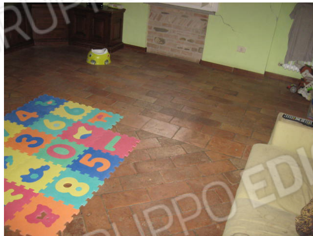
Ingresso al soggiorno-pranzo e particolare pavimentazione soggiorno-pranzo