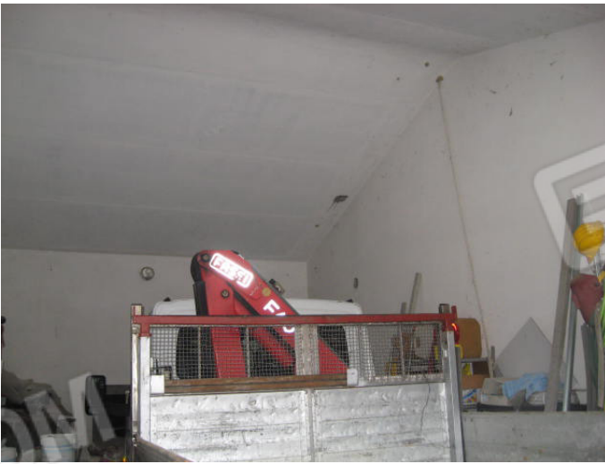
Deposito fra i vani garage/attrezzaie