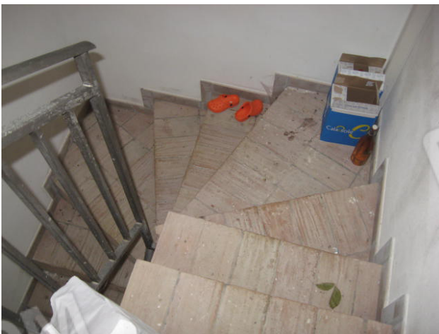
Scala accesso cantina e particolare cantina