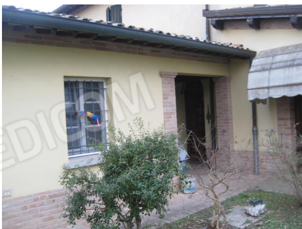
Scorcio sud ovest e particolare portico/loggia esclusiva