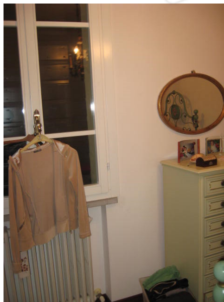
Disimpegno zona notte (piano primo) e camera da letto