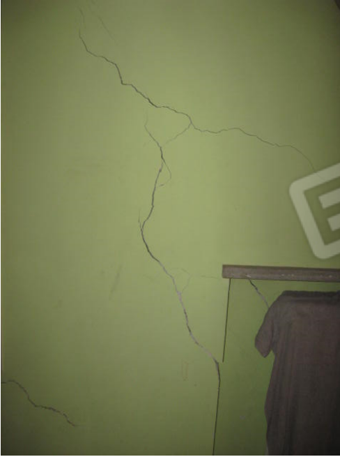
Crepe interne sulle murature