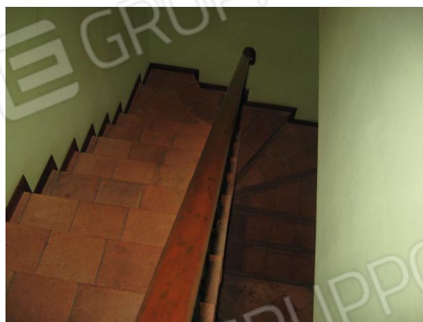
Arco a tutto sesto nel vano soggiorno-pranzo e scala dal piano primo