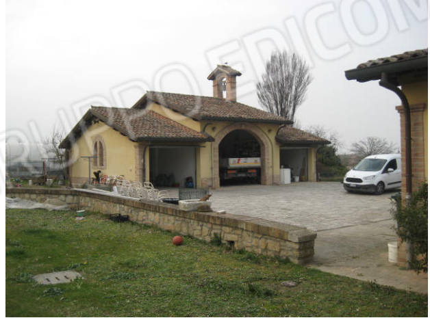
Fabbricato destinato ad autorimesse/attrezzaie e deposito (nord) e scorcio sud est