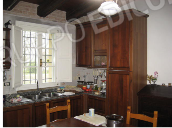
Soggiorno zona camini e cucina nel vano destinato ad attrezzaia