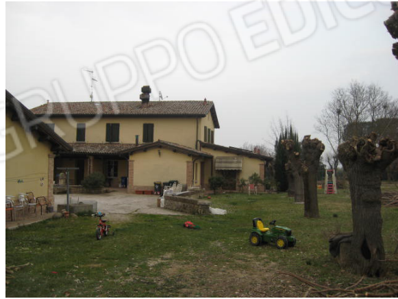
Fronte stradale (est) e porzione prospetto posteriore (ovest)