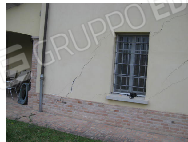
Particolare vista crepe esterne sul fabbricato principale