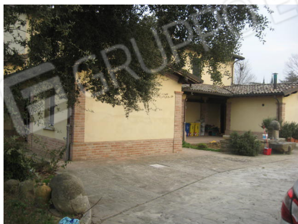
Vista dall'accesso stradale e particolare prospetto posteriore