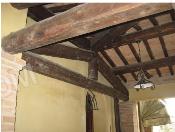
Particolare portico comune del fronte posteriore (ovest)