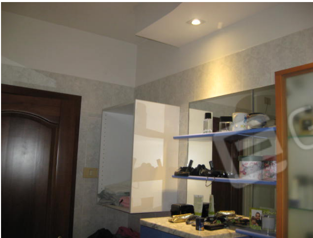
Bagno e camera da letto (piano primo)