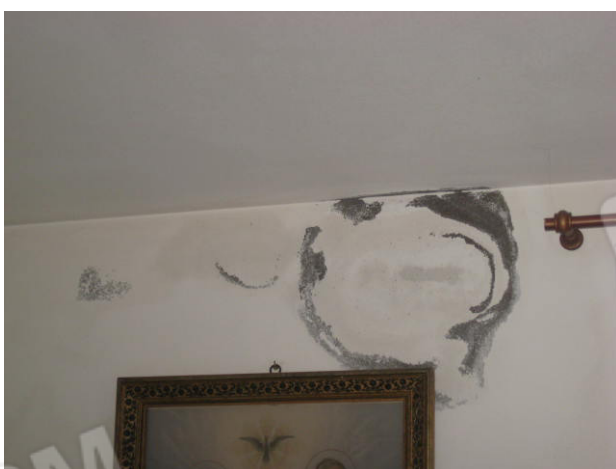
Particolare zona interessate da efflorescenze intonaci - tinteggiature