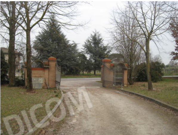
Accesso da via Monda