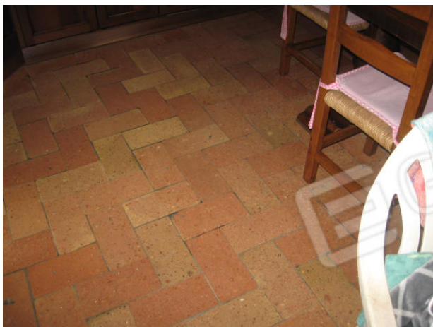
Pavimento cucina e camera