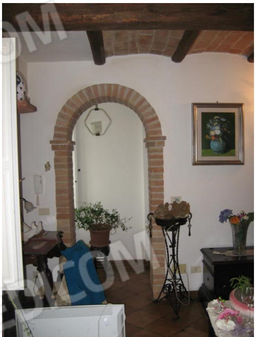
Soggiorno pranzo e scala accesso piano primo