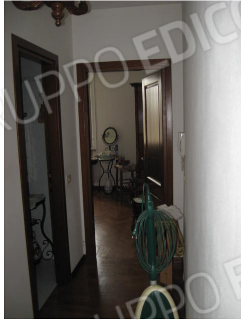
Camera da letto e disimpegno con ingresso camere e bagno