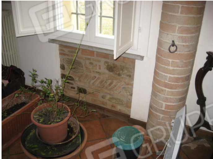
Cucina (attrezzaia) e particolare soggiorno