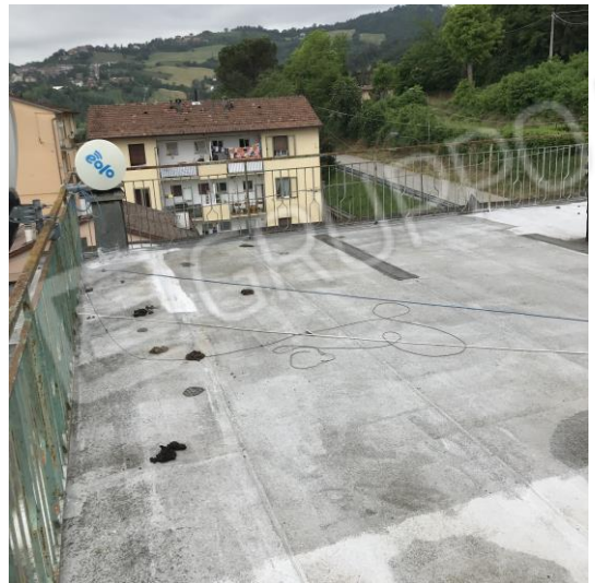
Canali P.A. Fabrizia