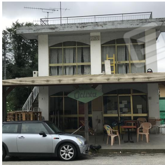
Canali P.A. Fabrizia